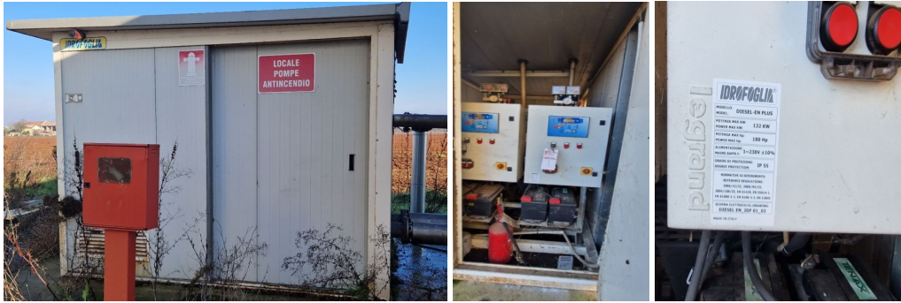
gruppo antincendio "Idrofoglia"