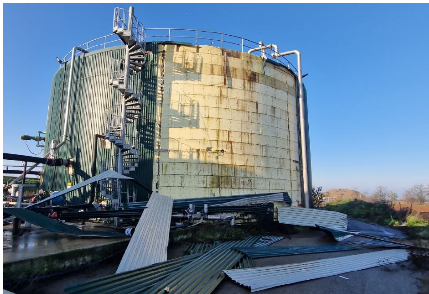
serbatoio 1 in c.a. D 20 m c.a. - digestore