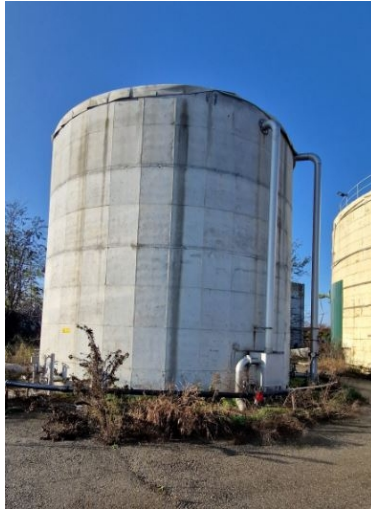
serbatoio in c.a. per biogas D 6m