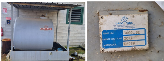
serbatoio gasolio "Dado tank"