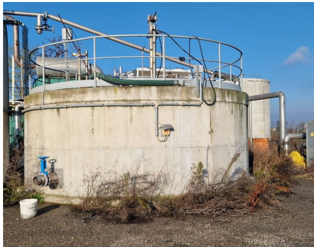
vasca in c.a. circolare D 4m c.a. - stoccaggio liquami