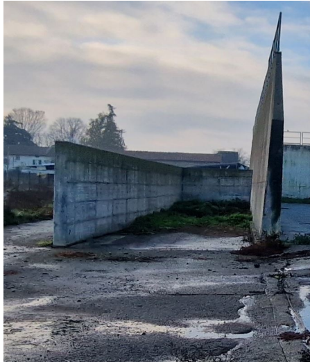
ulteriore trincea silos aperta (larghezza ridotta)