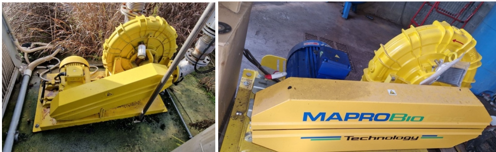
n. 2 gruppi soffianti "Mapro"