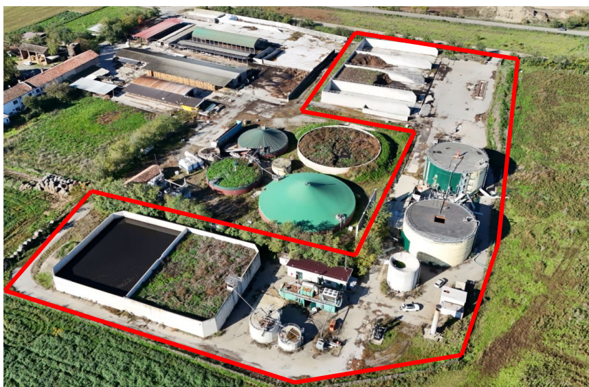
sedime di interesse impianto