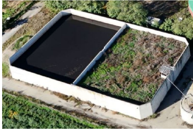
vasca in c.a. 50m x 30m c.a. raccolta digestato