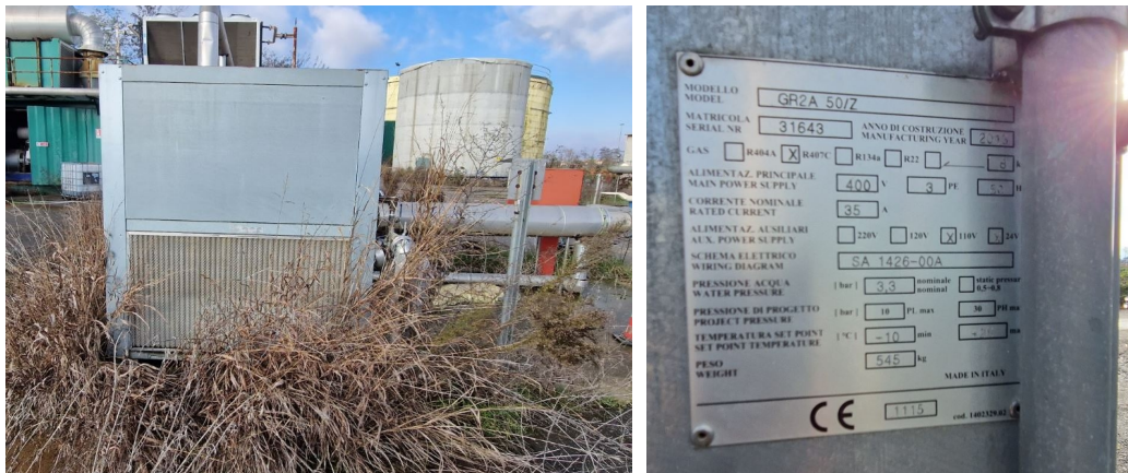
gruppo chiller GR2A