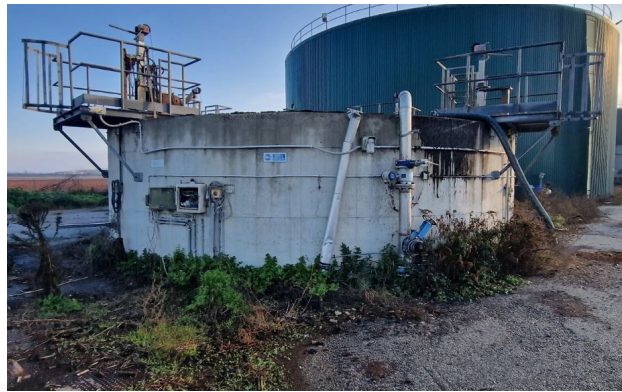
vasca in c.a. circolare D8 m c.a. - carico liquami