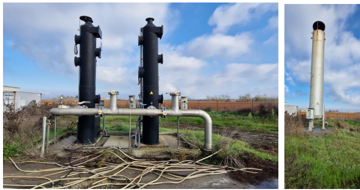
n.2 torri di desolfurazione - colonna torcia di impianto