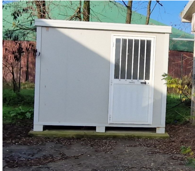
container con servizio igienico