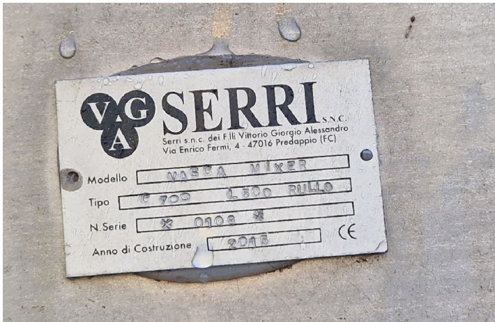
tramoggia di carico "Serri"