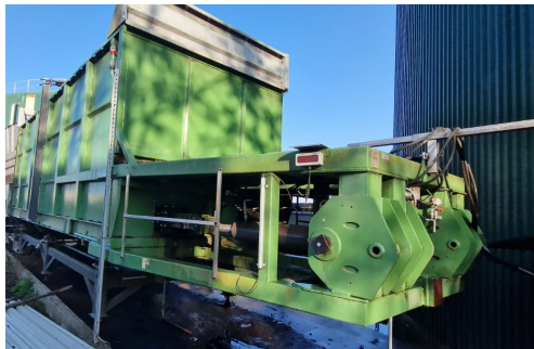
tramoggia di carico e sistemi coclea "Franzosi" ( macchinario soggetto a leasing contratto SI93350 del 25/02/2022)