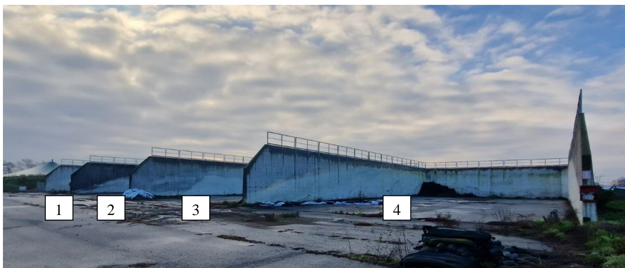
silos orizzontali aperti n. 1 (larghezza ridotta) - n.2-3-4