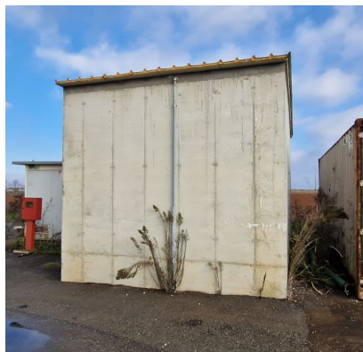
serbatoio in c.a. per acqua impianto antincendio