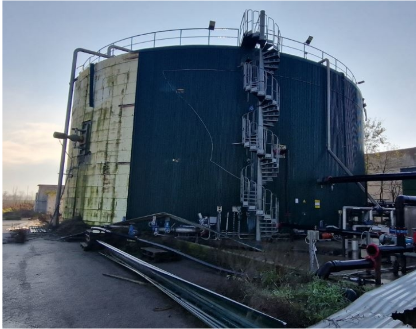
serbatoio 2 in c.a. D 20 m c.a. - digestore