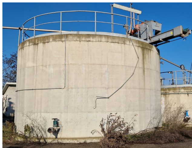
vasca in c.a. circolare D 8m c.a. separazione digestato