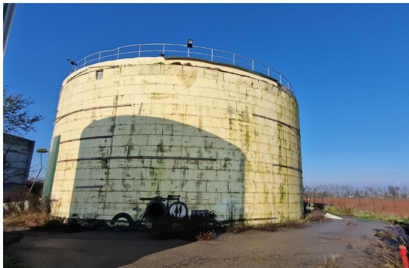
particolare serbatoio 2 in c.a. D 20 m c.a. digestore