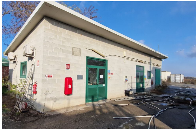
struttura con ufficio - centrale termica-magazzino