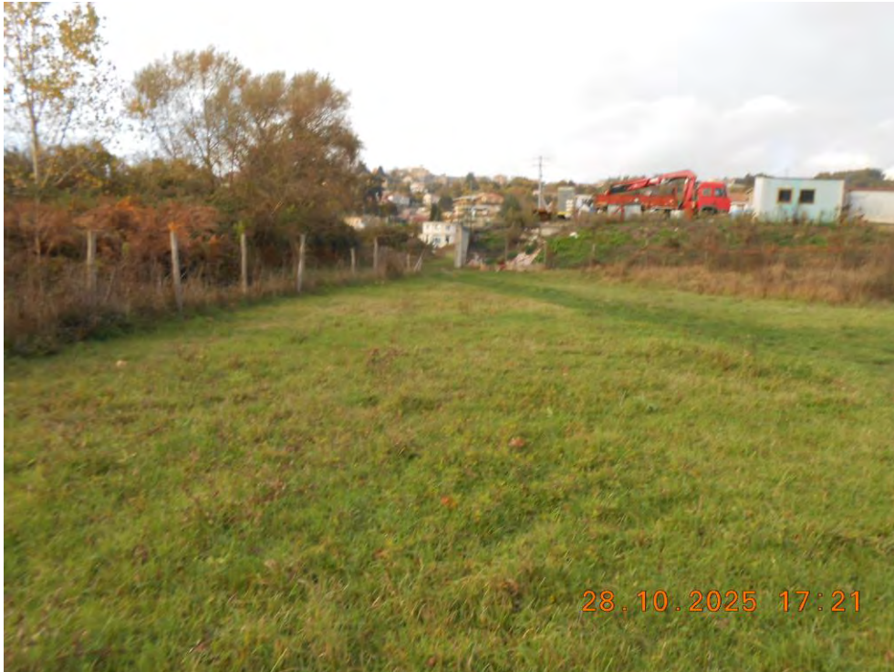
Foto n. 7 Corte Esterna nord-est