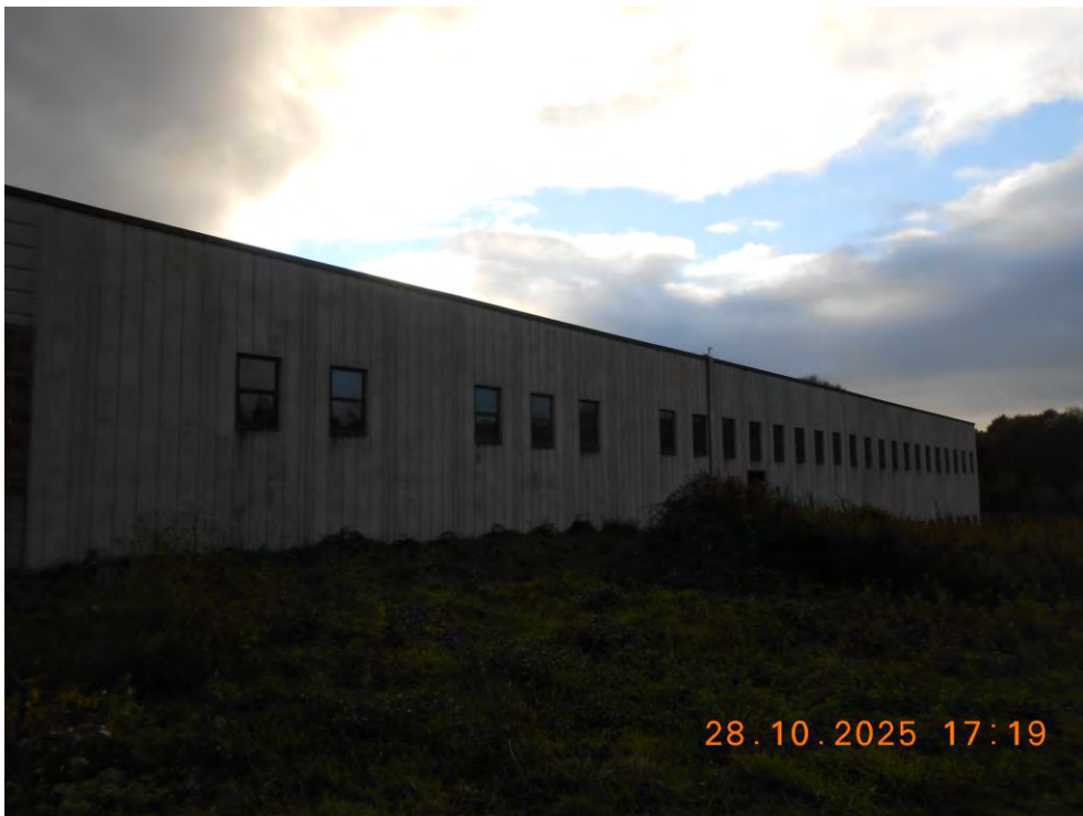
Foto n. 2 Prospetto nord-est