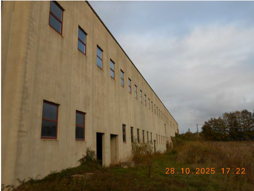
Foto n. 9 Corte Esterna sud-ovest