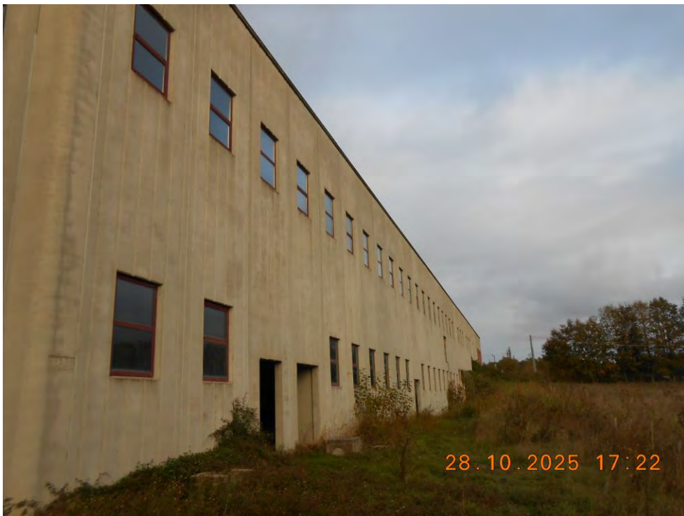
Foto n. 6 Prospetto sud-ovest