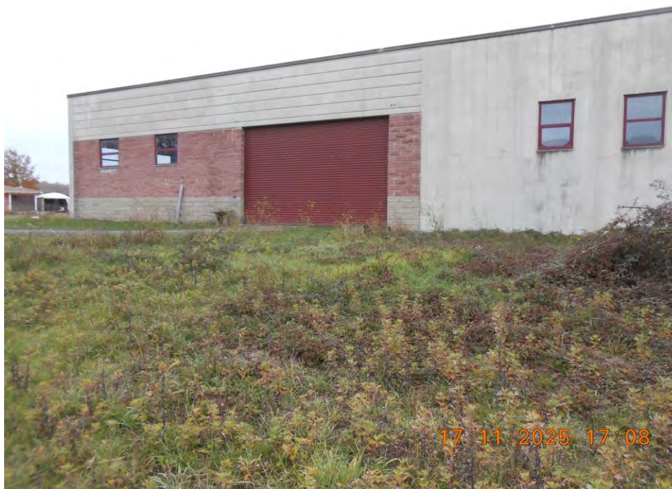
Foto n. 4 Prospetto sud-est