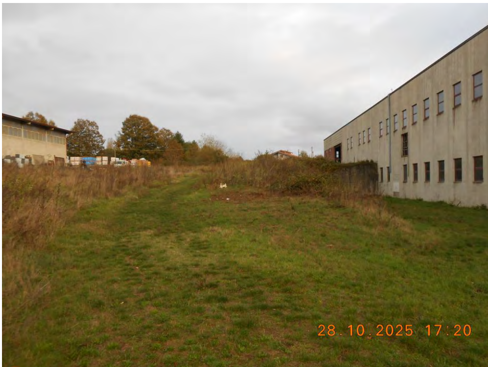
Foto n. 8 Corte Esterna nord-est