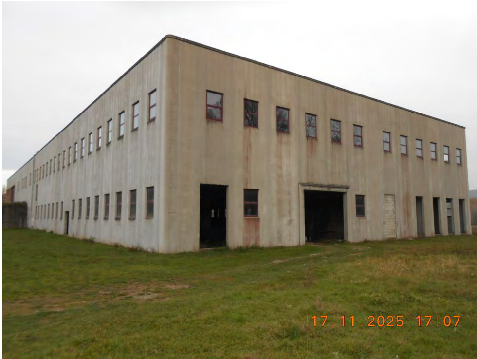
Foto n. 5 Prospetto nord-ovest