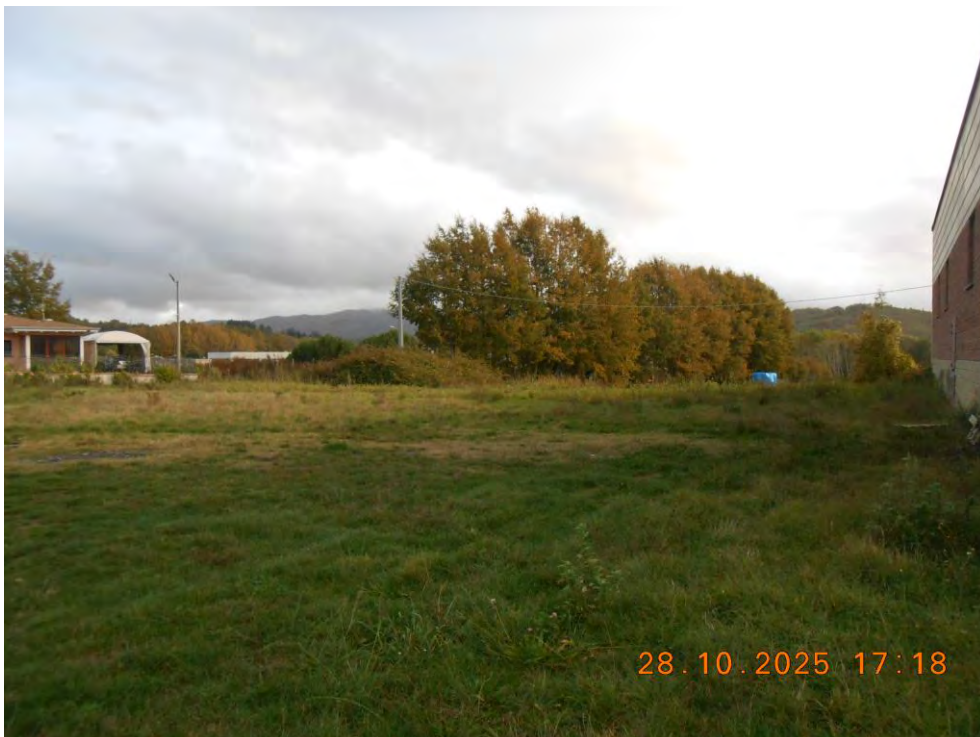
Foto n. 10 Corte Esterna sud-est