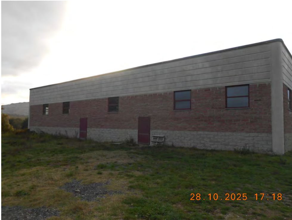
Foto n. 1 Prospetto sud-est