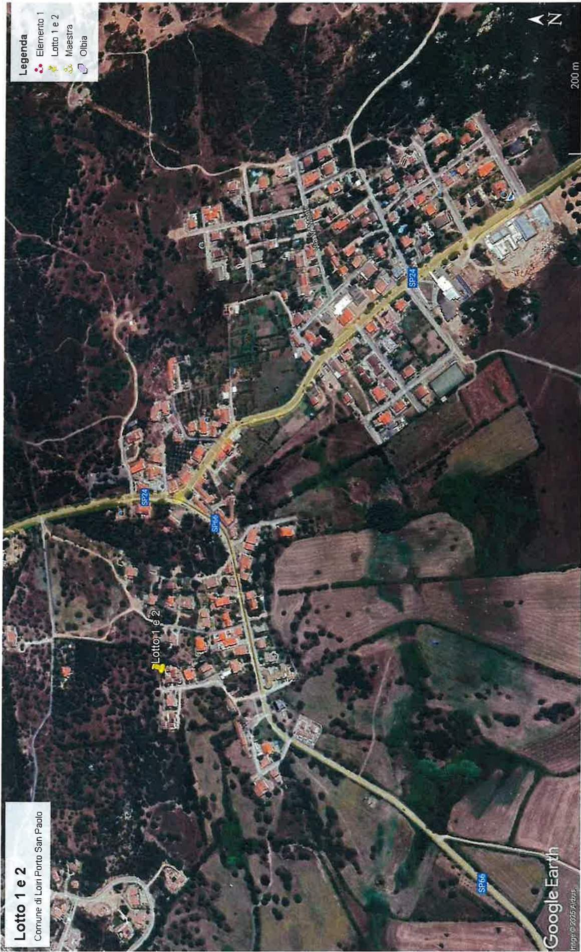
Vista satellitare di Loiri Porto San Paolo