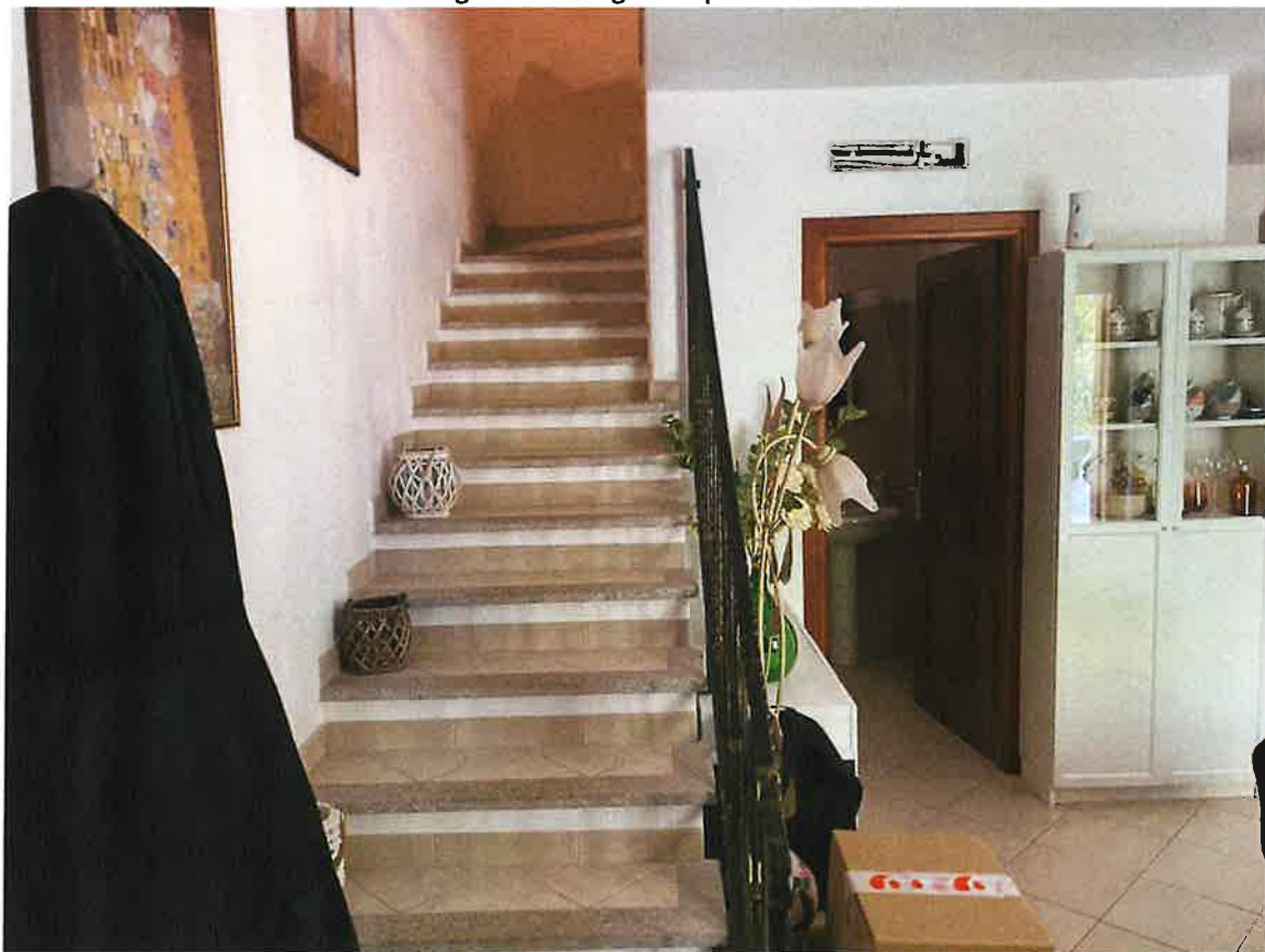
Scala di accesso piano primo