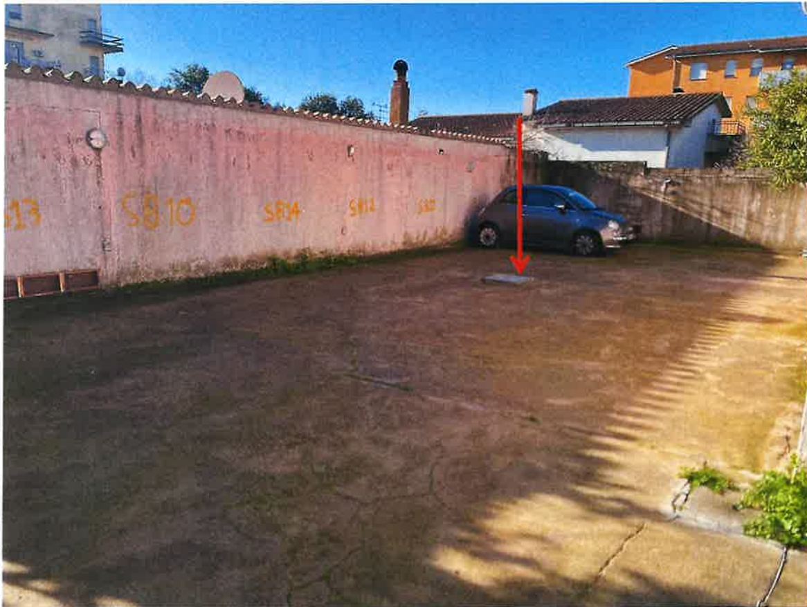
Area parcheggi – cisterna idrica condominiale