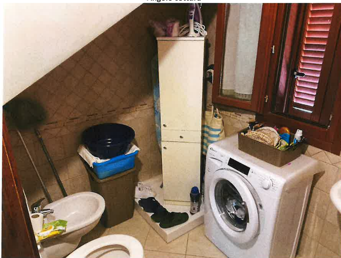
Bagno piano terra