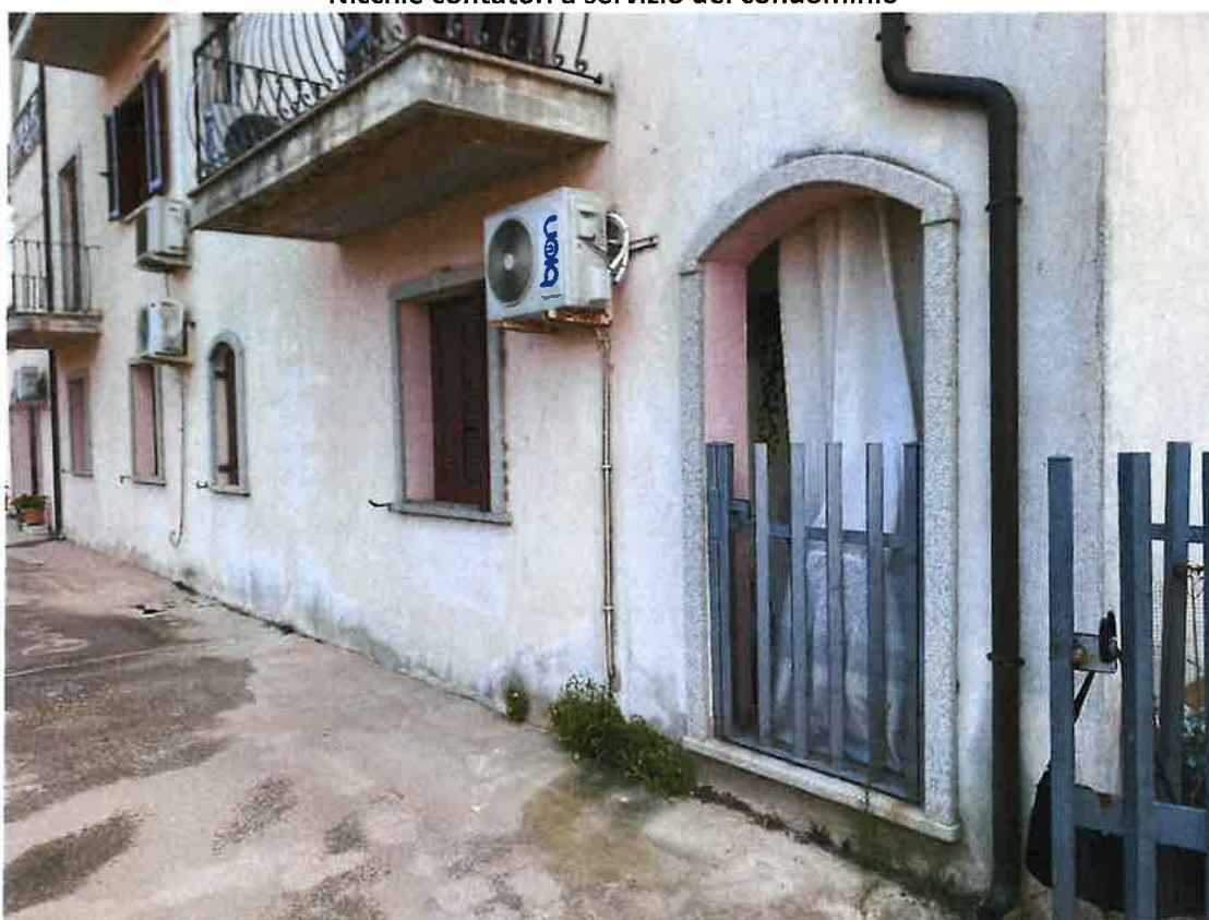
Accesso ad unità residenziale piano terra del condominio