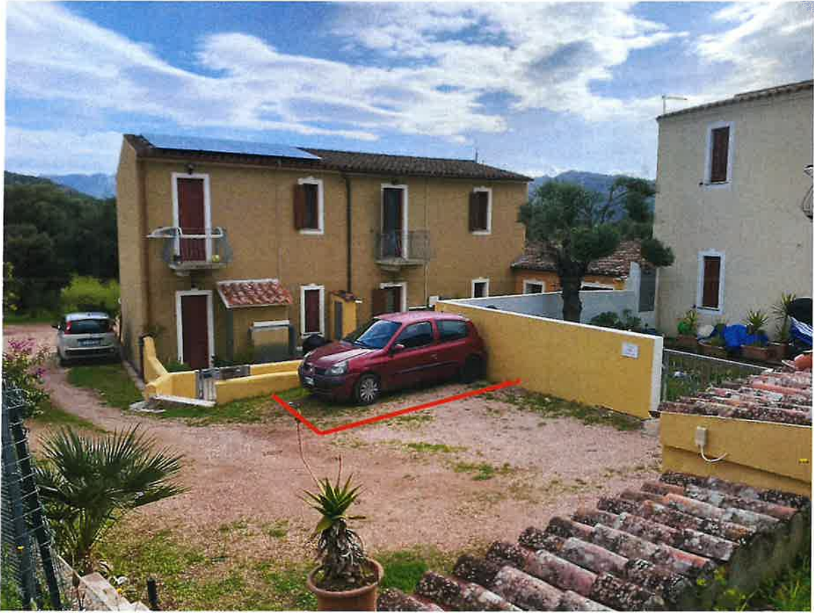
Vista area parcheggio scoperta