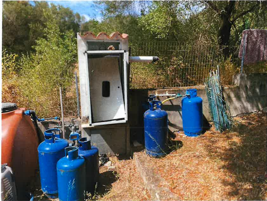
Caldaia a gas