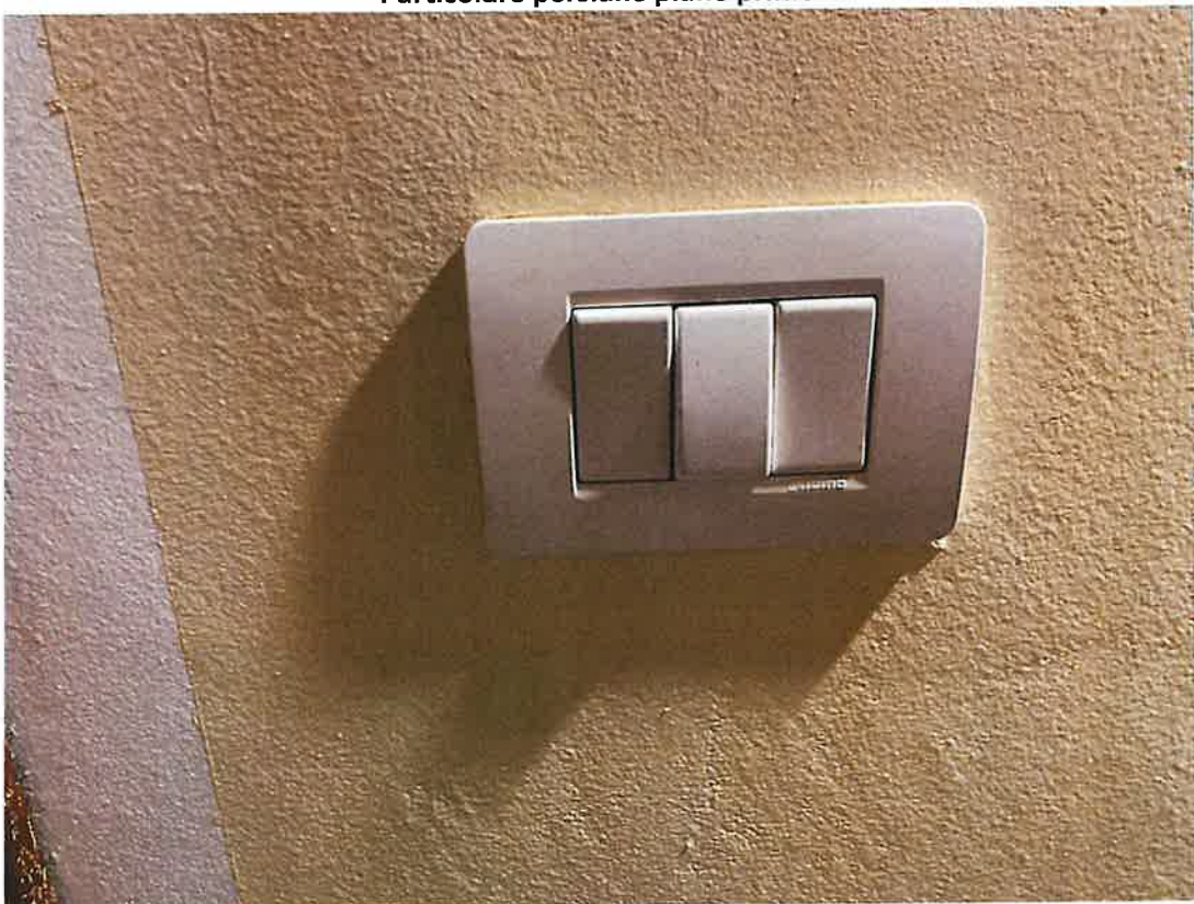
Impianto elettrico Bticino