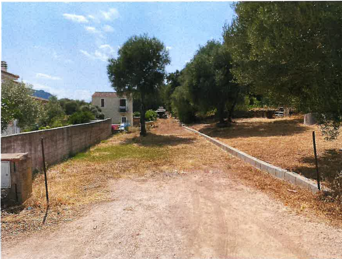
Accesso da strada pubblica