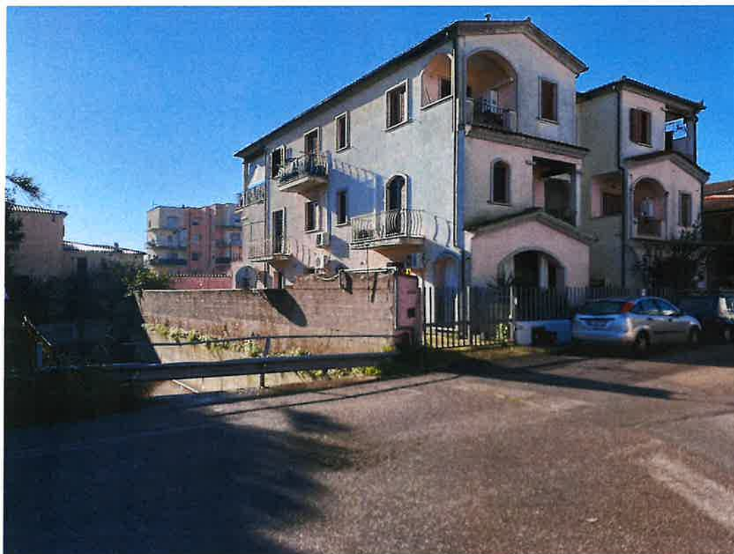
Vista accesso carrabile su viaV. Bellini