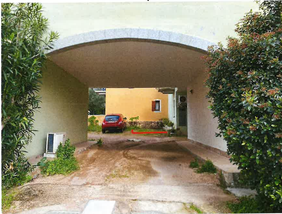
Vista accesso da strada pubblica