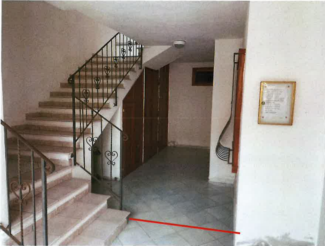
Vista area di pertinenza corpo scale con realizzazione di armadi a muro