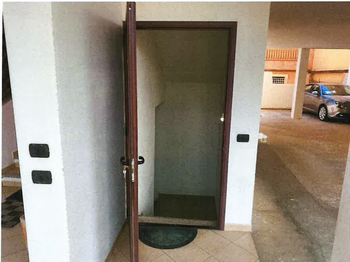
Accesso piano interrato