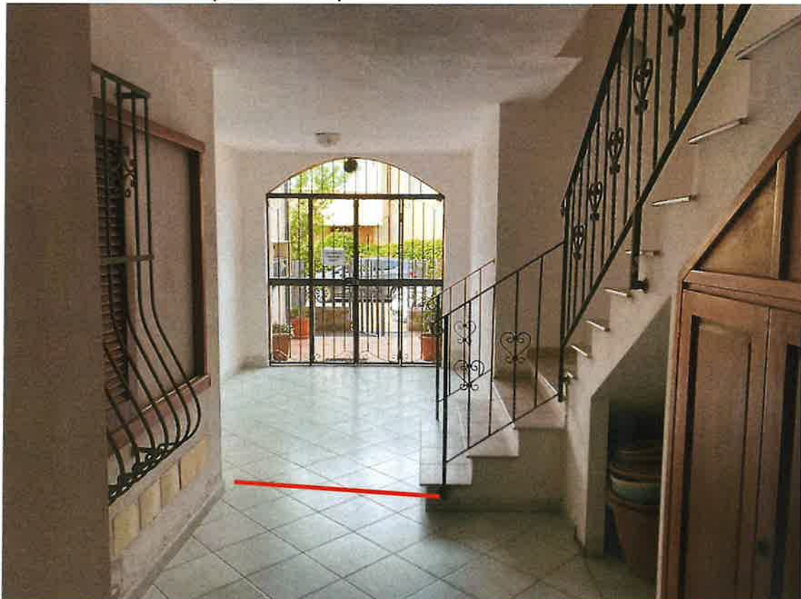
Vista area di pertinenza corpo scale con realizzazione di armadi a muro