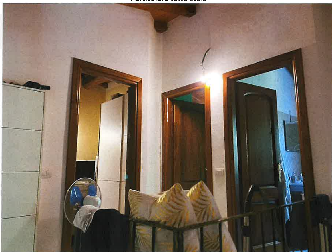
Disimpegno piano primo