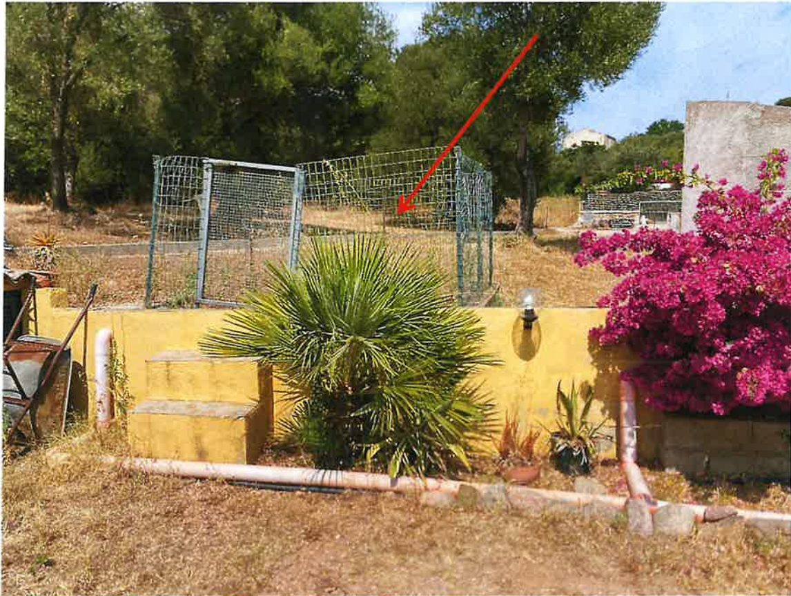
Servitù bombolone gas a servizio di altri corpi di fabbrica