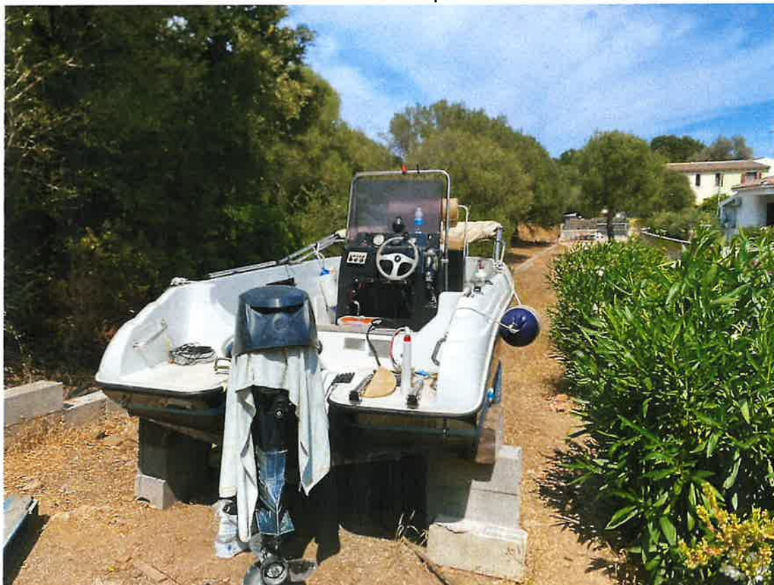
Vista da interno lotto