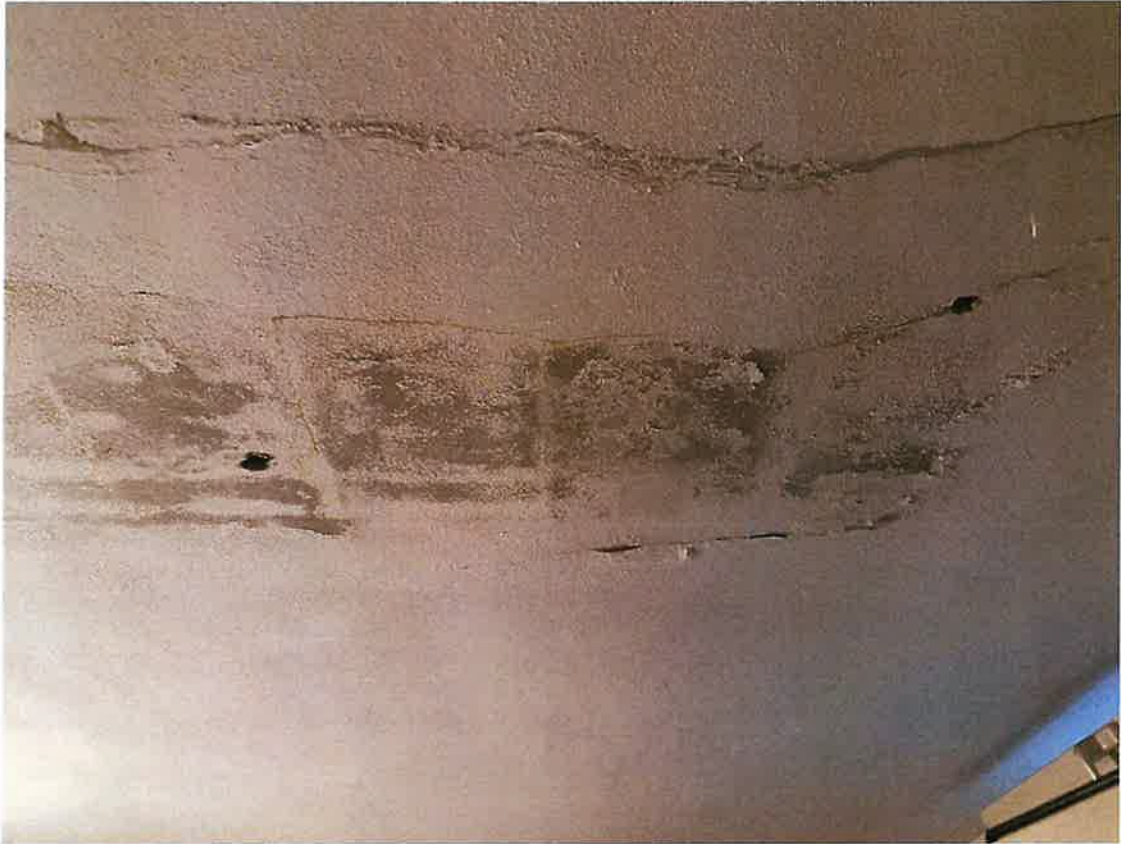
Segni di infiltrazioni nel soffitto