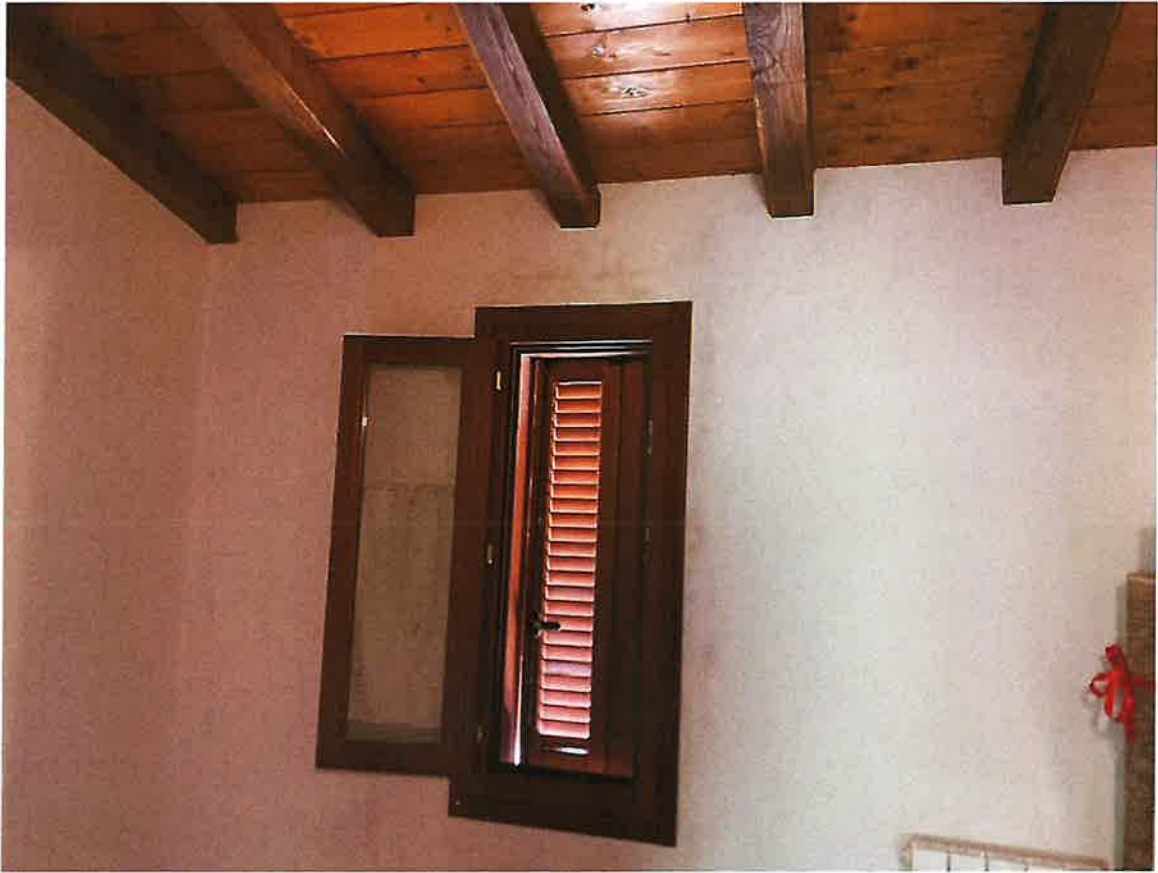
Particolare scala con evidenti segni di muffa