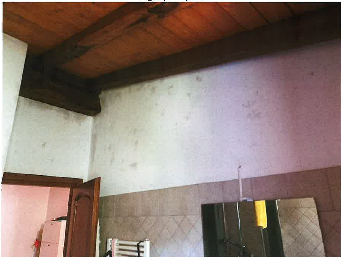
Bagno piano primo con evidenti segni di muffa