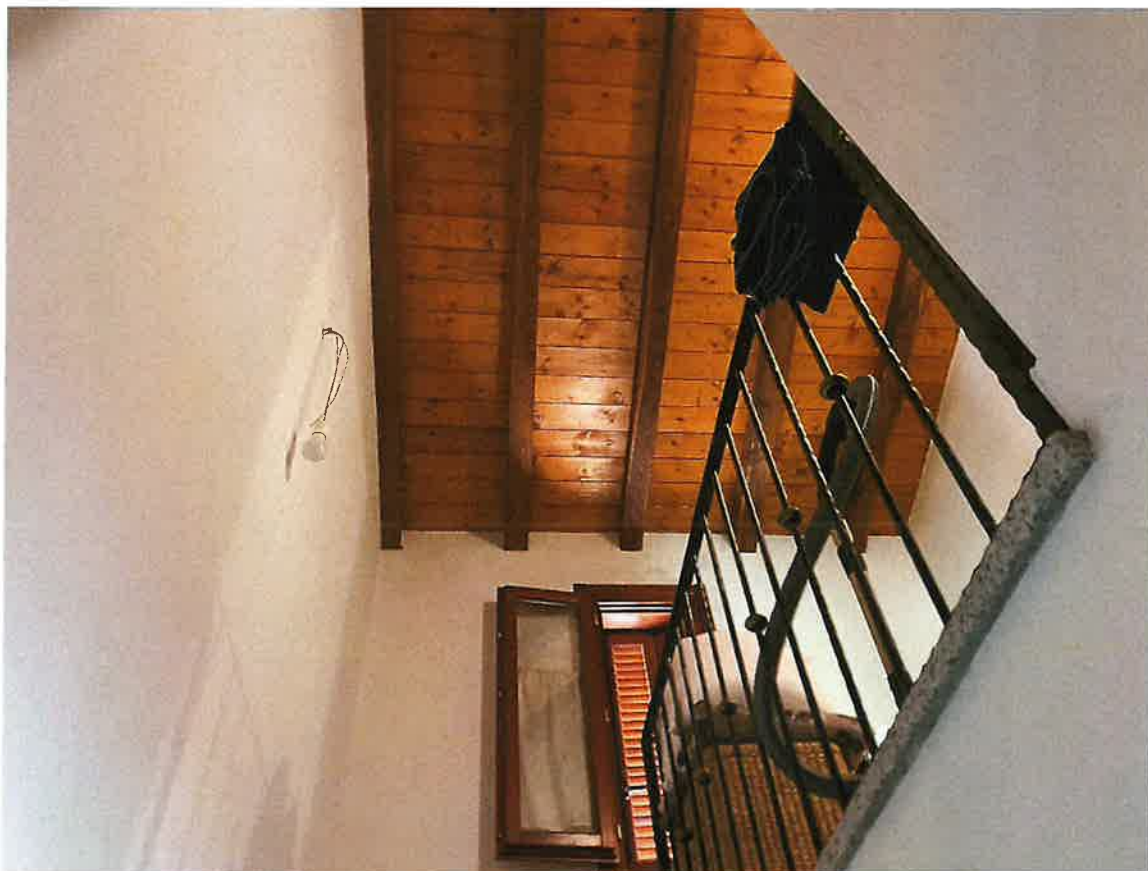
Particolare tetto scala