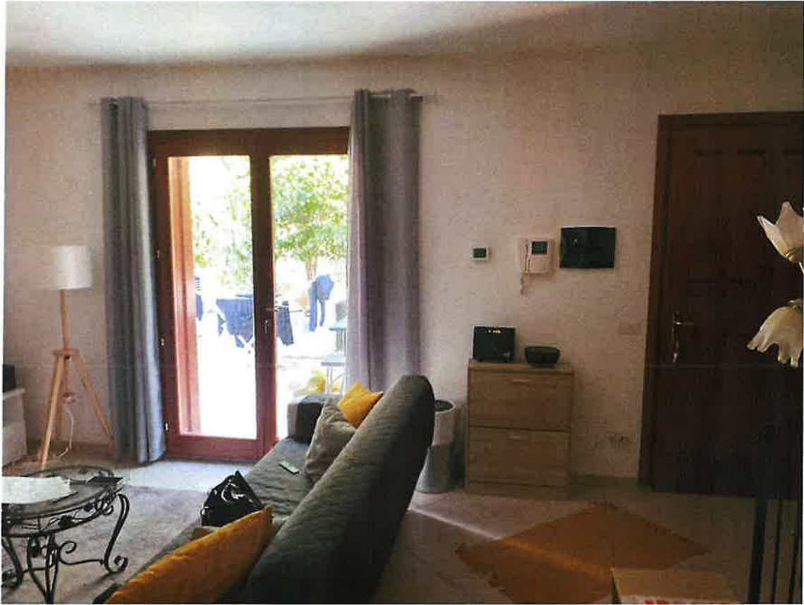
Ingresso zona giorno piano terra