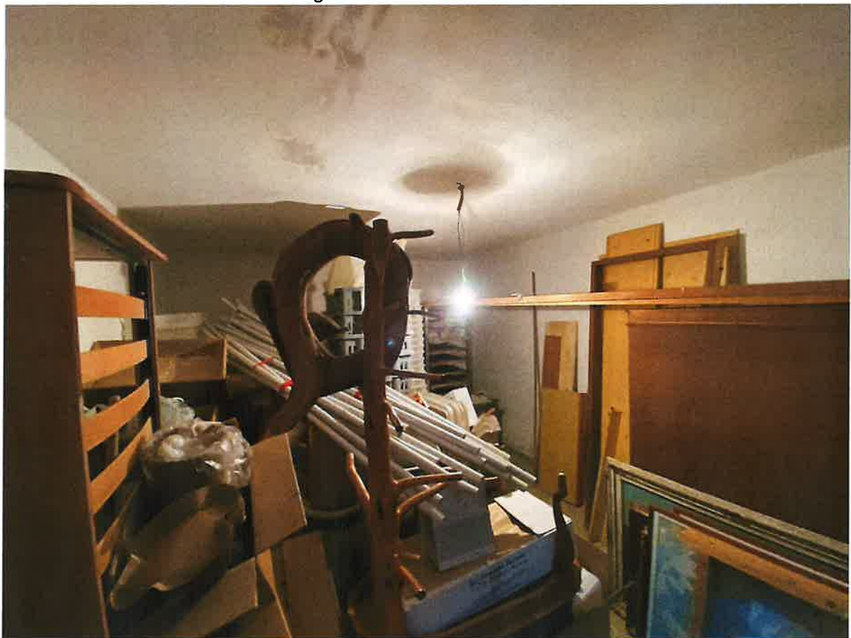
Segni di infiltrazioni nel soffitto