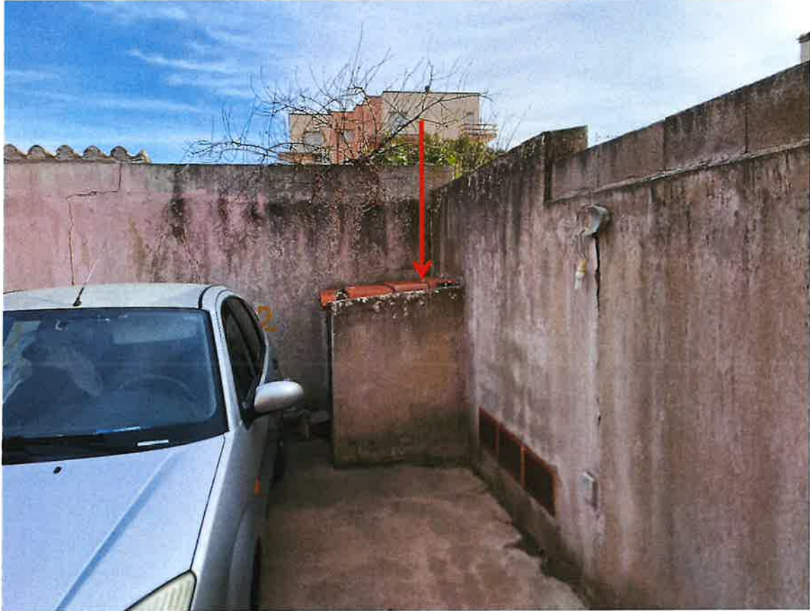
Nicchia autoclave condominiale