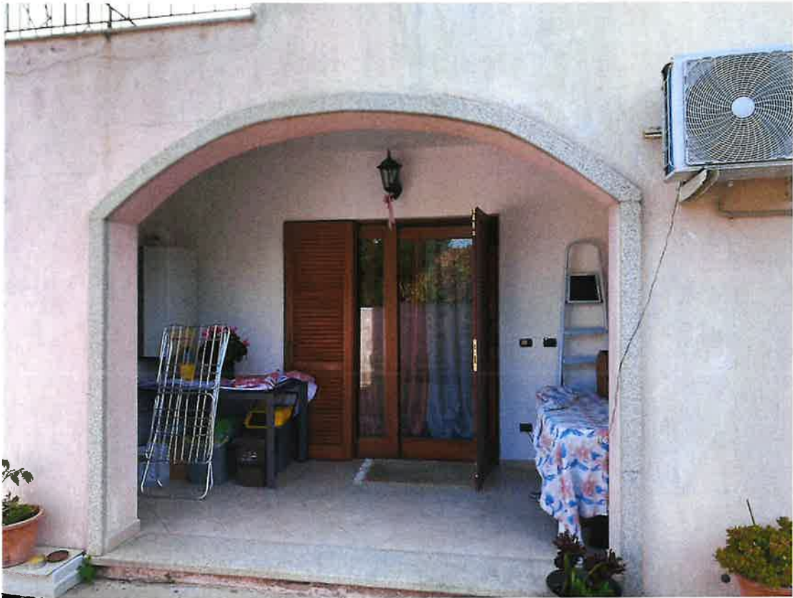
Accesso ad unità residenziale piano terra del condominio