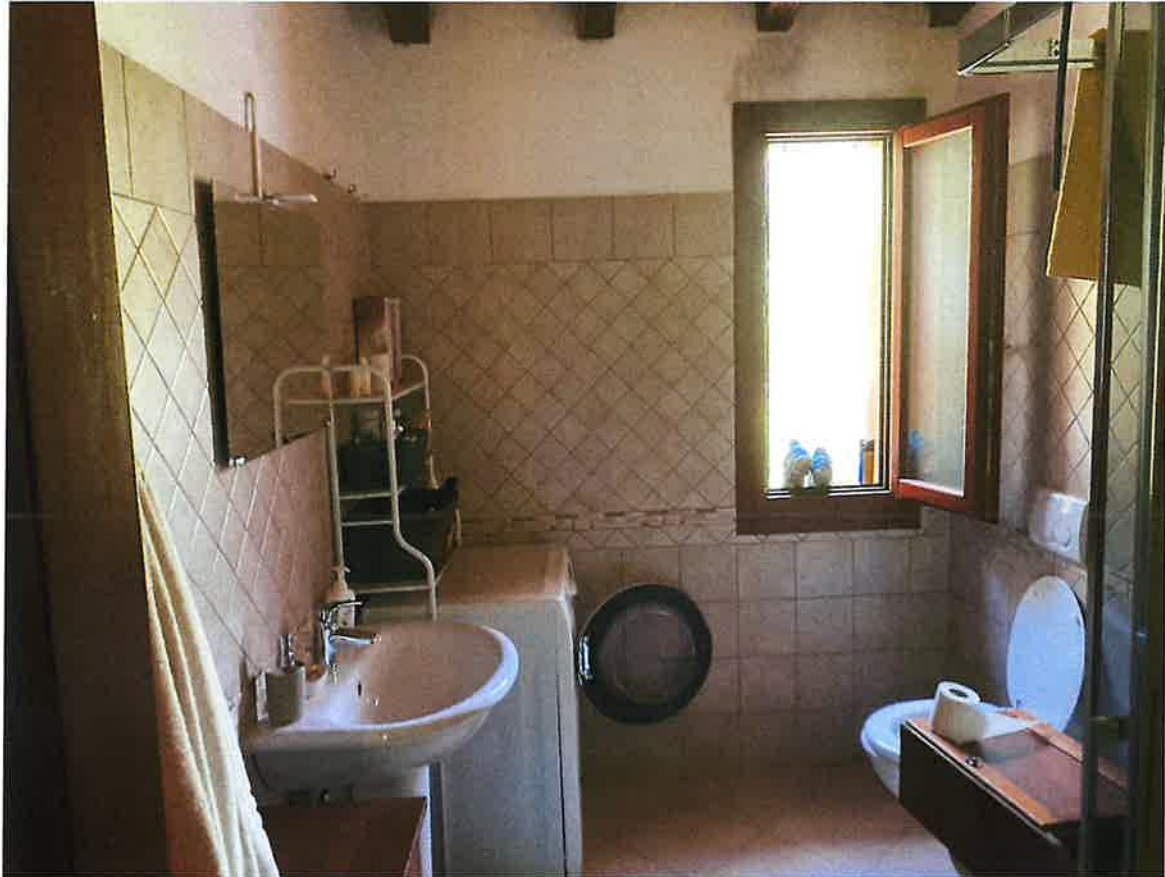
Bagno piano primo