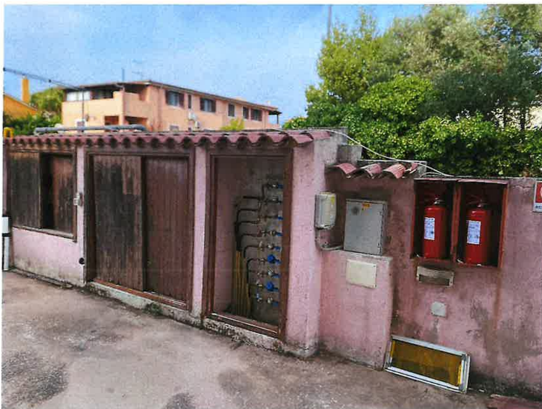
Nicchie contatori a servizio del condominio