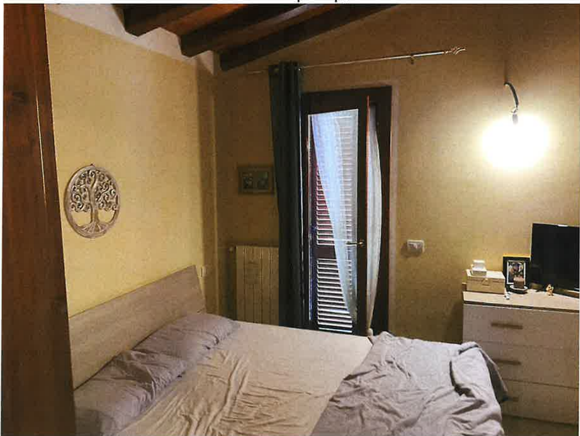
Camera letto piano primo