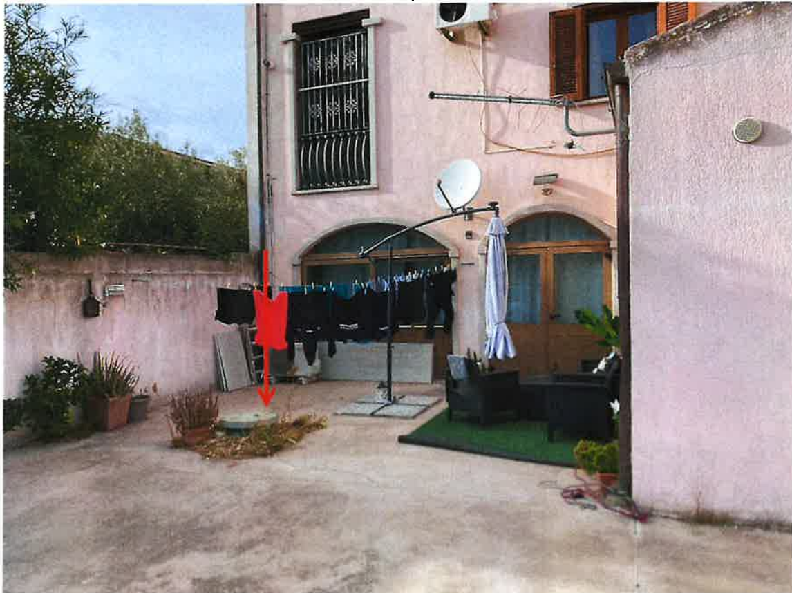
Accesso ad unità residenziale piano terra del condominio- cisterna gas