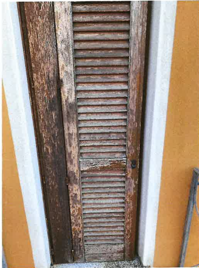
Particolare persiane piano primo