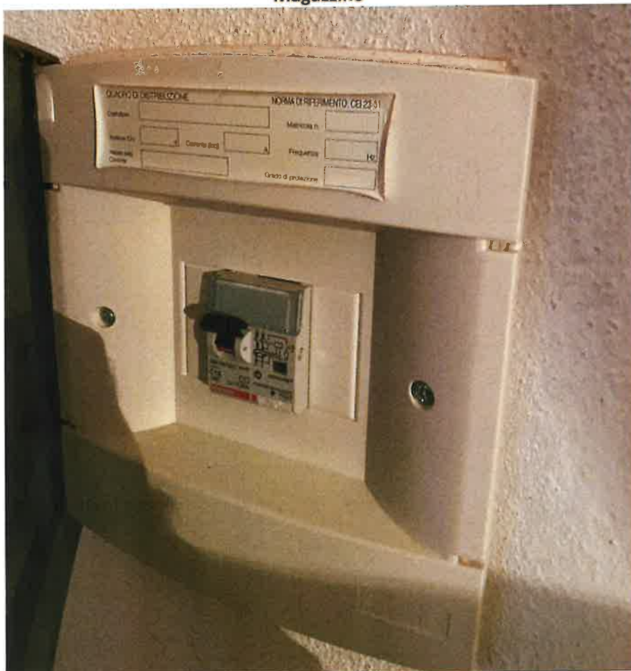
Q.E. allaccio enel al condominio abusivo