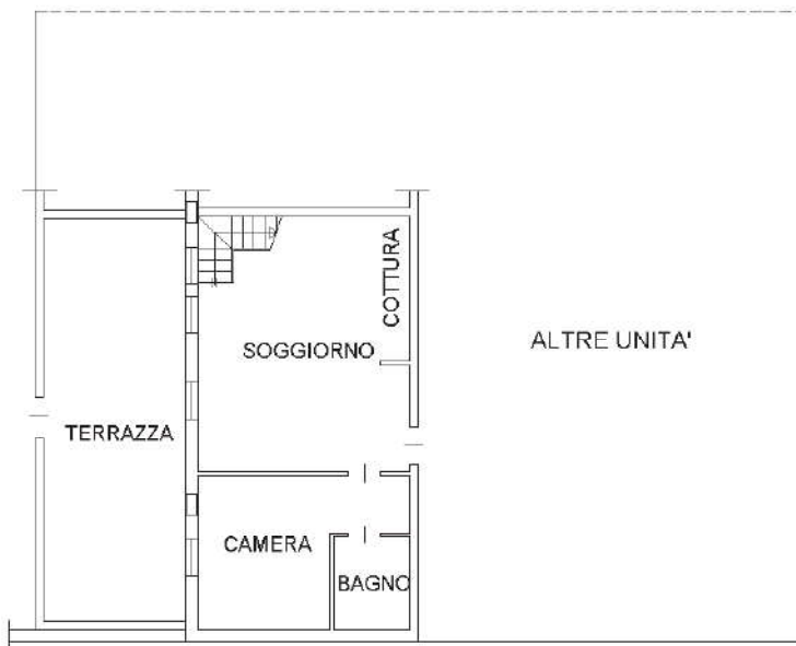
PIANO PRIMO H=3.00