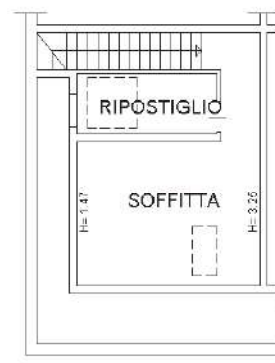
PIANO SECONDO Hm=2.36