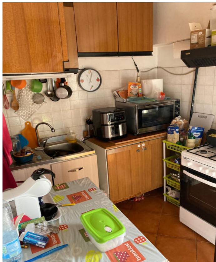
FOTO N. 6 - Cucina