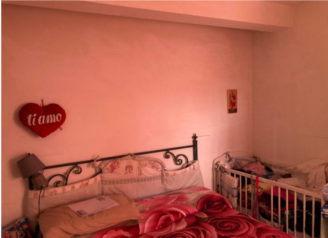
FOTO N. 9 - Camera