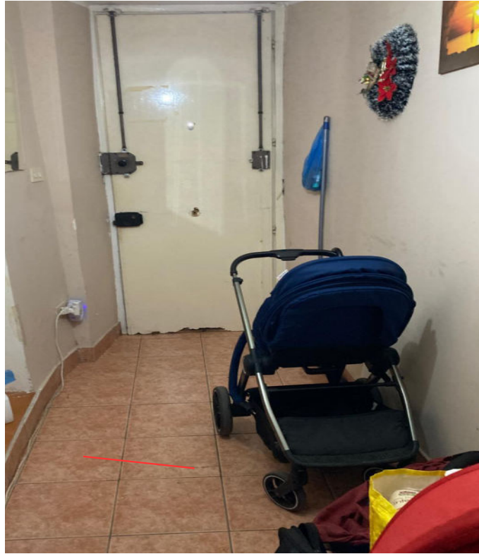
FOTO N. 3 - Ingresso