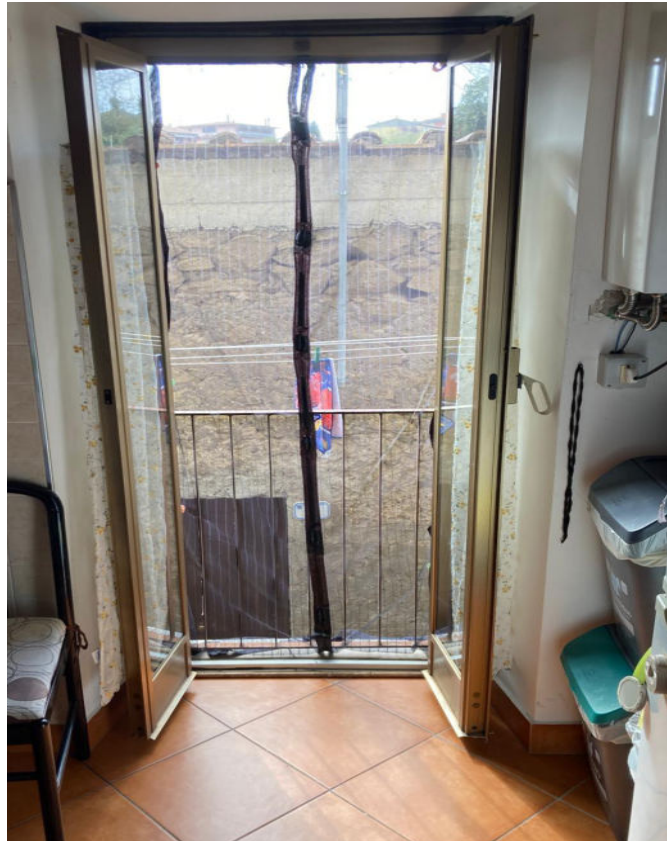
FOTO N. 7 - Cucina