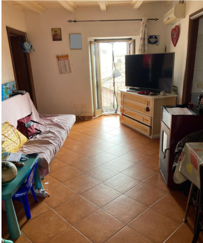
FOTO N. 5 - Soggiorno