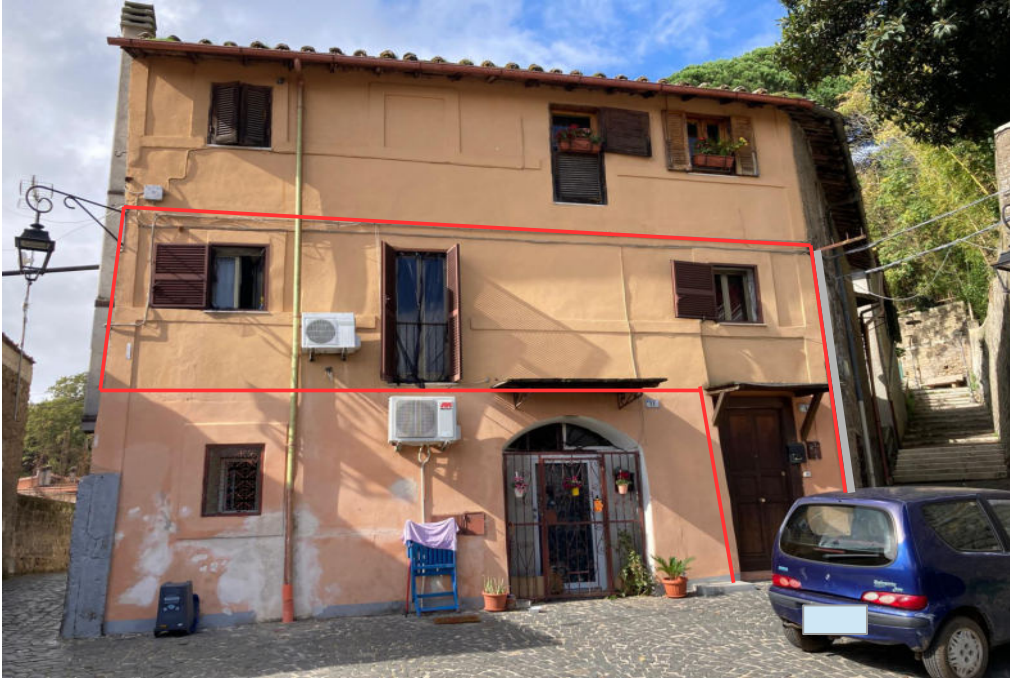
FOTO N. 1 - Facciata Principale