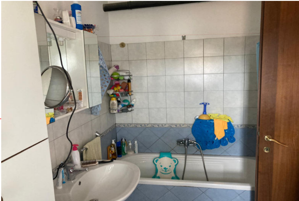
FOTO N. 11 - bagno