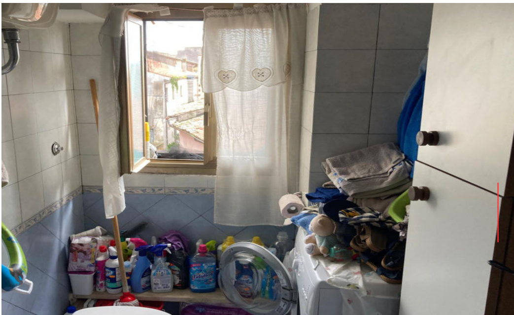
FOTO N. 12 - bagno