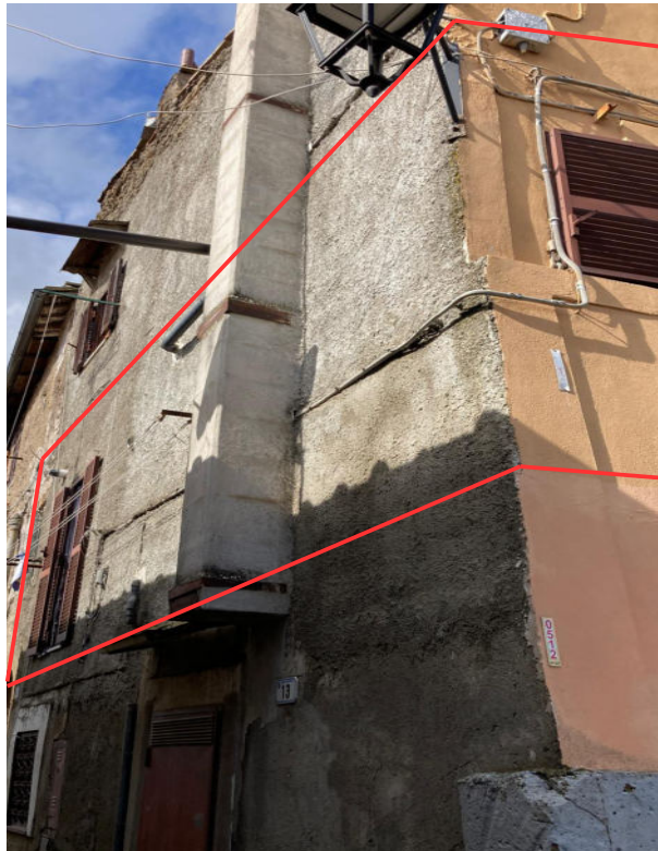
FOTO N. 2 - Facciata Laterale