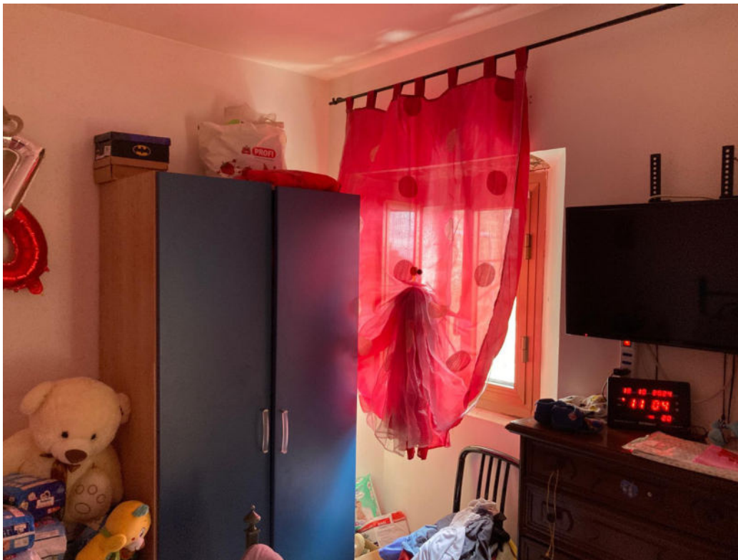
FOTO N. 8 - Camera