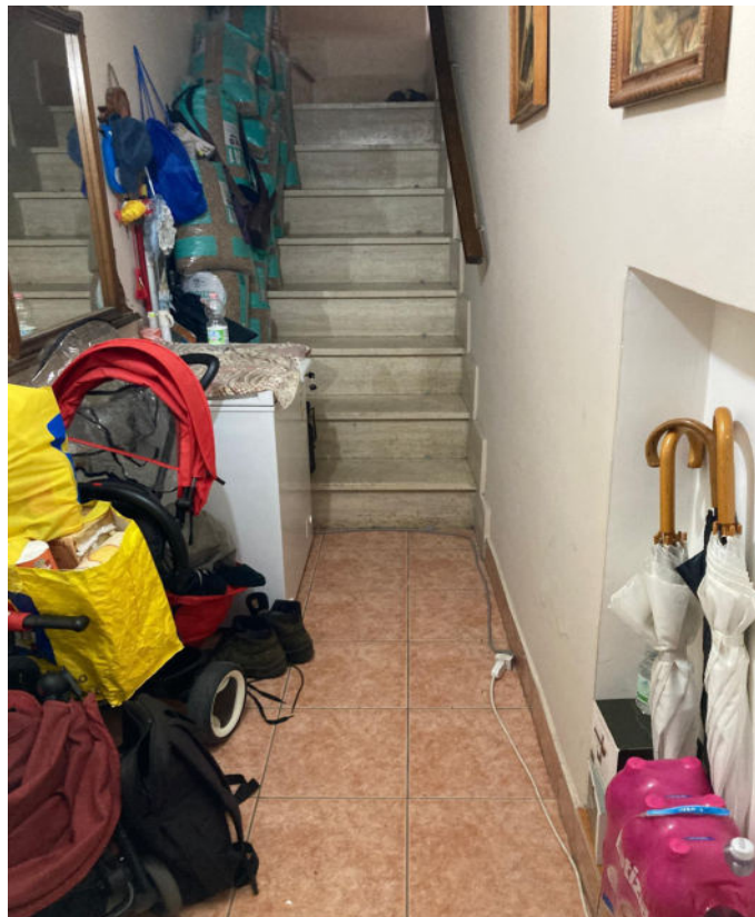
FOTO N. 4 - Ingresso