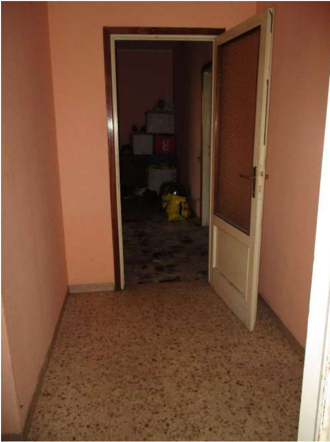
Fig. 29 – Vista del disimpegno della zona notte