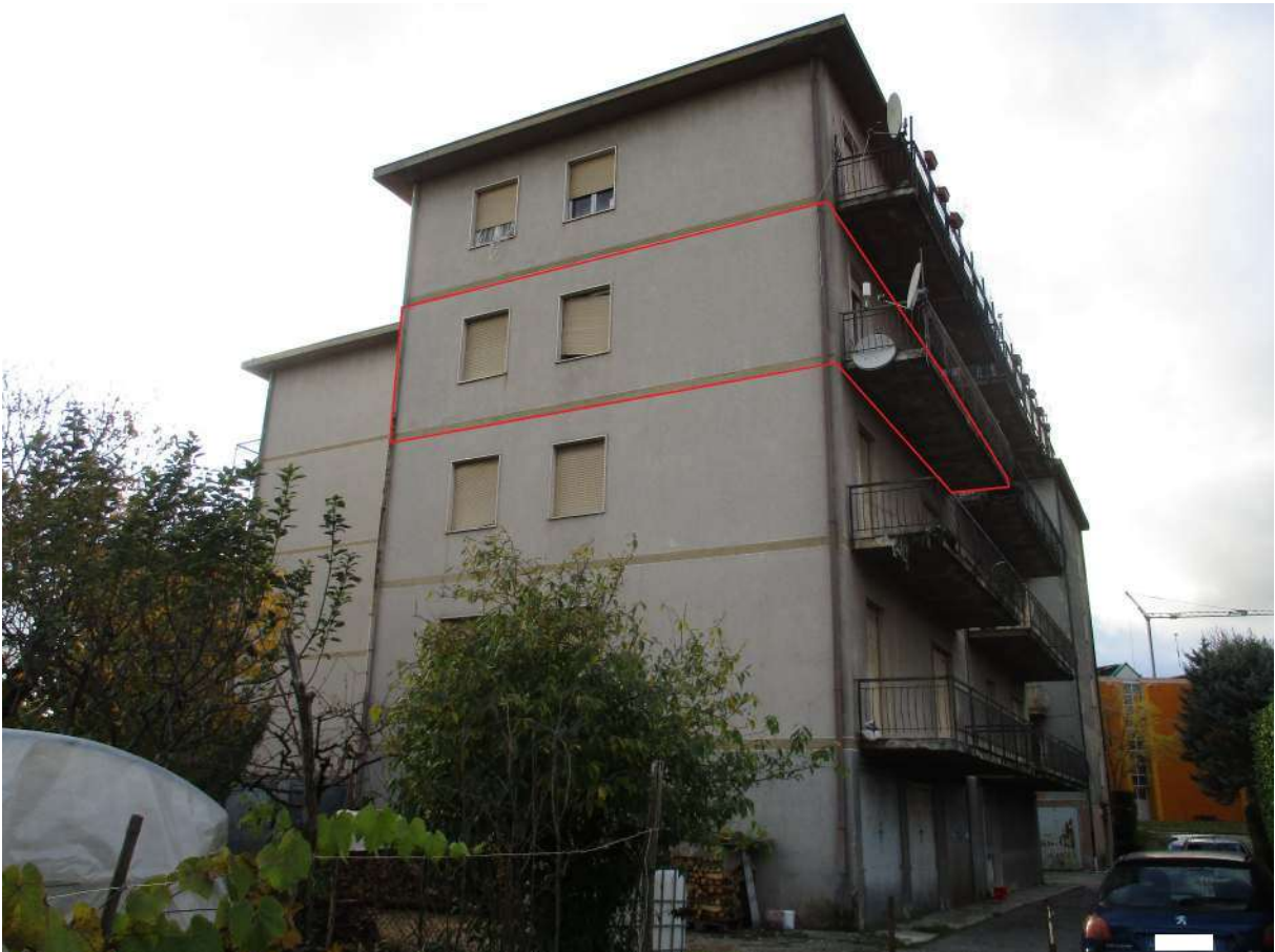
Fig. 6 – Vista d'insieme del condominio (prospetto est) con l'alloggio al P. 3° riquadrato in rosso