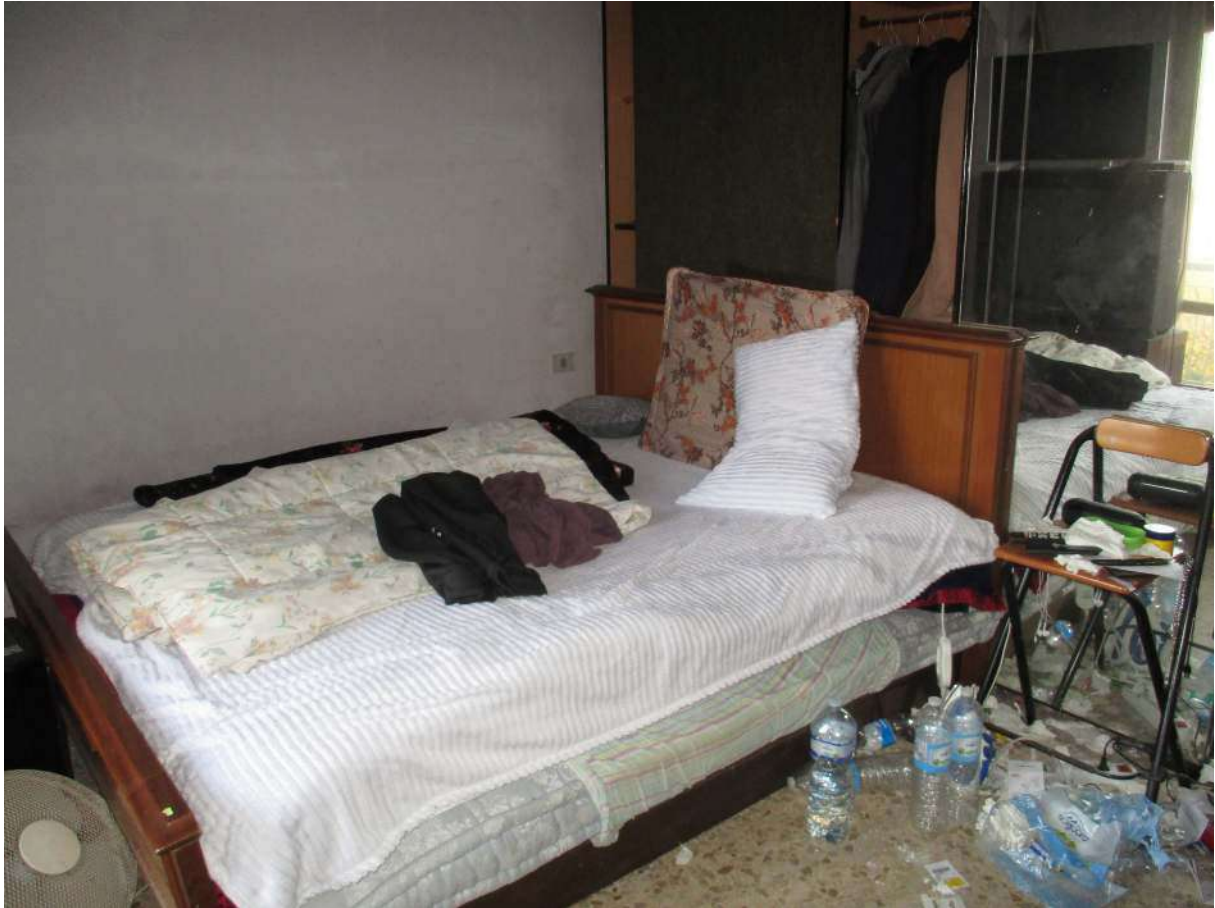
Fig. 35 – Vista della seconda camera con accesso al balcone (lato nord)