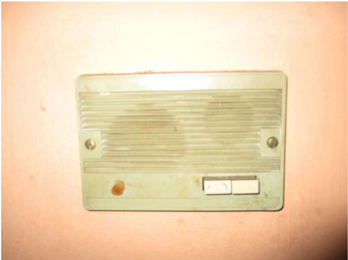
Fig. 44 – Vista del citofono installato nel corridoio d'ingresso