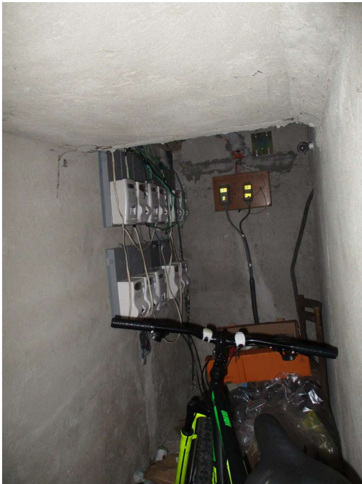
Fig. 14 – Vista dei contatori Enel installati nel locale tecnico al P.T.