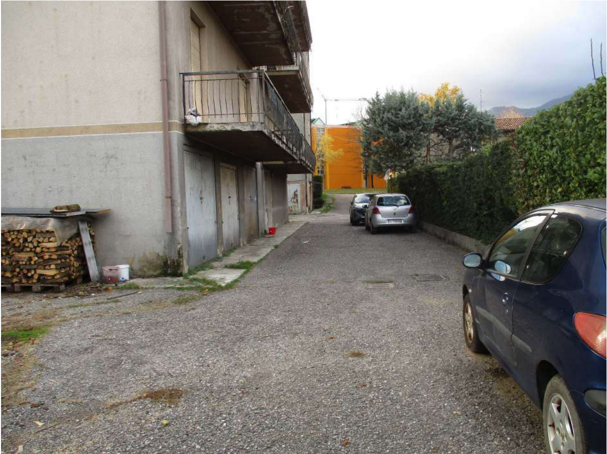
Fig. 5 – Vista del cortile condominiale (lato nord)