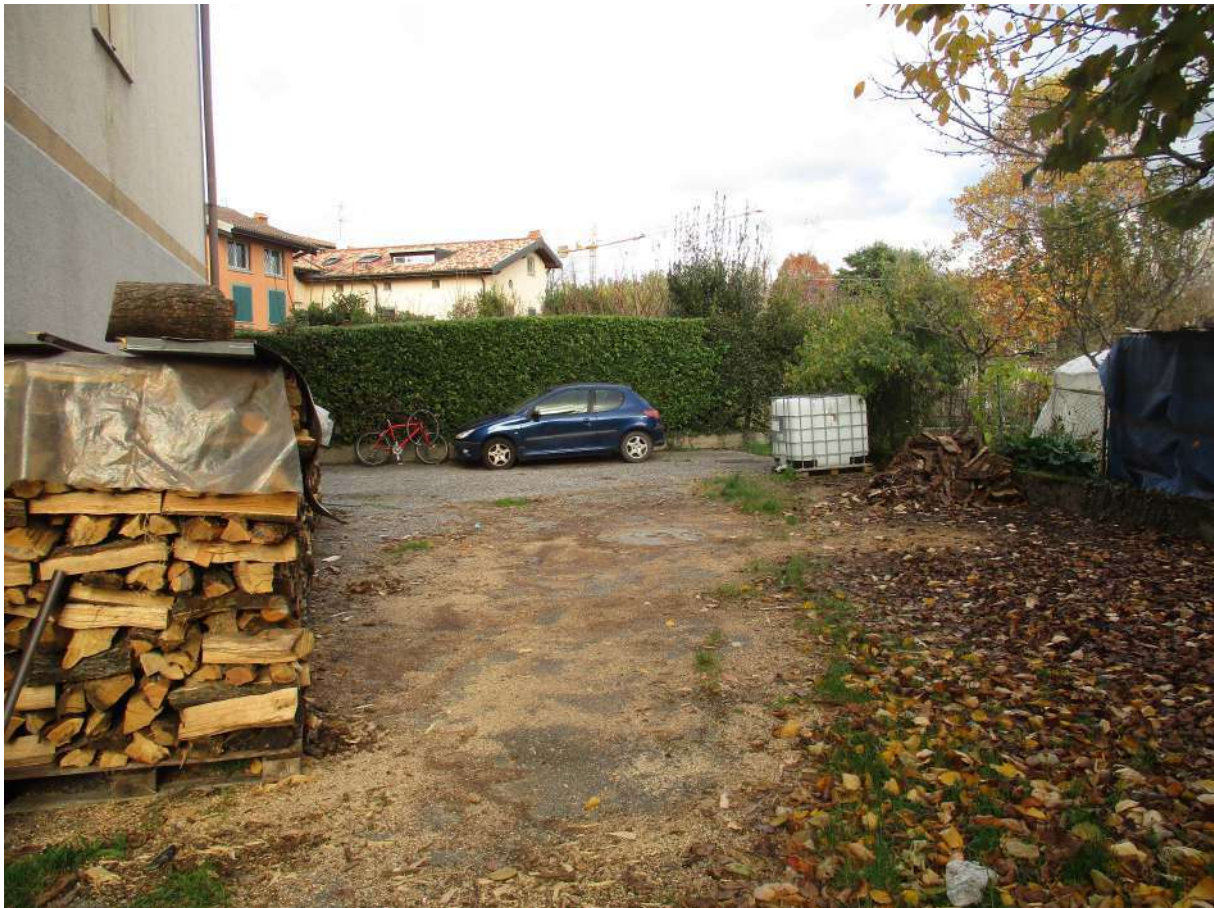
Fig. 9 – Vista del cortile condominiale (lato est)