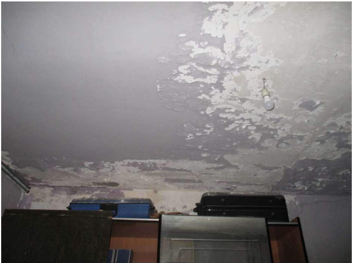
Fig. 36 – Vista della tinteggiatura ammalorata sul soffitto/parete della seconda camera