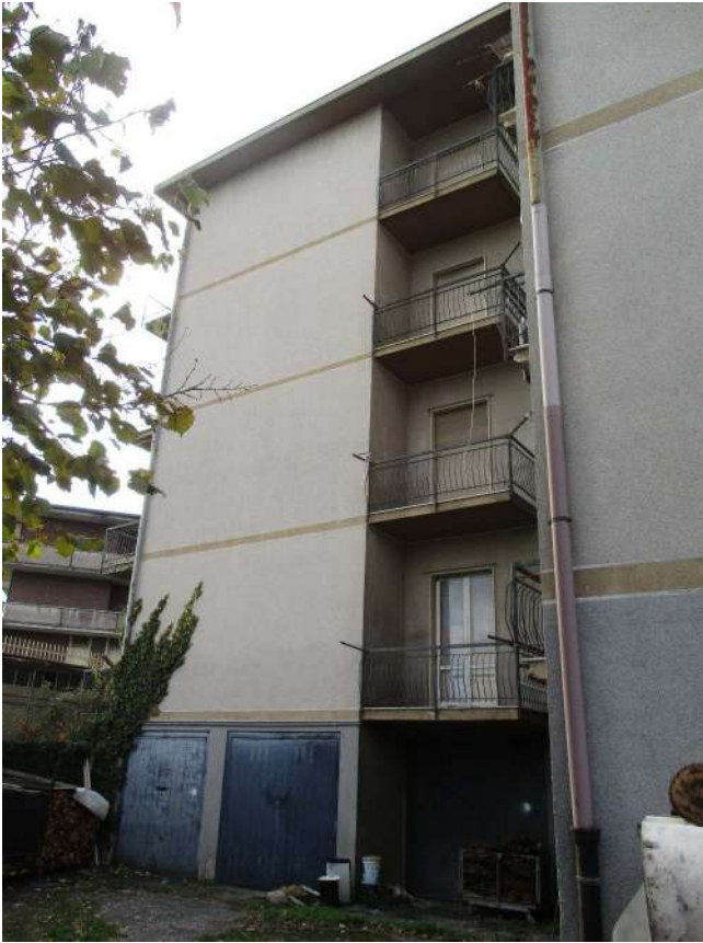
Fig. 7 – Vista del condominio (lato est)