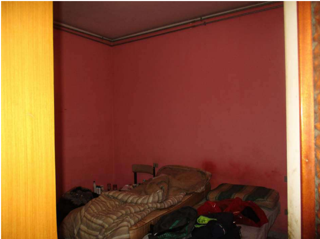
Fig. 31 – Vista della camera adiacente alla cucina (angolo sud-est)