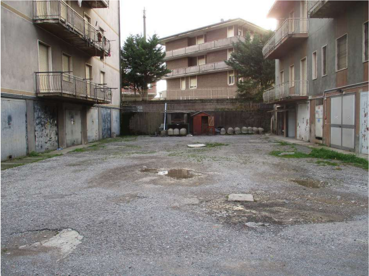
Fig. 3 – Vista d'insieme del cortile/piazzale condominiale (lato ovest)