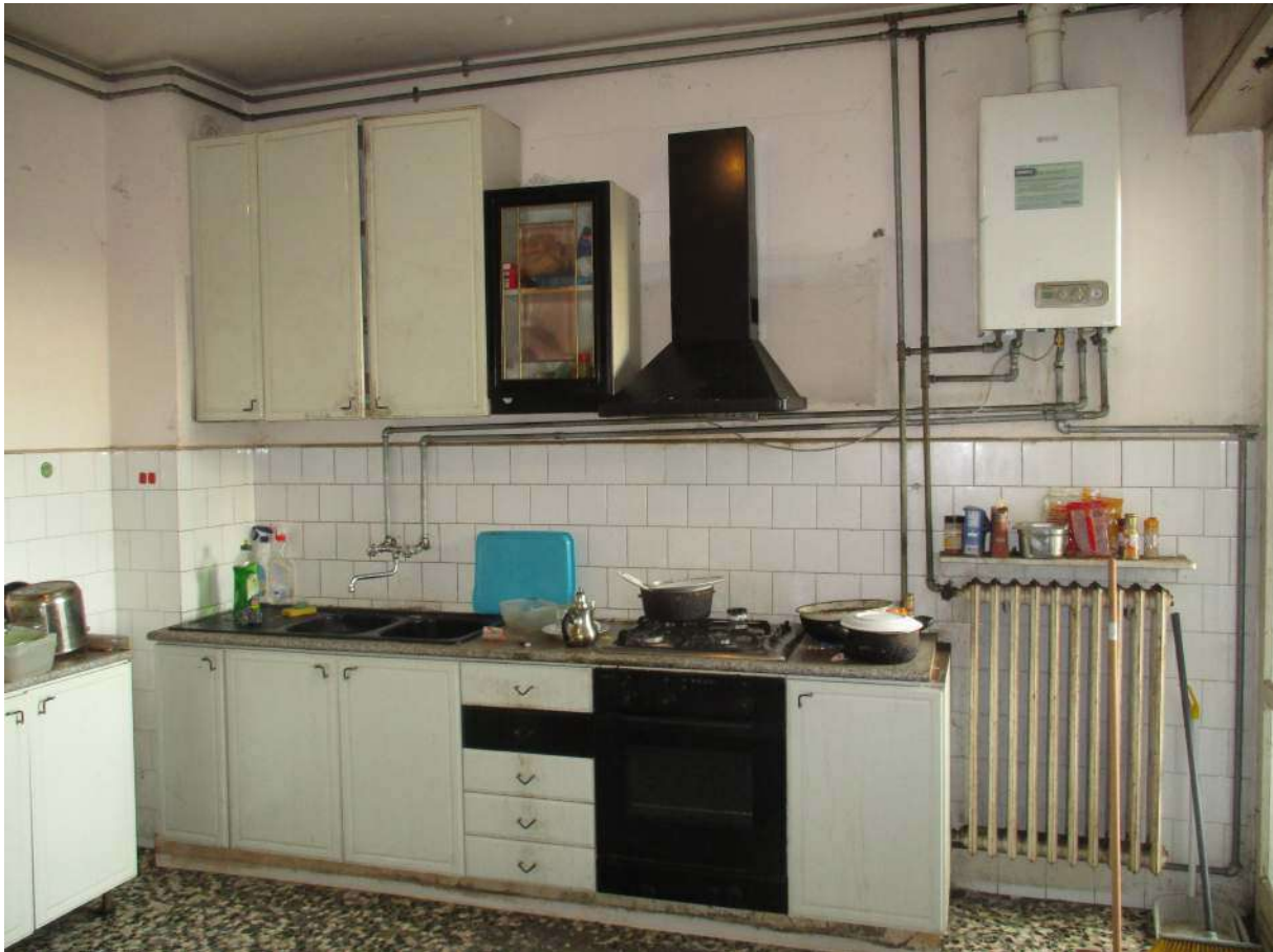
Fig. 24 – Vista del blocco cucina