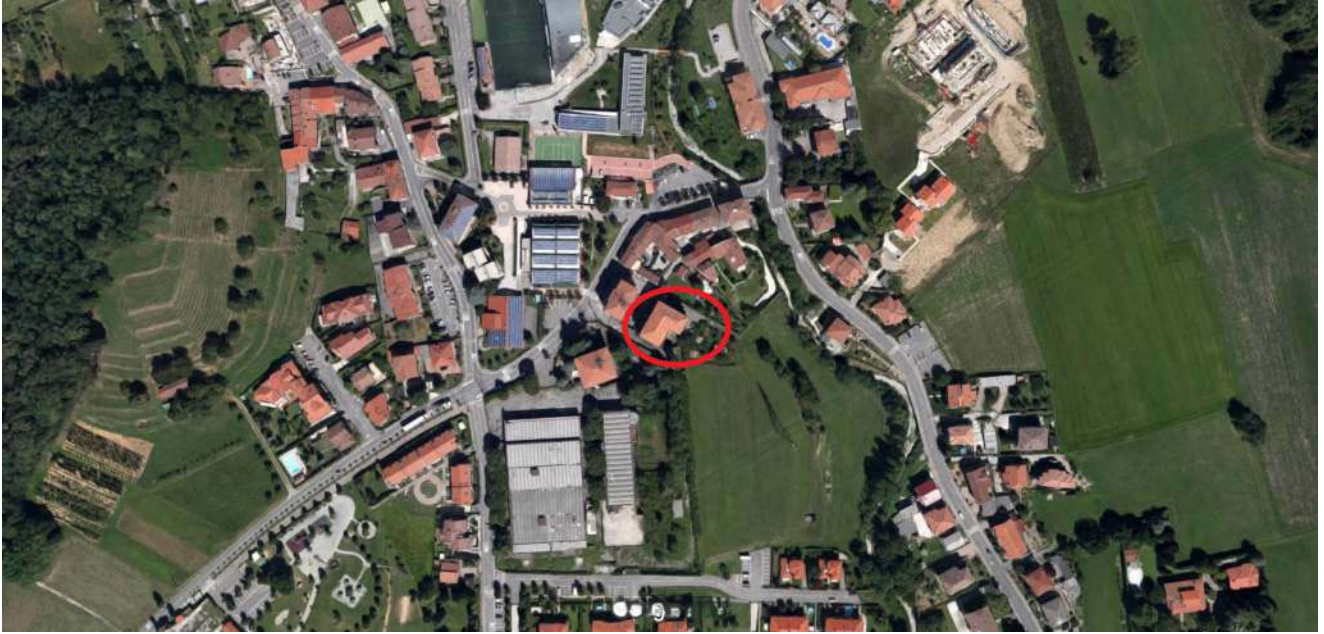
Fig. 1 – Immagine satellitare con il condominio in cui è inserito l'appartamento cerchiato in rosso