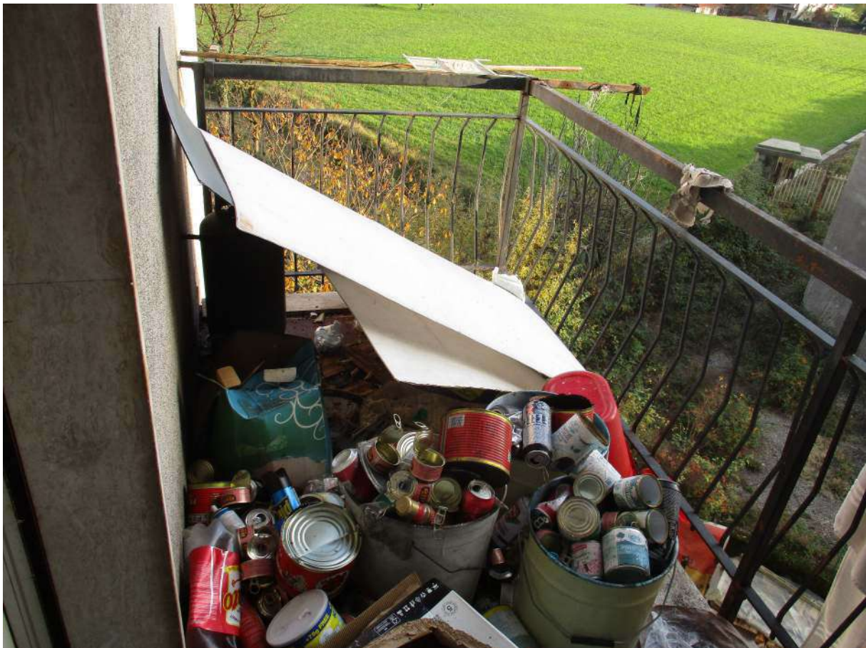
Fig. 25 – Vista del balcone con accesso dalla cucina (lato sud)