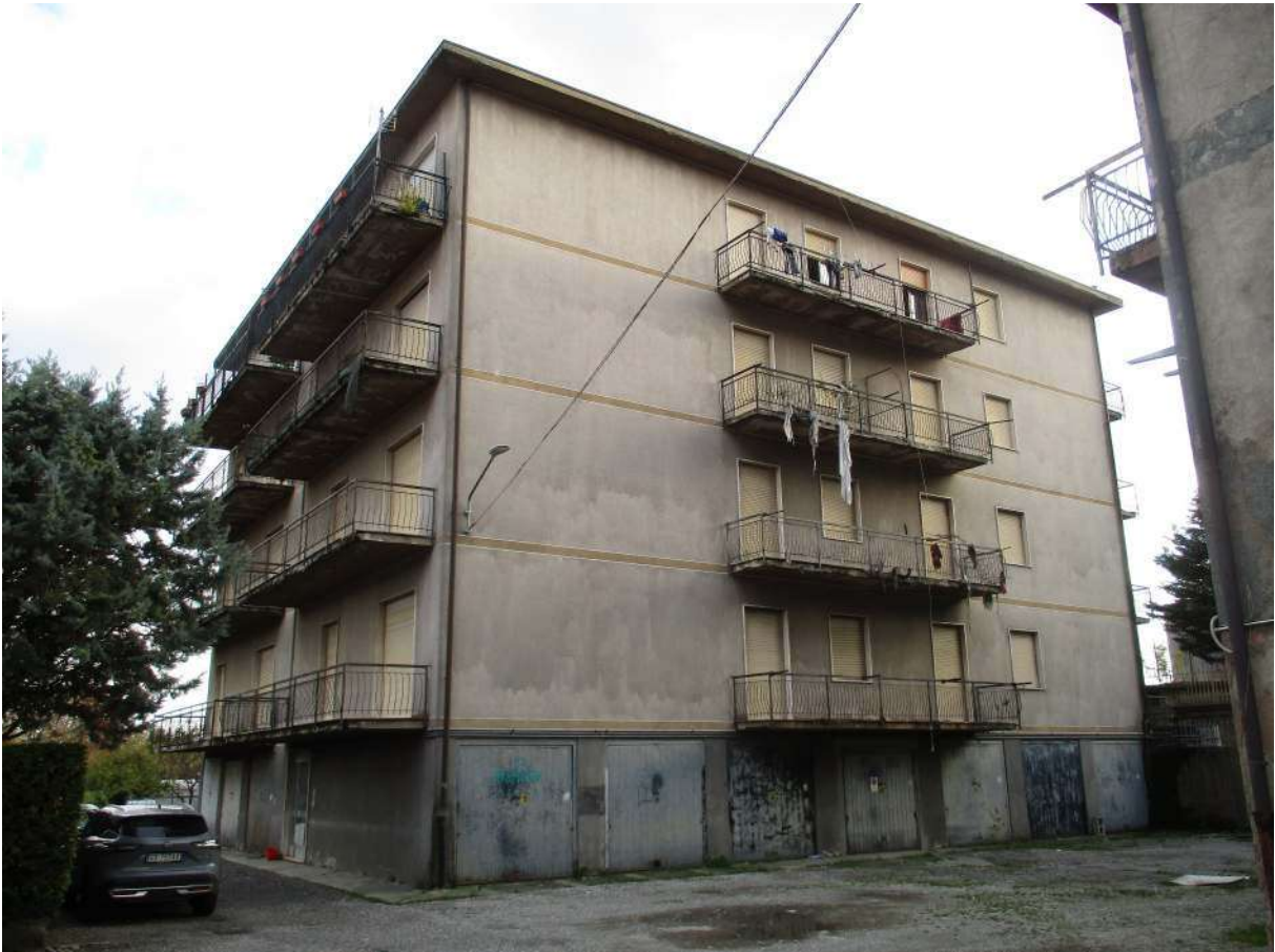
Fig. 4 – Vista d'insieme del condominio da Via San Rocco (prospetto ovest)