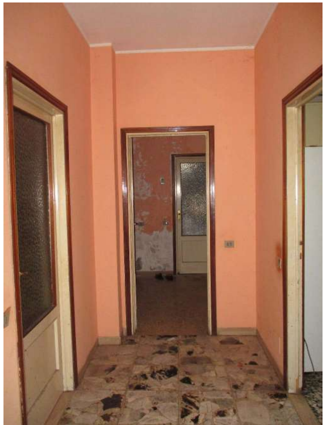
Fig. 21 – Vista del corridoio dall'ingresso