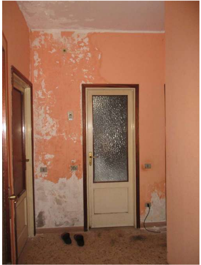
Fig. 30 – Vista del disimpegno della zona notte