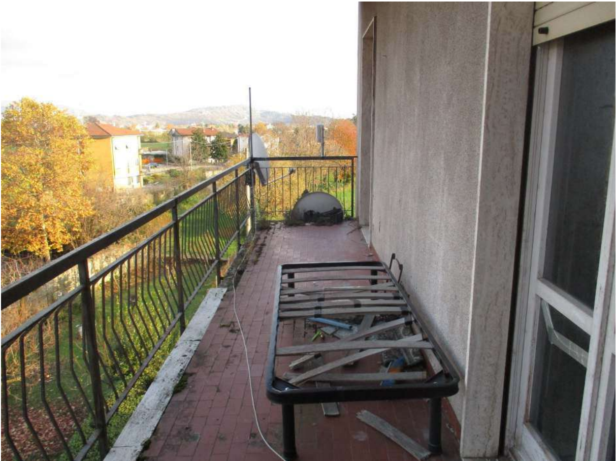
Fig. 28 – Vista del balcone con accesso dal soggiorno e da una camera (lato nord)