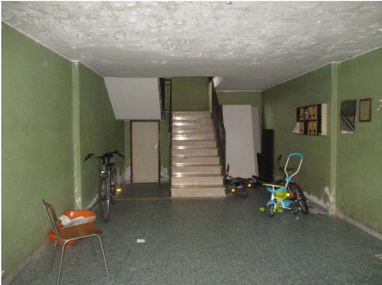
Fig. 12 – Vista dell'androne d'ingresso condominiale in cui si trova l'alloggio oggetto di stima