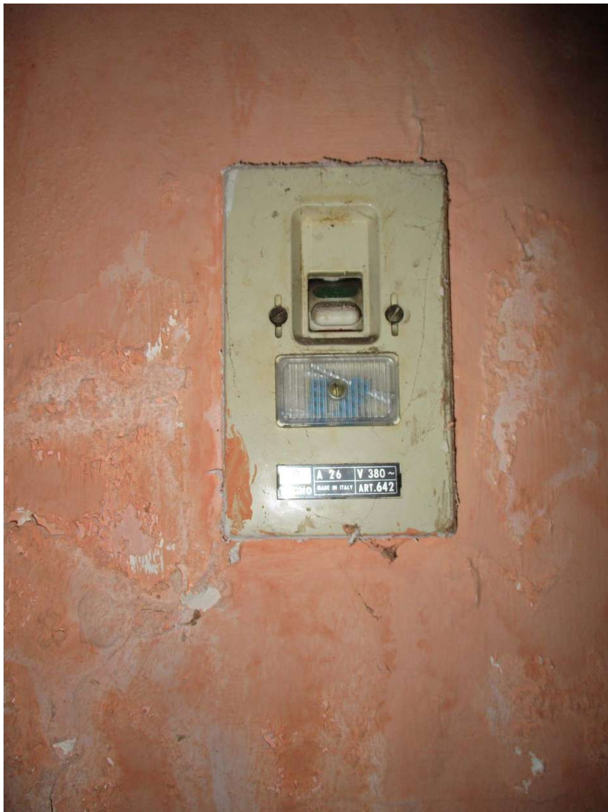
Fig. 45 – Vista del quadro di alimentazione del boiler installato nel disimpegno della zona notte