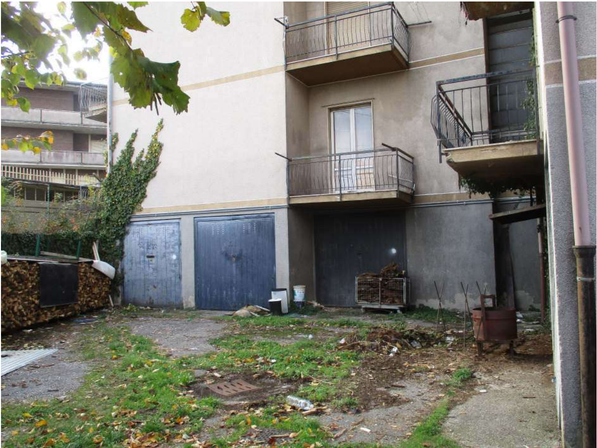
Fig. 10 – Vista del cortile condominiale (lato sud)