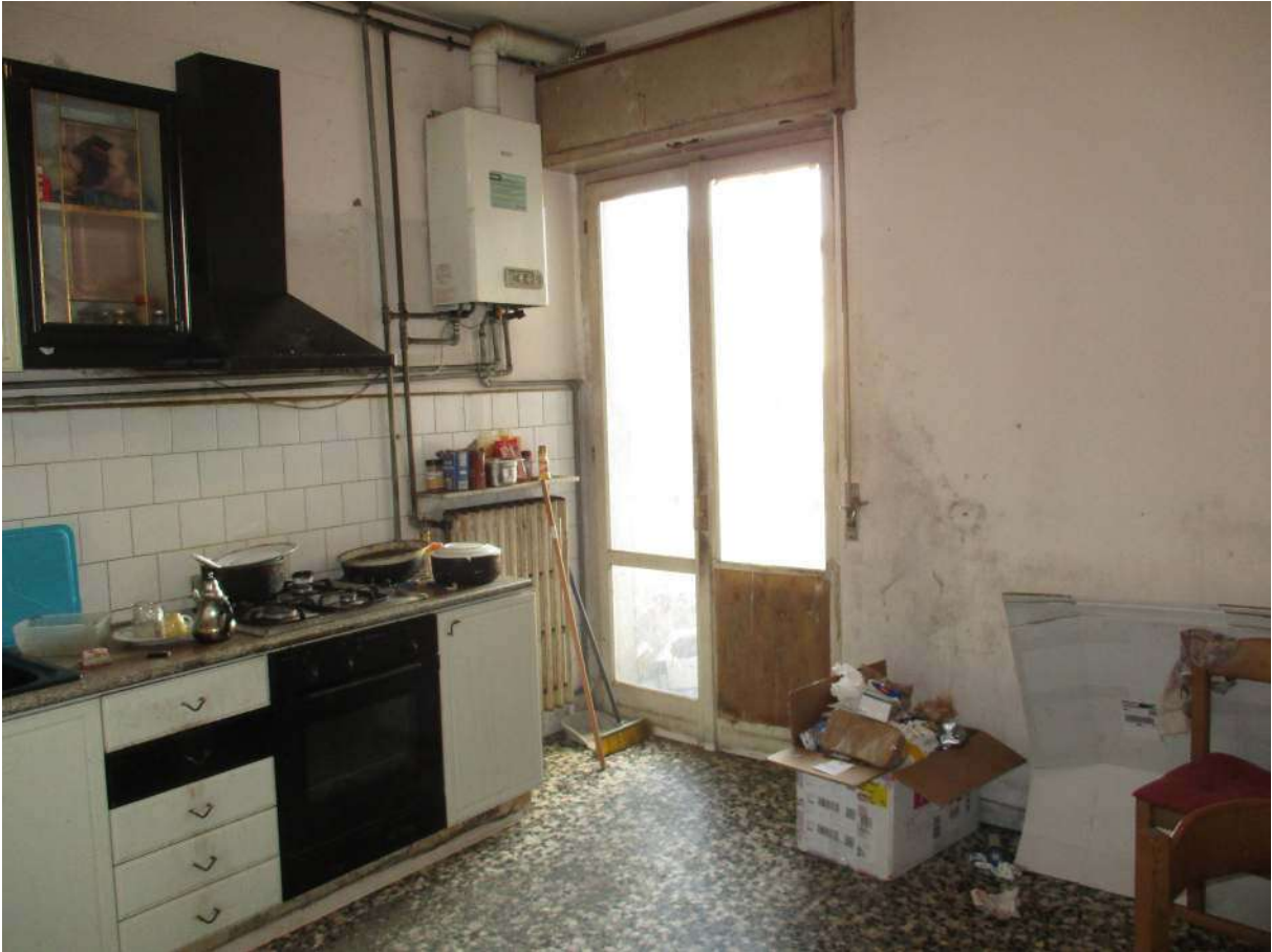
Fig. 22 – Vista della cucina dal corridoio