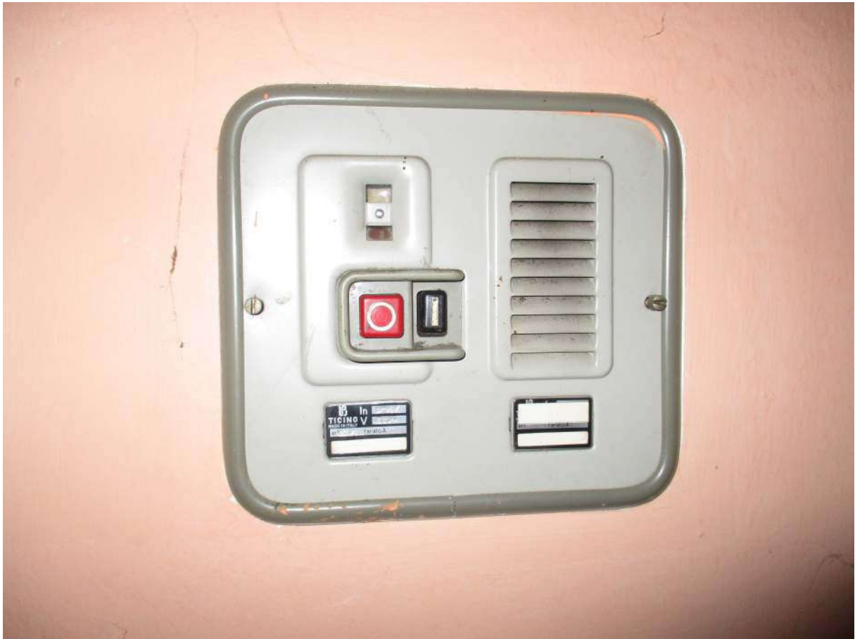
Fig. 43 – Vista del quadro elettrico installato nel corridoio d'ingresso