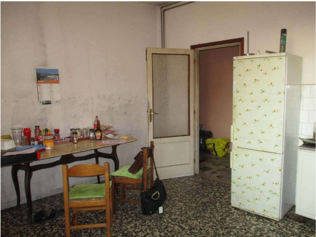
Fig. 23 – Vista d'insieme della cucina