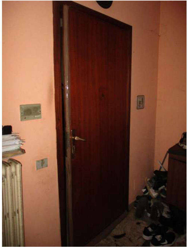
Fig. 19 – Vista interna della porta d'ingresso