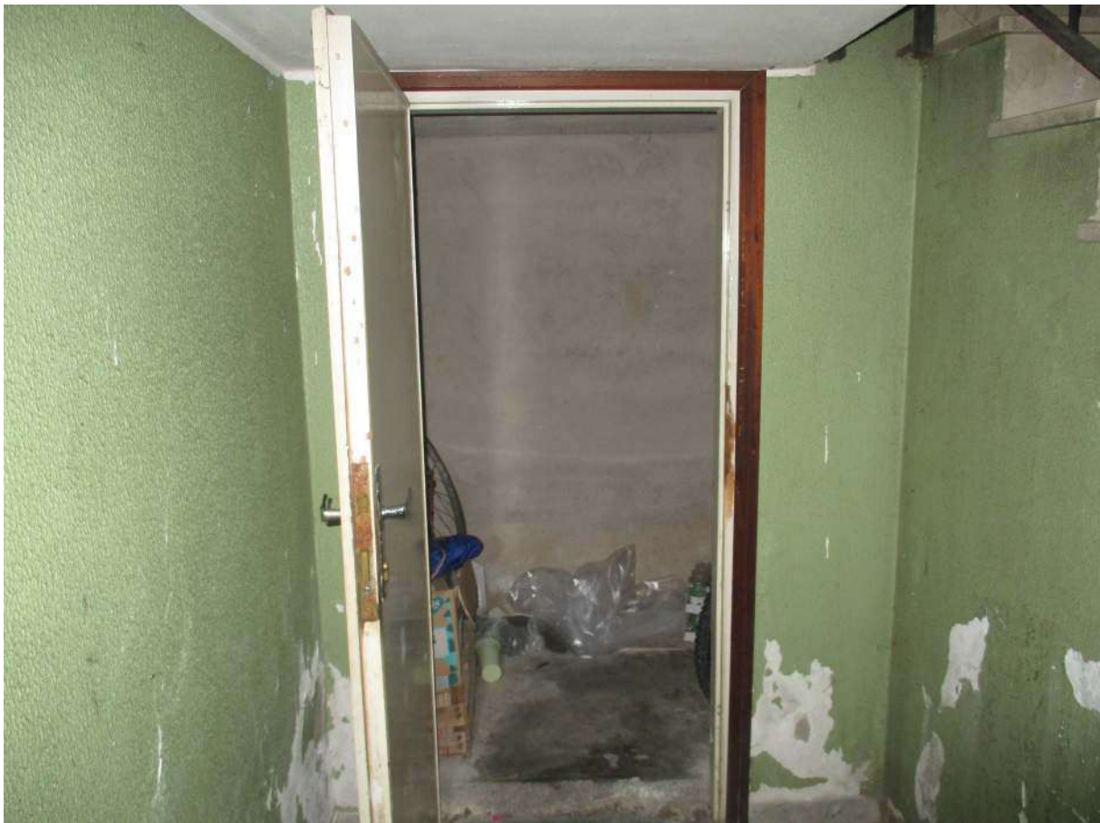
Fig. 13 – Vista della porta del locale contatori posto nell'androne d'ingresso