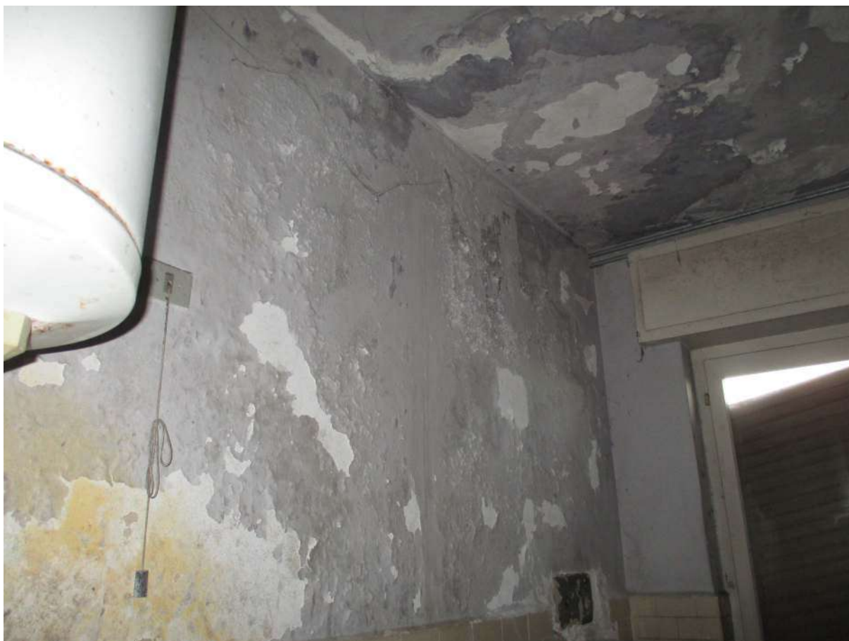
Fig. 41 – Vista della tinteggiatura ammalorata sul soffitto/pareti del bagno