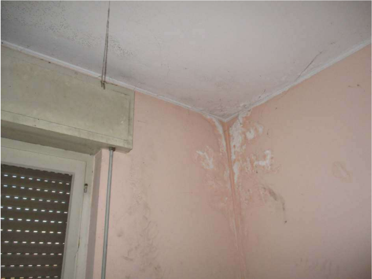
Fig. 27 – Vista della tinteggiatura ammalorata sulle pareti/soffitto del soggiorno