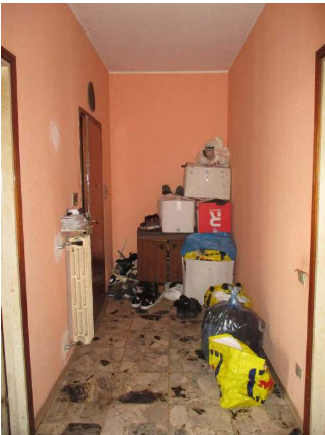
Fig. 20 – Vista della zona ingresso