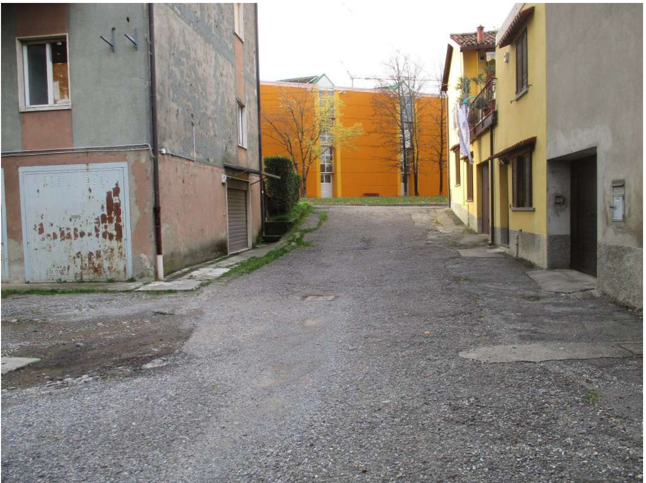
Fig. 2 – Vista dell'accesso al condominio da Via San Rocco (lato ovest)