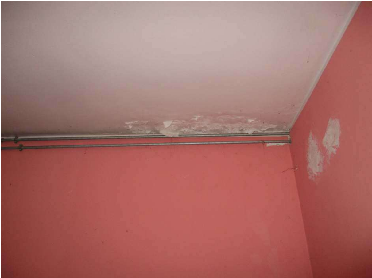
Fig. 33 – Vista della tinteggiatura ammalorata sul soffitto/parete della camera