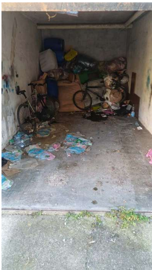
Fig. 48 – Vista interna del box pertinenziale