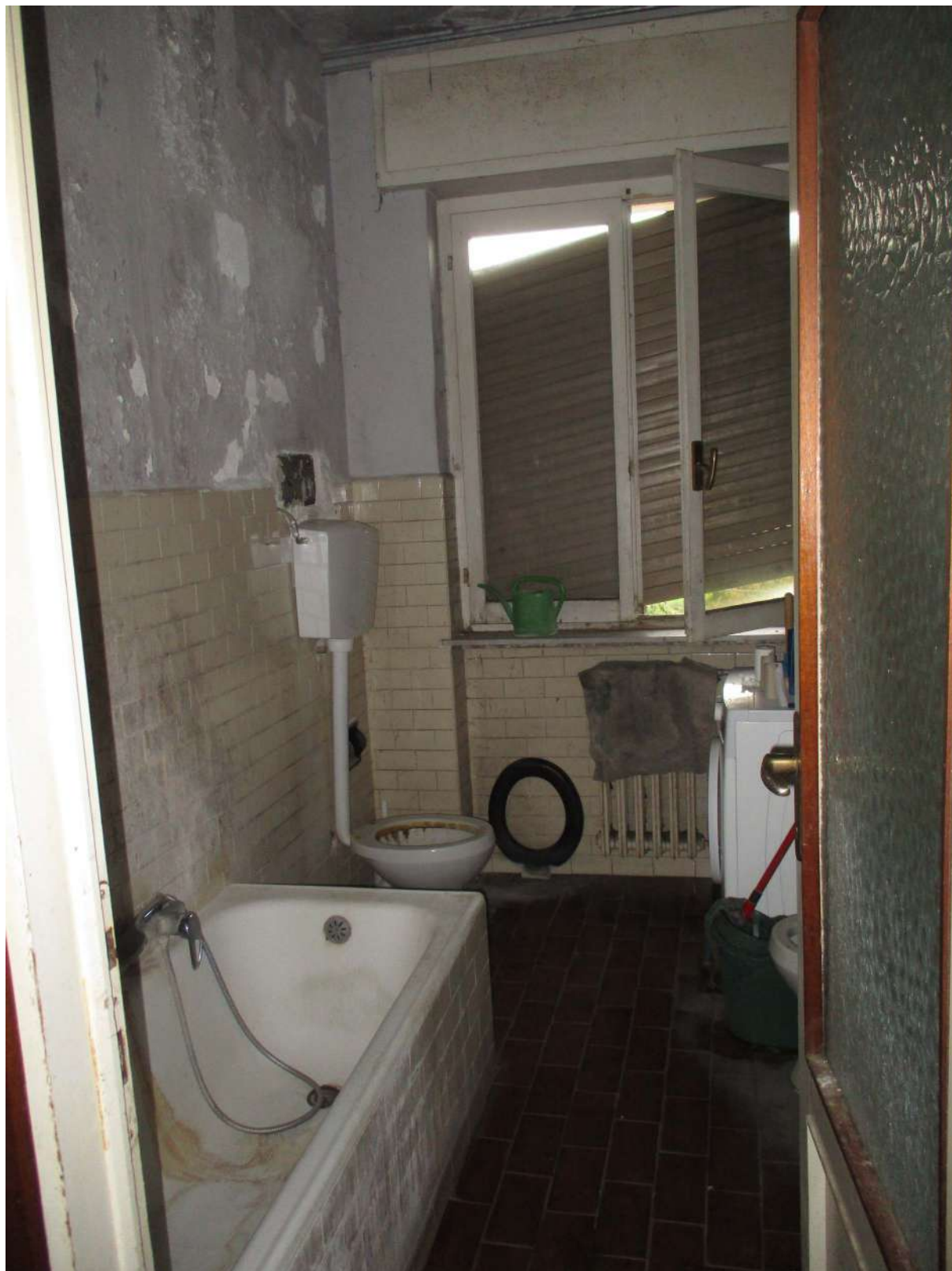
Fig. 37 – Vista del bagno dal disimpegno