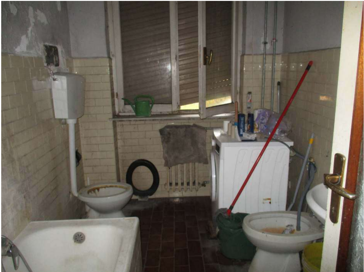
Fig. 38 – Vista del bagno (zona sanitari)