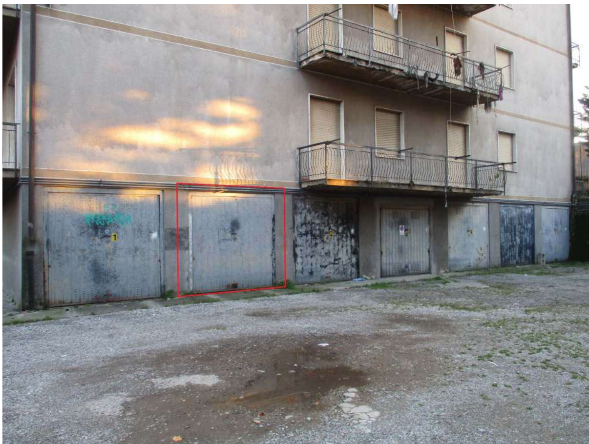
Fig. 46 – Vista del box pertinenziale oggetto di stima al P.T. riquadrato in rosso