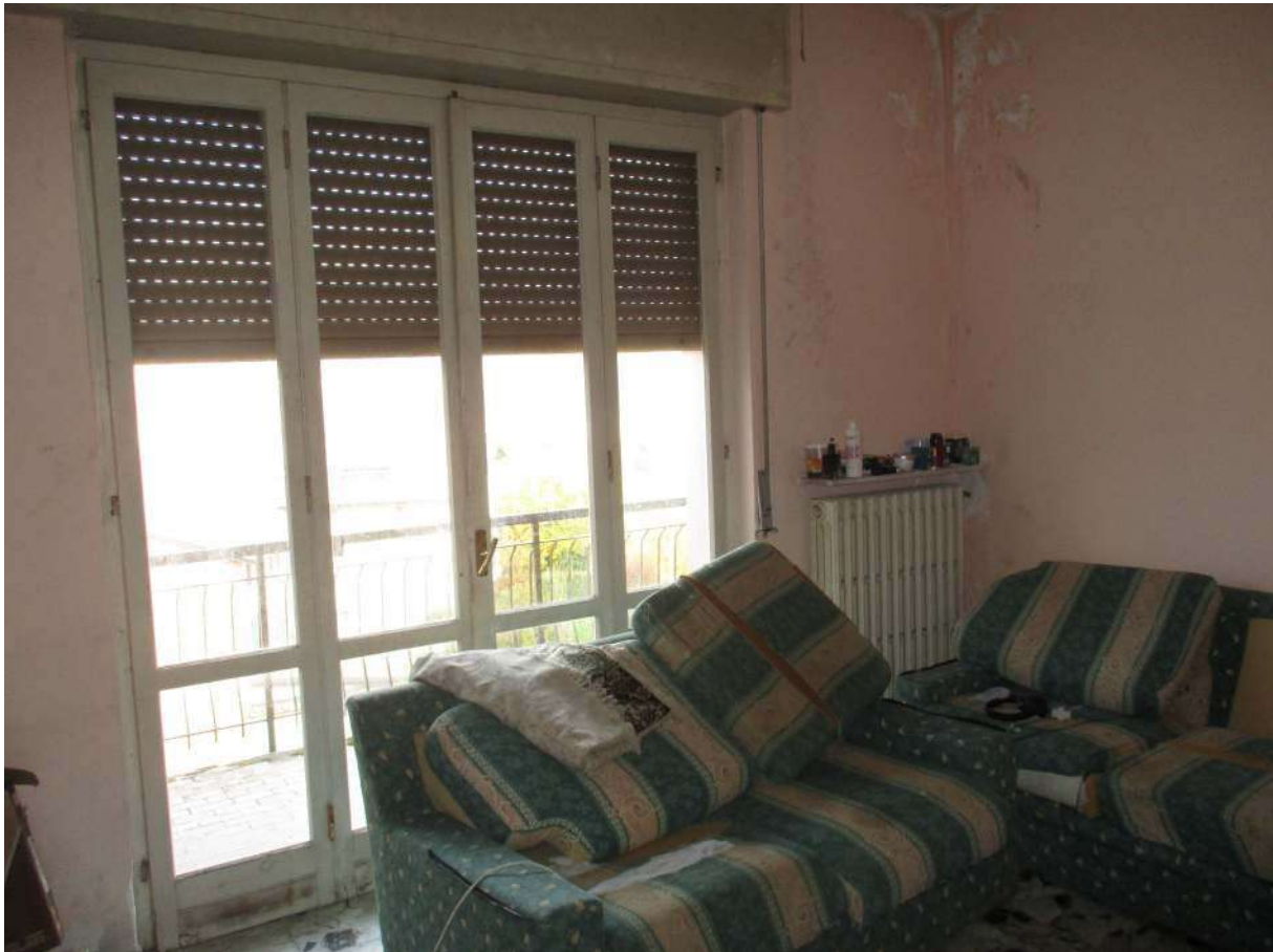
Fig. 25 – Vista del soggiorno con accesso al balcone