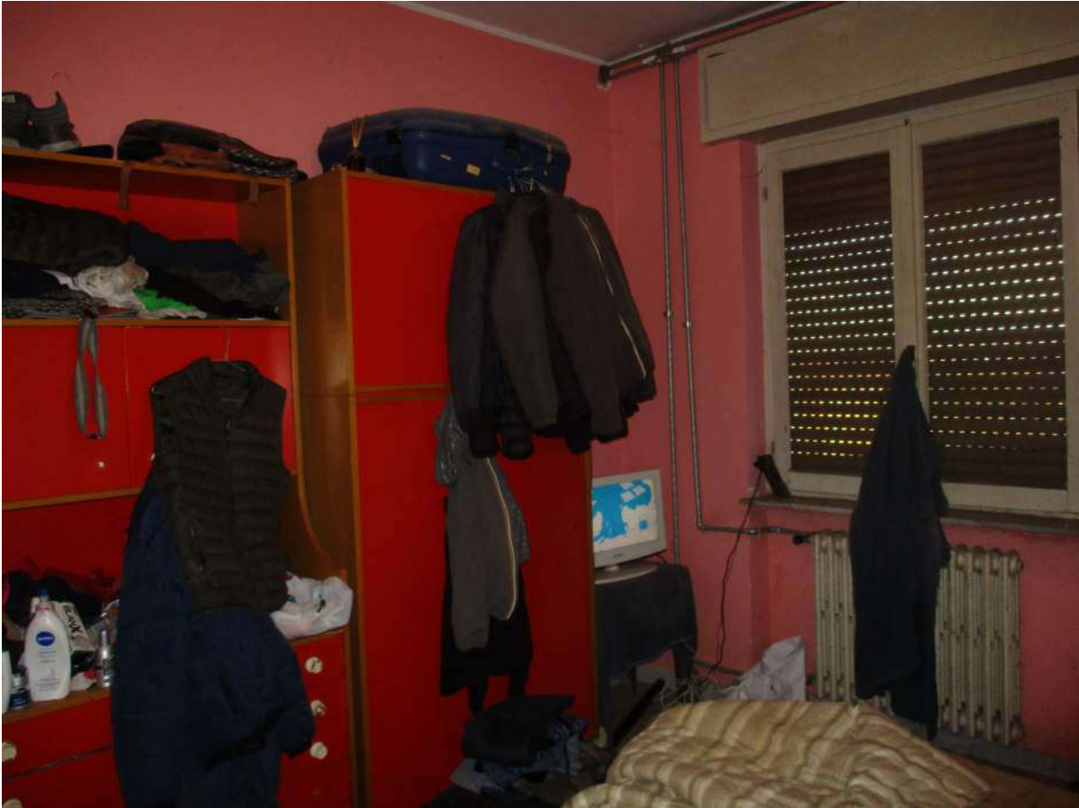
Fig. 32 – Vista della camera adiacente alla cucina (angolo sud-est)