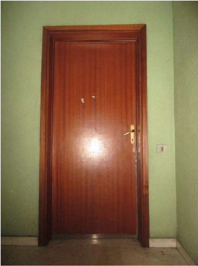
Fig. 18 – Vista esterna della porta d'ingresso