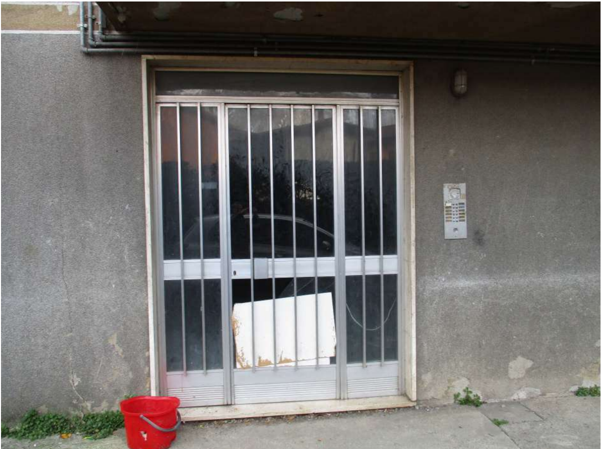
Fig. 11 – Vista dell'ingresso alla scala condominiale in cui si trova l'alloggio oggetto di stima