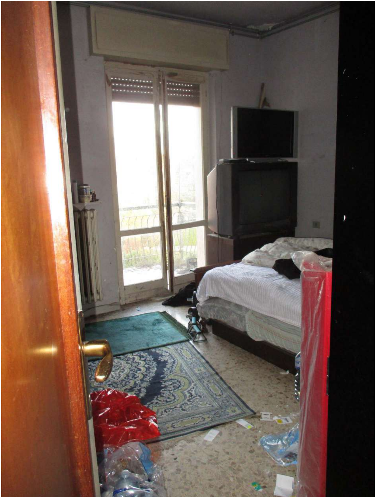
Fig. 34 – Vista della seconda camera con accesso al balcone (lato nord)