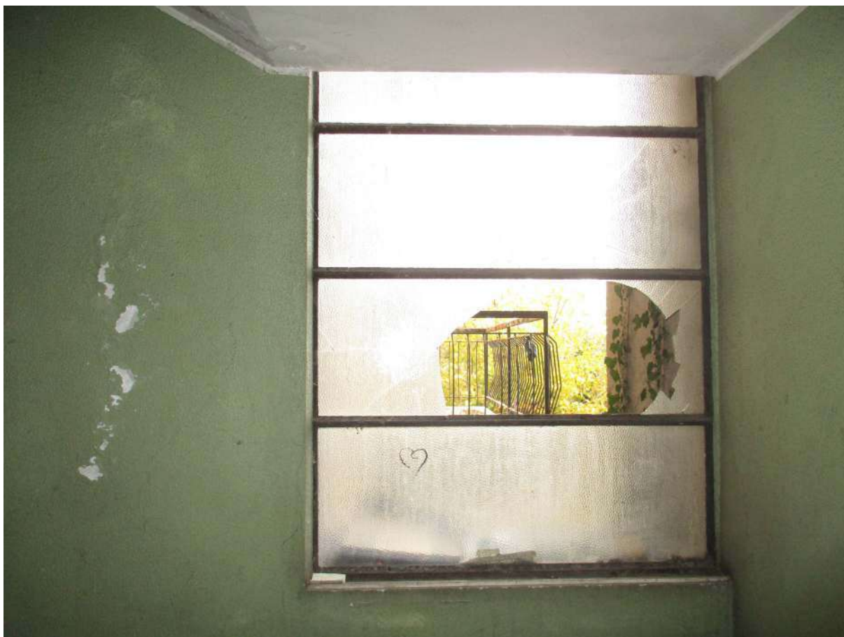
Fig. 16 – Vista di un vetro rotto nel vano scala condominiale