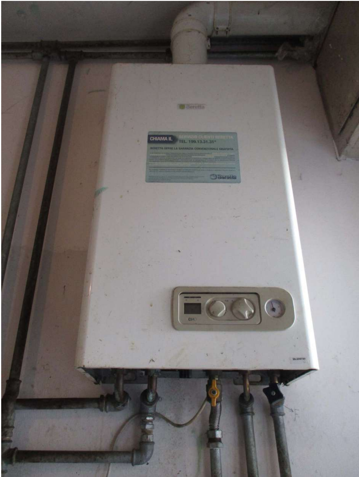
Fig. 42 – Vista della caldaia installata in cucina