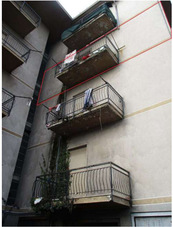
Fig. 8 – Vista del condominio (lato sud)