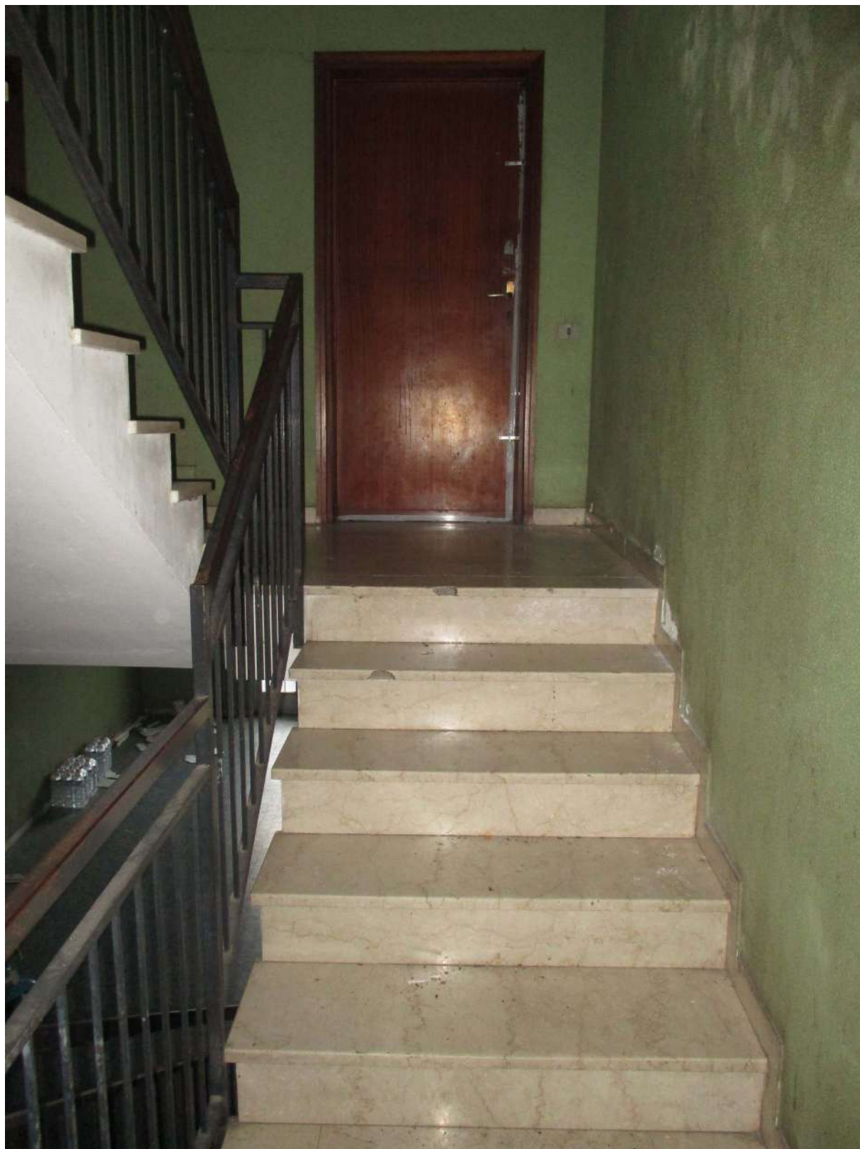
Fig. 17 – Vista del vano scala condominiale