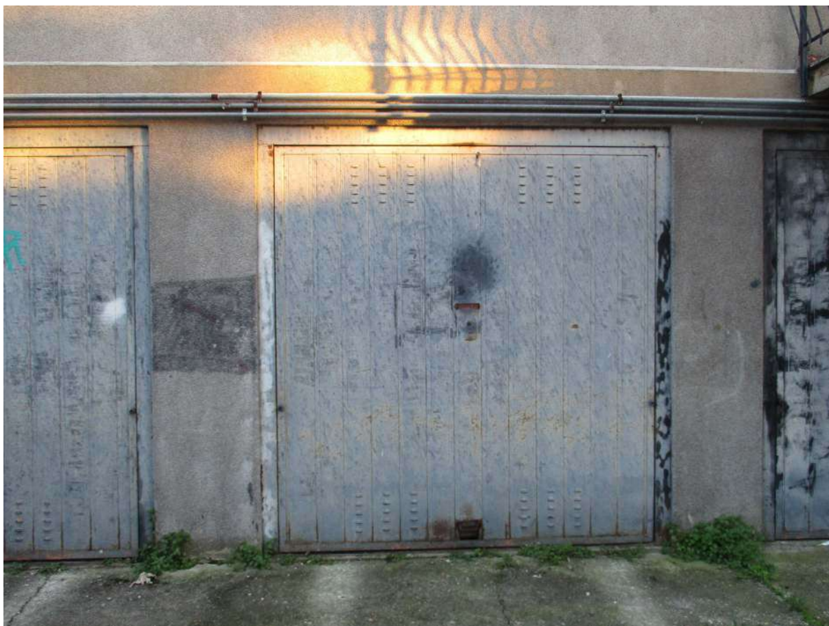
Fig. 47 – Vista della basculante del box pertinenziale all'alloggio oggetto di stima