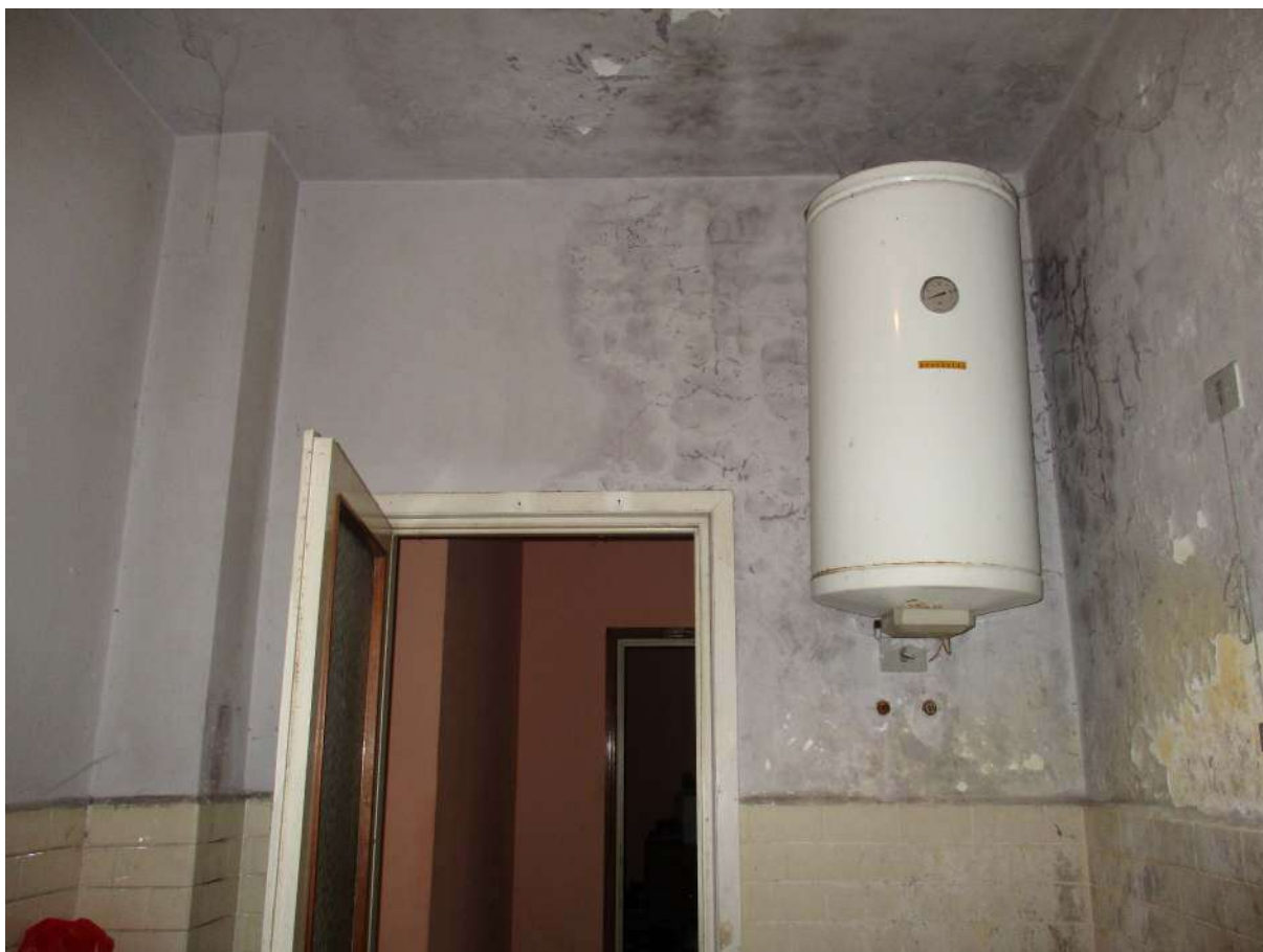
Fig. 40 – Vista dello scaldabagno installato nel bagno