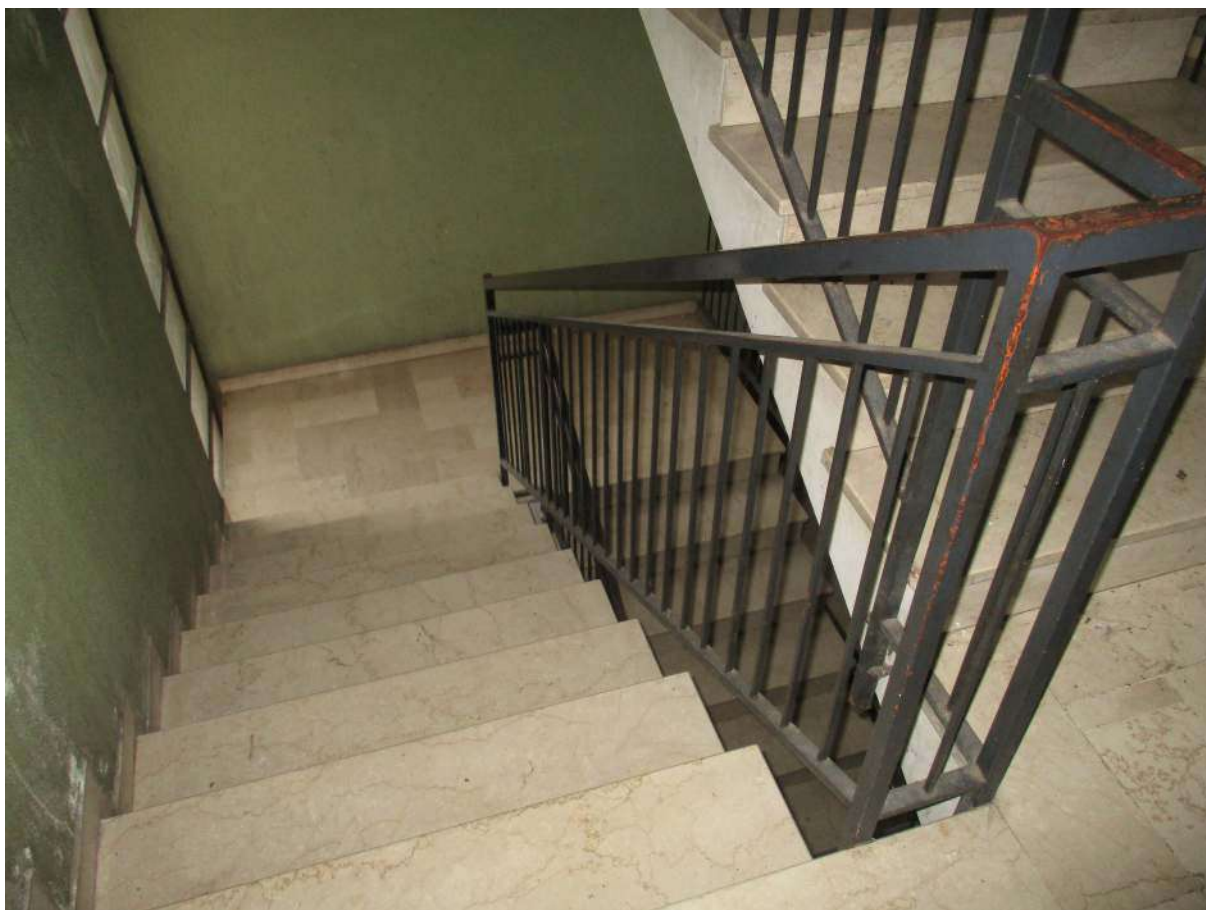
Fig. 15 – Vista del vano scala condominiale