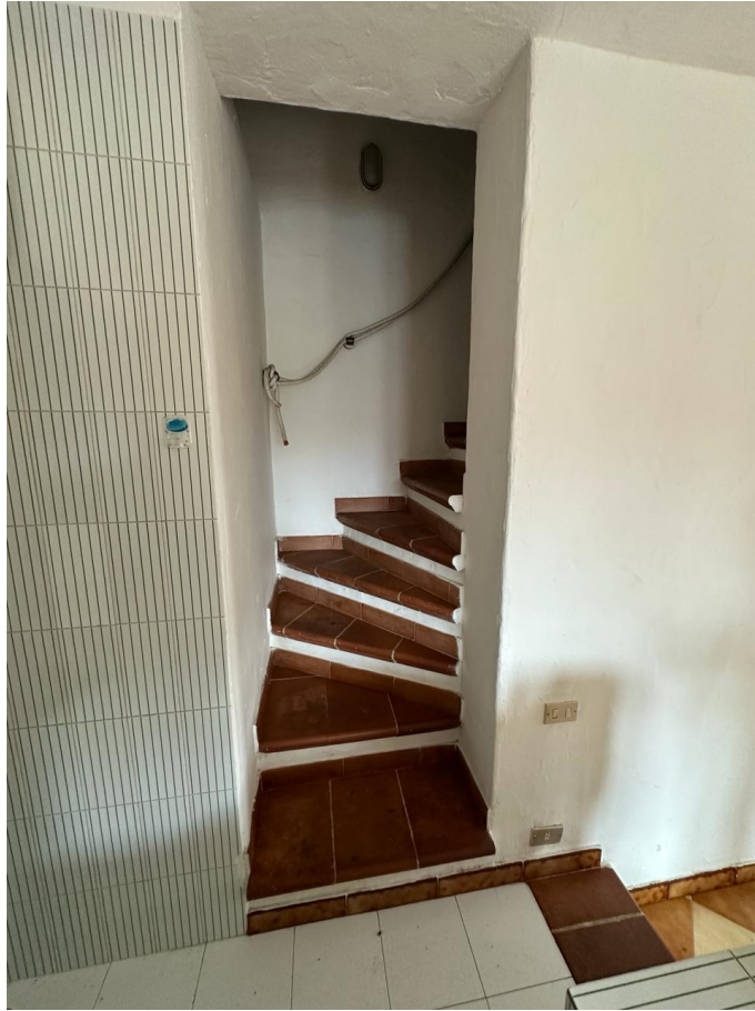
SCALA VERSO IL TERRAZZO