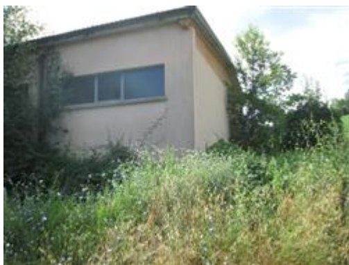
Scatto su parte di fabbricato

L'intero edificio sviluppa 1 piano, 1 piano fuori terra, 0 piano interrato. Immobile costruito nel 2001.