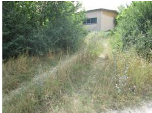
Percorso per accedere al capannone agricolo