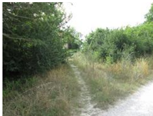
Incrocio tra Strada di Via La Ghita e la stradina per accedere al bene pignorato