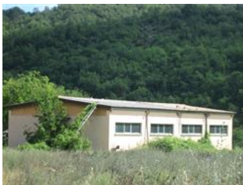
Scatto dalla strada, Via La Ghita, verso il retro del capannone.