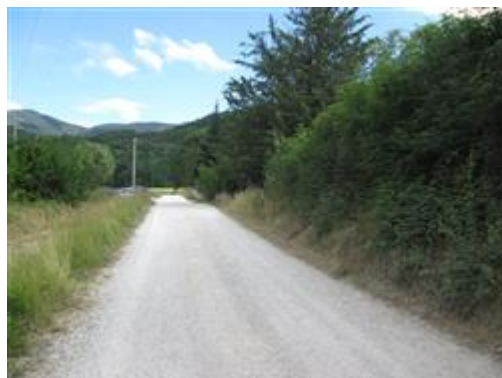
Scatto su Strada principale -Via La Ghita- nei pressi del capannone