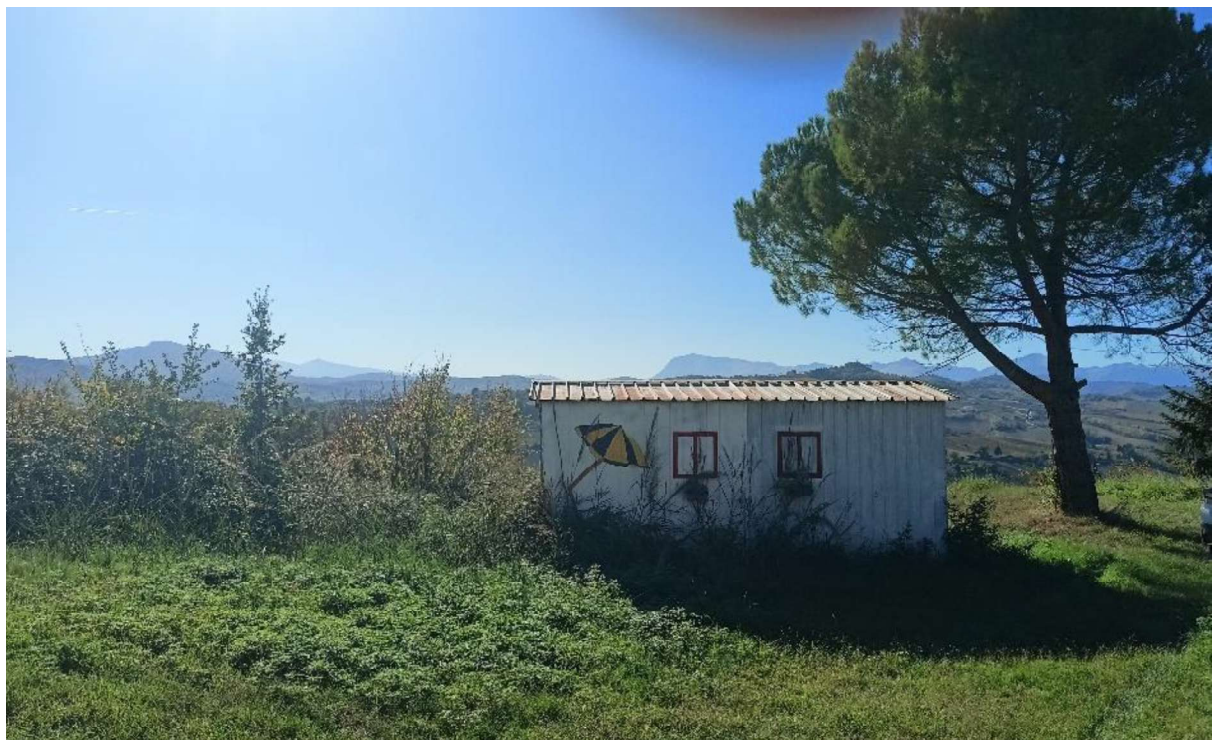
3. Prefabbricato abusivo presente sul lotto