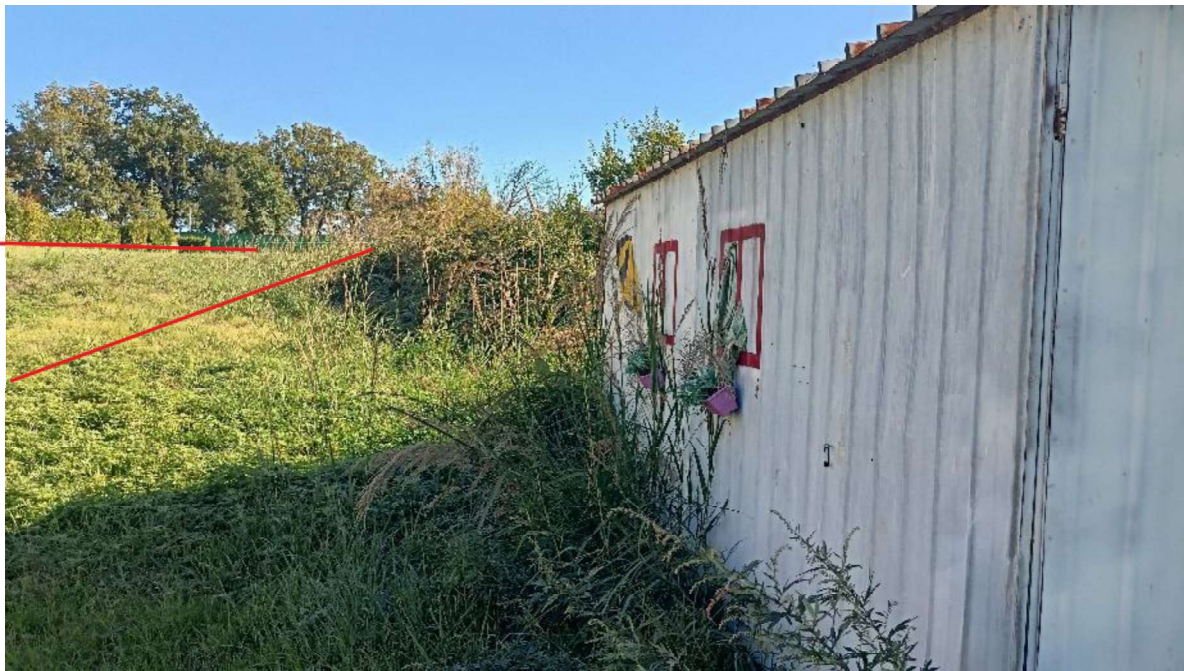
11. Area accesso campo sportivo