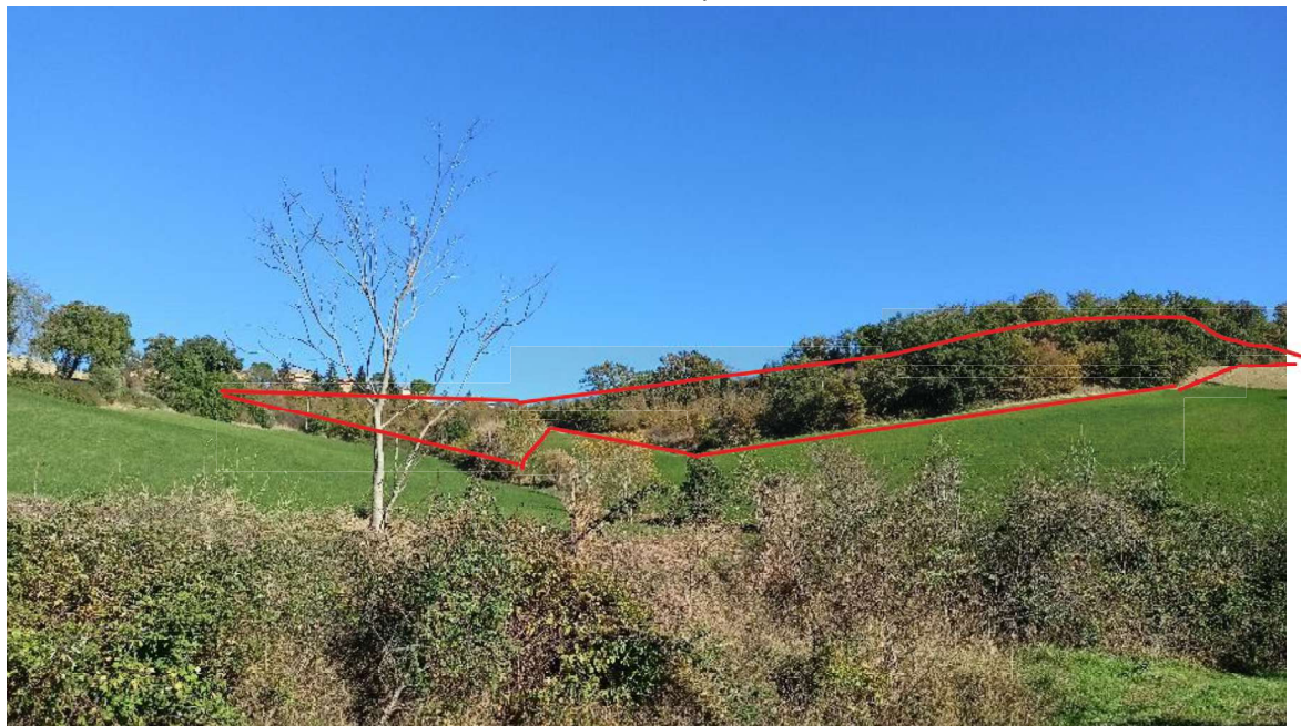
9. Vista dei lotti dal fronte Sud