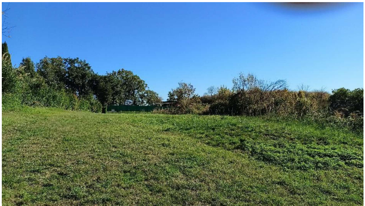
5. Area di ingresso e sgombrero utenza Campo Sportivo