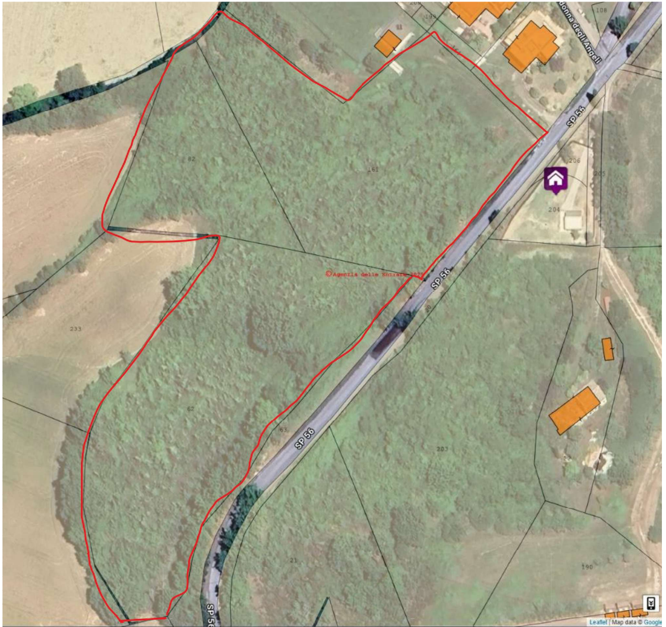
1. Inquadramento Otofotoplanimetrico