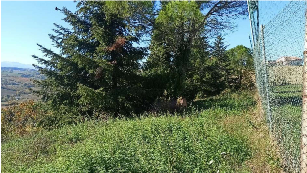
2. Limite Nord Part. 82