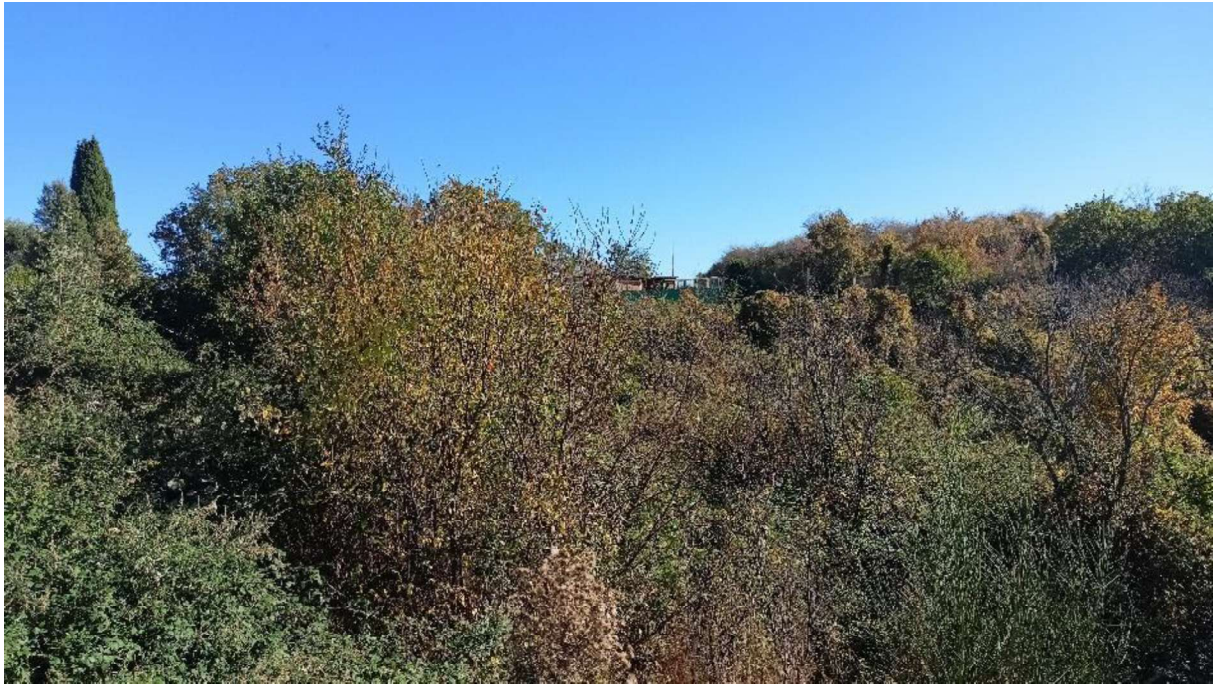
6. Vegetazione spontanea cresciuta nel lotto