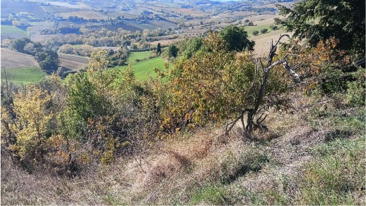
4. Vista delle ex coltivazioni dal fronte Nord