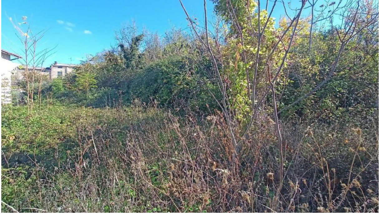
3. Terreno visto dalla parte bassa