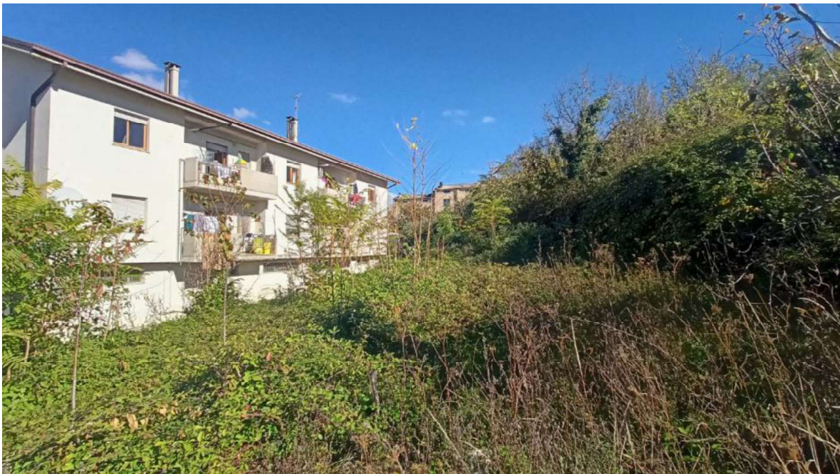
2. Limite con il caseggiato delle case popolari