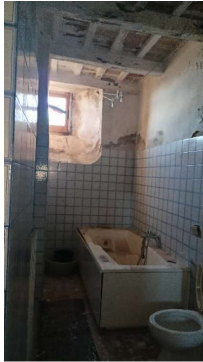
15. Bagno finestrato