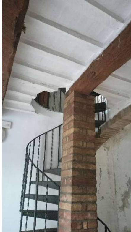
19. Scala elicoidale