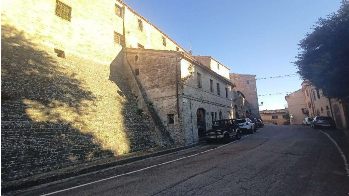
1. Vista dal fronte stradale