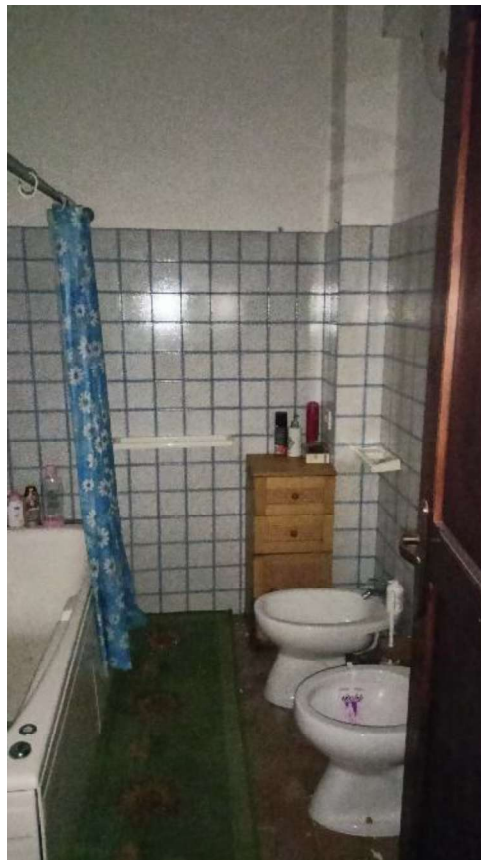
14. Bagno cieco