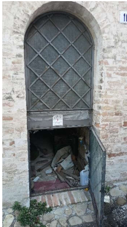
20. Centrale Termica