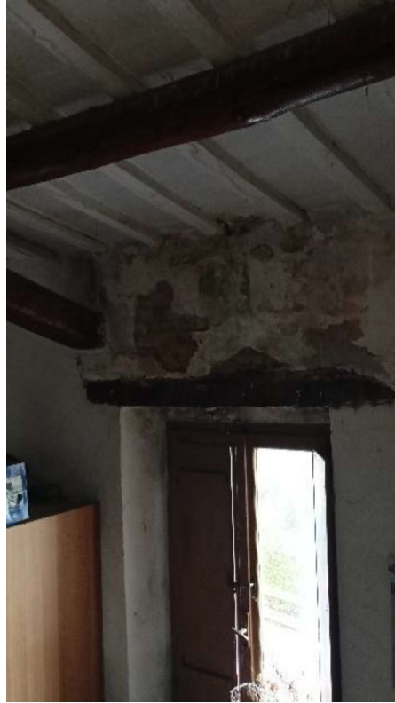
17. Perdita dal tetto fronte camera