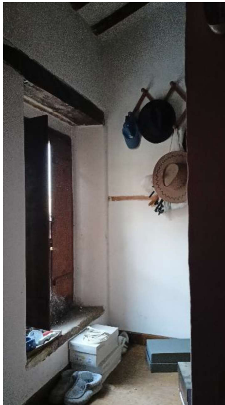
10. Seconda Camera verso mezzanino