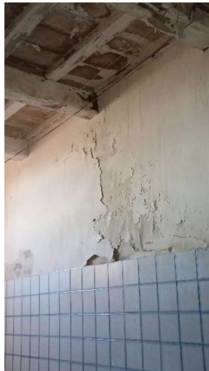
16. Perdita all'interno del bagno