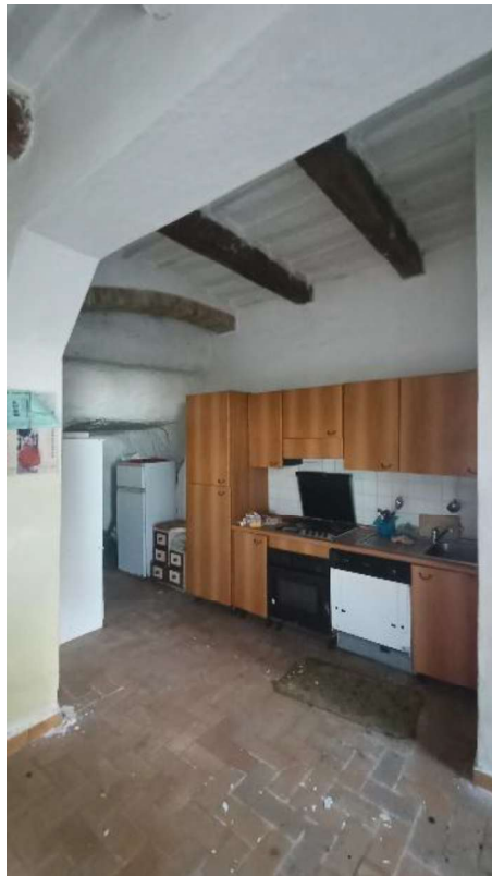
6. Angolo cottura + grotta