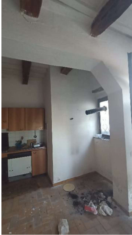
5. Angolo cottura