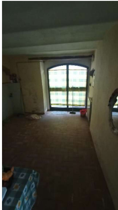
18. Subalterno 3