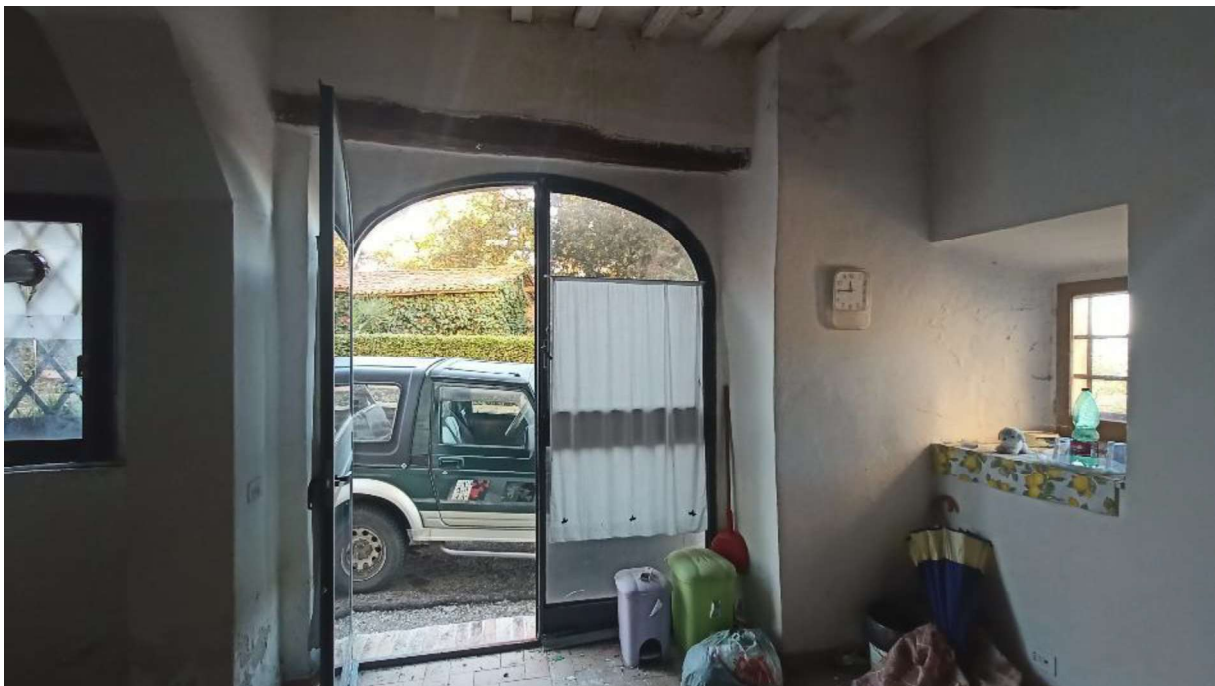
4. Interno Cucina Pranzo