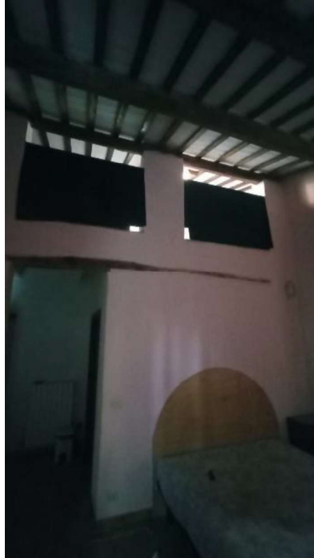
13. Vista mezzanino dalla seconda camera