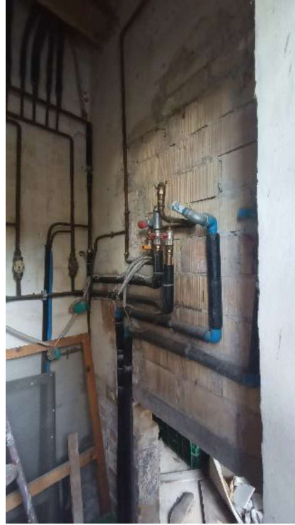
21. Alloggiamento caldaia, assente