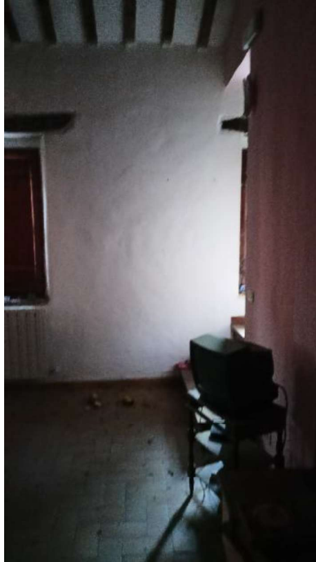
9. Seconda Camera piano primo