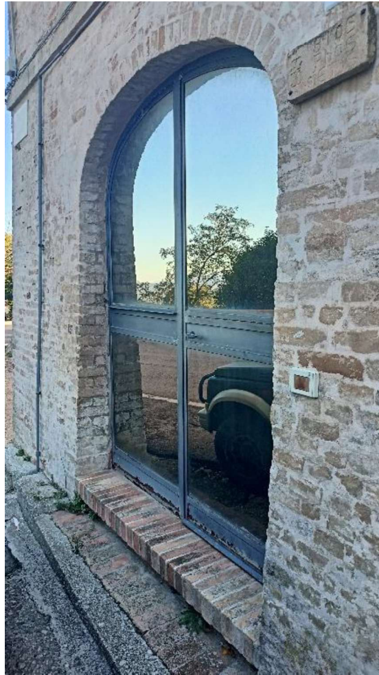
3. Ingresso Pedonale