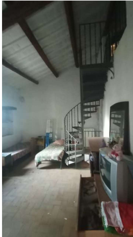
7. Camera piano primo