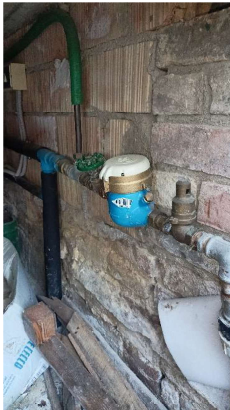
22. Contatore acqua