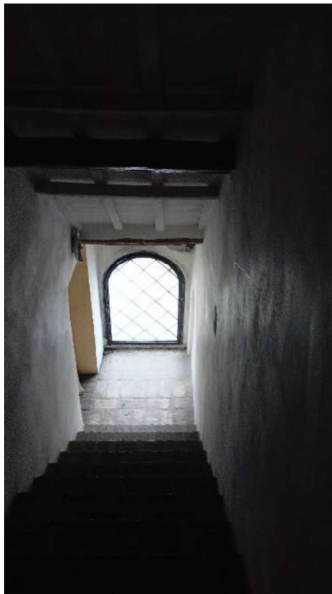
8. Scala in muratura centrali