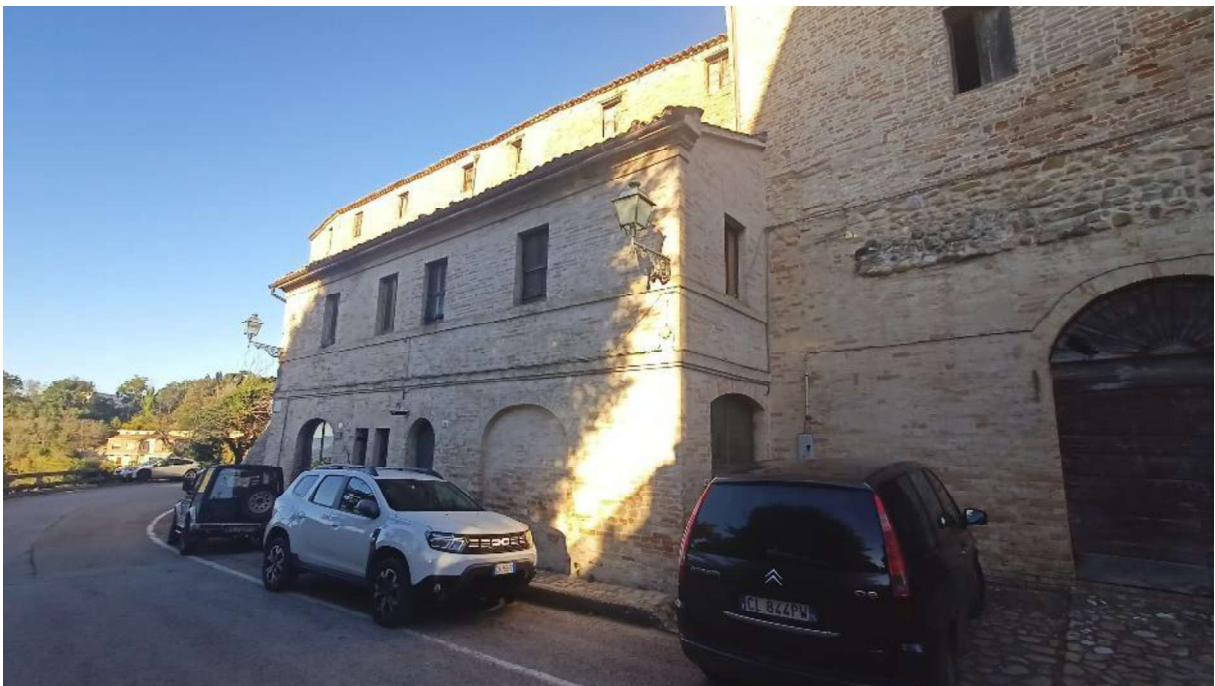
2. Ingresso fronte SUD sub.3