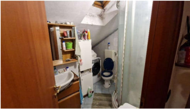
14. Servizio igienico P1