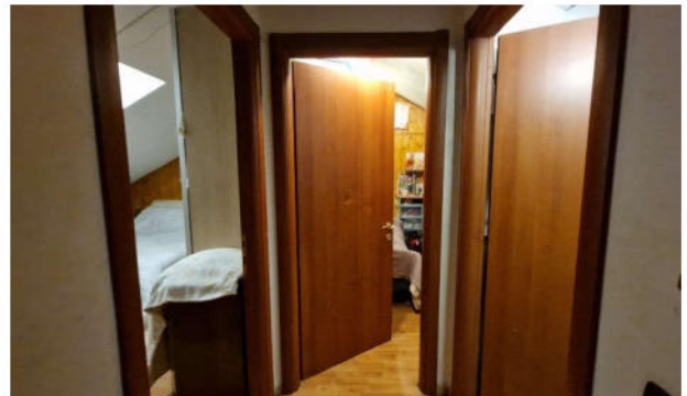
11. Disimpegno P1