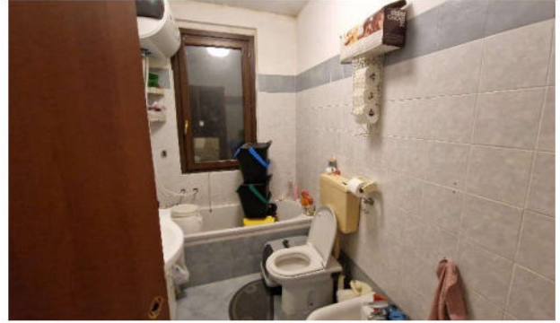
7. Servizio igienico