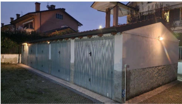
16. Blocco autorimesse