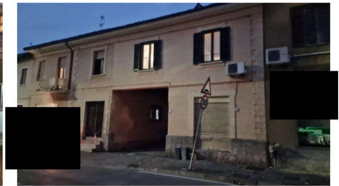
17. Accesso dalla Via Milano