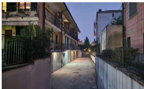
3. Veduta esterna del fabbricato