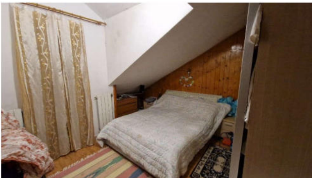
12. Camera da letto P1