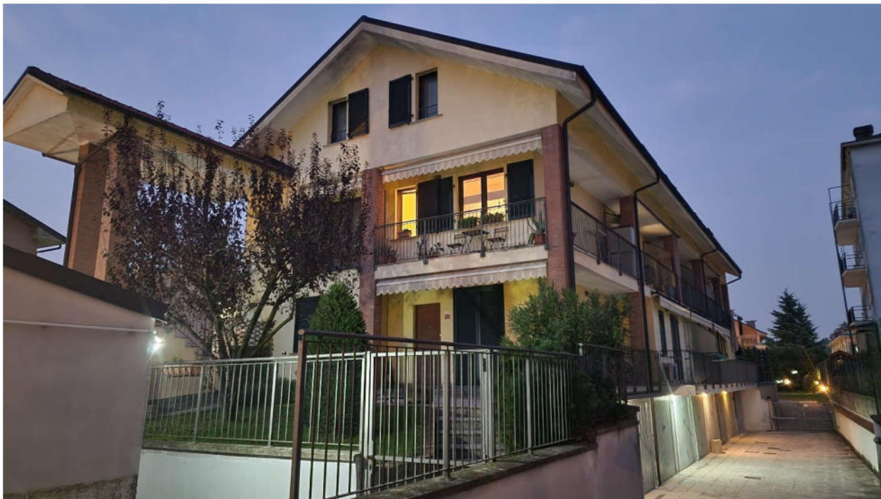
1. Veduta esterna del fabbricato