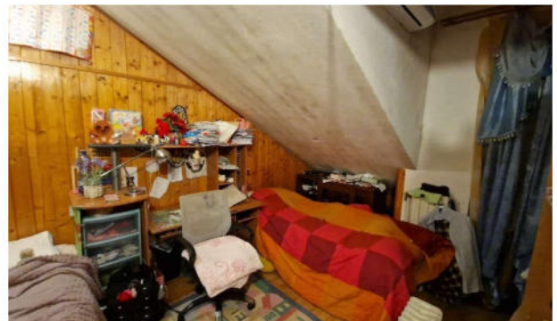
13. Camera da letto P1