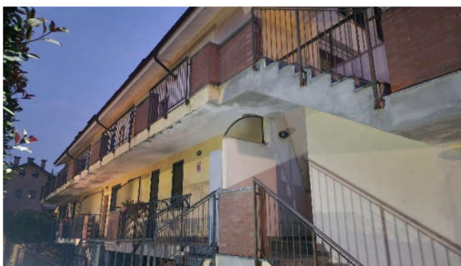
2. Veduta esterna del fabbricato