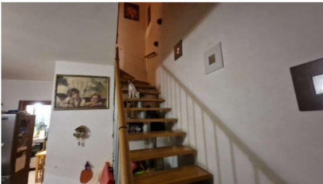
10. Accesso al piano primo