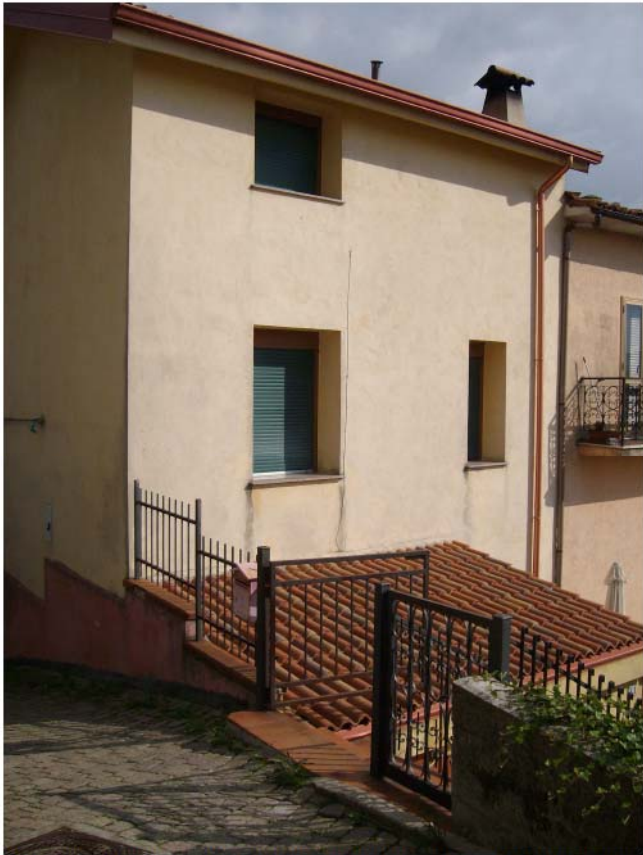
Foto n°1 – Accesso all'u.i. sita in Colosimi (CS) Fg. n°17 p.lla n°385; vista dalla sovrastante SS108 bis;