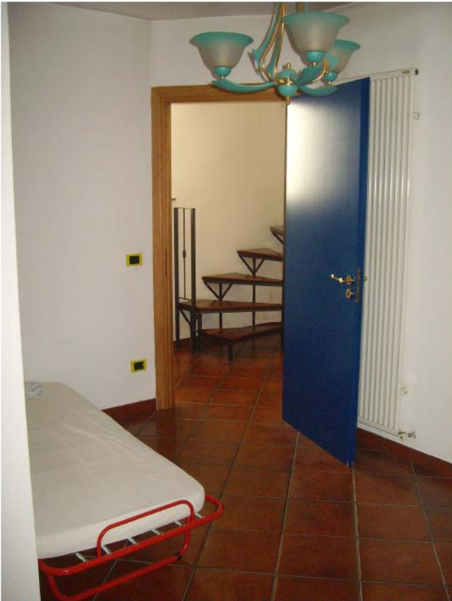
Foto n°13 - Piano Primo; stanza da letto; vista dall'interno verso la porta di accesso