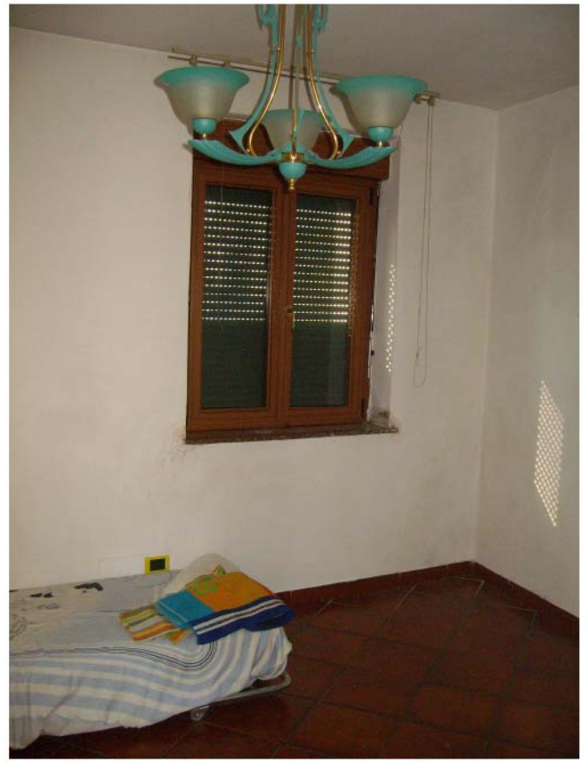
Foto n°12 – Piano Primo; stanza da letto; vista dalla porta di accesso;