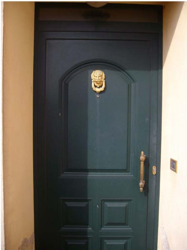
Foto n°5 –Portoncino di Ingresso dell'appartamento per civile abitazione;