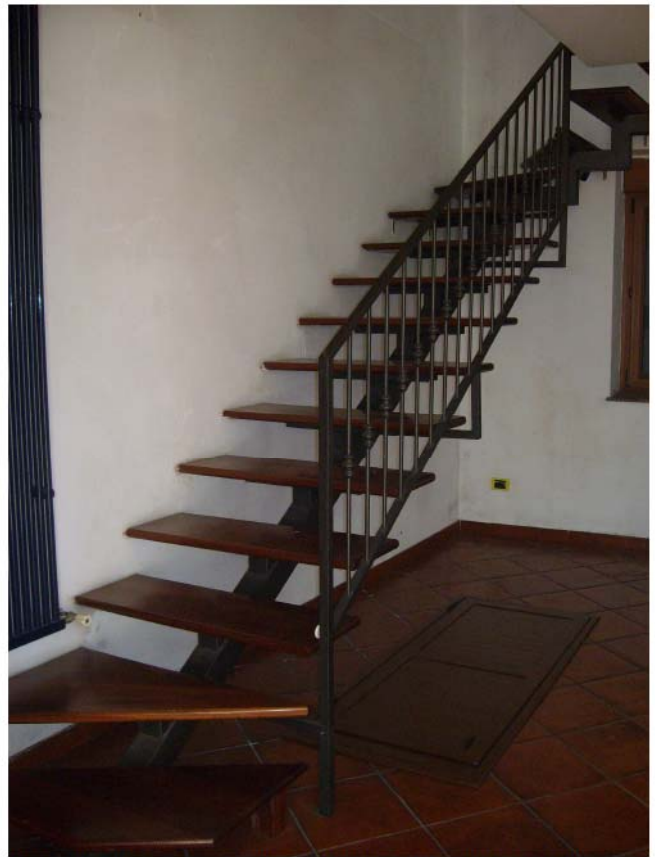
Foto n°6 –Piano Terra scala per l'accesso dal piano terra al piano primo;