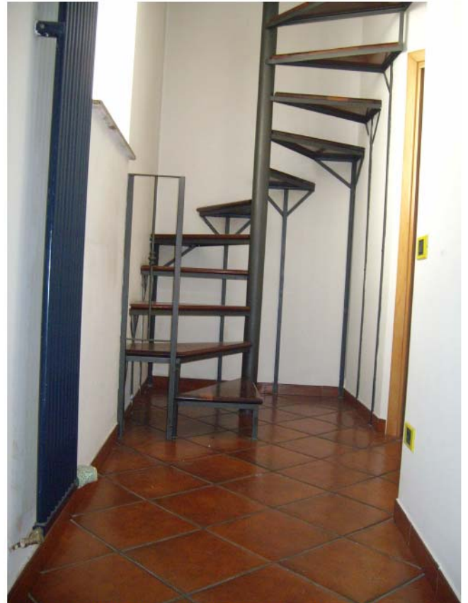
Foto n°14 - Piano primo; disimpegno con scala a chiocciola per l'accesso al piano sottotetto;