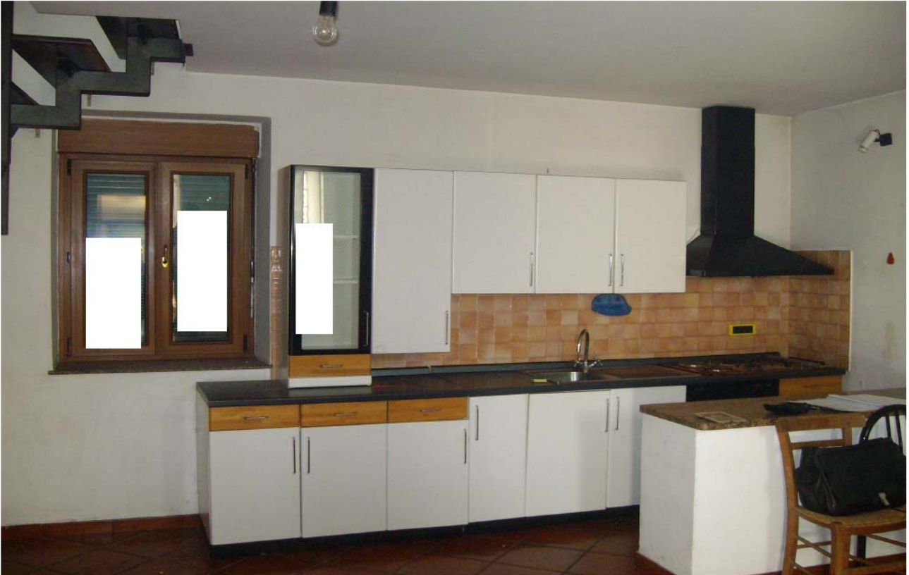
Foto n°7 – Piano Terra, vano soggiorno – pranzo; zona angolo cottura