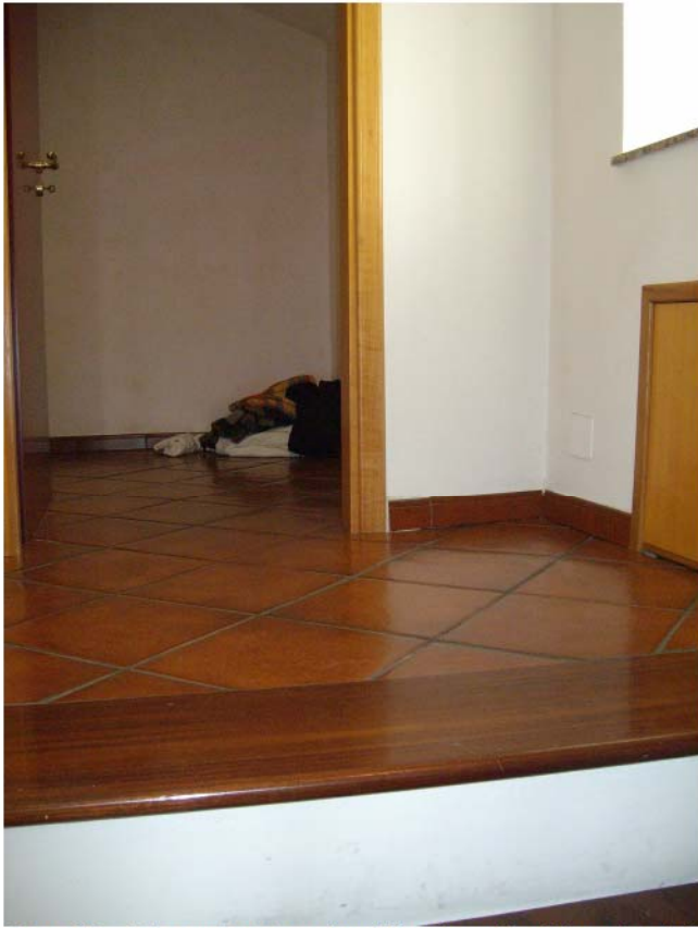
Foto n°15 – Piano sottotetto; arrivo della csia a chiocciola e vista del locale ripostiglio;