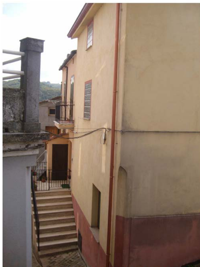
Foto n°20 – Vista dell'angolo Nord-Est del fabbricato individuato dalla particella catastale n°385 al foglio n°17.