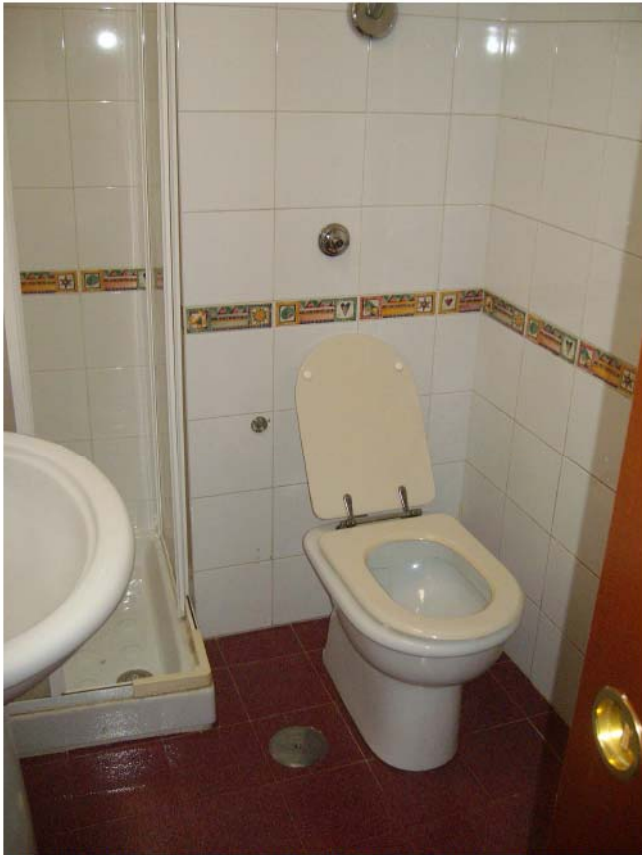
Foto n°17 -Piano sottotetto; locale WC interno alla stanza da letto;