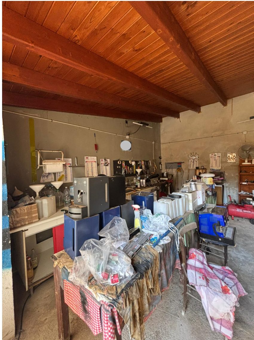
Locale di sgombero