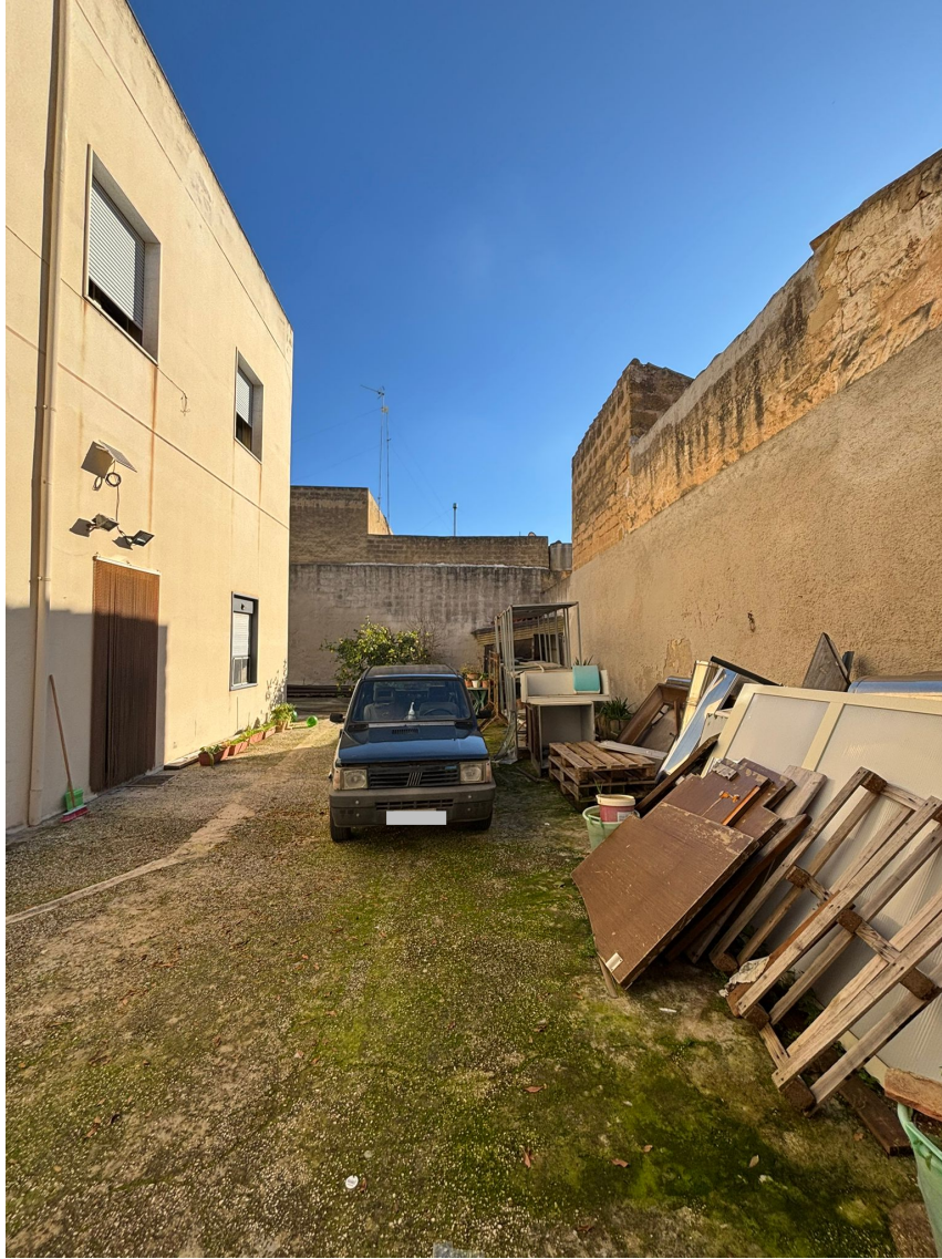
Area libera comune al magazzino e all'abitazione