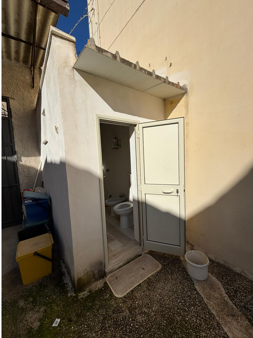
Servizio W.C. esterno