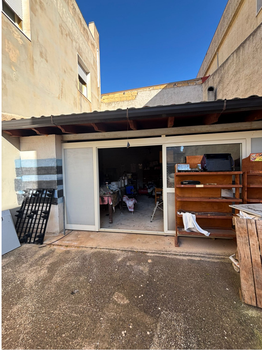
Locale di sgombero