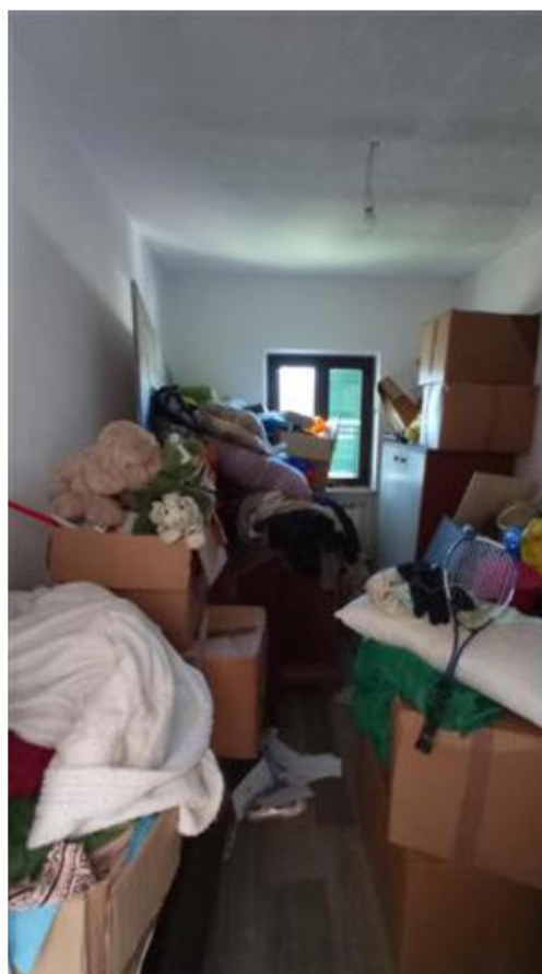
Camera singola lato ovest