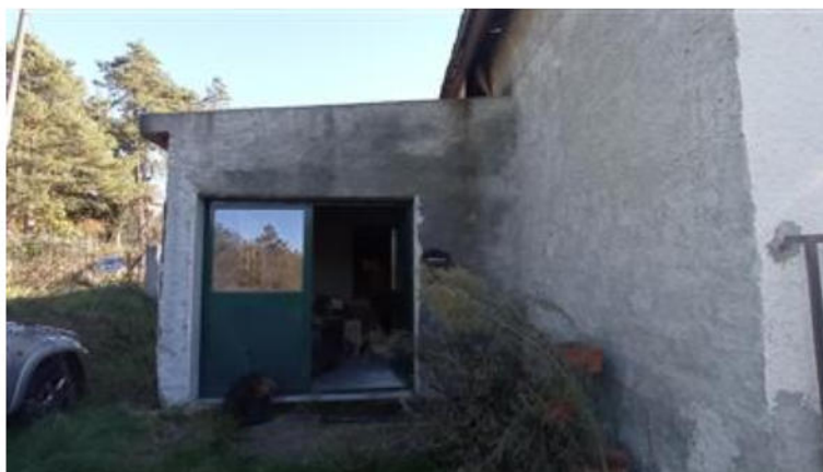
Locale deposito sul fronte nord