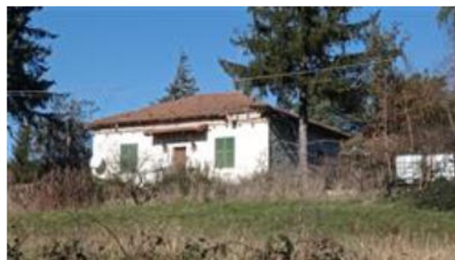
Vista della casa da Via Pianfrecioso

I beni sono ubicati in zona rurale in un'area agricola, le zone limitrofe si trovano in un'area agricola. Il traffico nella zona è locale, i parcheggi sono sufficienti. Sono inoltre presenti i servizi di urbanizzazione primaria e secondaria.