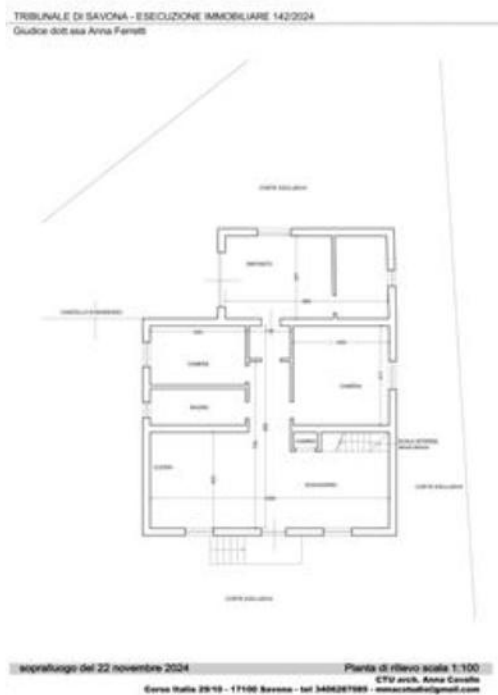
Pianta di rilievo dello stato attuale

Tempi necessari per la regolarizzazione: 1 mese