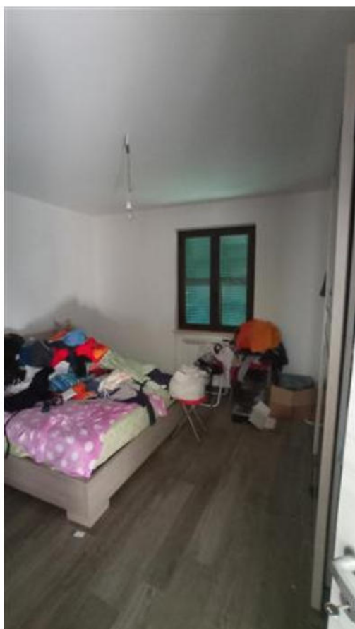
Camera matrimoniale lato est