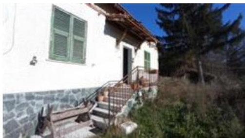
Ingresso principale della casa

L'intero edificio sviluppa un piano, 1 piano fuori terra, . Immobile ristrutturato nel 2012.