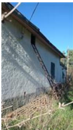
Fronte est con accesso al sottotetto