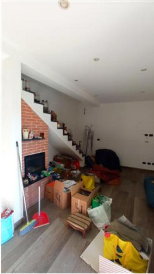
Zona giorno con la scala di collegamento al sottotetto