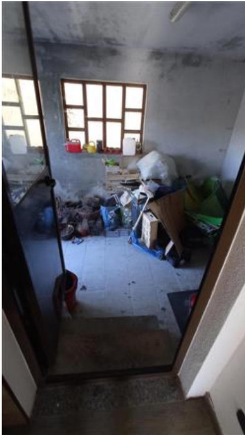
Collegamento tra la casa e il locale deposito a nord