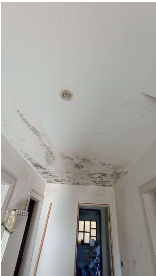
Macchie di infiltrazione sul soffitto