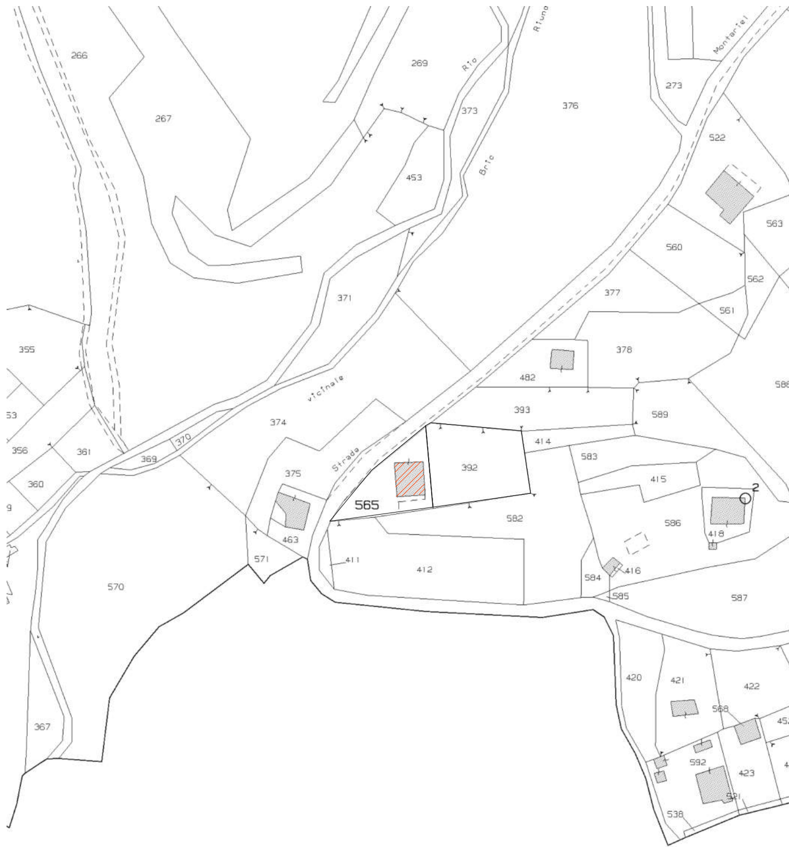
Estratto di mappa catastale Comune di Giusvalla Fg. 3 mappali 565, 392