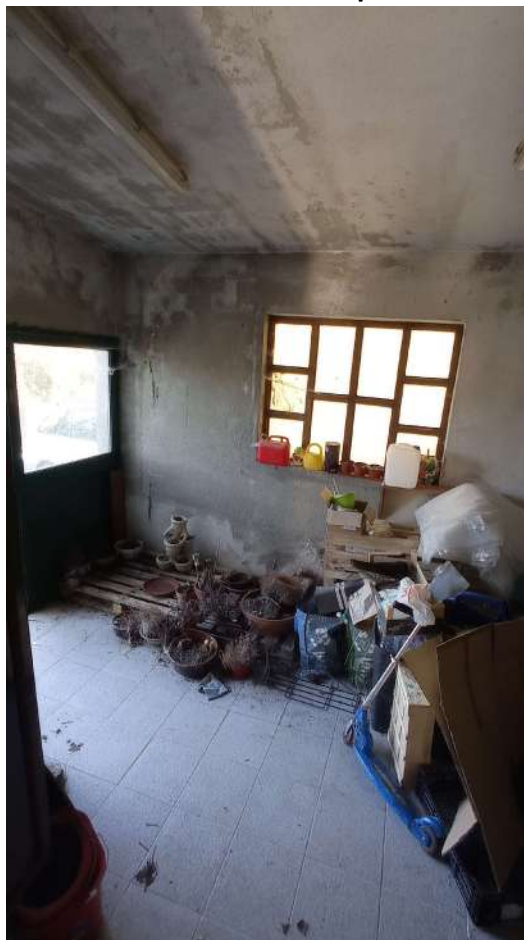
Interno del locale di deposito