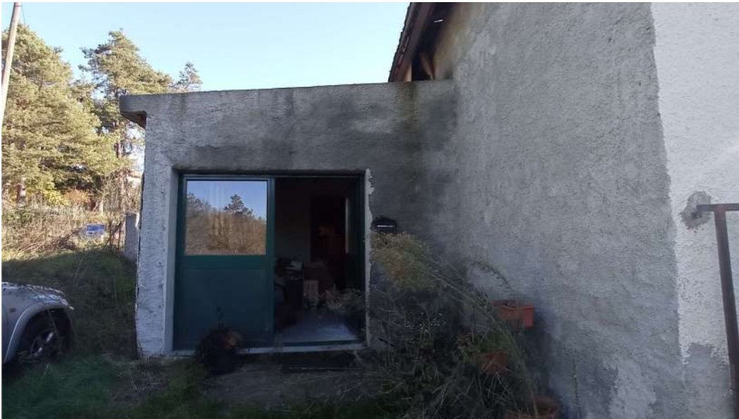
Accesso al locale deposito