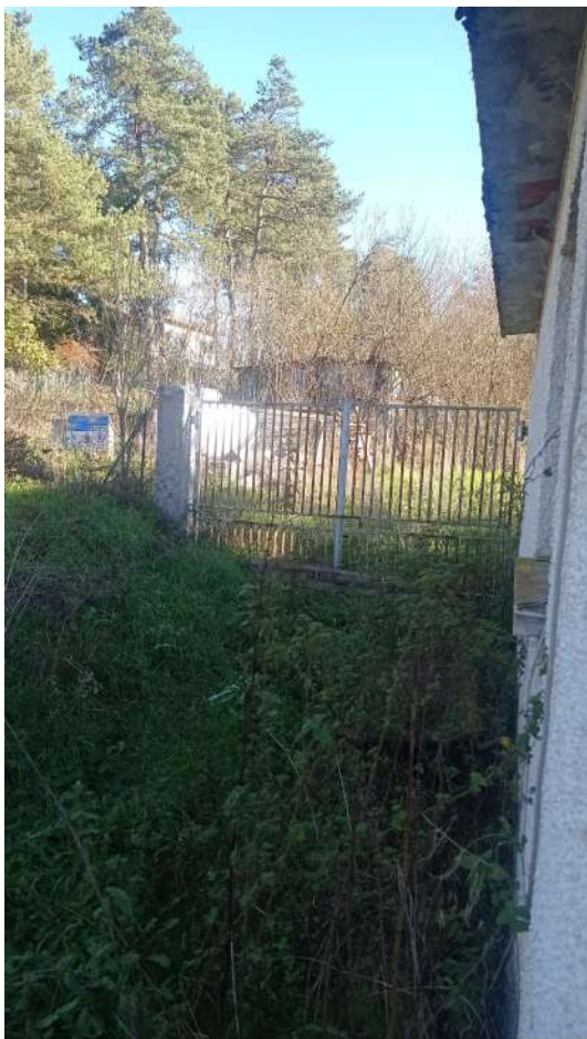
Accesso al terreno confinante