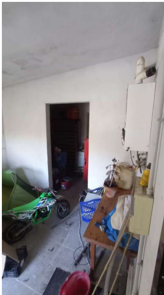
Interno del locale di deposito