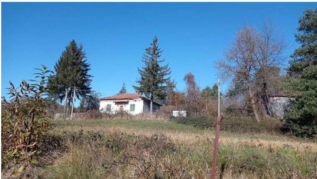
Vista della casa dalla strada