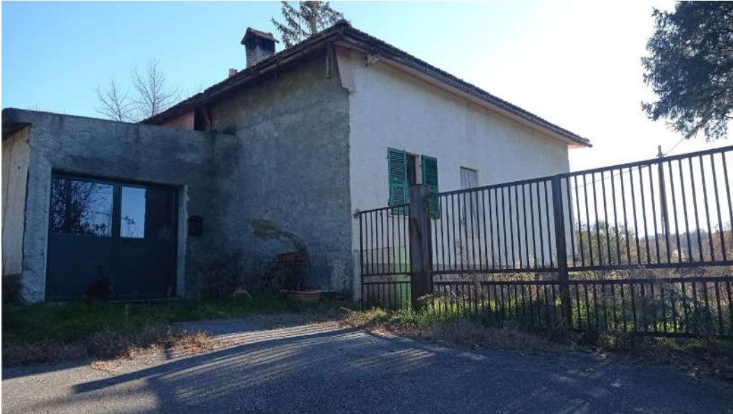
Accesso al locale deposito e cancello di ingresso alla casa