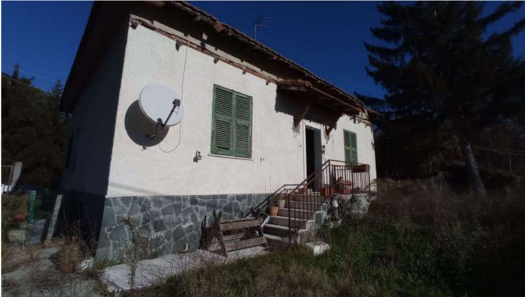
Fronte sud con ingresso all'appartamento