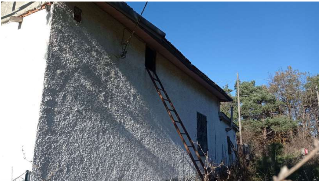
Fronte est con accesso al sottotetto