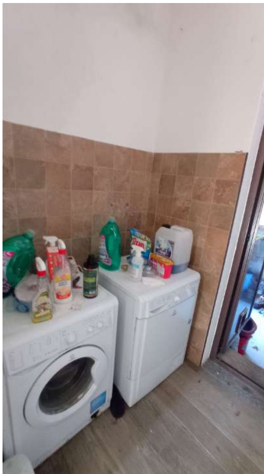
Lavanderia con collegamento al locale deposito