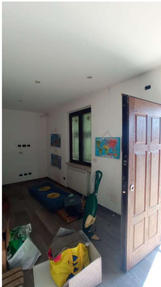
Ingresso e soggiorno