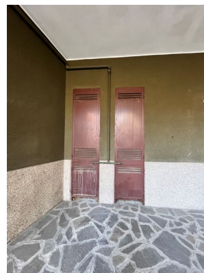
Immagini 6, 7 8 e 9. Attraverso la porta posta sul fondo del locale di ingresso, si accede ad uno spazio di servizio (bagno e ripostiglio) collegato con il cortile interno porticato. Il collegamento avviene attraverso un portoncino blindato. Dal cortile si accede ai contatori del gas.