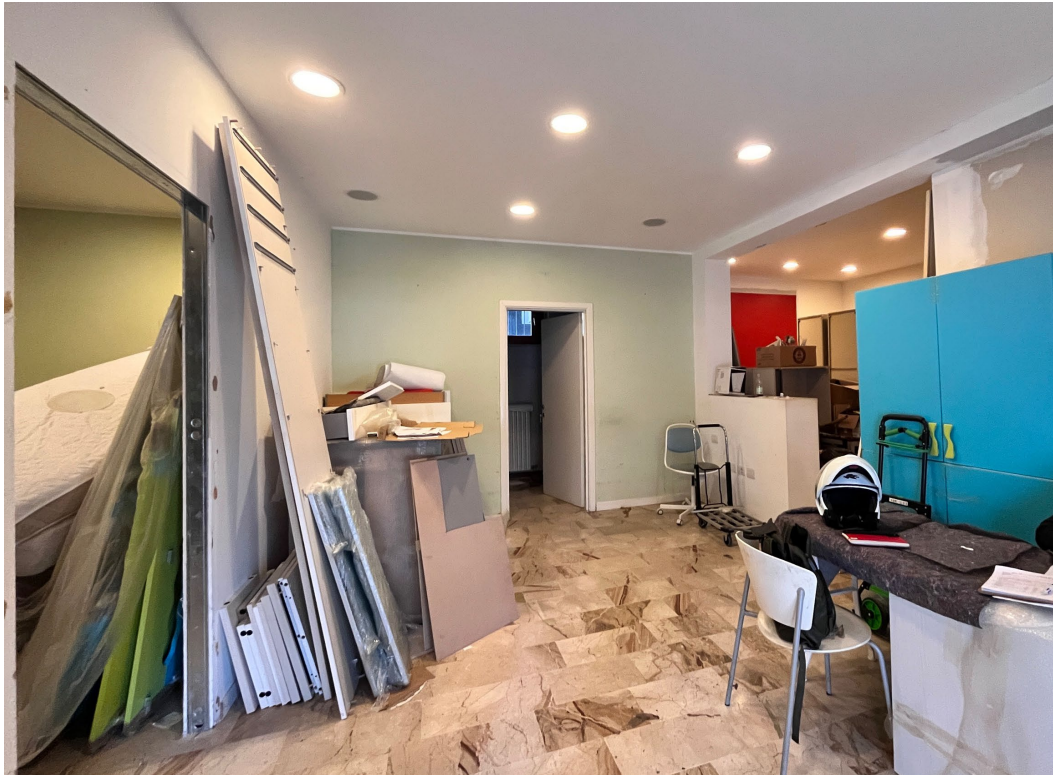
Immagine 4. Entrando, dal primo locale si accede al retro dove ha sede il bagno e che si apre anche sul cortile interno porticato retrostante e a due ulteriori spazi a sinistra e destra dello spazio di ingresso. Il locale è controsoffittato e pavimentato in pietra naturale.