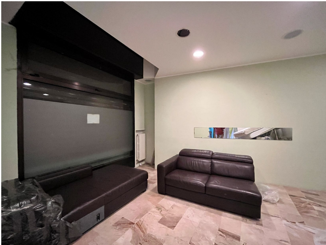
Immagini 5 e 6. Il locale a sinistra dello spazio di ingresso. Tale spazio è dotato di una verrina fissa.