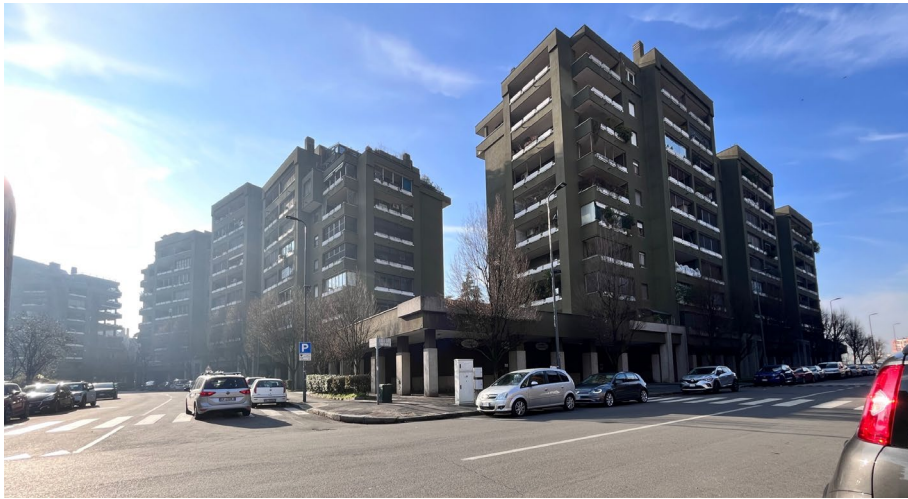
Immagine 0. Si tratta di un complesso edilizio integrato che comprende residenze e spazi commerciali al piede dell'edificio che si raccordano con la pubblica via attraverso un sistema di portici.