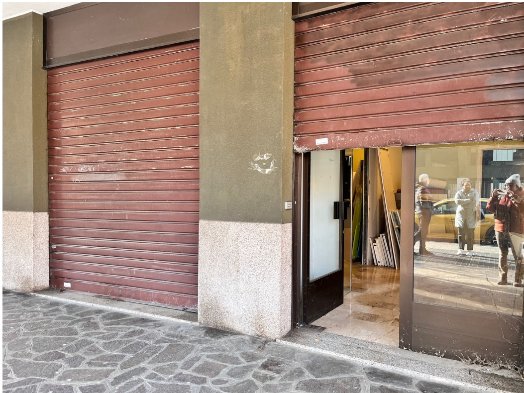
Immagine 3. Le due vetrine dell'unità di cui al Lotto 1.