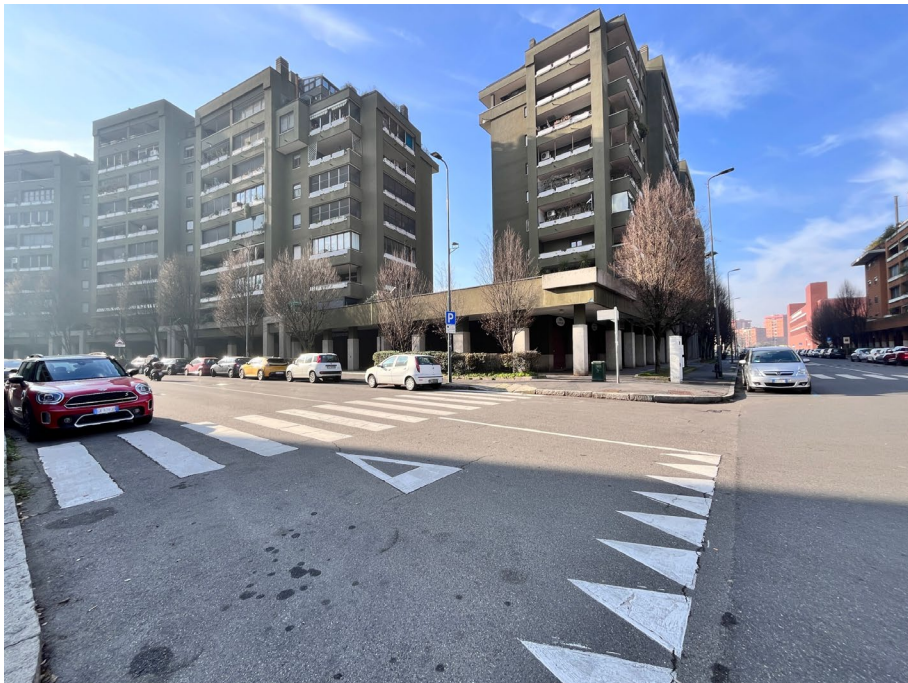
Immagine 1. Le unità oggetto di valutazione si trovano a piano terra, sono adiacenti tra loro e una delle due occupa l'angolo.