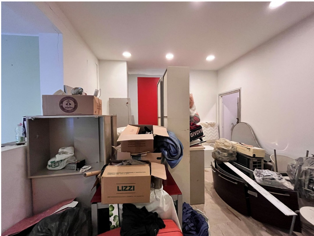
Immagini 9 e 10. Il locale a destra dell'ingresso con una sua vetrina dal quale si accede anche ad un ulteriore spazio che corrisponde alla terza vetrina.