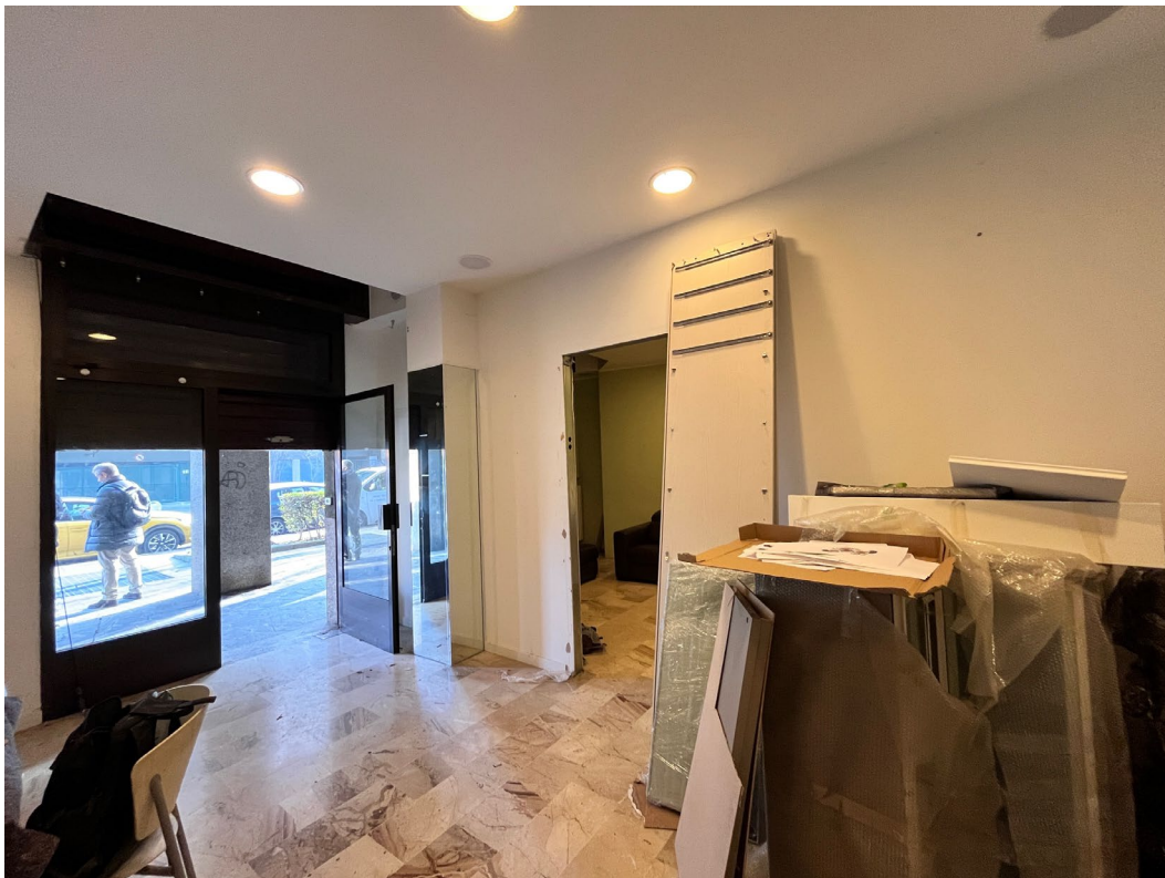
Immagine 5. Vista dall'interno verso lo spazio porticato antistante le vetrine.