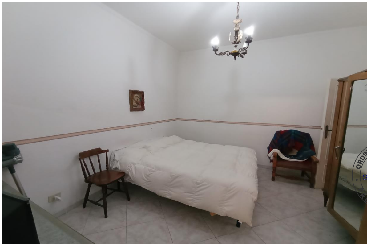
FOTO N. 6 - CAMERA DA LETTO