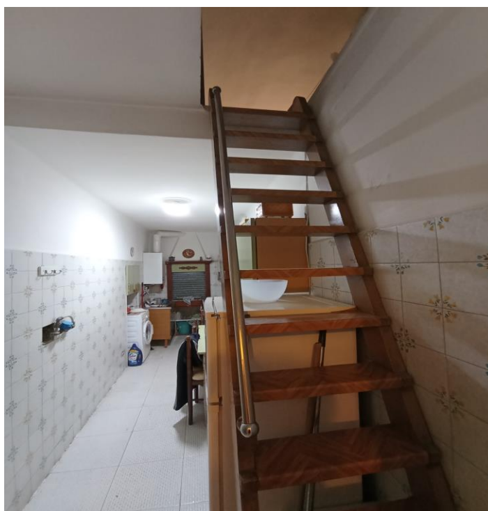
FOTO N. 11 SCALA DI ACCESSO PIANO SUP. SOFFITTA