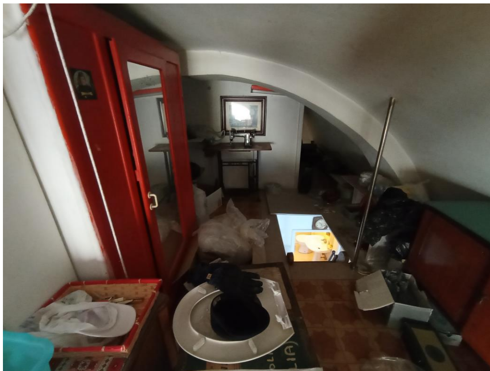
FOTO N. 15 SOFFITTA