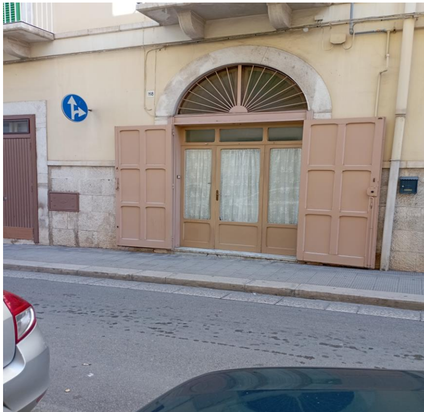
FOTO N. 4 - PORTONE INGRESSO ABITAZIONE