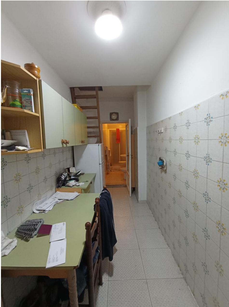
FOTO N. 7 - CUCININO