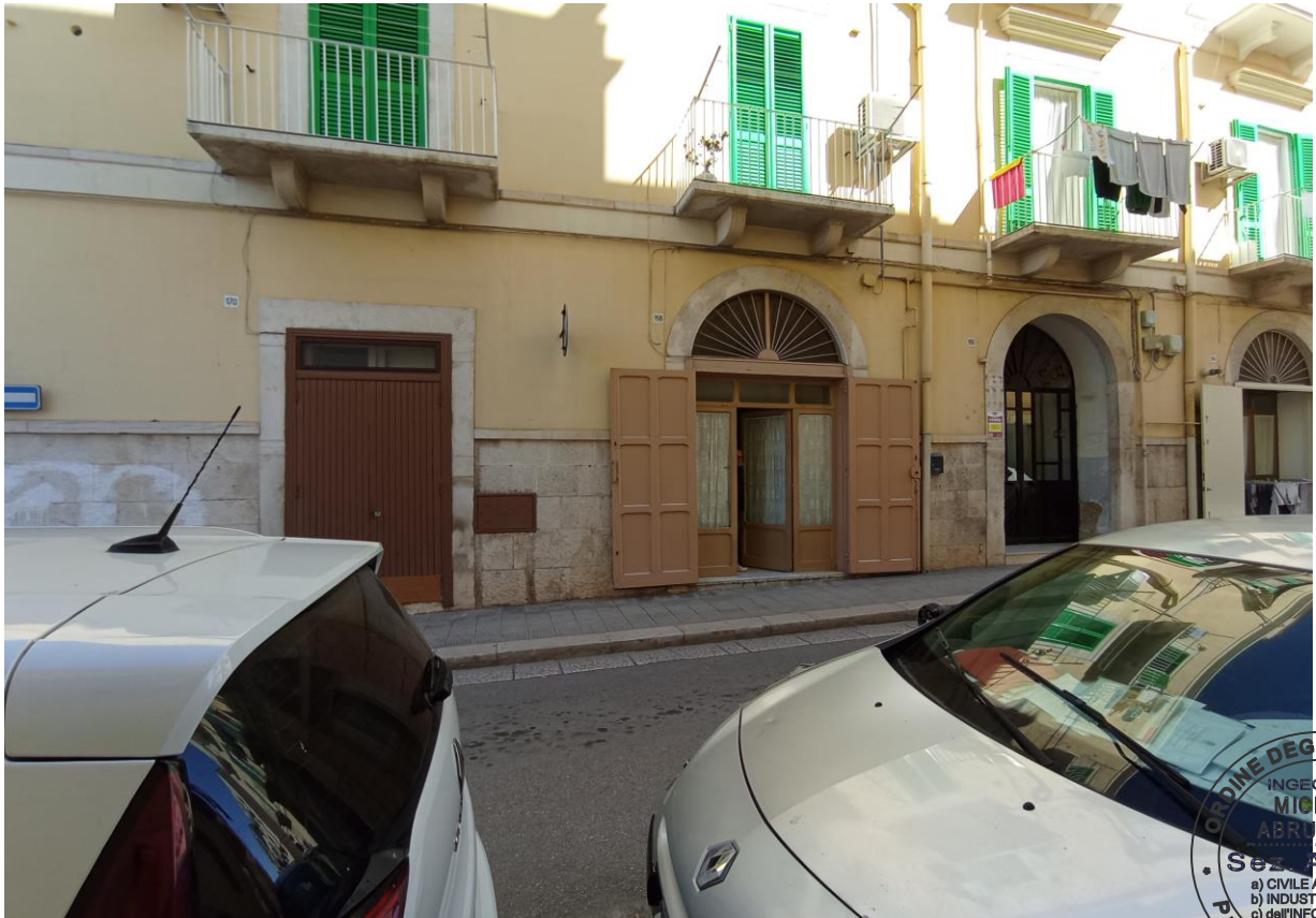
FOTO N. 3 - ABITAZIONE P.TERRA VIA ROMA N. 168