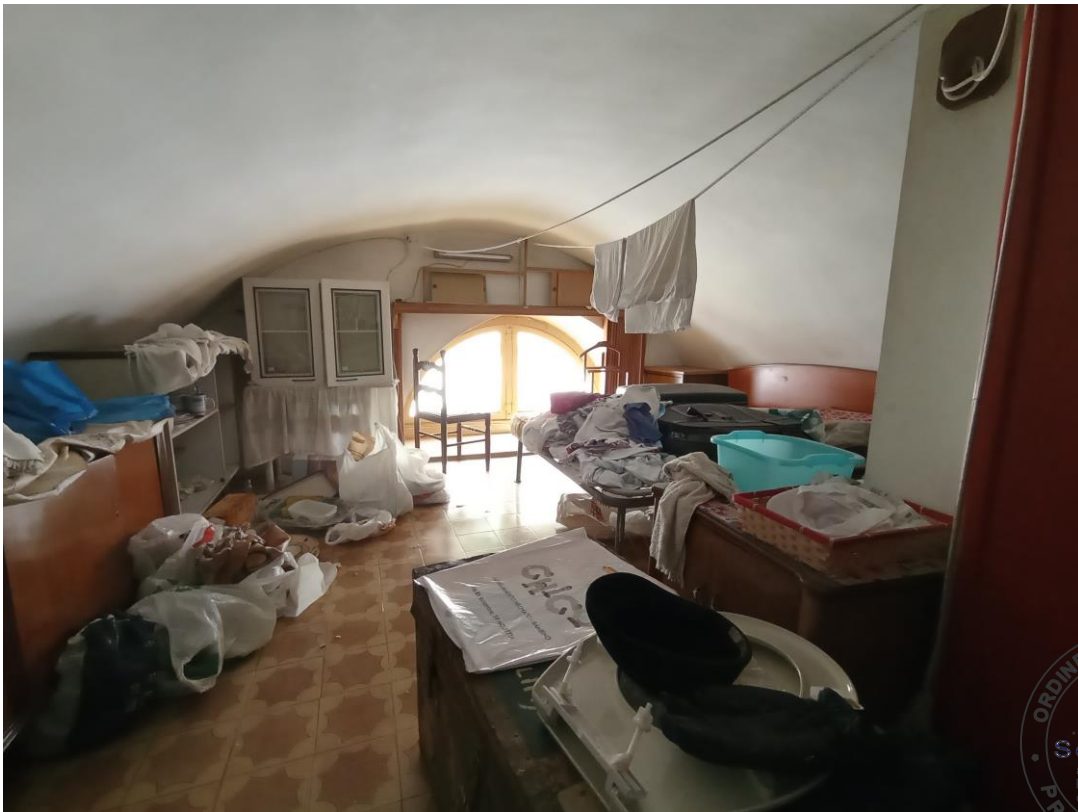
FOTO N. 13 SOFFITTA