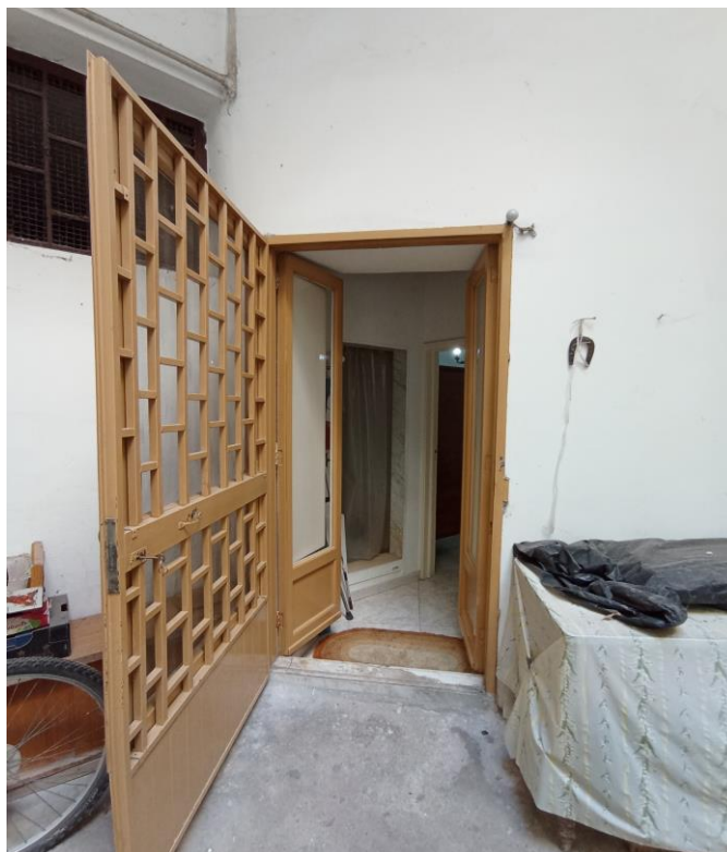
FOTO N. 9 ACCESSO AL CORTILE RETROSTANTE