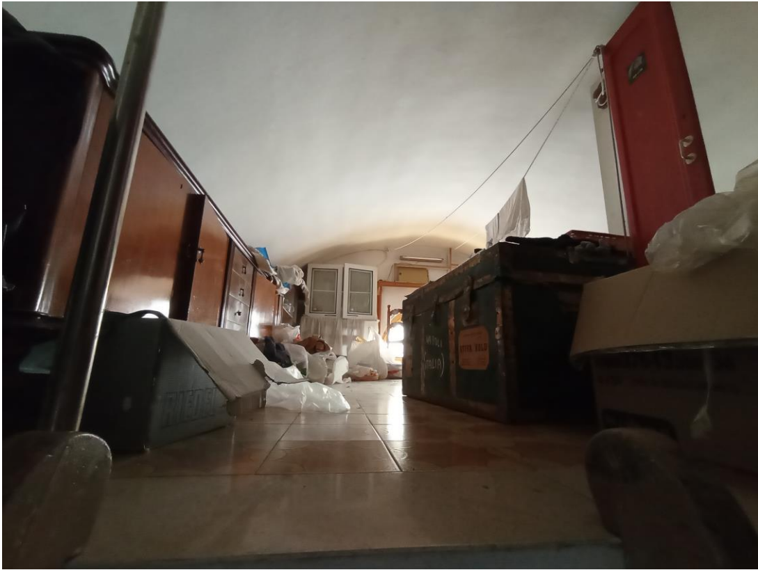
FOTO N. 12 SOFFITTA