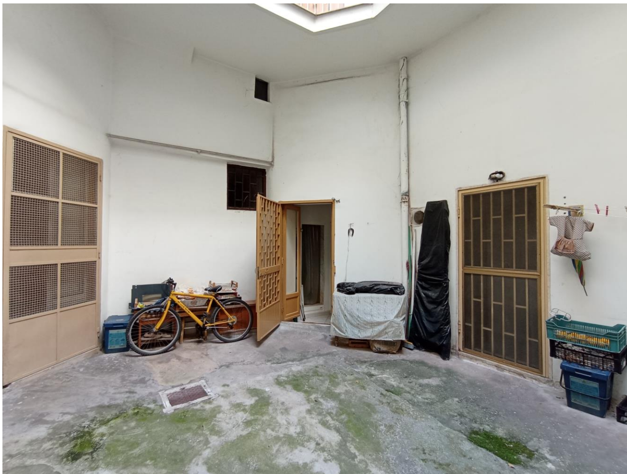
FOTO N. 10 CORTILE RETROSTANTE