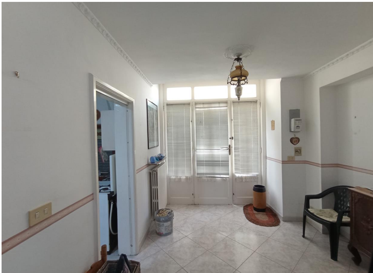
FOTO N. 5 - VANO ANTISTANTE