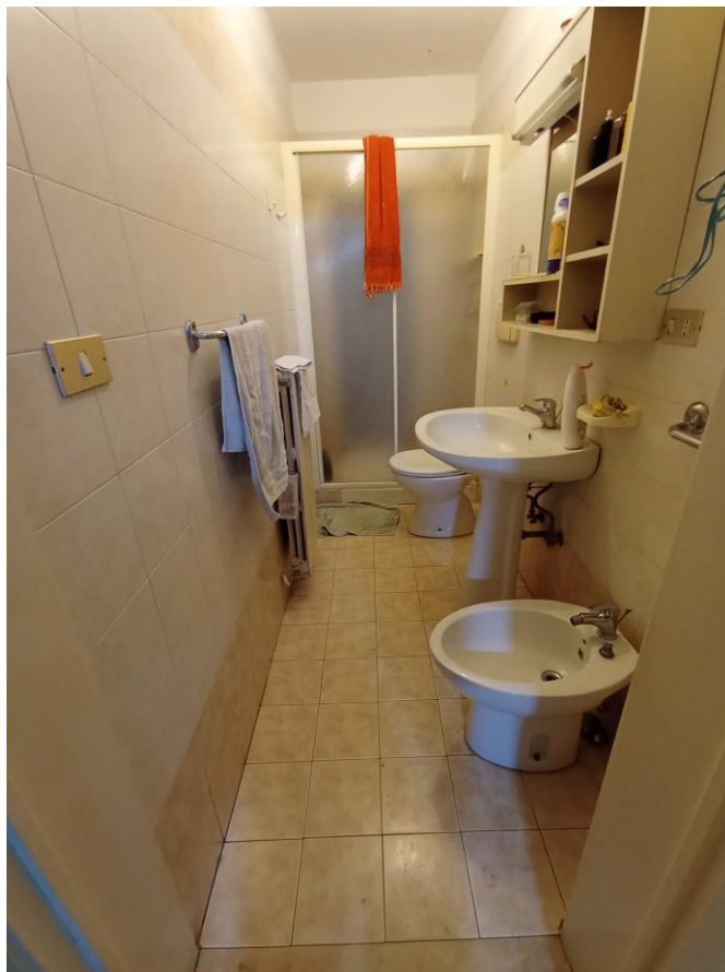
FOTO N. 8 BAGNO