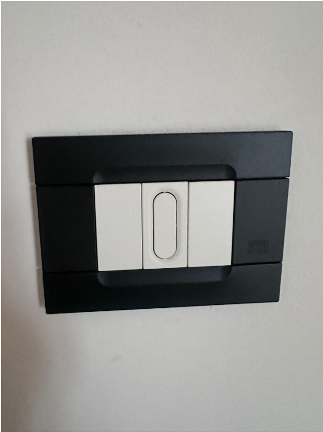
FOTO 18: Tipologia di interruttore della luce presente in tutti gli ambienti