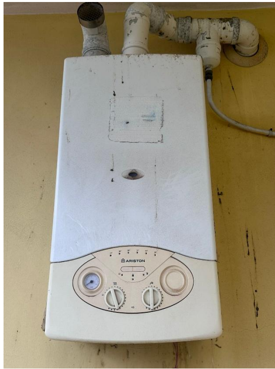
FOTO 7-8: Balcone relativo alla camera n. 1 e caldaia ivi installata.