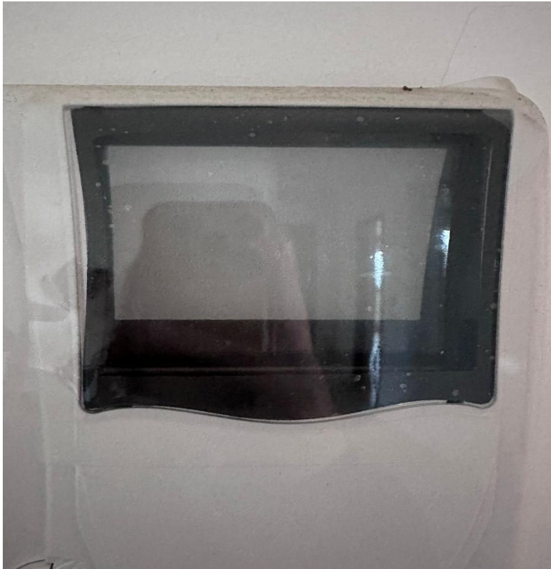
FOTO 3-4: Citofono posto sul lato sinistro della porta d'ingresso, ancora dotato di pellicola protettiva e di libretto d'uso.