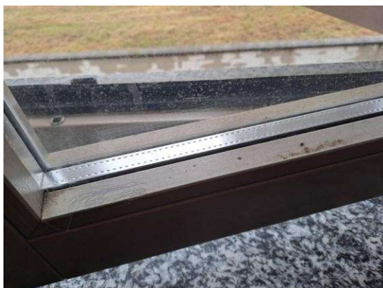
29. Dettaglio serramento esterno