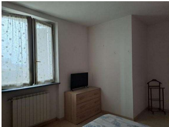
27. Camera da letto