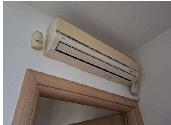
20. Particolare split di condizionamento