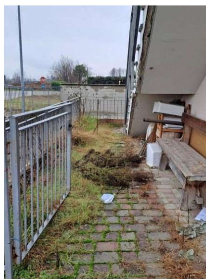
6. Vialetto di ingresso esclusivo