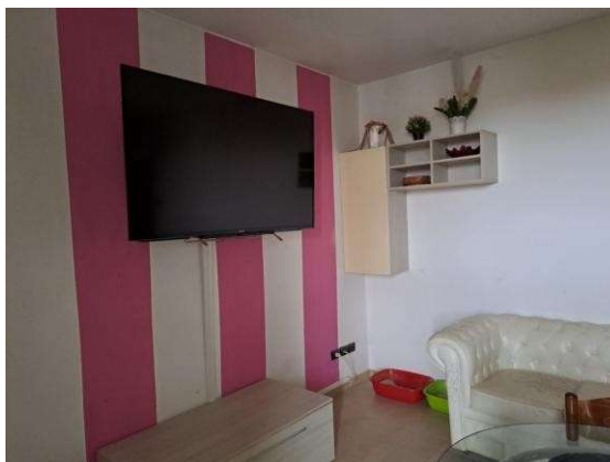
17. Zona soggiorno