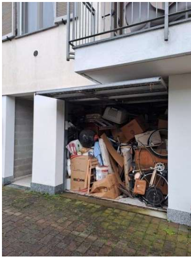
7. Box con basculante aperta