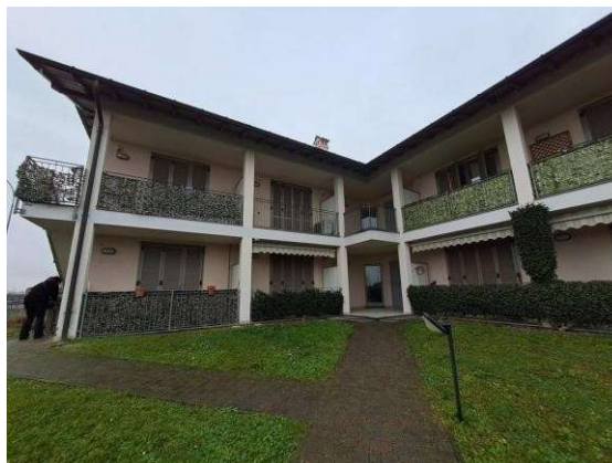
2. Panoramica del condominio