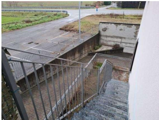
9. Vista della rampa scala