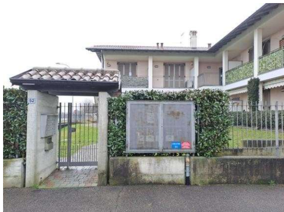
1. Ingresso al condominio