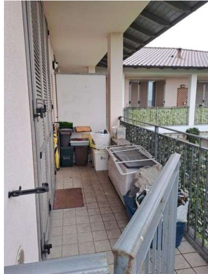
8. Ballatoio di arrivo al piano primo