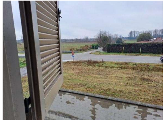
32. Veduta dalla camera