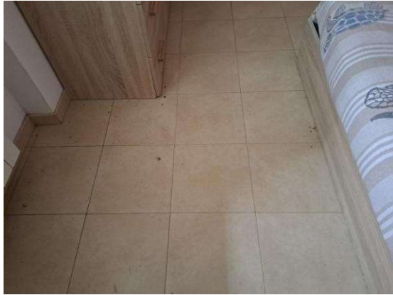
31. Dettaglio pavimento della camera