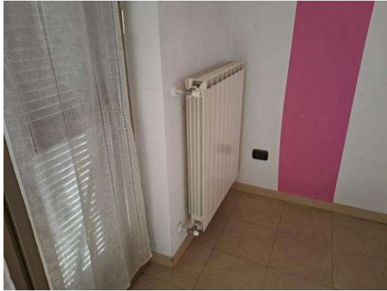
19. Particolare calorifero