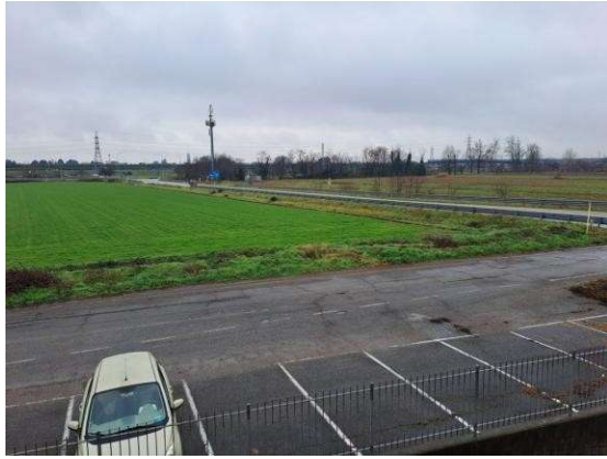
13. Vista dal ballatoio