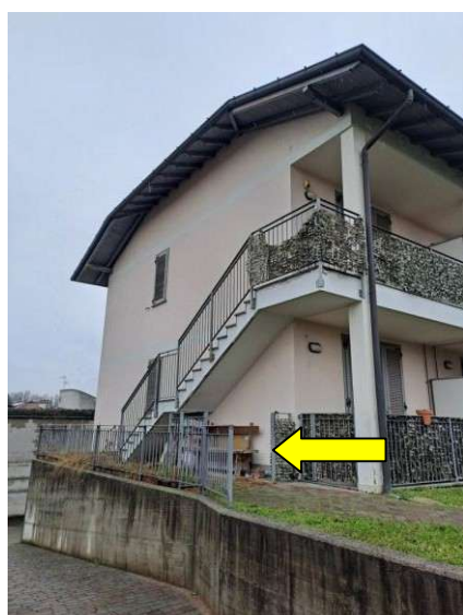
5 Prospetto laterale e ingresso esclusivo