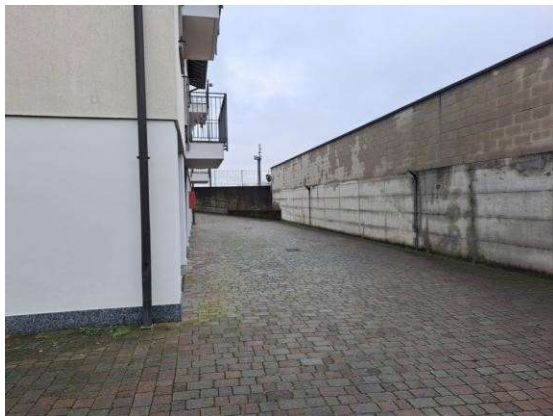
3. Corsello di manovra