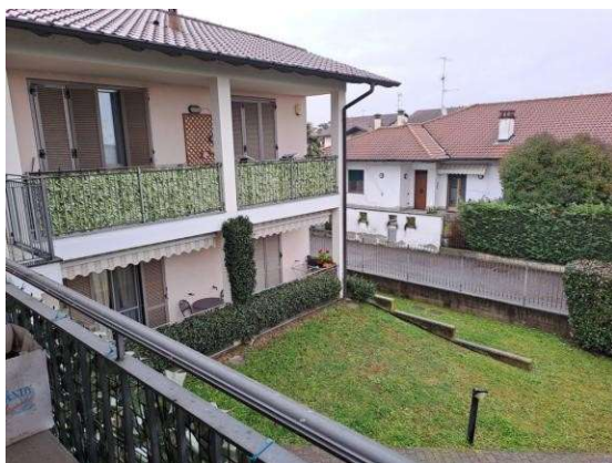
11. Vista dal ballatoio di ingresso