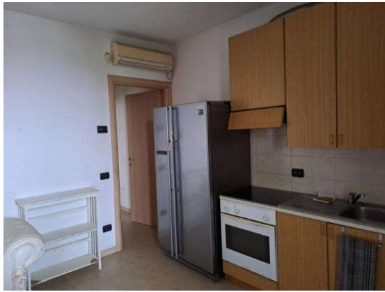
15. Zona cucina