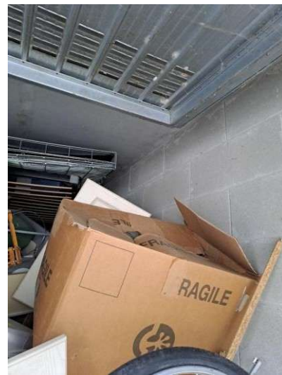
10. Interno del box