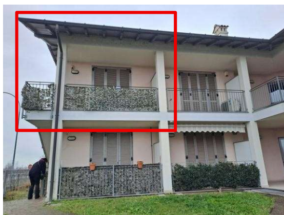
3. Prospetto esterno fronte principale