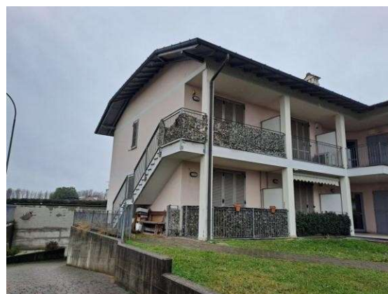
4. Panoramica con fronte laterale