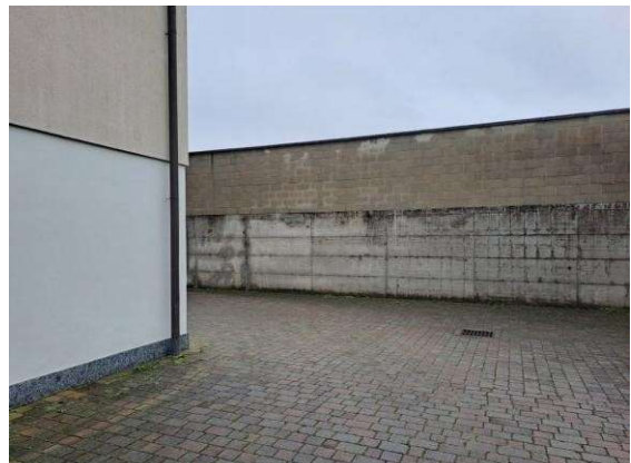
4. Corsello di manovra