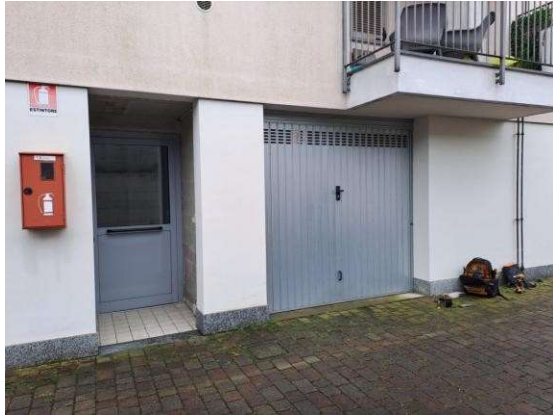
5. Vista del box dall'esterno