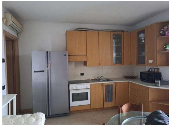
16. Zona cucina