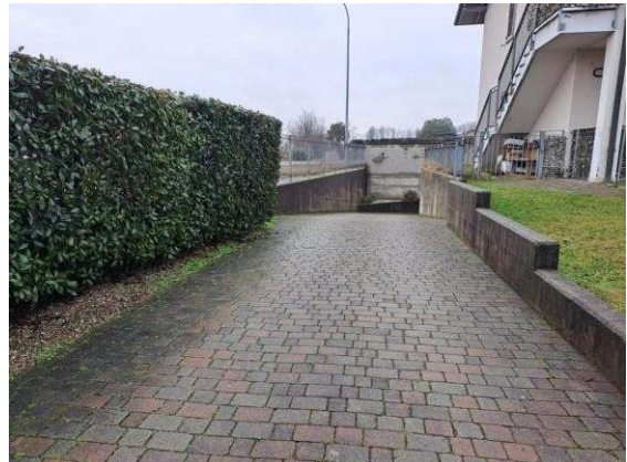
2. Ingresso carraio