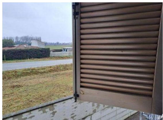
30. Persiana esterna da oscuro