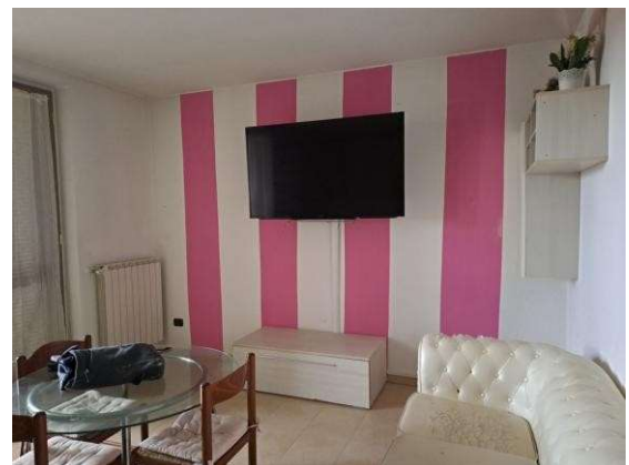
18. Zona soggiorno