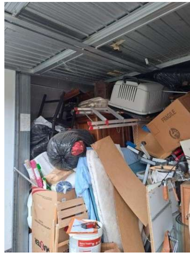
8. Interno del box