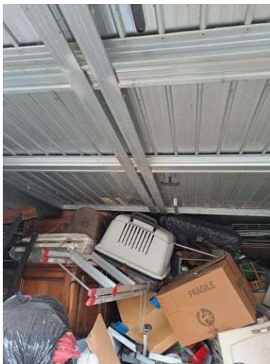
9. Interno del box