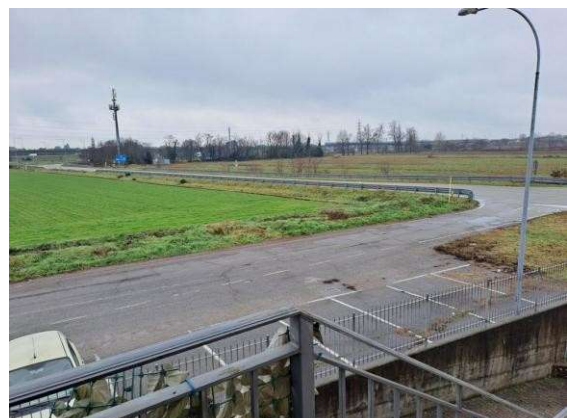
12. Vista dal ballatoio di ingresso