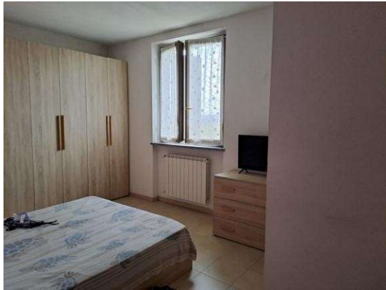
25. Camera da letto