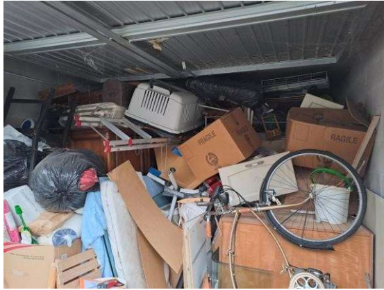
11. Interno del box