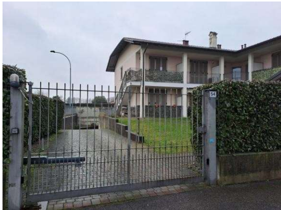
1. Ingresso carraio (dalla strada)