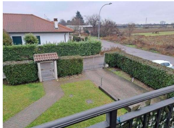
10. Vista dal ballatoio di ingresso