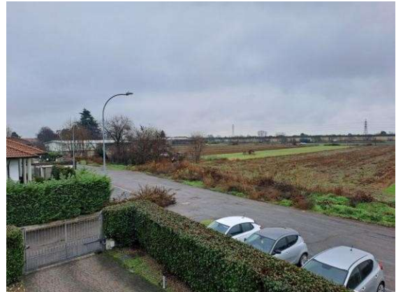
14. Vista dal ballatoio