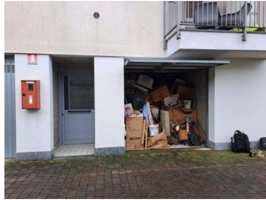
6. Box con basculante aperta