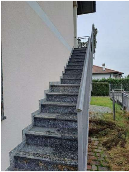
7. Scala di accesso al piano primo