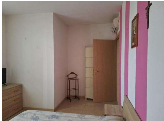
28. Camera da letto