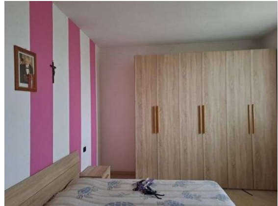
26. Camera da letto