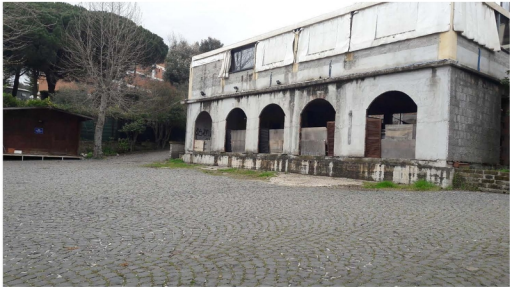
FOTO 9 -EDIFICIO B E BUNGALOW PREFABBRICATO