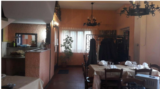
FOTO 2 – EDIFICIO A: SALA RISTORANTE VERSO L'ENTRATA AL PIANO TERRA