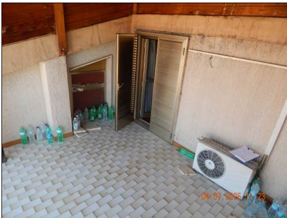
Foto 52 – Terrazzo con accesso dalla camera matrimoniale e porticina di accesso al ripostiglio esterno sottotetto