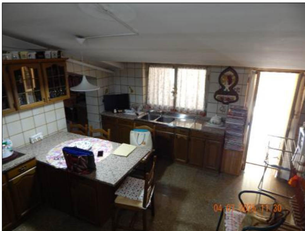
Foto 44 – Cucina con vista del balcone di uscita sul terrazzo e, a sinistra, ingresso al locale adibito a cucinino