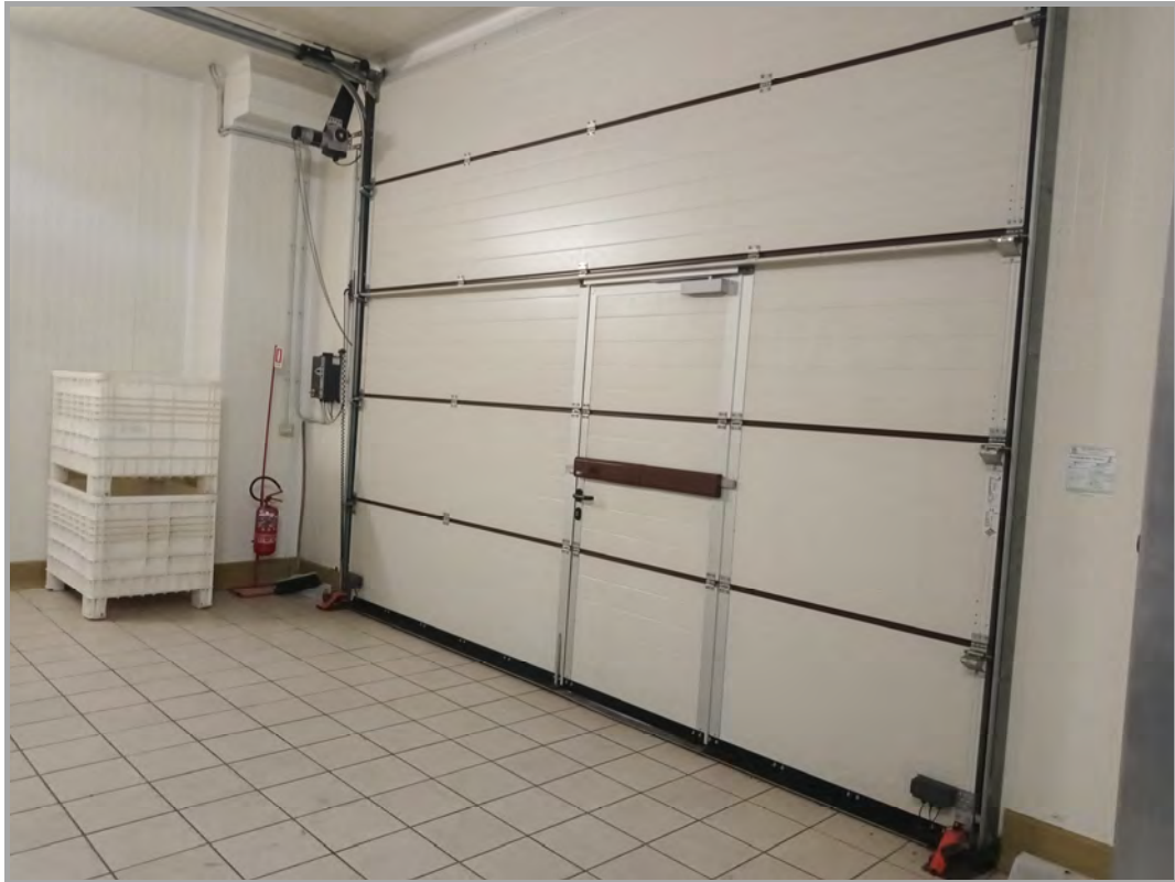
Fotografia n 20 - vista interna del sezionale di ingresso al piano terra del capannone corpo B