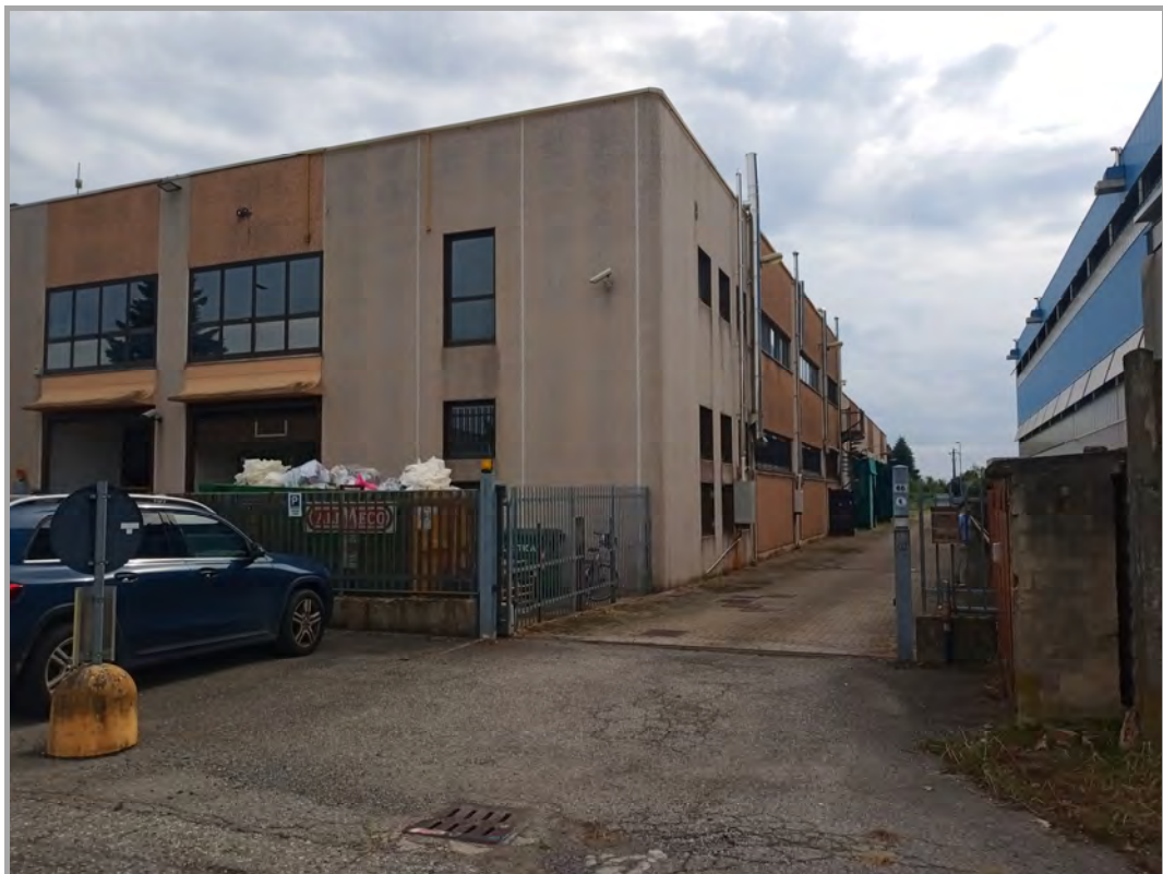
Fotografia n 3 - vista ingresso carrabile allo stabilimento produttivo dalla strada di via San Fiorano