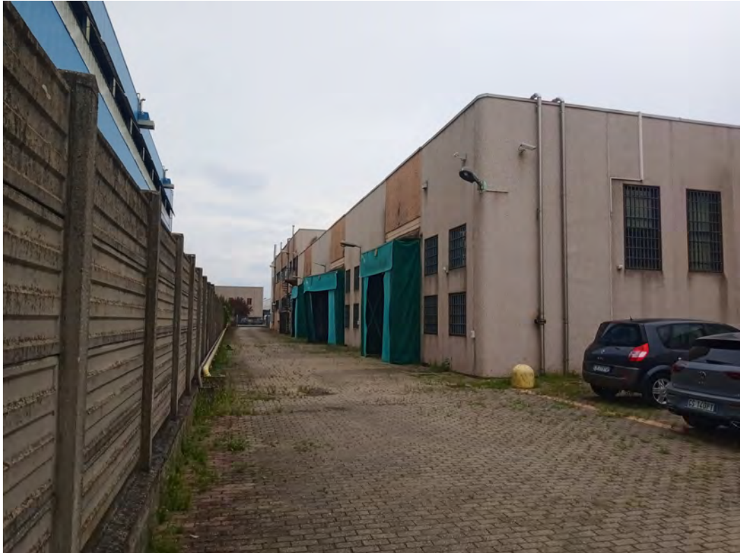
Fotografia n 30 - vista sezionali di ingresso al capannone corpo A