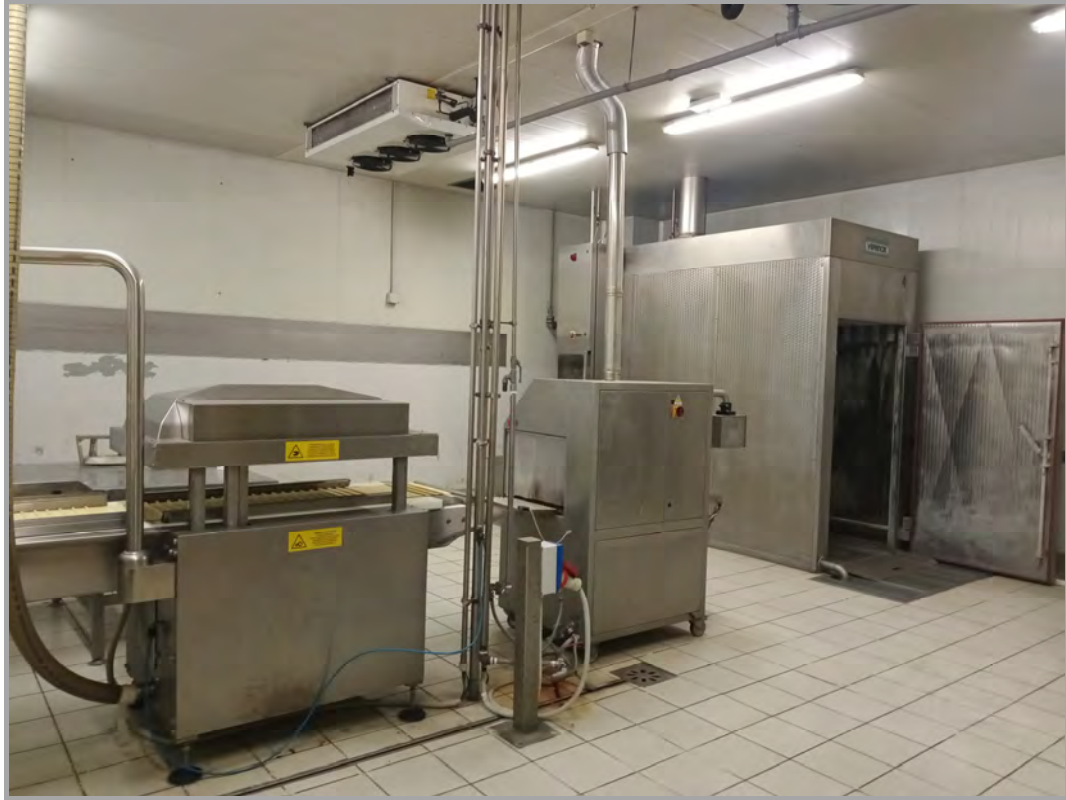
Fotografia n 36 - vista interna attrezzature impianti al blocco del capannone A (subalterno 5 mappale 84)