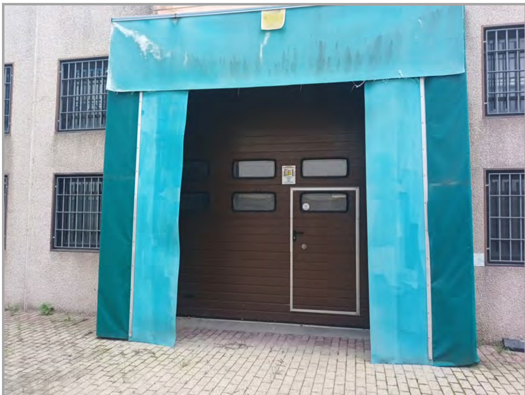
Fotografia n 31 - vista sezionale di ingresso al blocco del capannone A (subalterno 5 mappale 84)