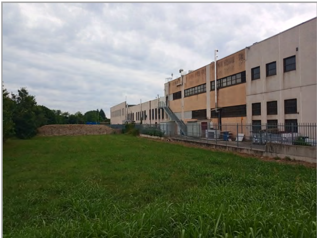
Fotografia n 11 - vista lato est dell'intero comparto produttivo con i capannoni di cui ai mappali 484-84 (quest'ultimo parte Alimeco e parte altra proprietà)