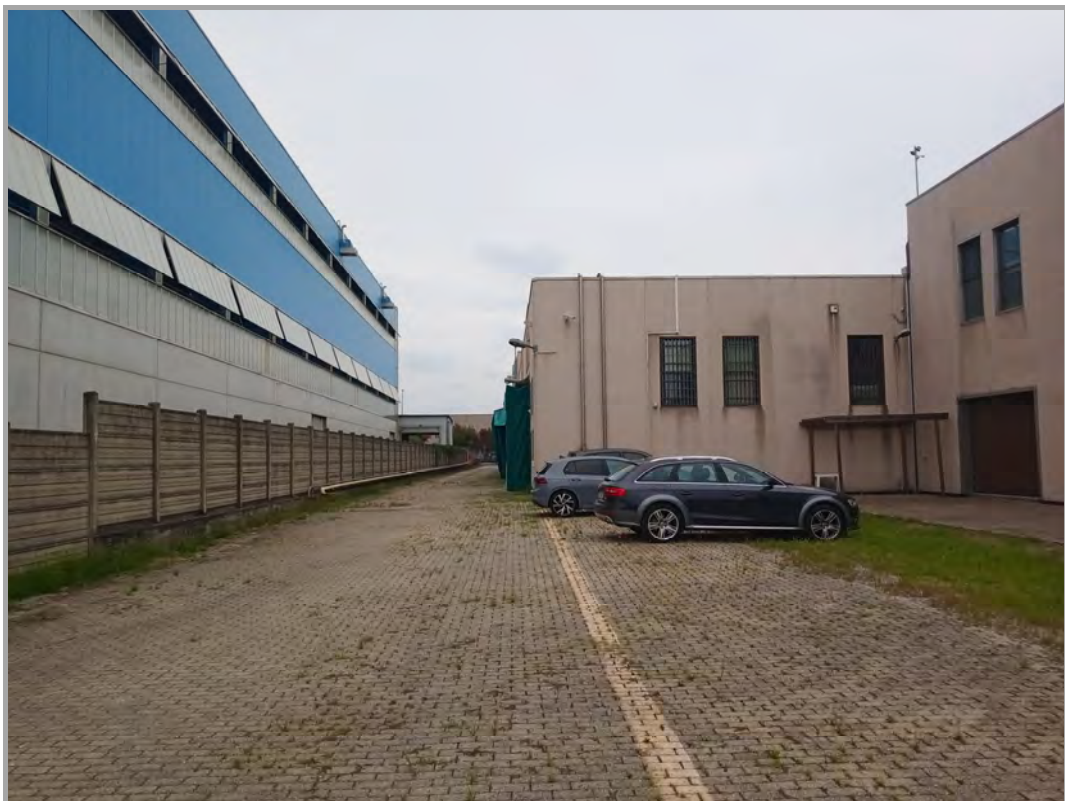
Fotografia n 5 - vista dell'area interna cortilizia con corpo A (frontale) e corpo B (laterale dx)