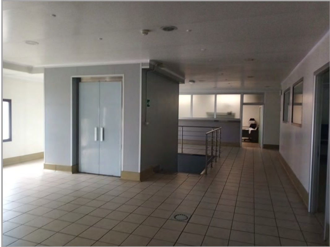
Fotografia n 24 - vista interna dello sbarco al piano primo del blocco scale/ascensore del capannone corpo B