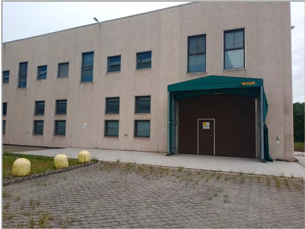
Fotografia n 14 - vista ingresso al piano terra del capannone corpo B