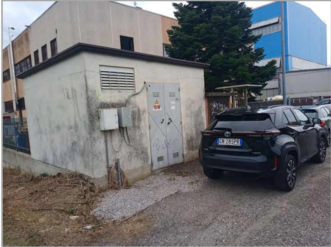
Fotografia n 12 - vista della cabina Enel di proprietà comune ai fabbricati di tutto il mappale 84