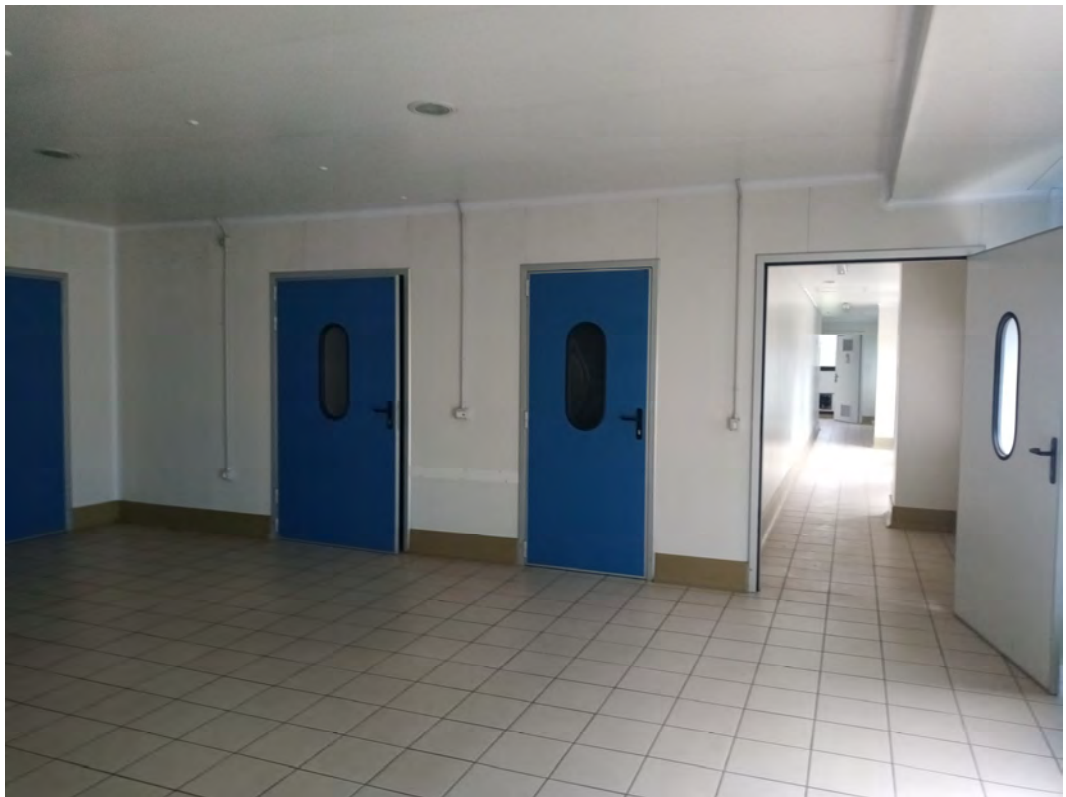
Fotografia n 25 - vista interna della zona di accesso ai locali tecnici e laboratorio al piano primo del capannone corpo B