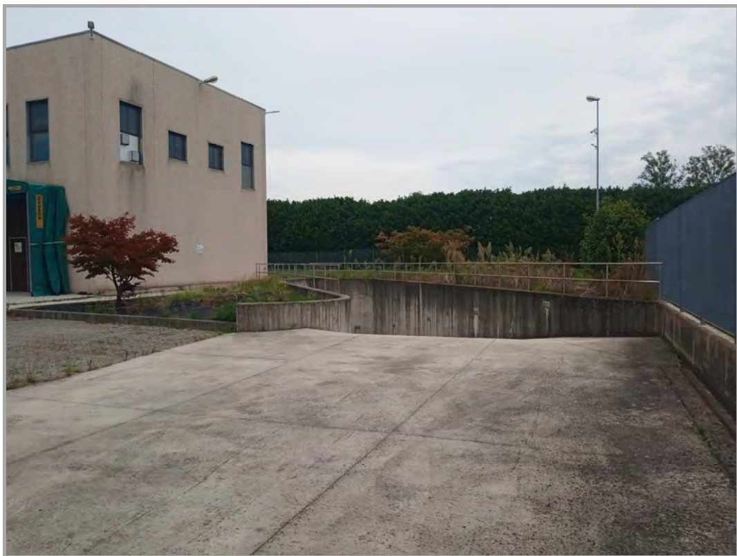
Fotografia n 7 - vista iniziale della rampa carrabile di accesso al piano interrato dell'edificio corpo B