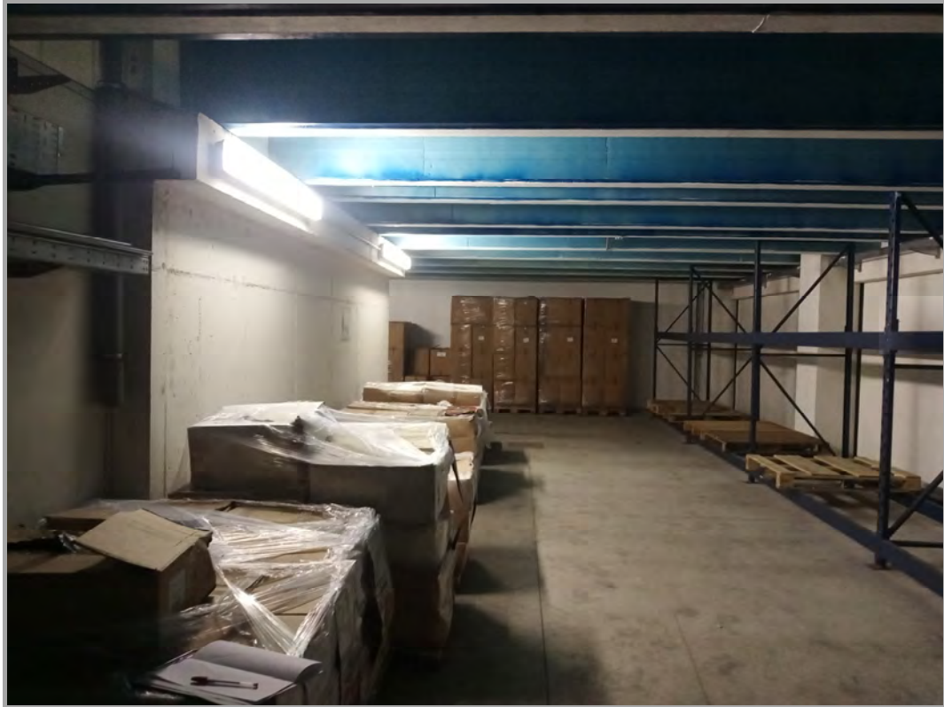
Fotografia n 18 - vista interna a piano interrato del capannone corpo B