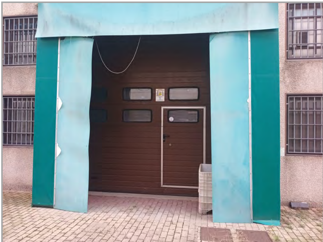
Fotografia n 33 - vista sezionale di ingresso al blocco del capannone A (subalterno 3 mappale 84)