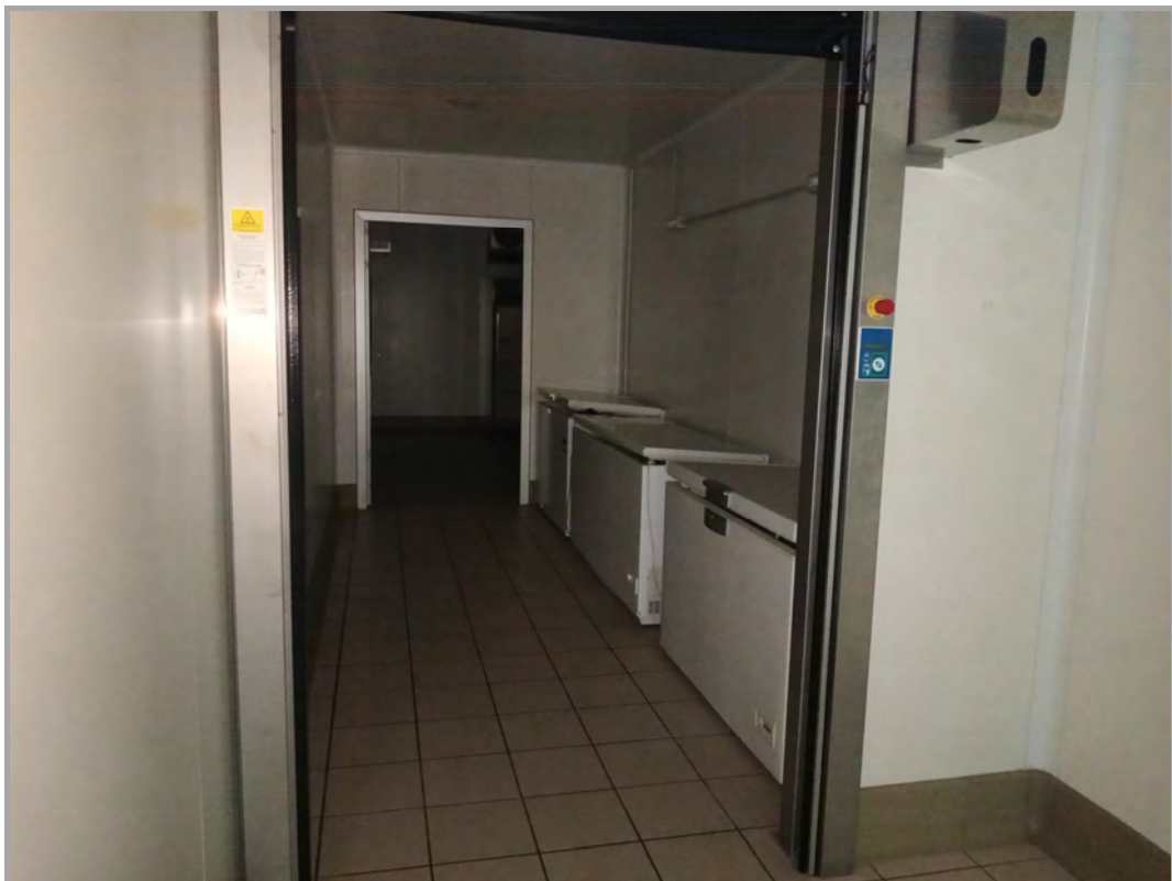
Fotografia n 27 - vista interna della zona cella frigo al piano primo del capannone corpo B