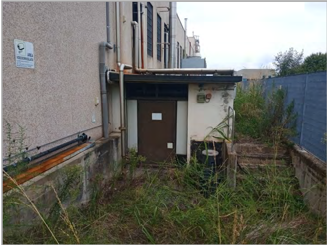
Fotografia n 10 - vista del volume accessorio per impianti serventi i capannoni