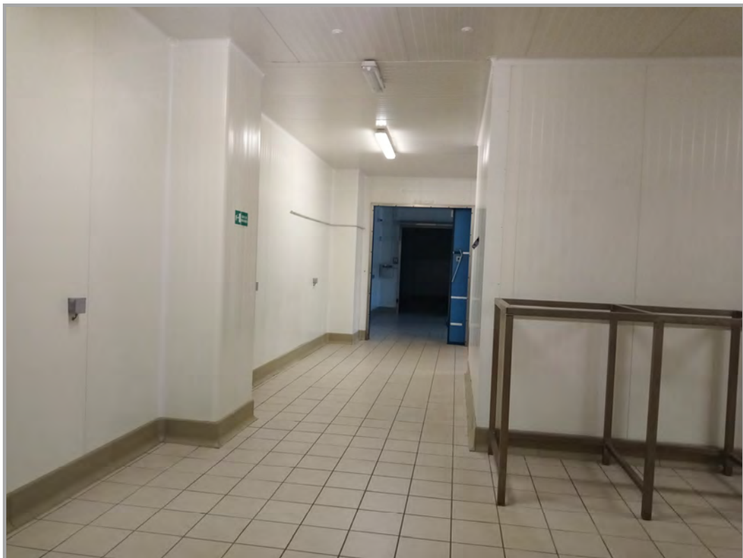
Fotografia n 37 - vista interna del collegamento capannone corpo A con il capannone corpo B