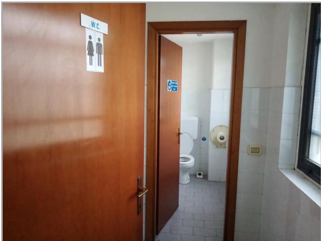
Fotografia n 35 - vista interna servizi igienici al blocco del capannone A (subalterno 5 mappale 84)