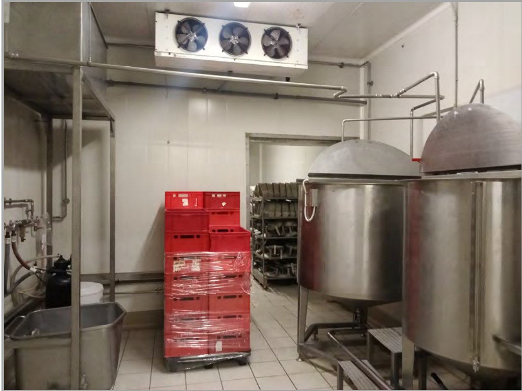
Fotografia n 40 - vista interna attrezzature impianti al blocco del capannone A (subalterno 4 mappale 84)