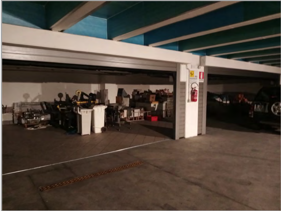
Fotografia n 16 - vista interna a piano interrato del capannone corpo B