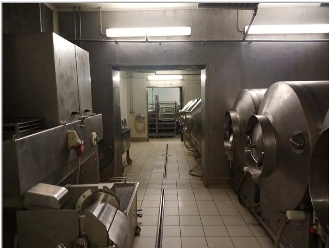
Fotografia n 41 - vista interna attrezzature impianti al blocco del capannone A (subalterno 4 mappale 84)