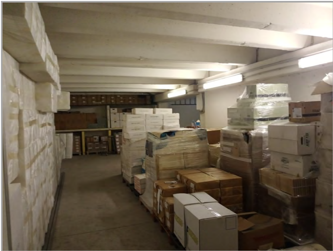
Fotografia n 19 - vista interna a piano interrato del capannone corpo B