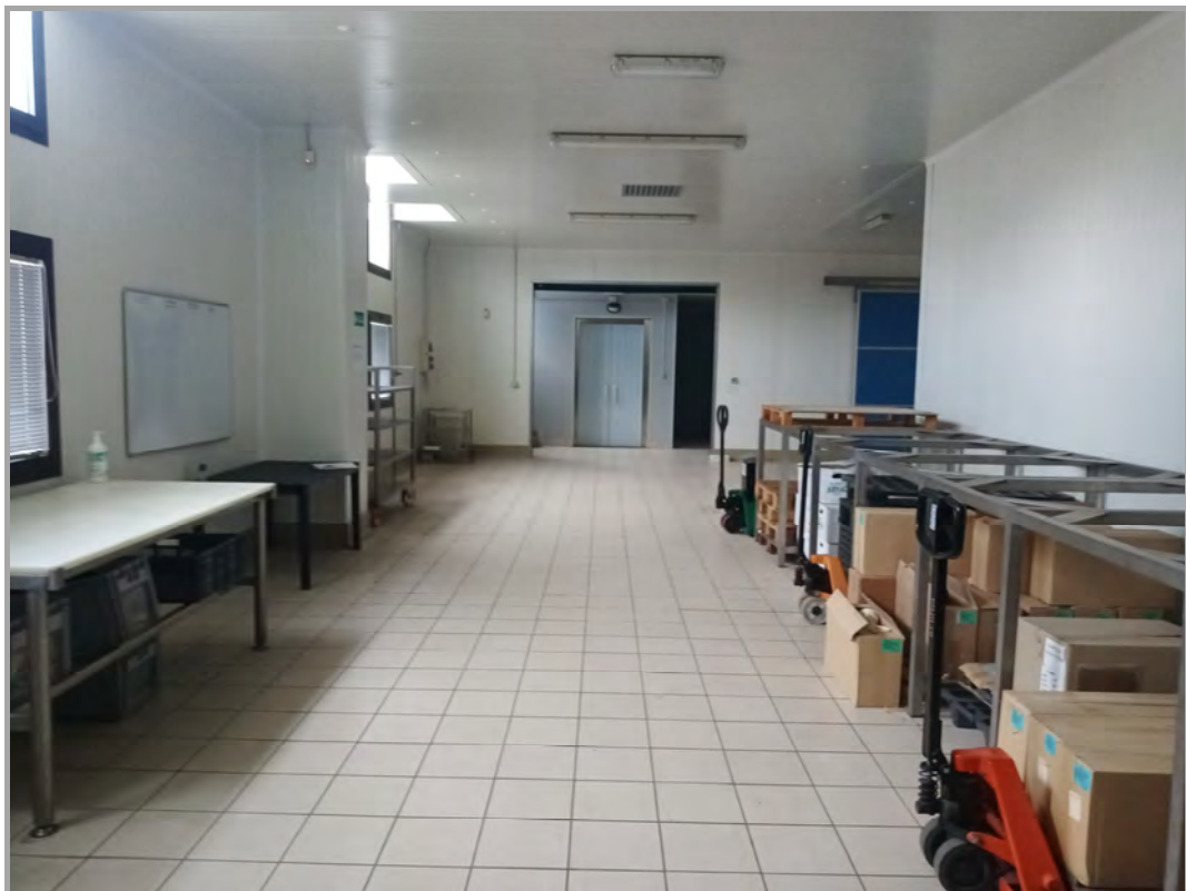
Fotografia n 21 - vista interna della zona di transito/spedizione al piano terra del capannone corpo B