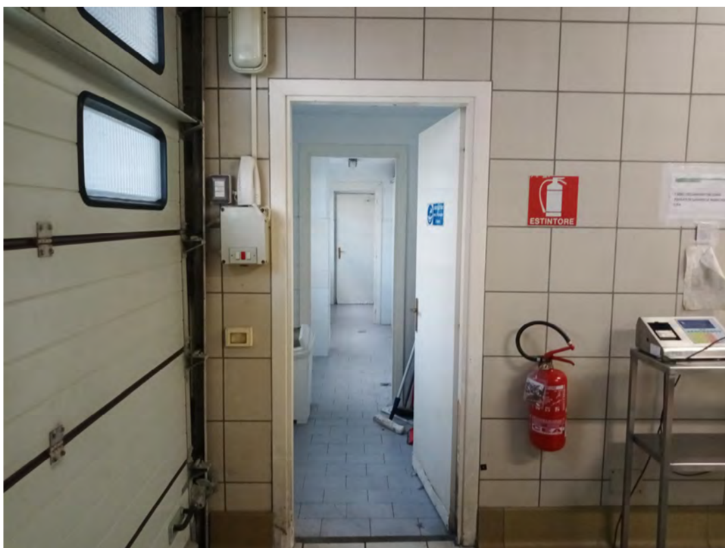
Fotografia n 39 - vista interna servizi/spogliatoi al blocco del capannone A (subalterno 4 mappale 84)