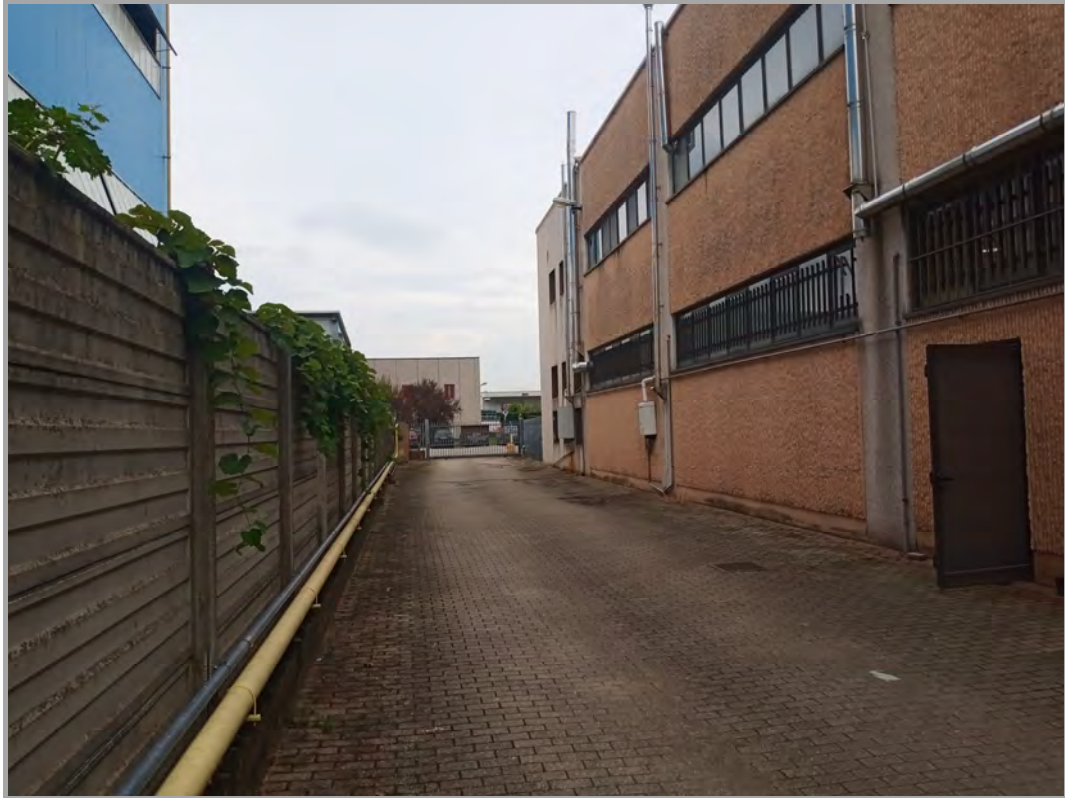
Fotografia n 4 - vista della strada interna/corsello al compendio (sulla dx la proprietà di terzi)