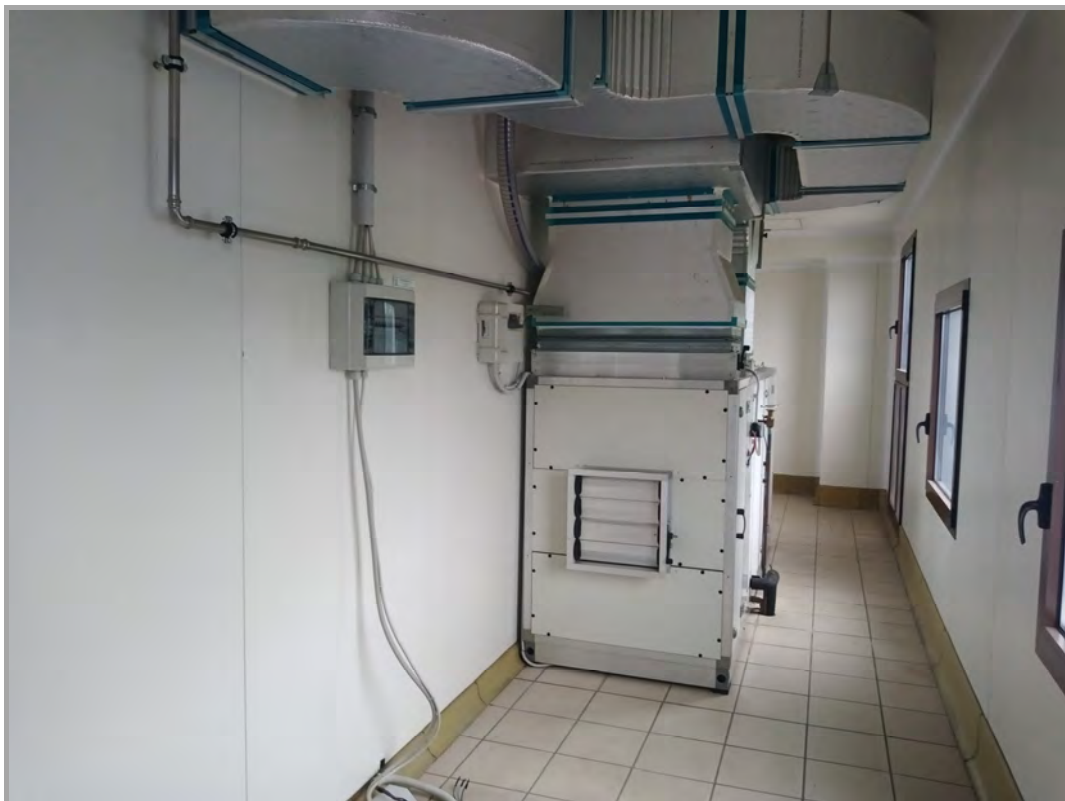
Fotografia n 29 - vista interna della zona locale tecnico impianti al piano primo del capannone corpo B