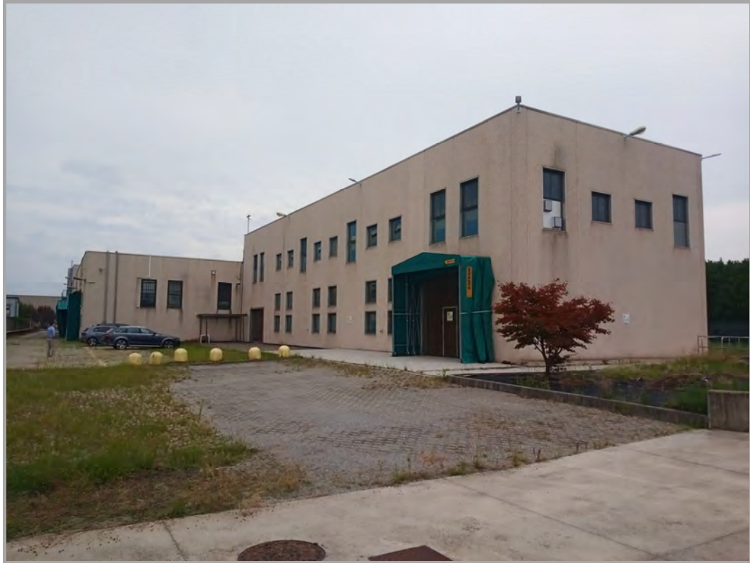
Fotografia n 6 - vista area cortilizia interna con il capannone corpo B in primo piano