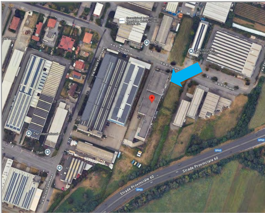
Fotografia n 1 - vista aerea del comparto immobiliare ALIMECO SRL