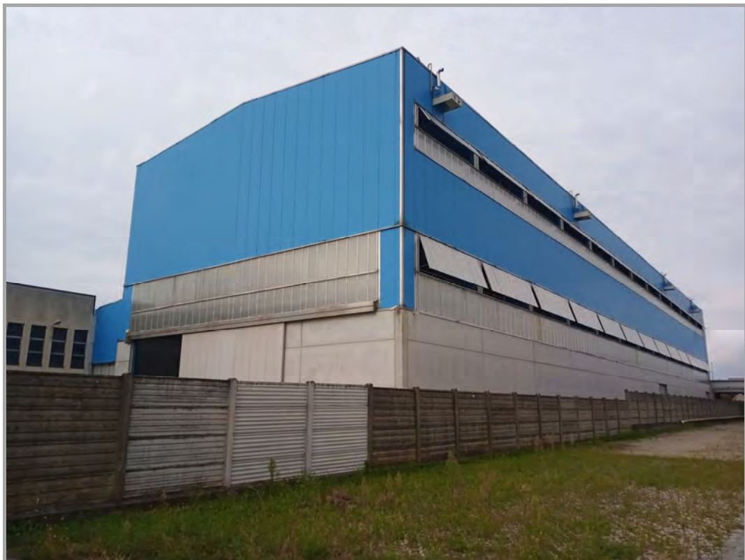
Fotografia n 13 - vista lato ovest del complesso produttivo con recinzione di confine sul mappale 190