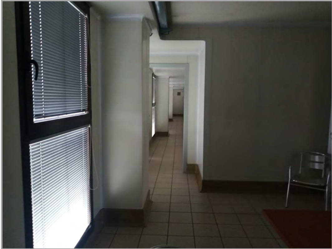
Fotografia n 28 - vista interna del corridoio a fianco laboratorio al piano primo del capannone corpo B