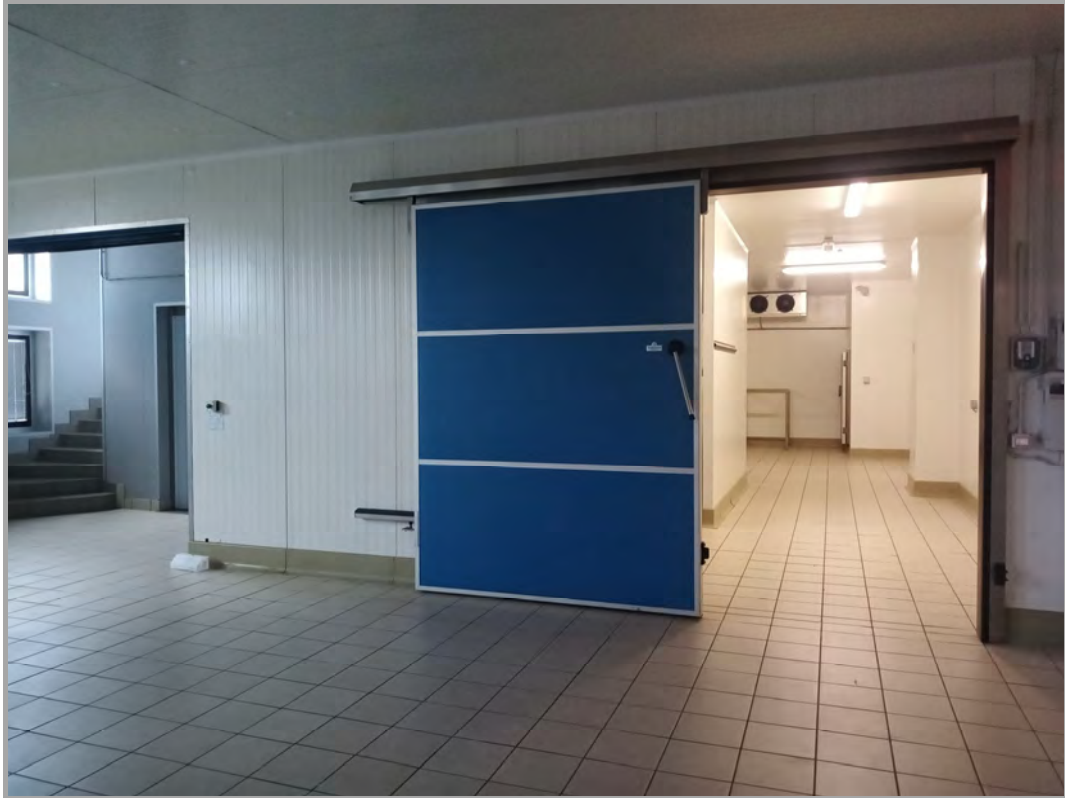
Fotografia n 22 - vista interna al piano terra del capannone corpo B con scale di salita al p. 1° e cella frigo