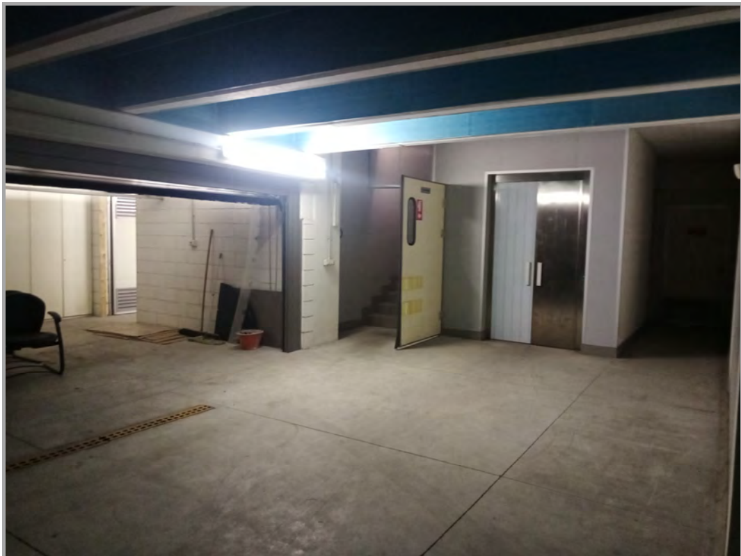
Fotografia n 17 - vista interna a piano interrato del capannone corpo B