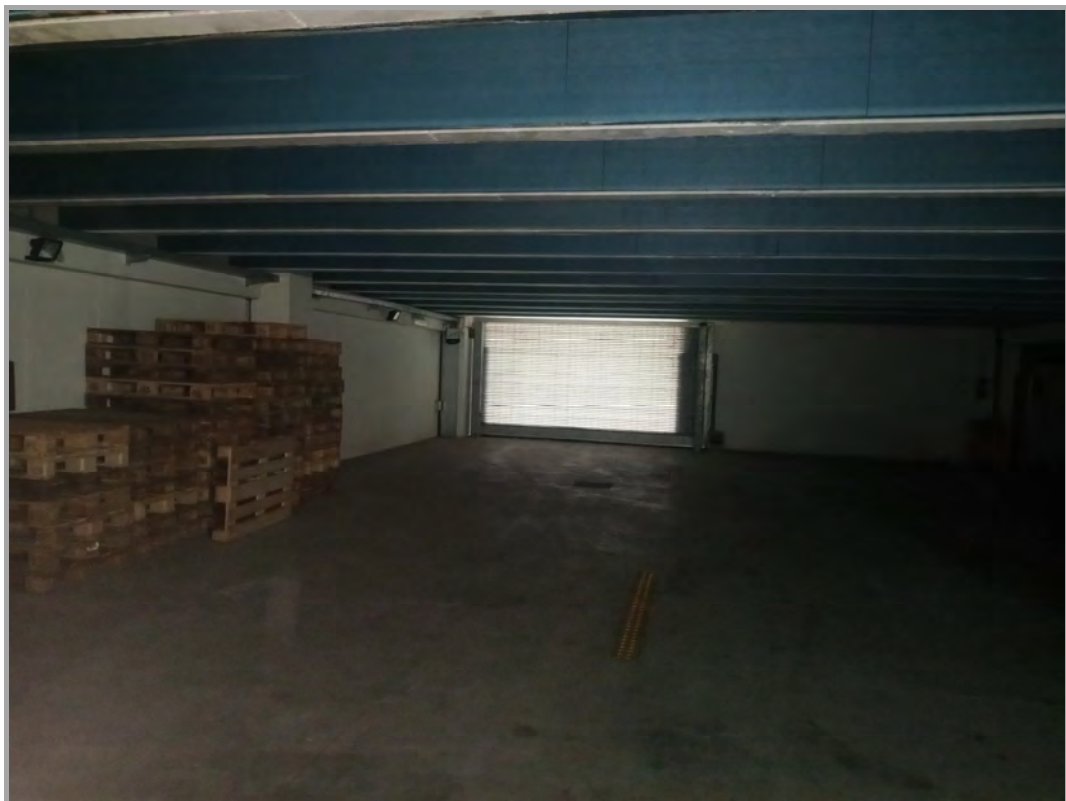
Fotografia n 15 - vista ingresso al piano interrato del capannone corpo B