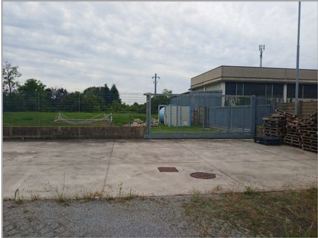
Fotografia n 8 - vista recinzione e cancello di confine con altra proprietà (mappali 421-423) a sud