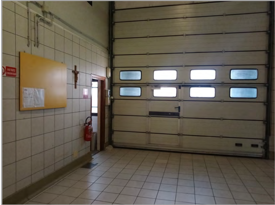
Fotografia n 34 - vista interna dell'ingresso al blocco del capannone A (subalterno 5 mappale 84)