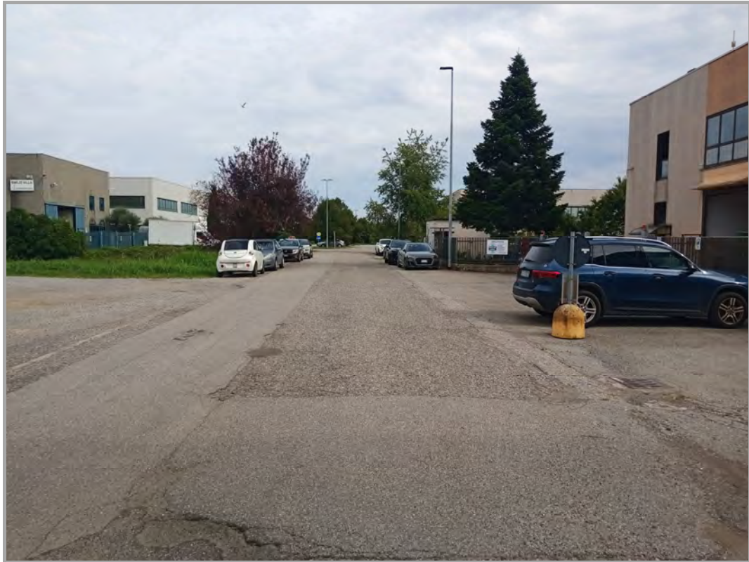
Fotografia n 2 - vista della via San Fiorano strada di accesso al comparto industriale