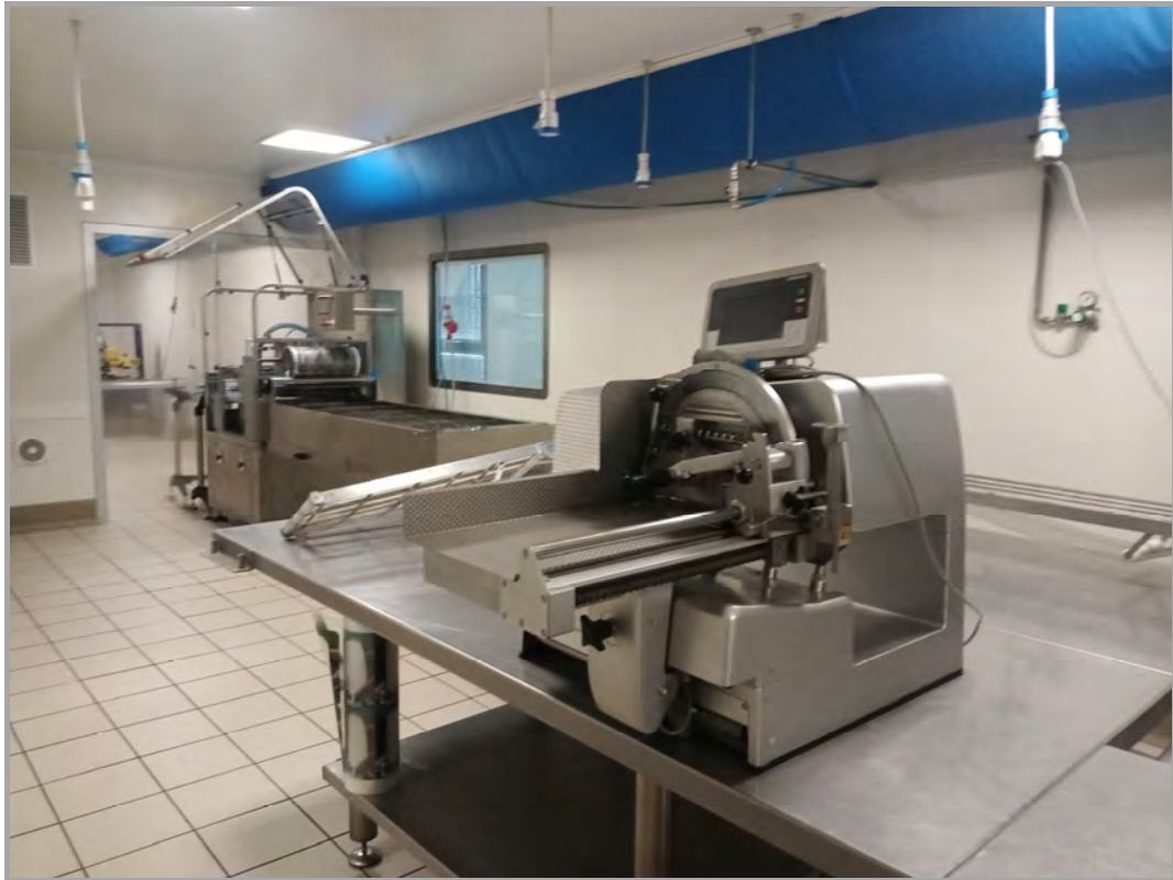
Fotografia n 26 - vista interna della zona laboratorio al piano primo del capannone corpo B