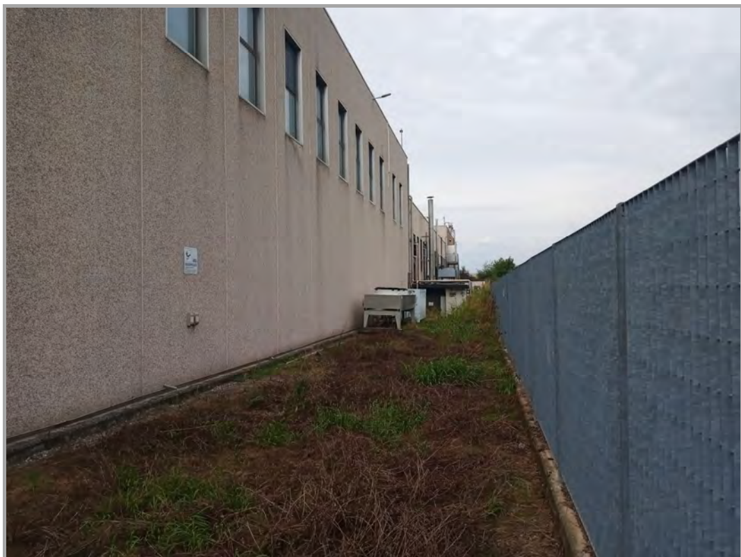
Fotografia n 9 - vista lato est del complesso produttivo con recinzione di confine su mappali 85-86