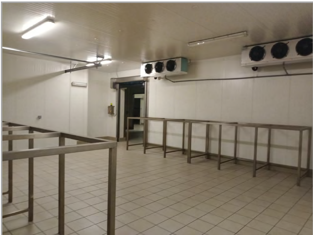
Fotografia n 23 - vista interna cella frigo al piano terra del capannone corpo B