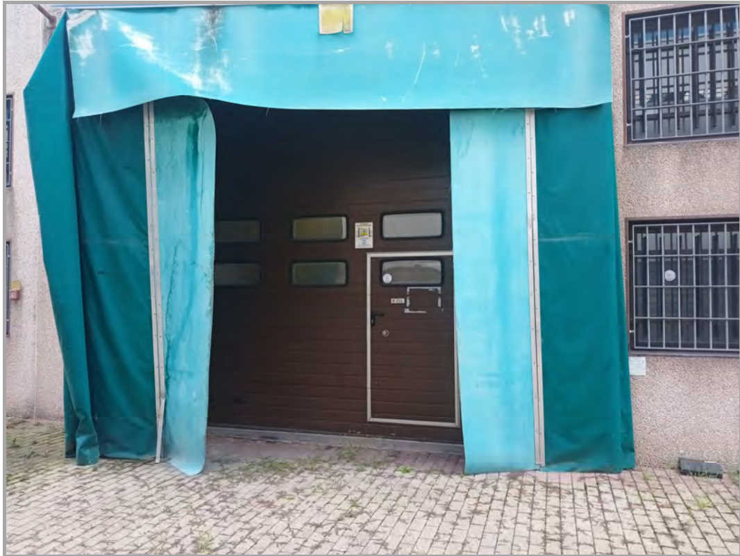
Fotografia n 32 - vista sezionale di ingresso al blocco del capannone A (subalterno 4 mappale 84)