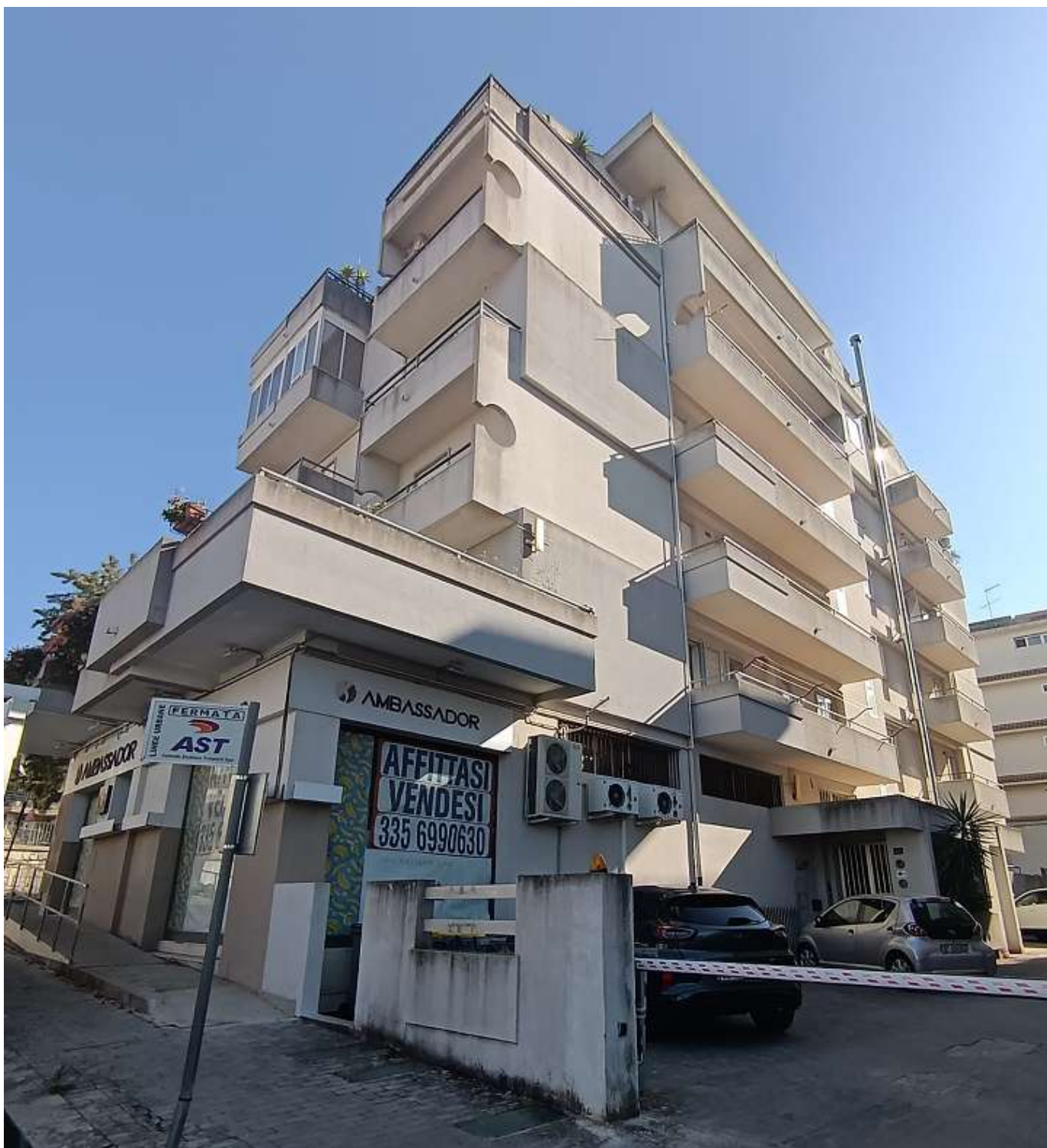
FOTO N. 1: PROSPETTO PRINCIPALE EDIFICIO SITO A RAGUSA, VIA ARCHIMEDE N.10/A