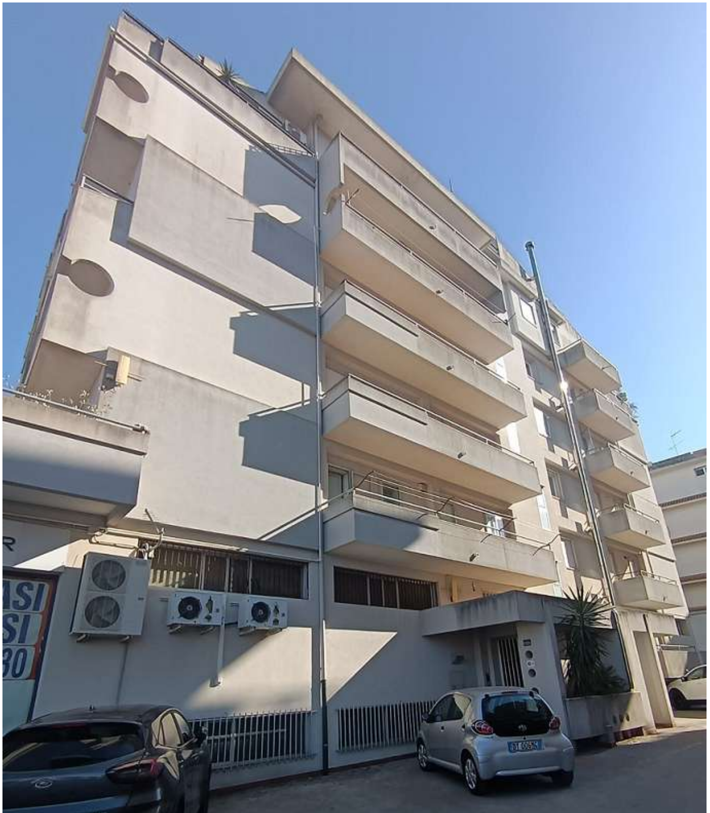
FOTO N. 2: PROSPETTO NORD EDIFICIO SITO A RAGUSA, VIA ARCHIMEDE N.10/A