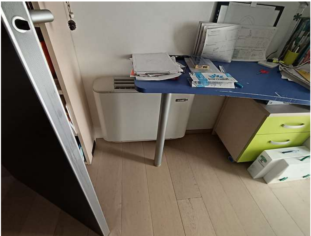
FOTO N. 11: DETTAGLIO FANCOIL CAMERA SINGOLA - APPARTAMENTO 2° PIANO