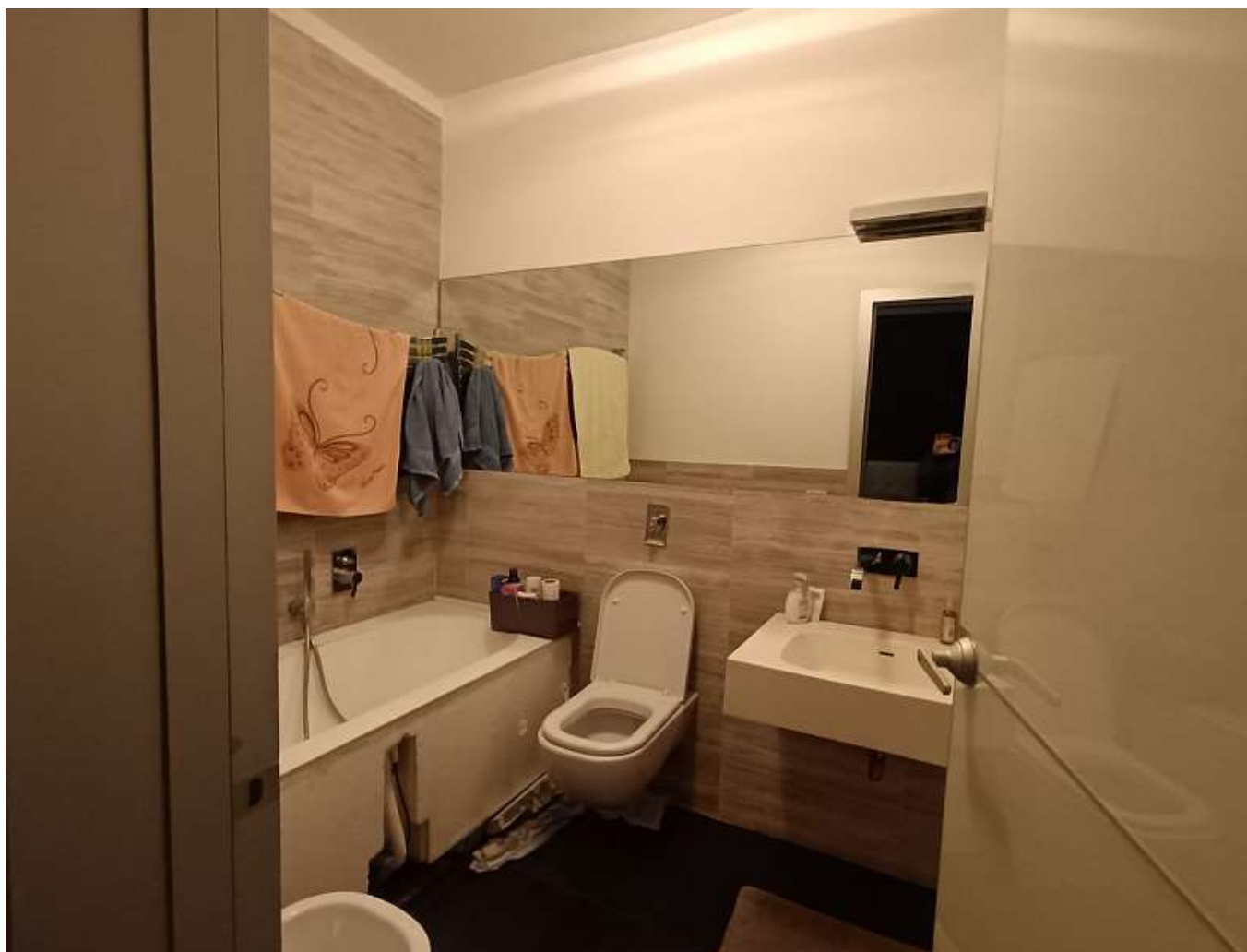
FOTO N. 15: BAGNO IN CAMERA DA LETTO MATRIMONIALE - APPARTAMENTO 2° PIANO