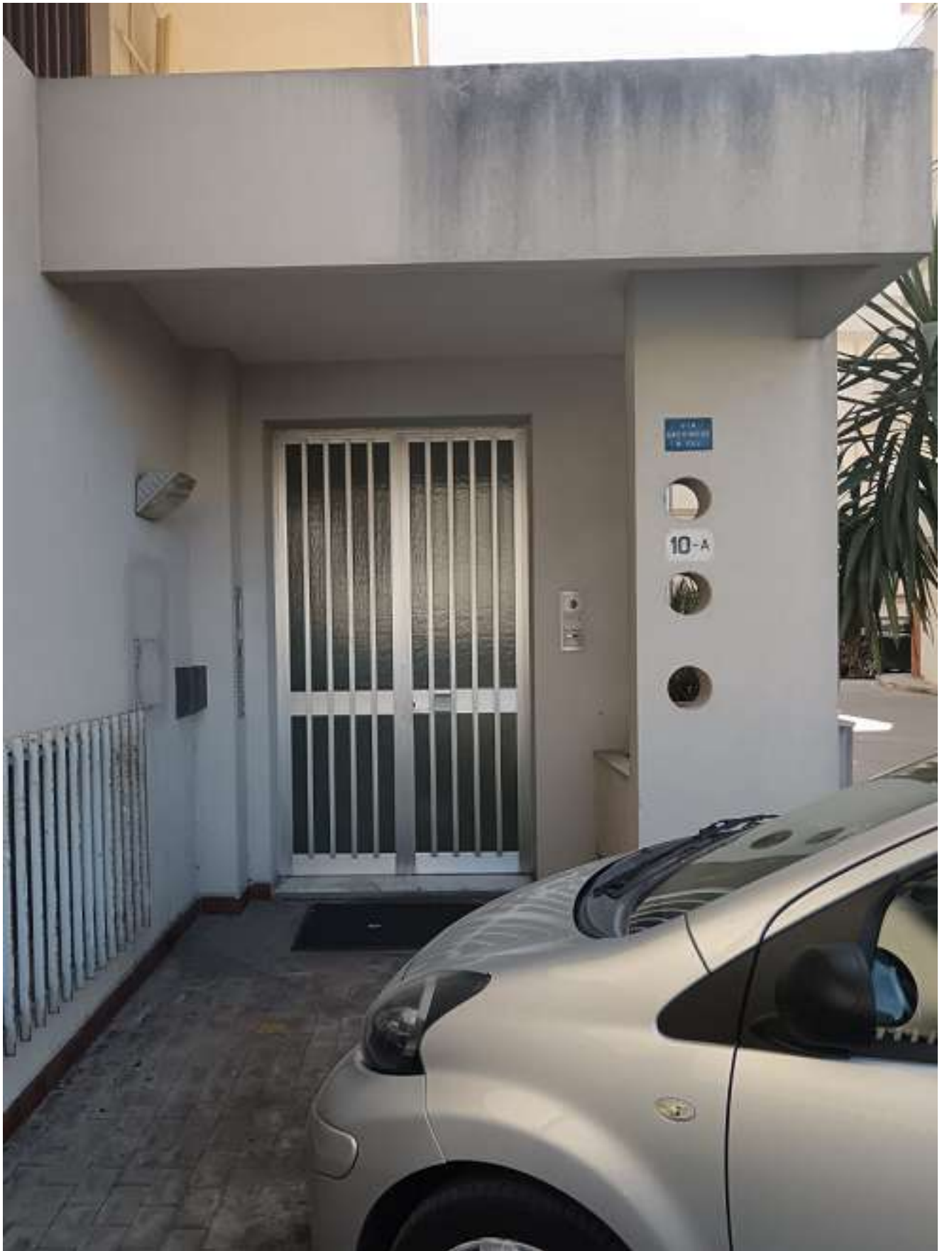
FOTO N. 4: PORTONE DI INGRESSO EDIFICIO SITO A RAGUSA, VIA ARCHIMEDE N.10/A