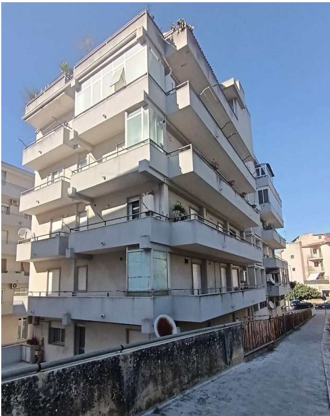
FOTO N. 3: PROSPETTO SUD-OVEST EDIFICIO SITO A RAGUSA, VIA ARCHIMEDE N.10/A