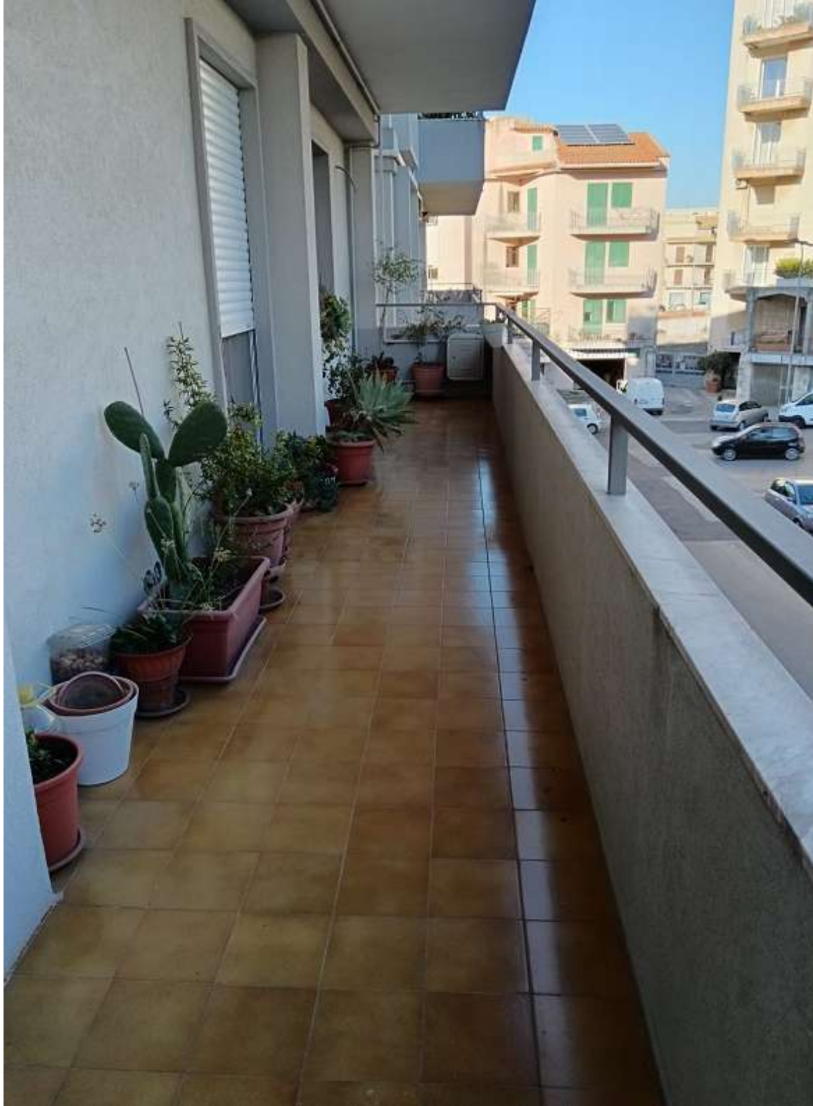
FOTO N. 16: BALLATOIO N.1 A SERVIZIO DEL SOGGIORNO/PRANZO E CUCINA