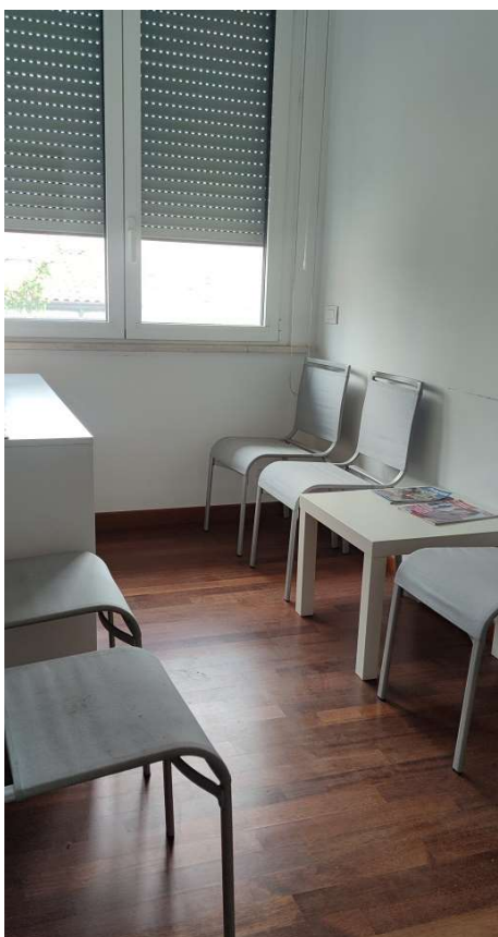
Sub 80 (Ufficio) – Sala attesa