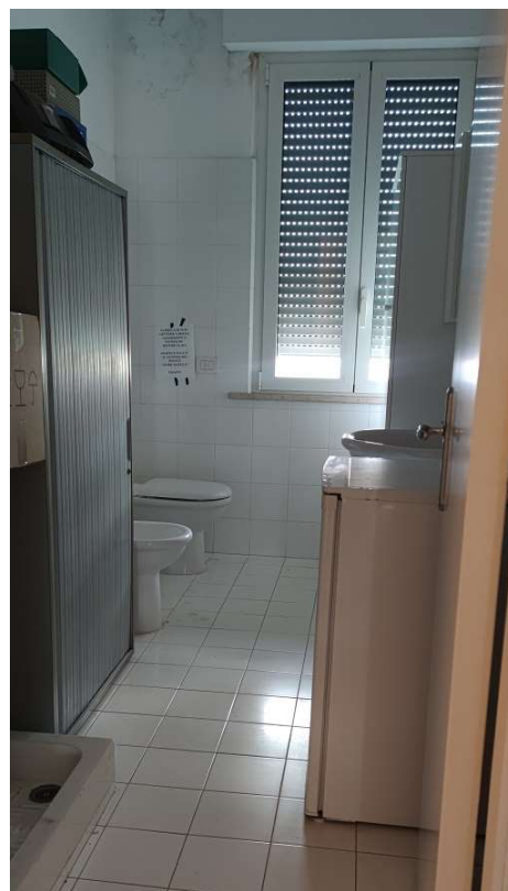
Sub 80 (Ufficio) – Bagno