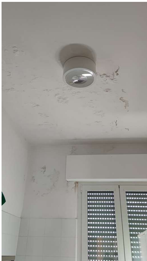
Sub 80 (Ufficio) – Bagno ( Traccia di vecchia infiltrazione )