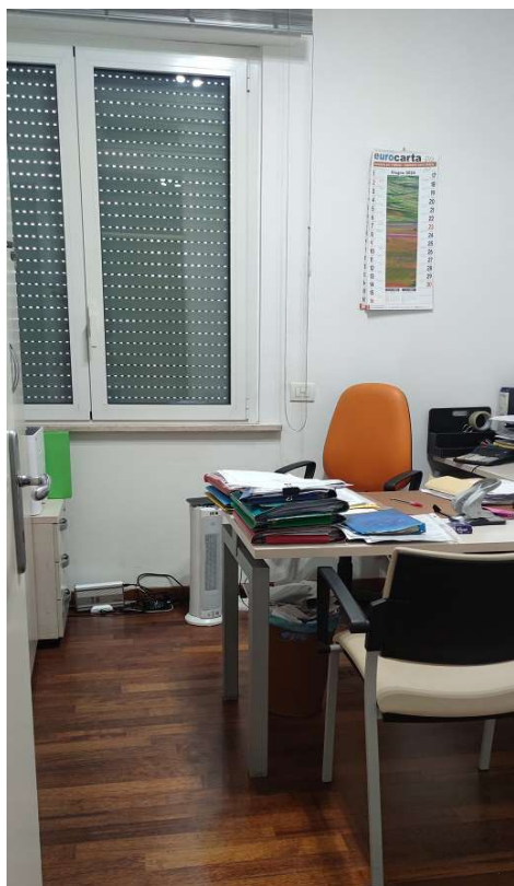
Sub 80 (Ufficio) – Ufficio 3