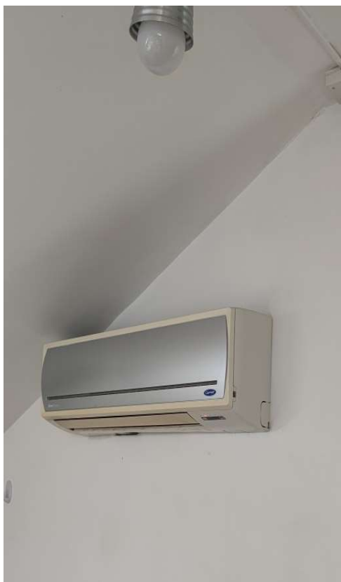
Sub 81 (Soffitta) – Split per la climatizzazione