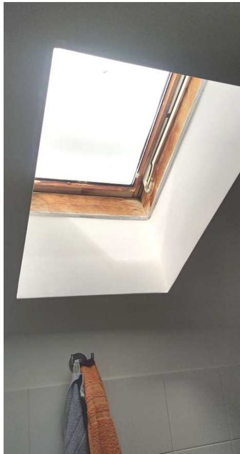
Sub 81 (Soffitta) – Lucernario posto ne bagno