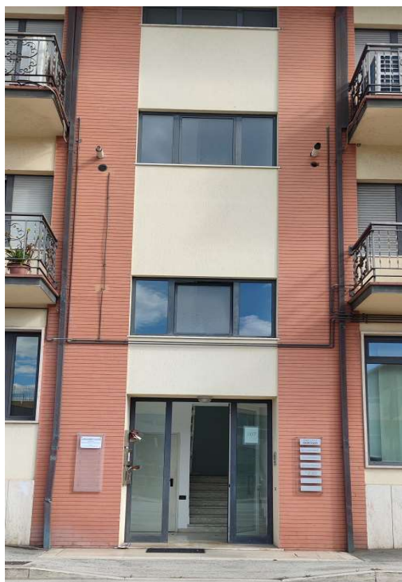
Ingresso condominiale (n.c. 107)