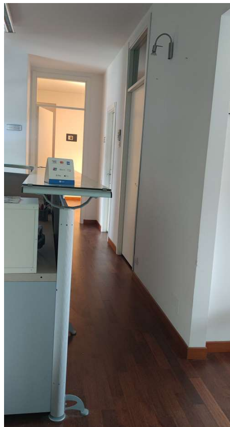
Sub 80 (Ufficio) – Ingresso/disimpegno