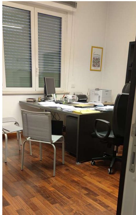
Sub 80 (Ufficio) – Ufficio 2