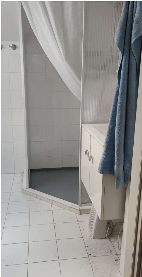
Sub 81 (Soffitta) – Bagno