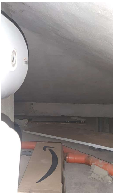
Sub 81 (Soffitta) – porzione con altezza inferiore a 150 cm