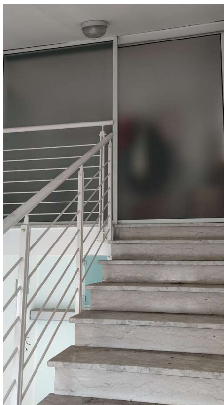
Vano scala condominiale – accesso p.3°