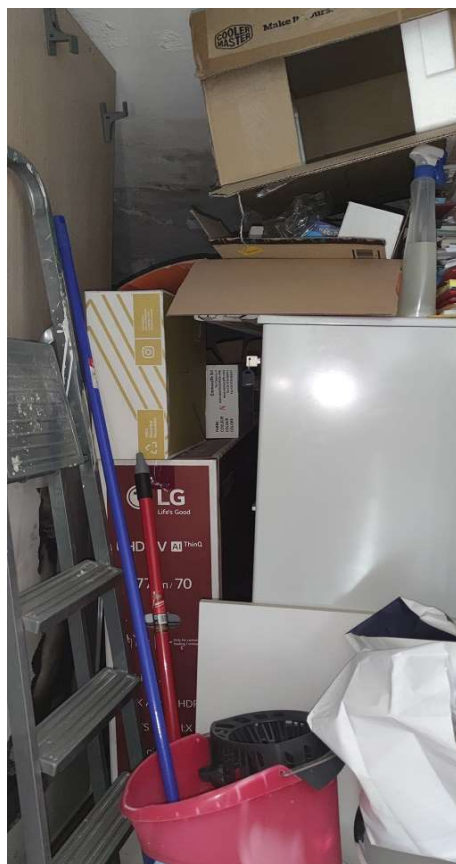
Sub 82 (Soffitta)