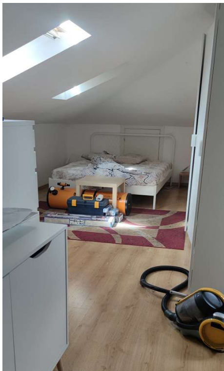
Sub 81 (Soffitta) – Ingresso/camera