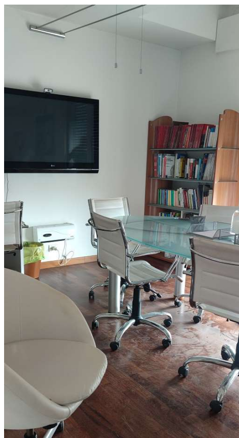
Sub 80 (Ufficio) – Ufficio 1