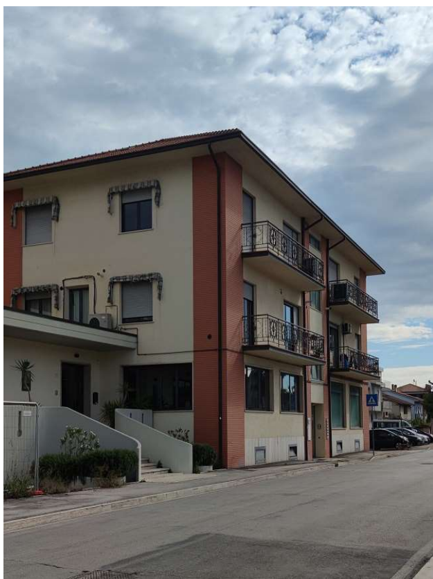
Via Martiri di Belfiore