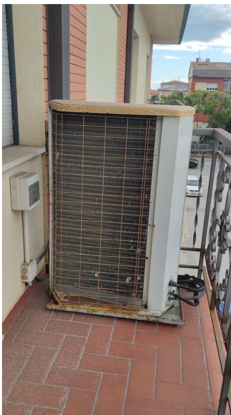
Sub 80 (Ufficio) – Terrazzo