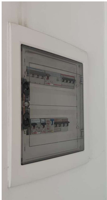
Sub 80 (Ufficio) – Quadro elettrico generale