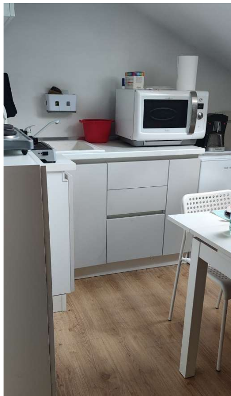
Sub 81 (Soffitta) – Cucina