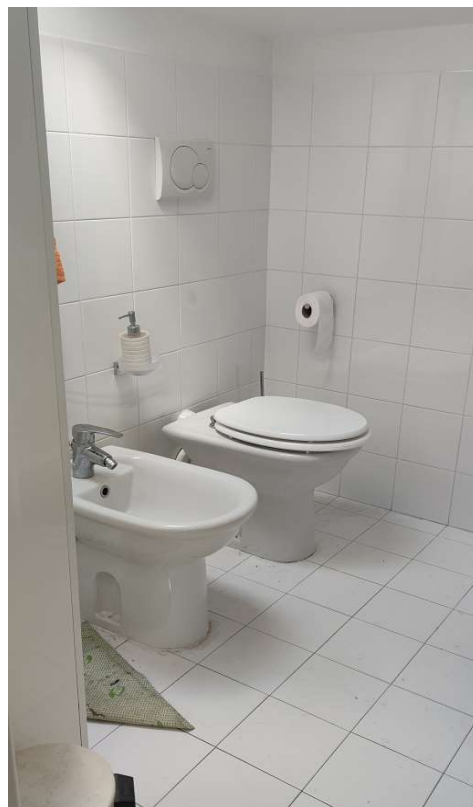
Sub 81 (Soffitta) – Bagno