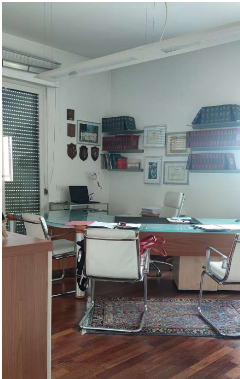
Sub 80 (Ufficio) – Ufficio 1