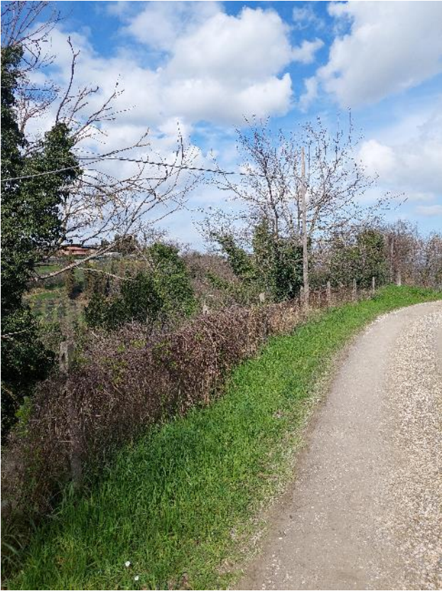
Immagini della strada vicinale il Colle, adiacenti le part. 318 e 316: