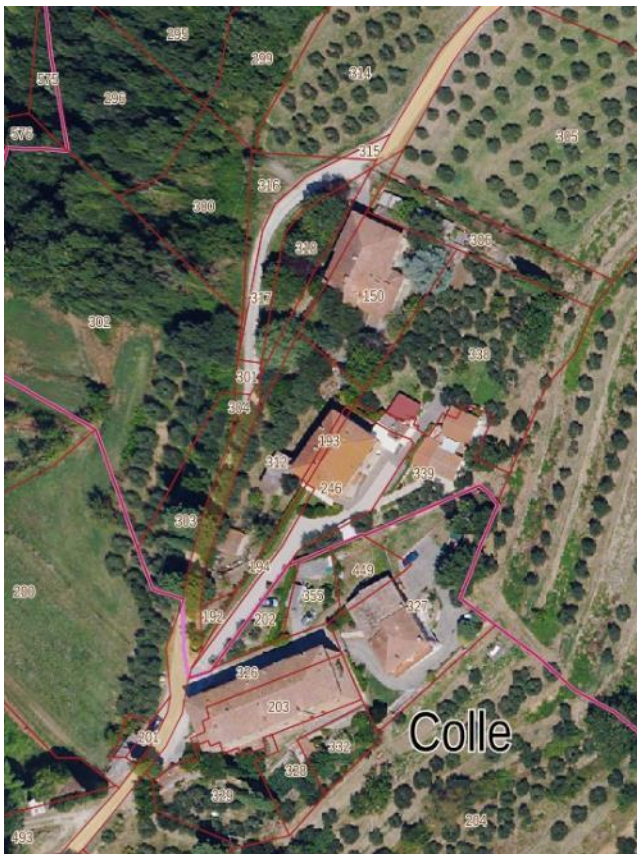
Foto 2 Ctr con sovrapposto orto foto