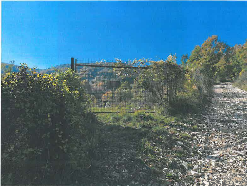
Foto nr. 4 – Vista Ingresso alla p.lla 538 -539 – 568 - 569