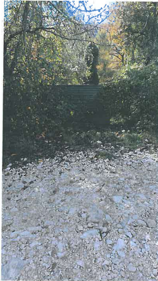
Foto nr. 3 – Vista Ingresso alla p.lla 538 attualmente non percorribile da fitta vegetazione