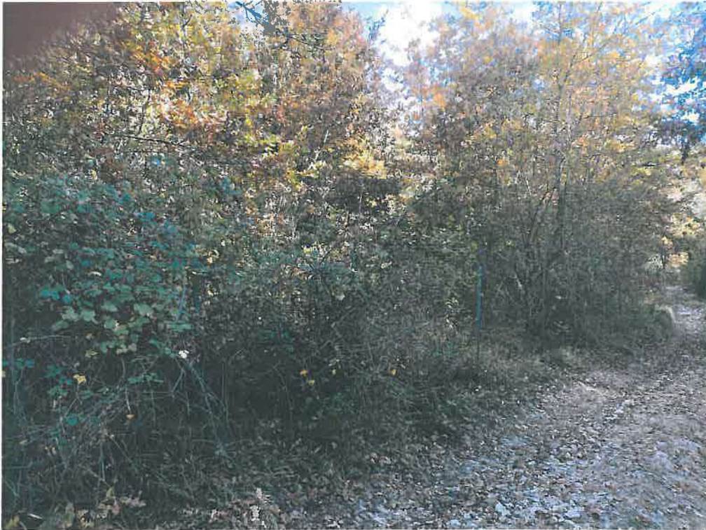
Foto nr. 2 – Confine con la p.lla 170 e vista recinzione che costeggia la strada anche nella parte a destra della strada