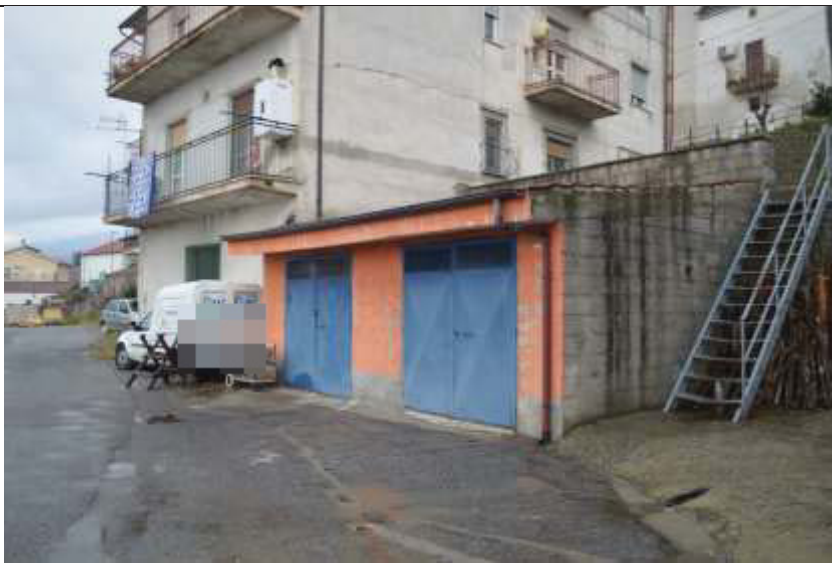
Immobile foglio N.8 Mappale N.313 sub.1