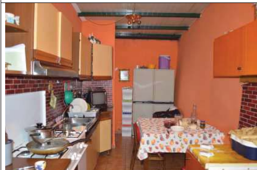
Locale ricavato nell'intercapedine