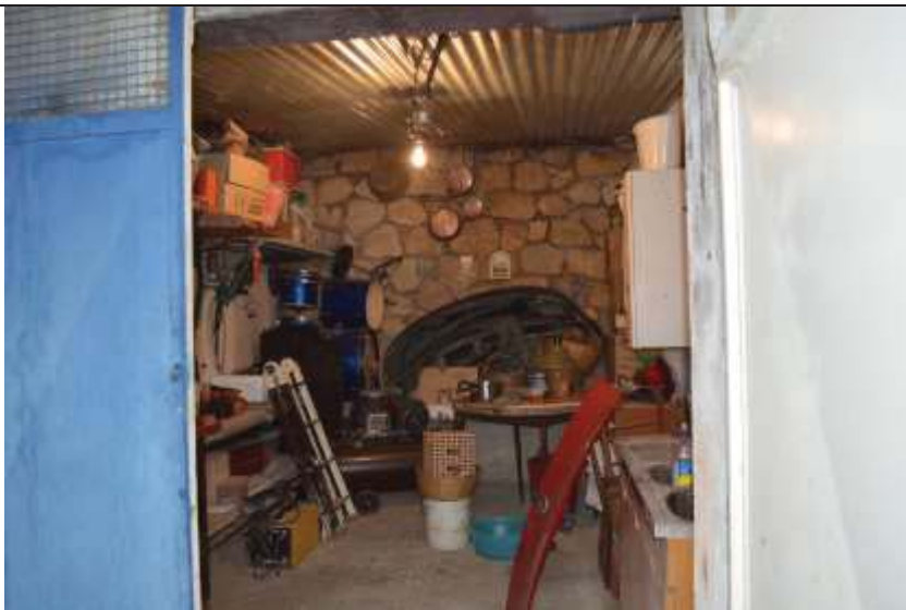
Immobile foglio N.8 Mappale N.313 sub.1