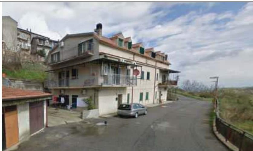
FOTO INTERO FABBRICATO