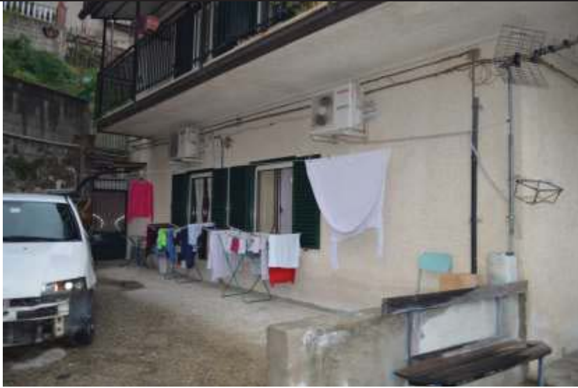
Alloggio foglio N.8 Mappale N.311 sub.1