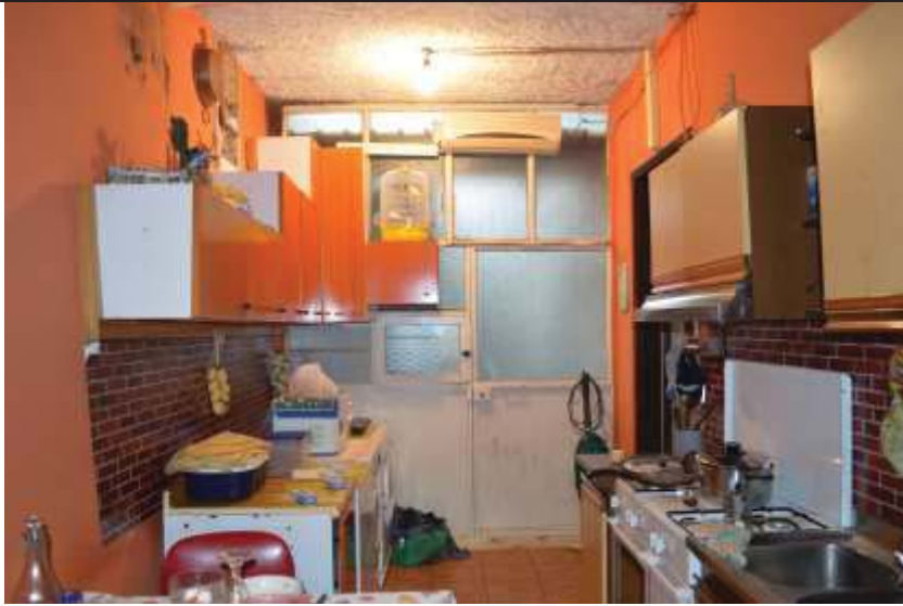
Locale ricavato nell'intercapedine