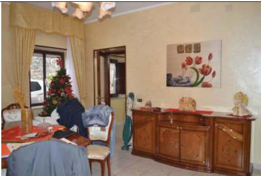
Soggiorno - pranzo