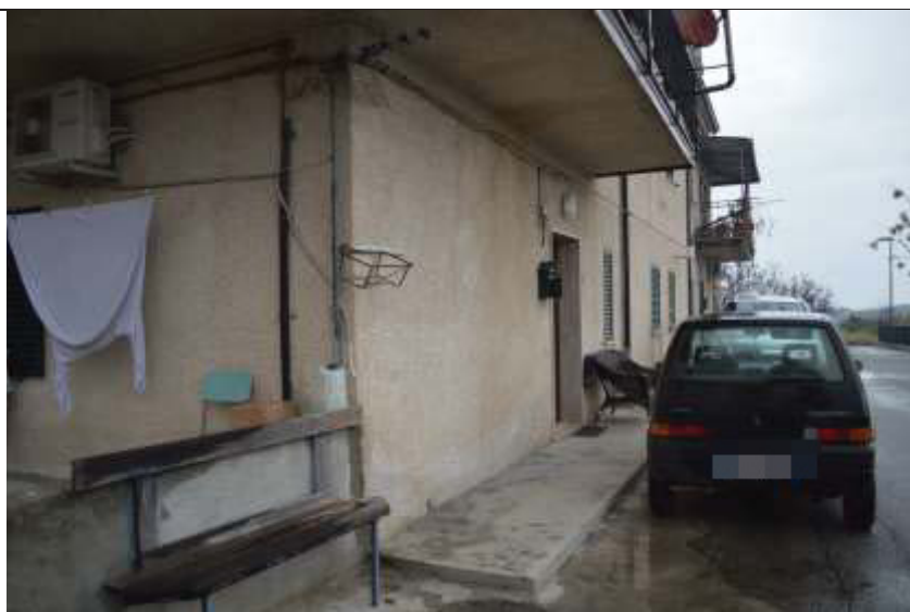
Alloggio foglio N.8 Mappale N.311 sub.1