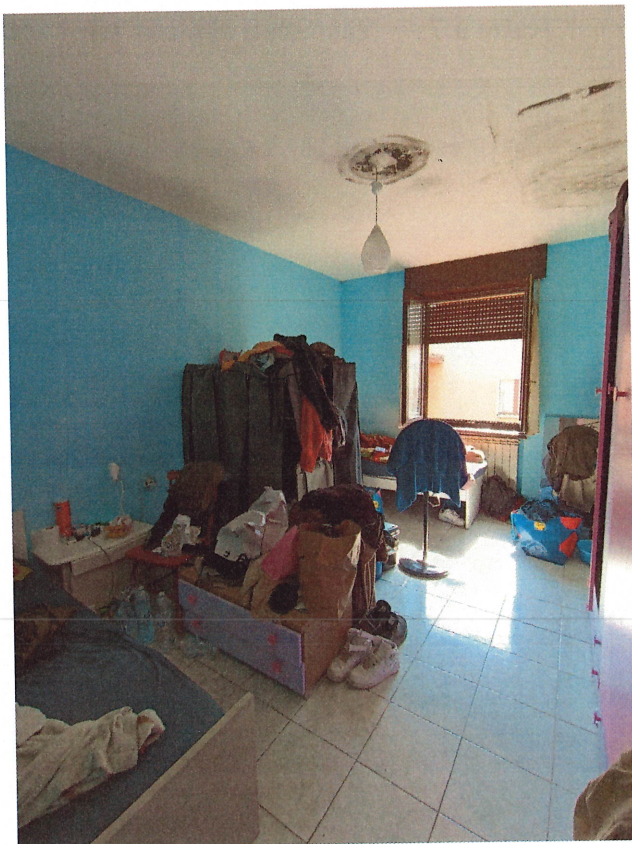
scatto n.12 - stanza con prospetto dal fronte N-E (fronte sul cotile condominiale)