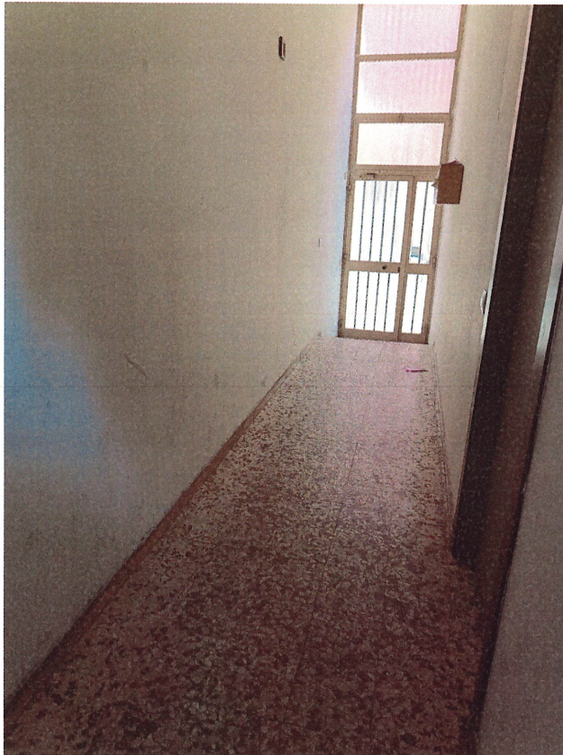
scatto n.6 – INGRESSO (P.T) dalla via Castiglioni