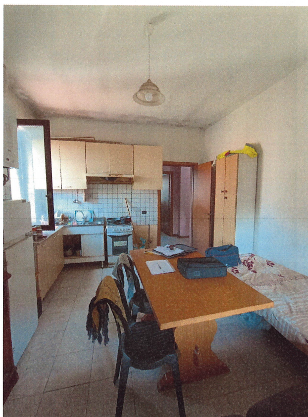
scatto n.15 - vano cucina , contro - campo