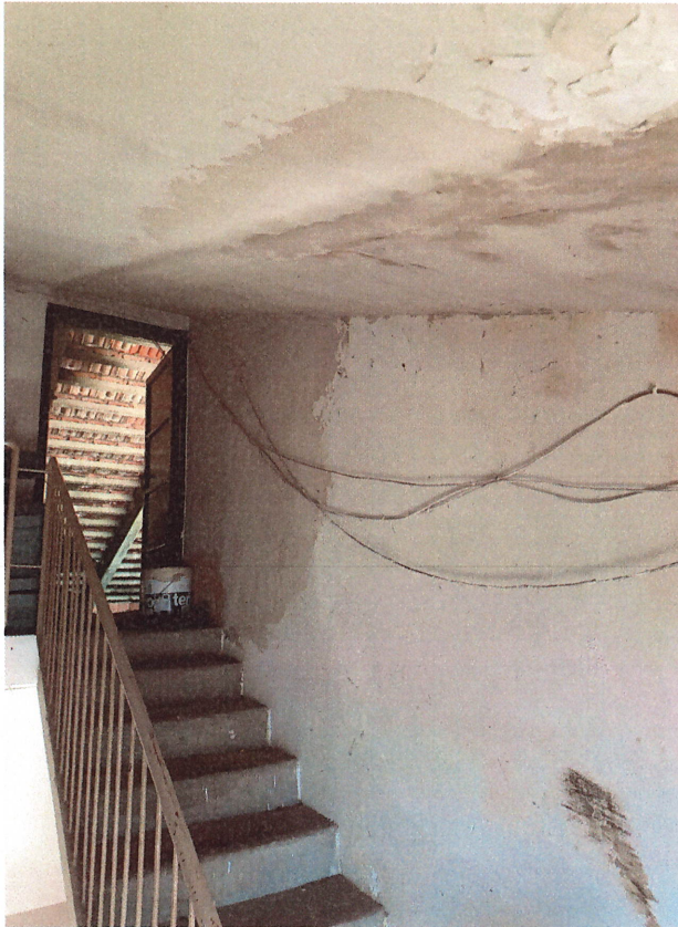
scatto n.22 – rampa di arrivo al sottotetto rampa d'accesso al piano sottotetto condominiale