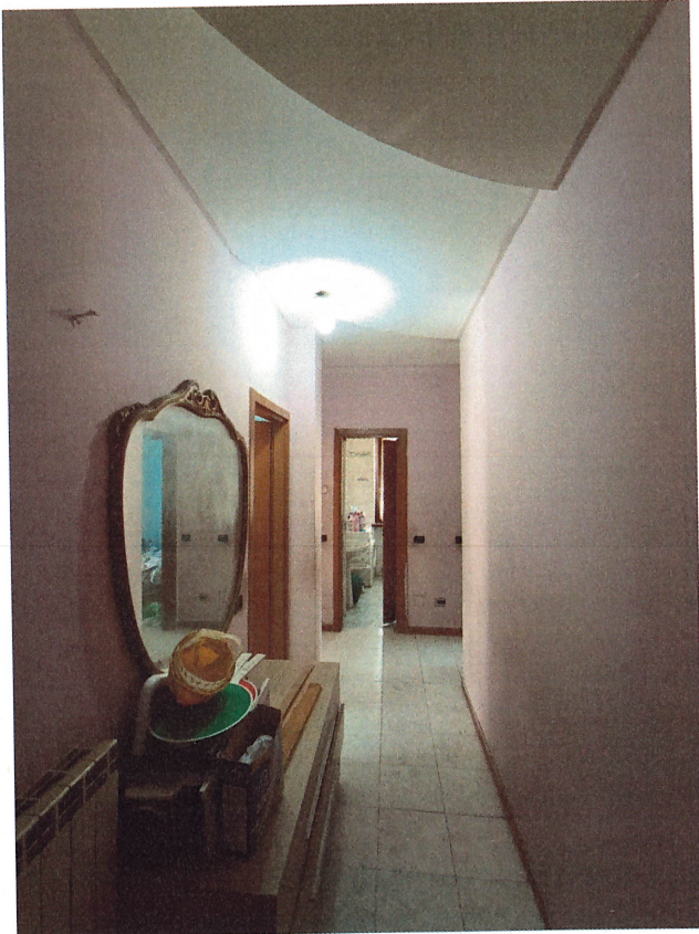
scatto n.10 – ingresso abitazione