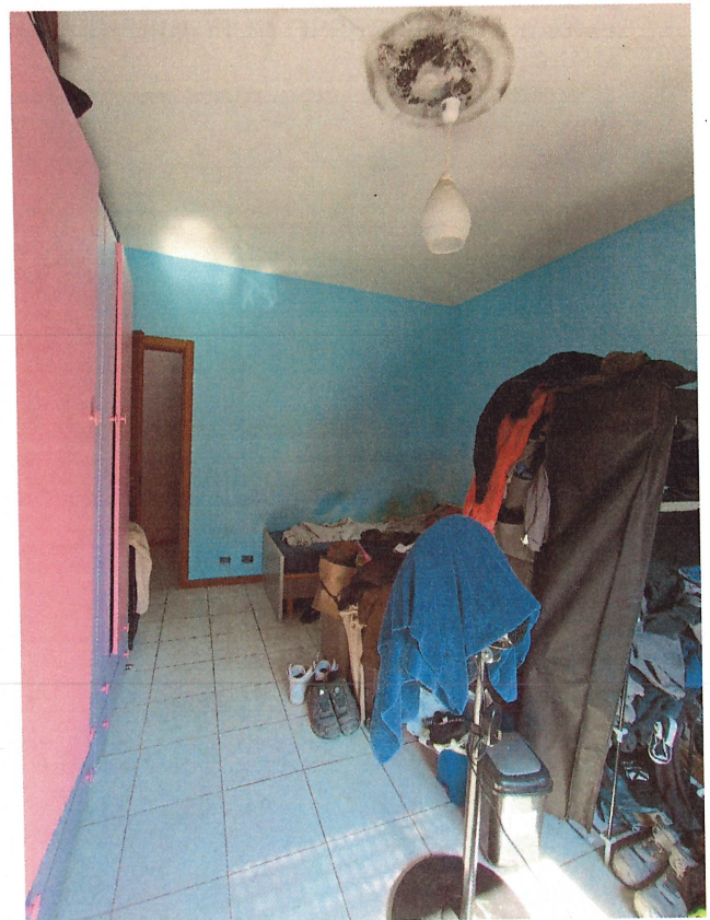
scatto n.13 - stanza fronte N-E (contro campo)