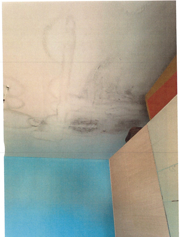
scatto n.21 - stanza con prospetto dal fronte S-O