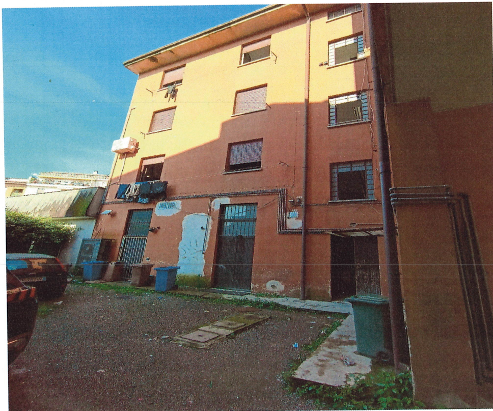
scatto n.5 - Fronte di S/O - interno al cortile condominiale