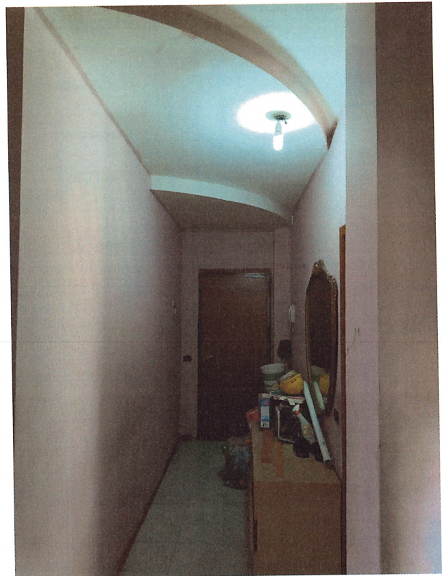
scatto n.11 – controcampo dell'ingresso abitazione