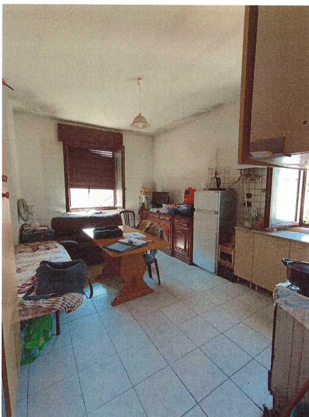
scatto n.14 - vano cucina