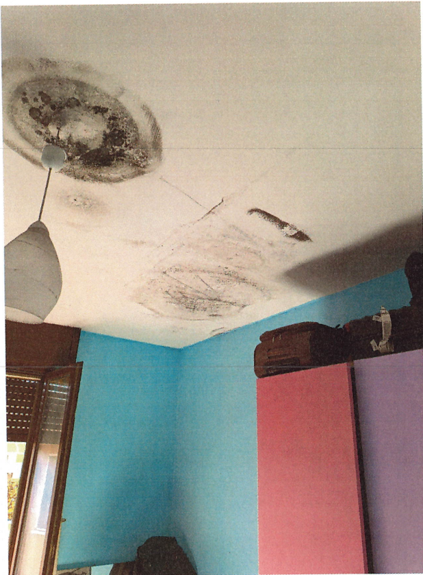
scatto n.20 - stanza con prospetto dal fronte N-E