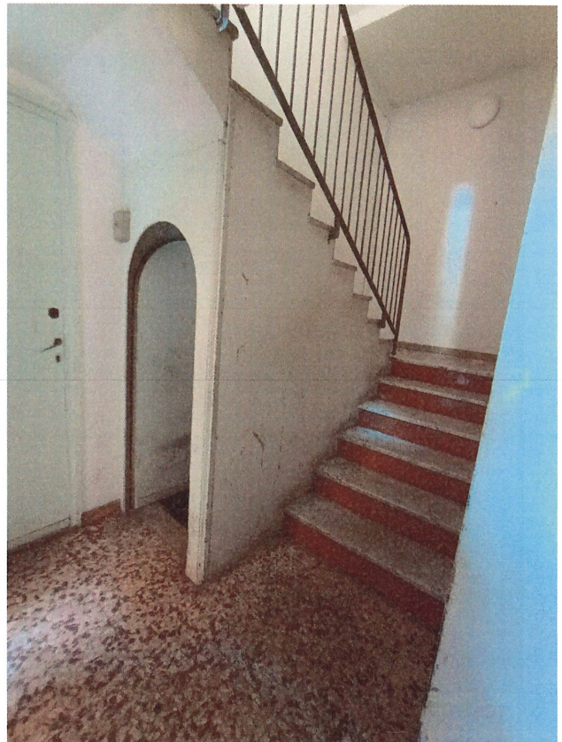
scatto n.7 – Vano scala al piano Terra