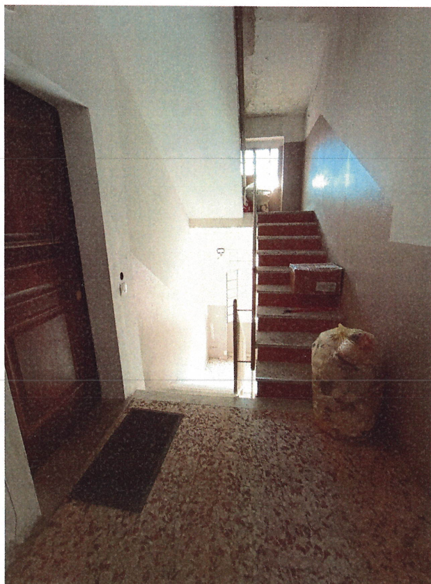
scatto n.8 “sbarco”al P.3°(piano quarto fuori terra)