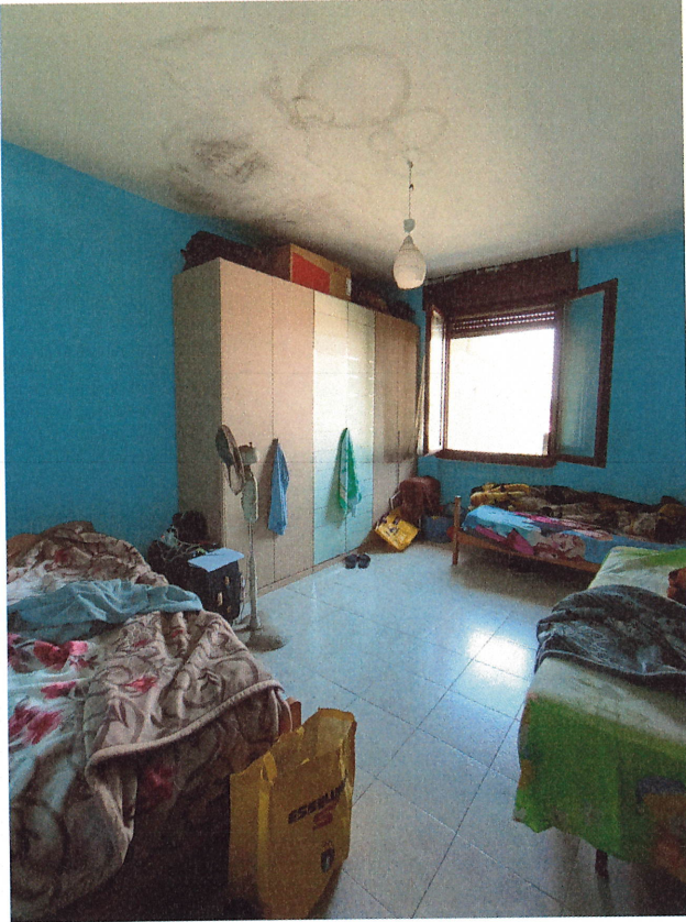
scatto n.18 - stanza con prospetto dal fronte S-O