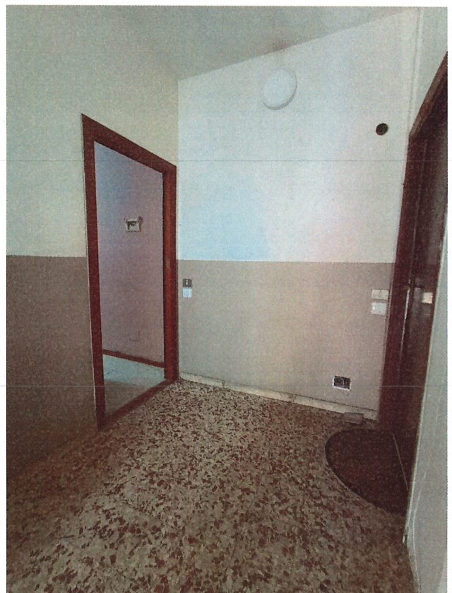
scatto n.9 – porta ingresso al U.I. al P.3°