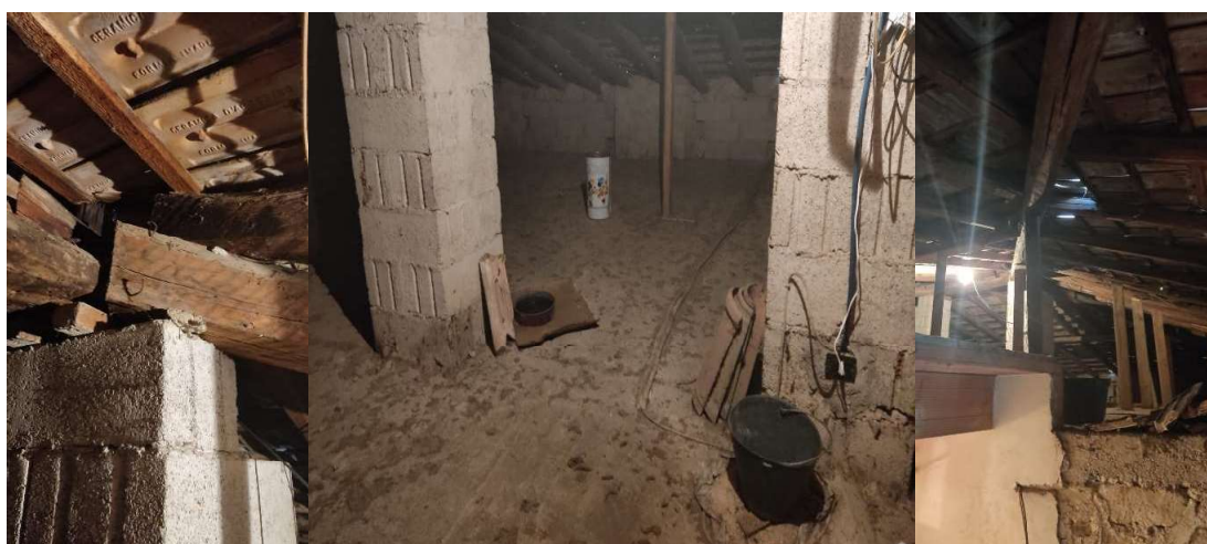
Vista Sotto tetto