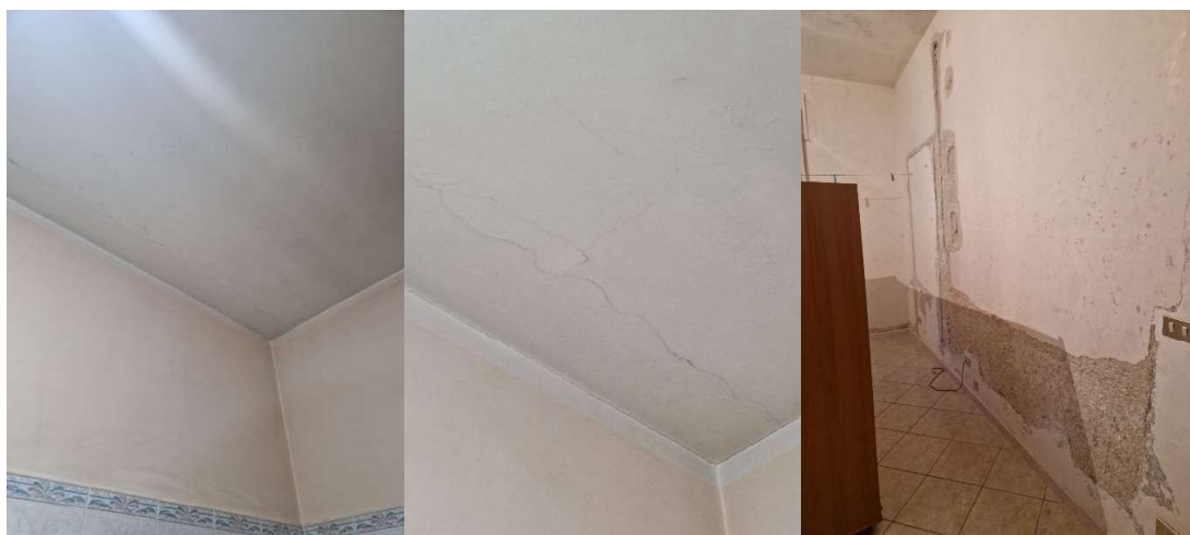
Dettaglio stato del bene.