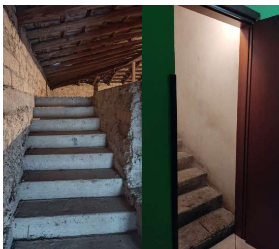
Accesso al tetto