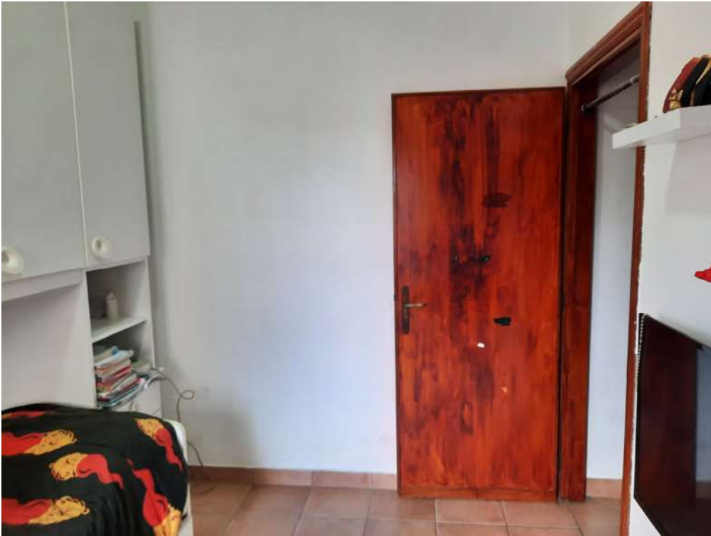
F11 – CAMERERETTA