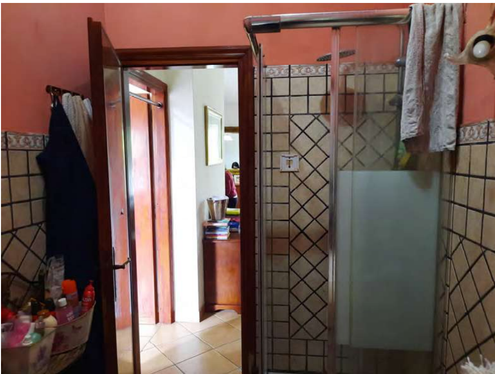
F14 – BAGNO