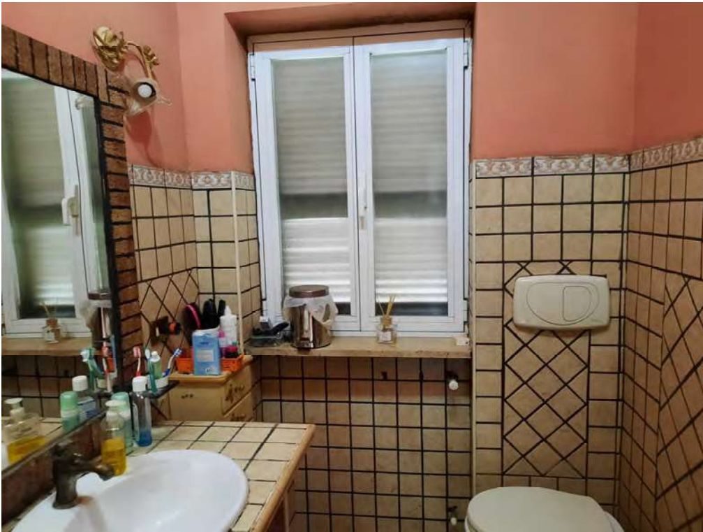
F13 – BAGNO