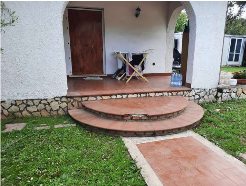
F3 - AREA CORTILIZIA LATO EST CON ACCESSO APPARTAMENTO