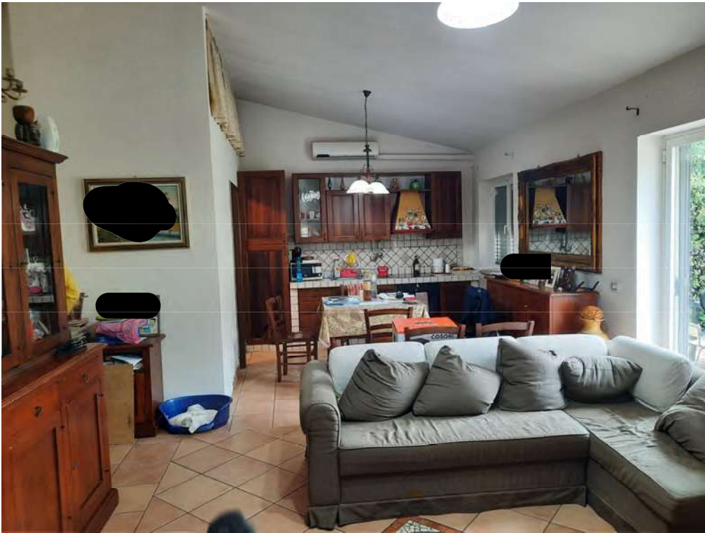
F5 – SOGGIORNO CON ANGOLO COTTURA