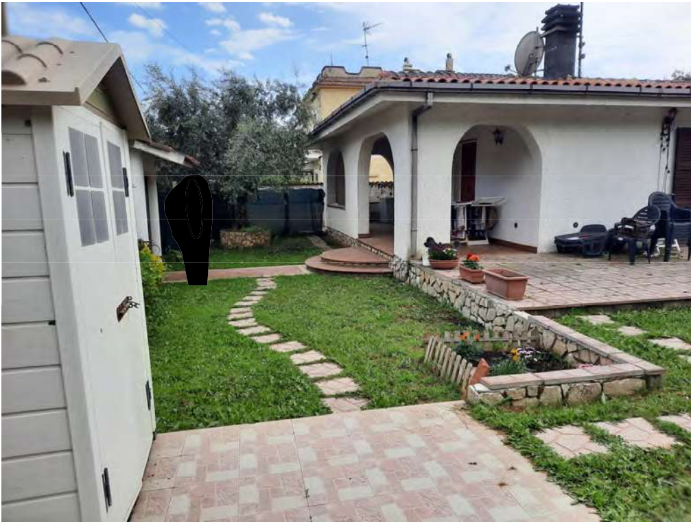
F1 - AREA CORTILIZIA LATO EST