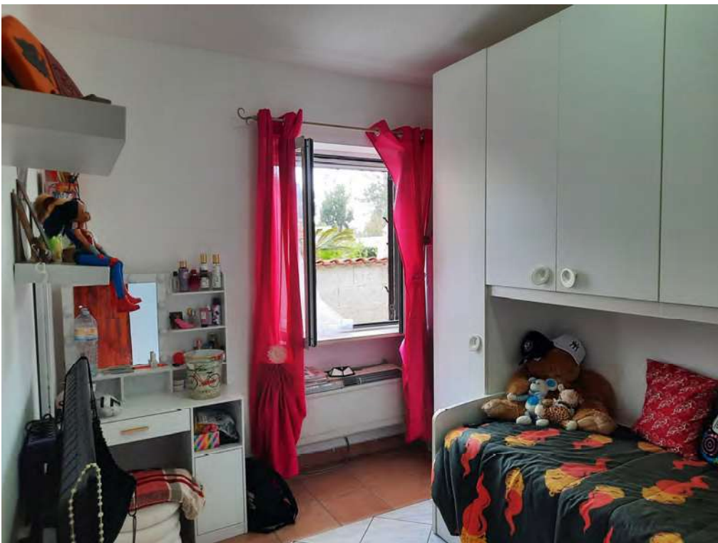
F10 – CAMERERETTA