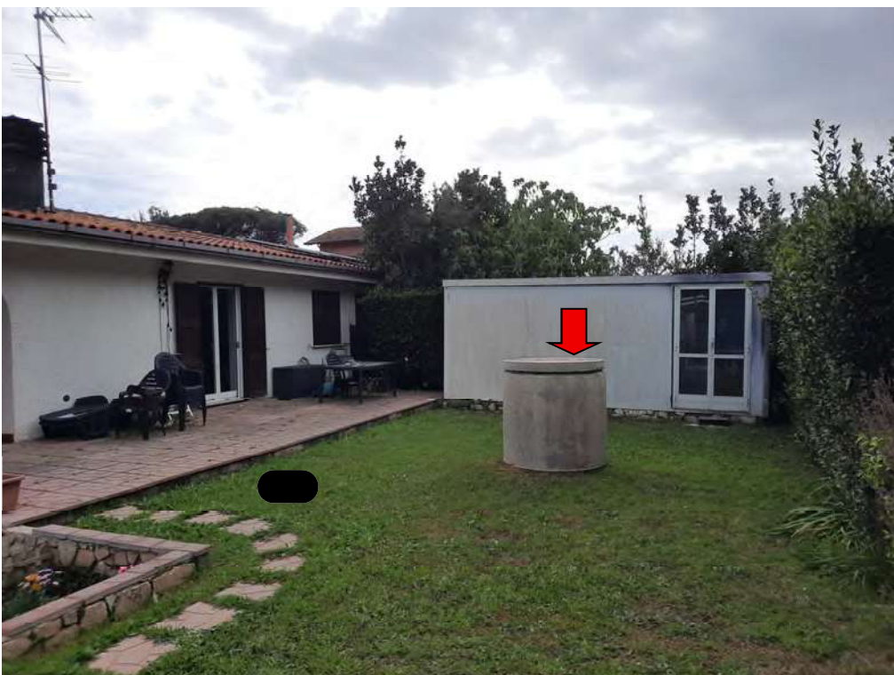
F2 - AREA CORTILIZIA LATO NORD CON POZZO APPROVVIGIONAMENTO IDRICO