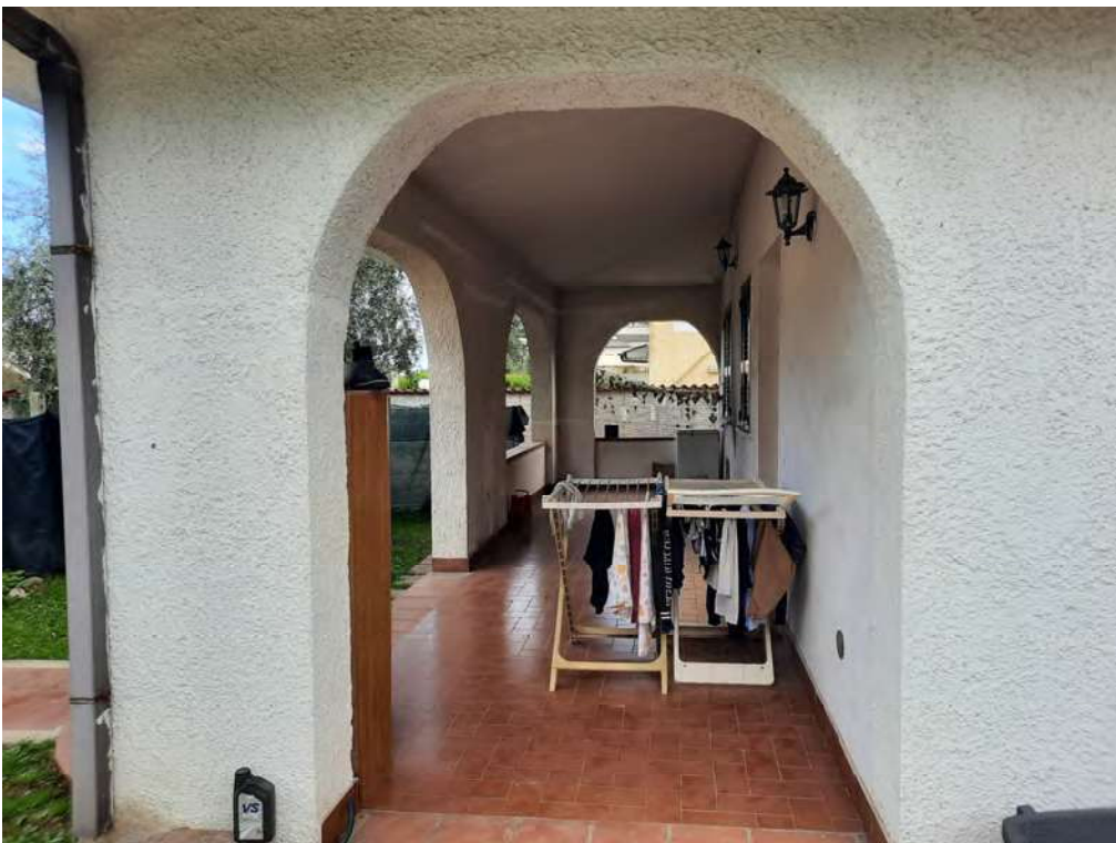
F4 - PORTICO