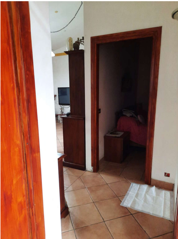
F12 – DISIMPEGNO