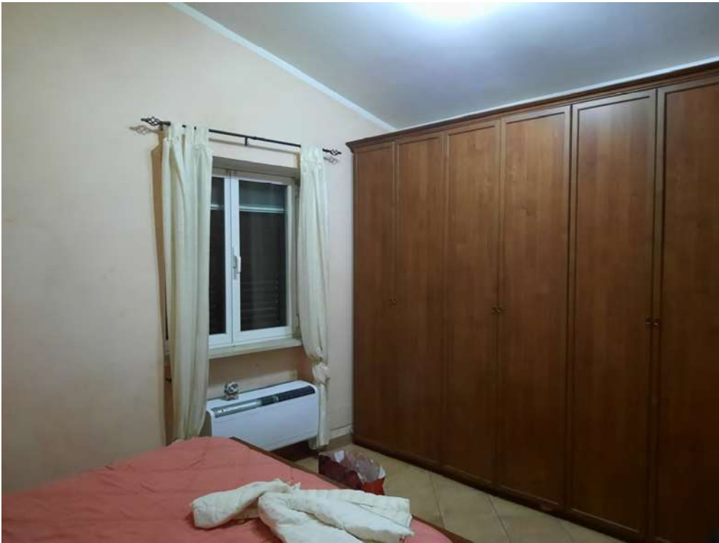
F9 – CAMERA MATRIMONIALE