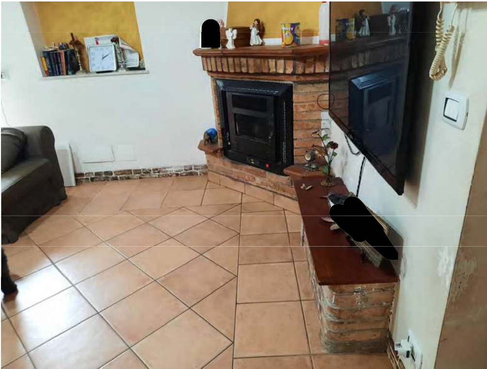
F7 – SOGGIORNO CON CAMINO VENTILATO