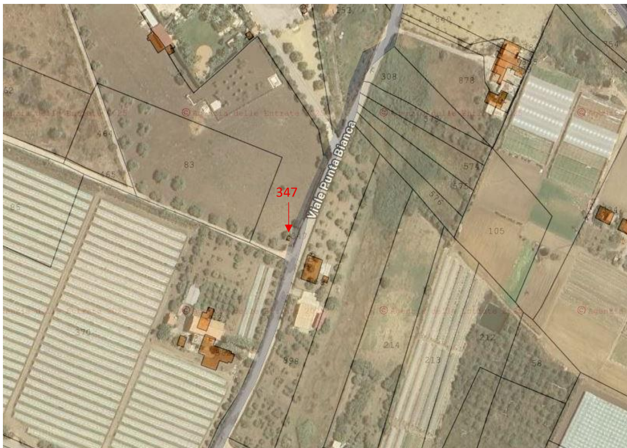
Figura 2 – Sovrapposizione di catastale su ortofoto.