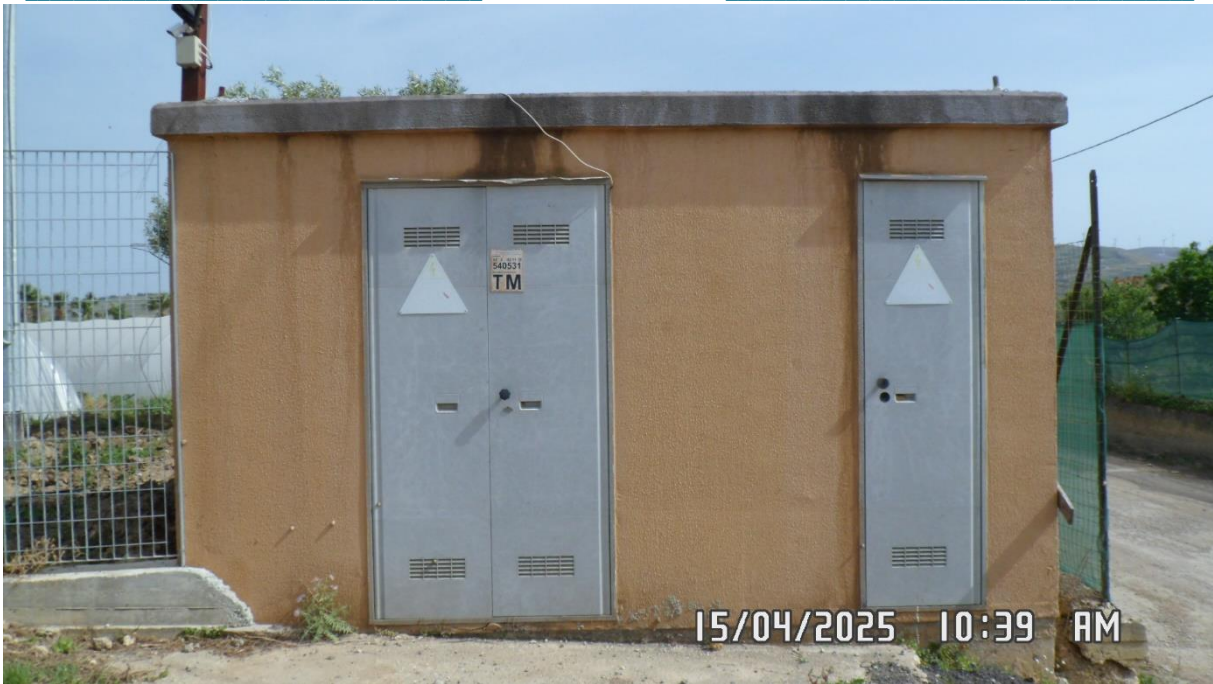
Figura 3 – Vista della cabina elettrica.