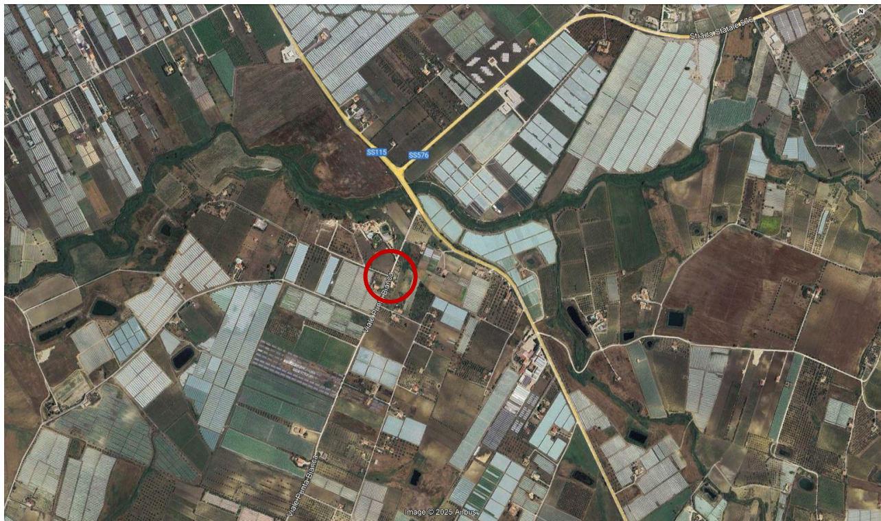
Figura 1 – Foto satellitare con individuazione dell’immobile.

Al Catasto Edilizio del comune di AGRIGENTO (AG):