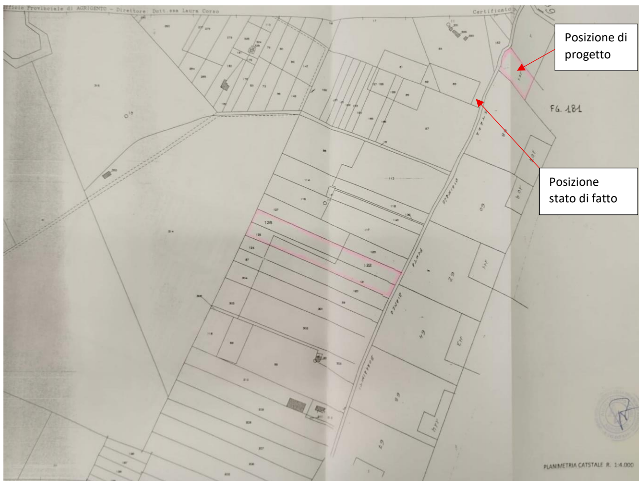
Planimetria allegata alla richiesta di autorizzazione.

Esiste autorizzazione n. 412/08 rilasciata il 15/12/2008 dal Comune di Agrigento alla ditta "B" per la collocazione di n. 2 strutture prefabbricate, una di consegna e misura, l'altra di smistamento e connessione, in dei lotti di terreno privati. La cabina di smistamento non è stata posizionata come da autorizzazione.