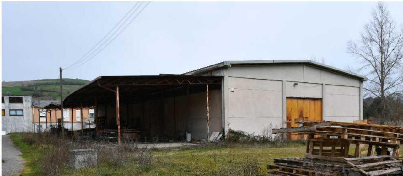
Foto del capannone scattata dal lato posteriore

Il lotto è composto da poco meno di 3 ettari di terreno, urbanisticamente la zona è classificata come rimboscimento .... con vincolo di inedificabilità, ed un capannone adibito alla produzione. Adiacente al corpo di fabbrica, sul lato anteriore, è realizzato un piccolo manufatto, probabilmente una centrale termica o un locale di rimessa. Su un lato è realizzata un'ampia tettoia in metallo.