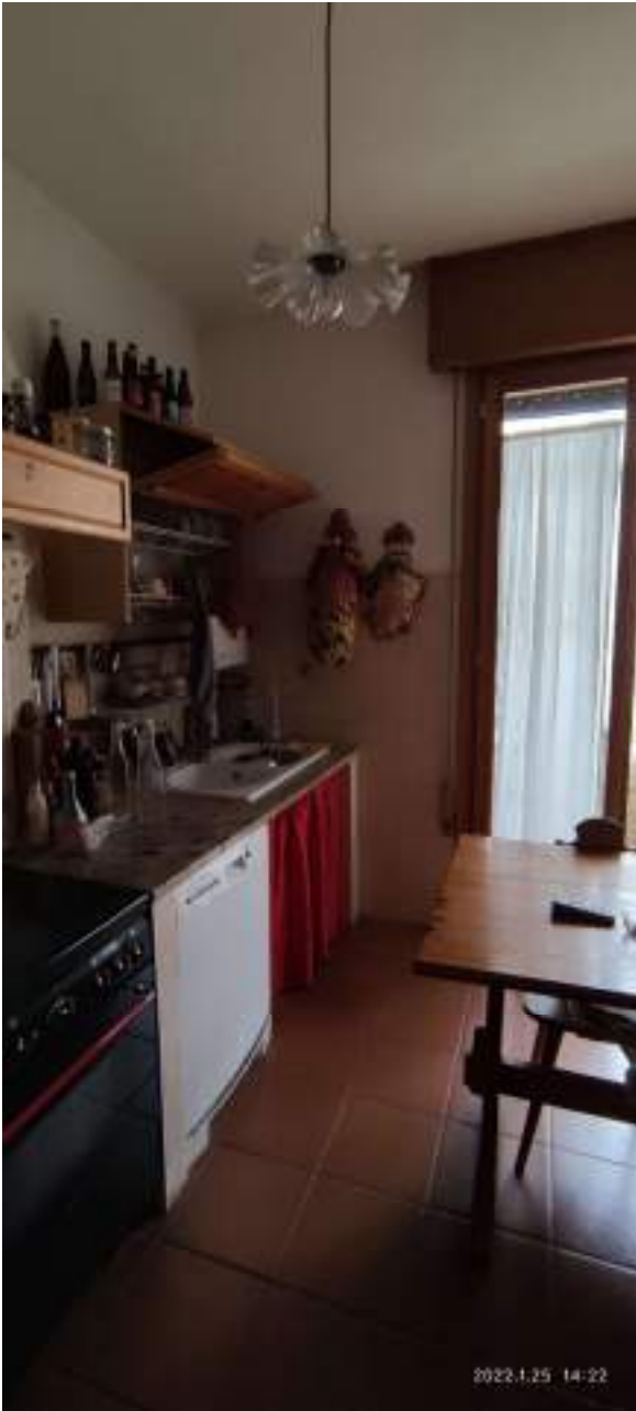
FOTO 13_CUCINA_VISTA VERSO VERANDA