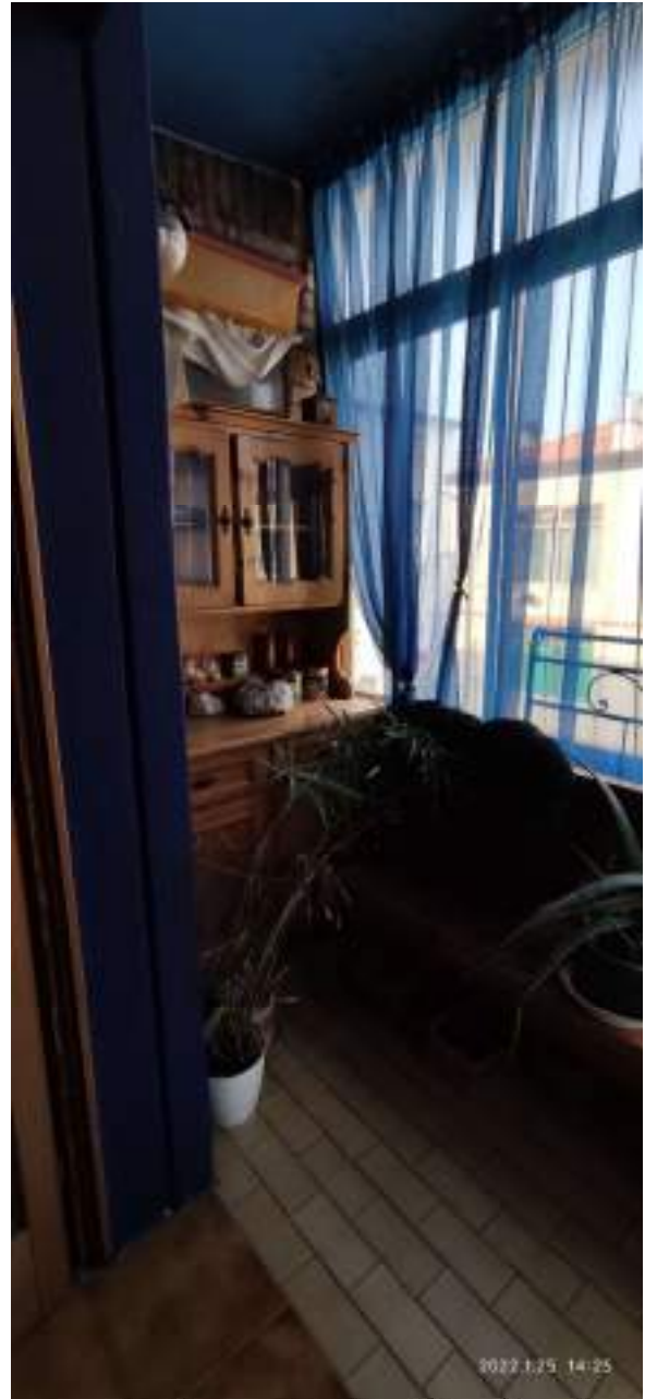
FOTO 10_PARTICOLARE VERANDA SU CAMERA