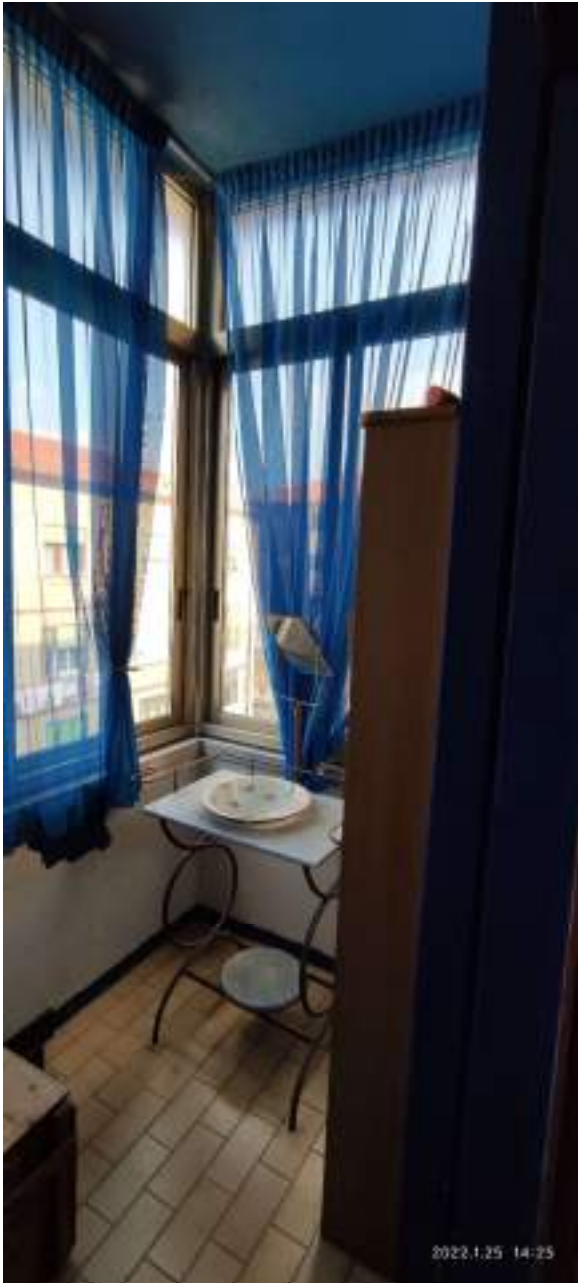
FOTO 11_PARTICOLARE VERANDA SU CAMERA