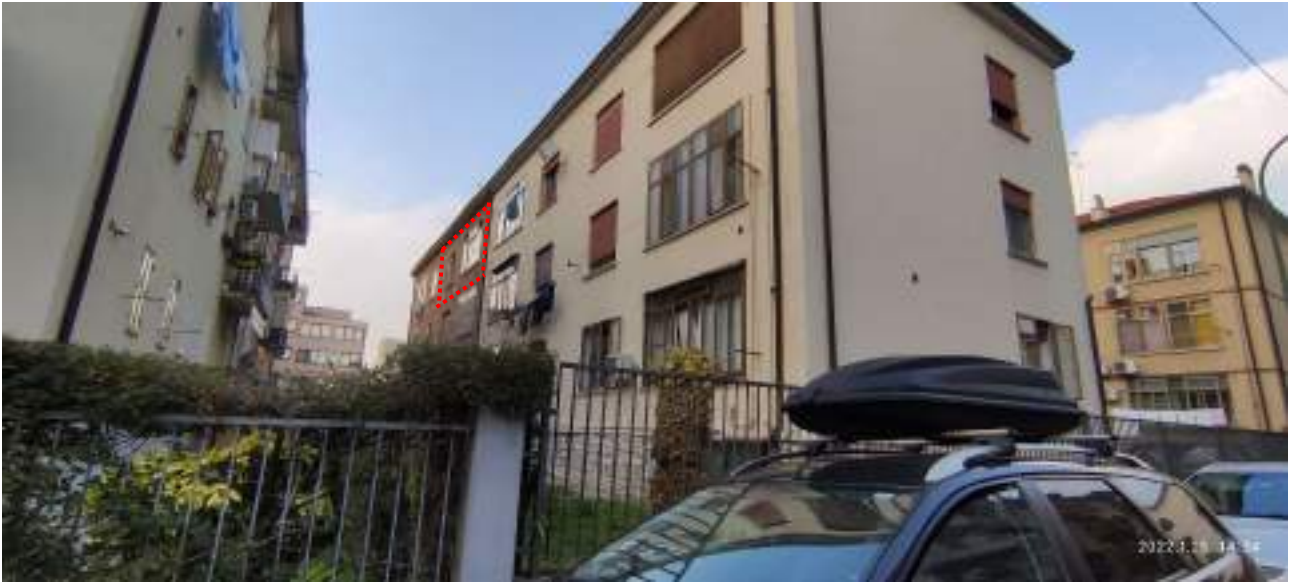
FOTO 1_PROSPETTI SUD/OVEST E SUD/EST DELLA PALAZZINA_DALLA VIA RUBICONE

PROCEDIMENTO N. 8153/2020 R.G. Tribunale Ordinario di Venezia G.I. DOTT. FILIPPONE PAOLO