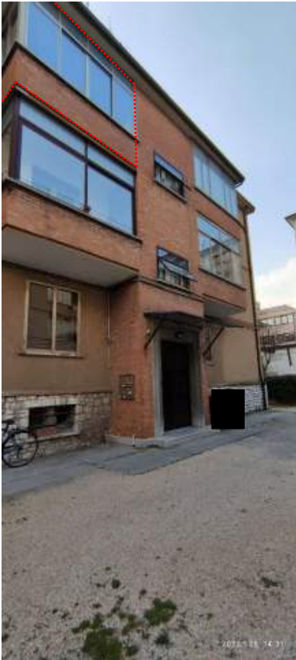
FOTO 3_SCALA DI INGRESSO SU PROSPETTO NORD/EST