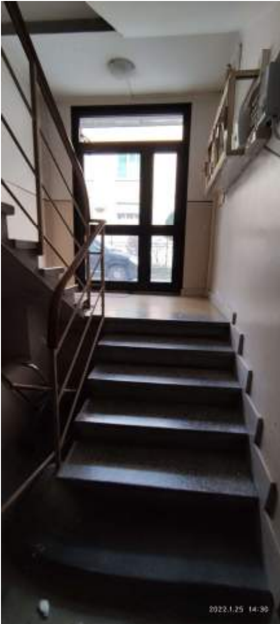
FOTO 19_SCALE VERSO IL PIANO SEMINTERRATO