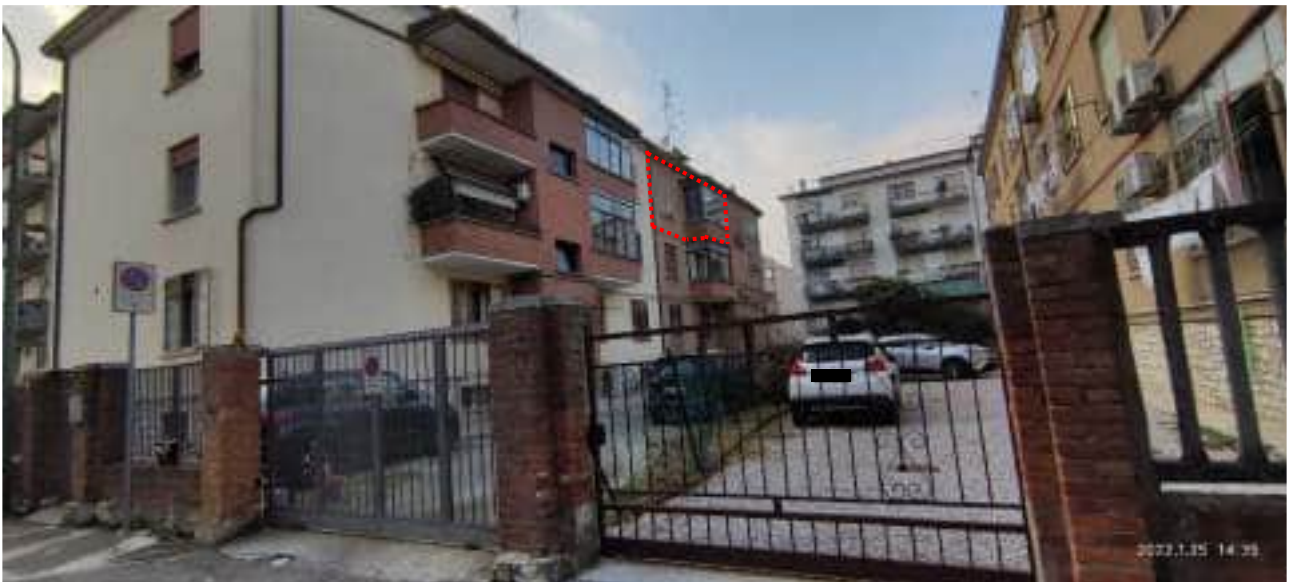
FOTO 2_PROSPETTI SUD/EST E NORD/EST DELLA PALAZZINA_DALLA VIA RUBICONE