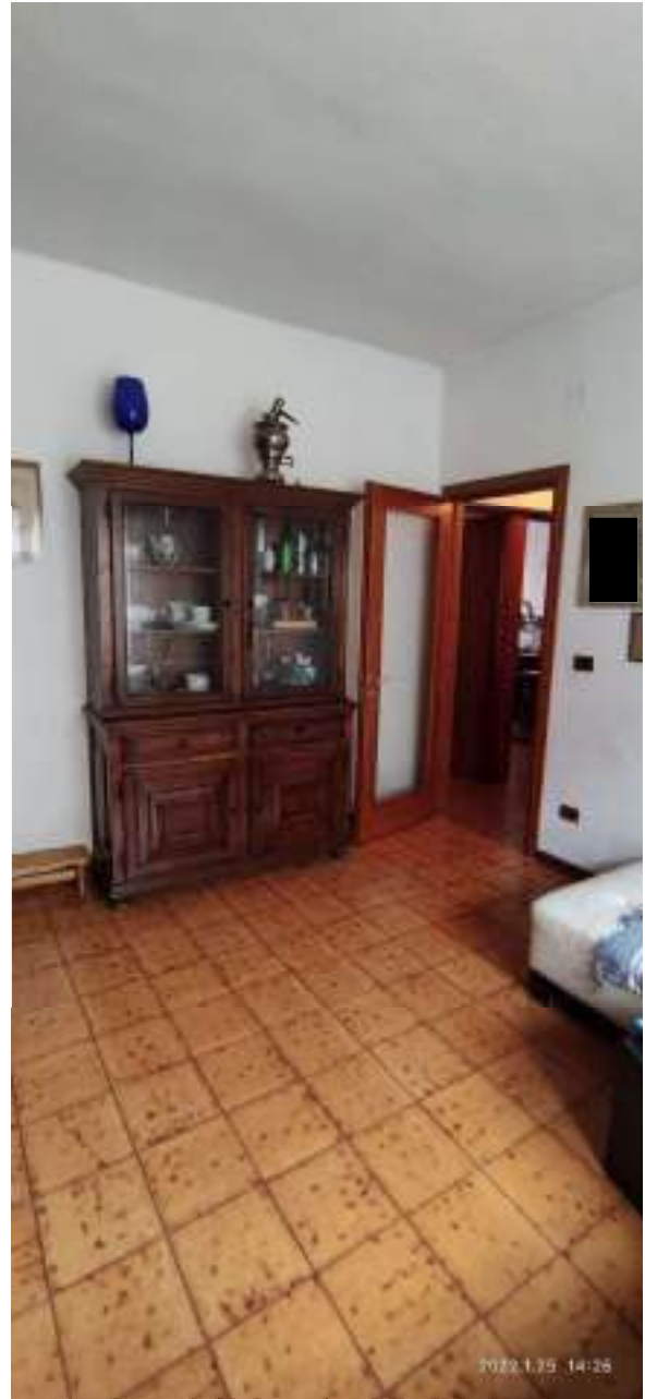
FOTO 8_SOGGIORNO_VISTA VERSO DISIMPEGNO