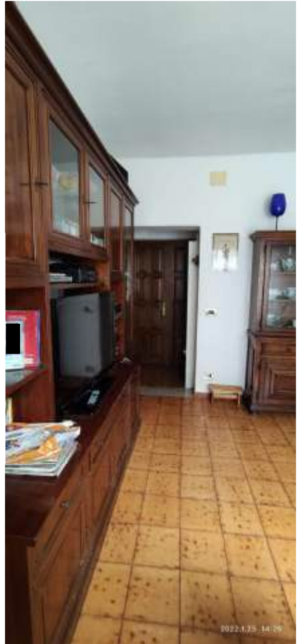
FOTO 6_SOGGIORNO_VISTA VERSO INGRESSO