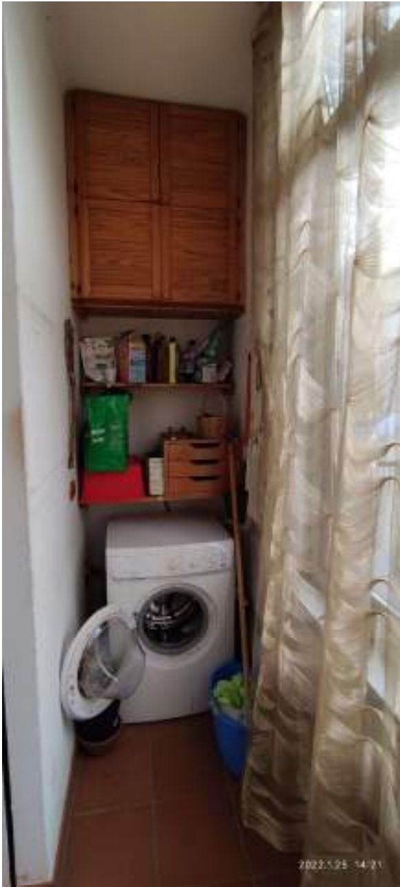
FOTO 15_VERANDA SU CUCINA