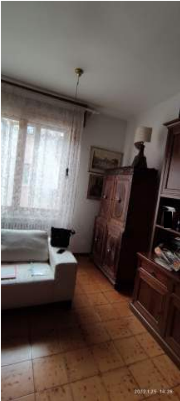
FOTO 7_SOGGIORNO_VISTA VERSO LATO SUD/OVEST