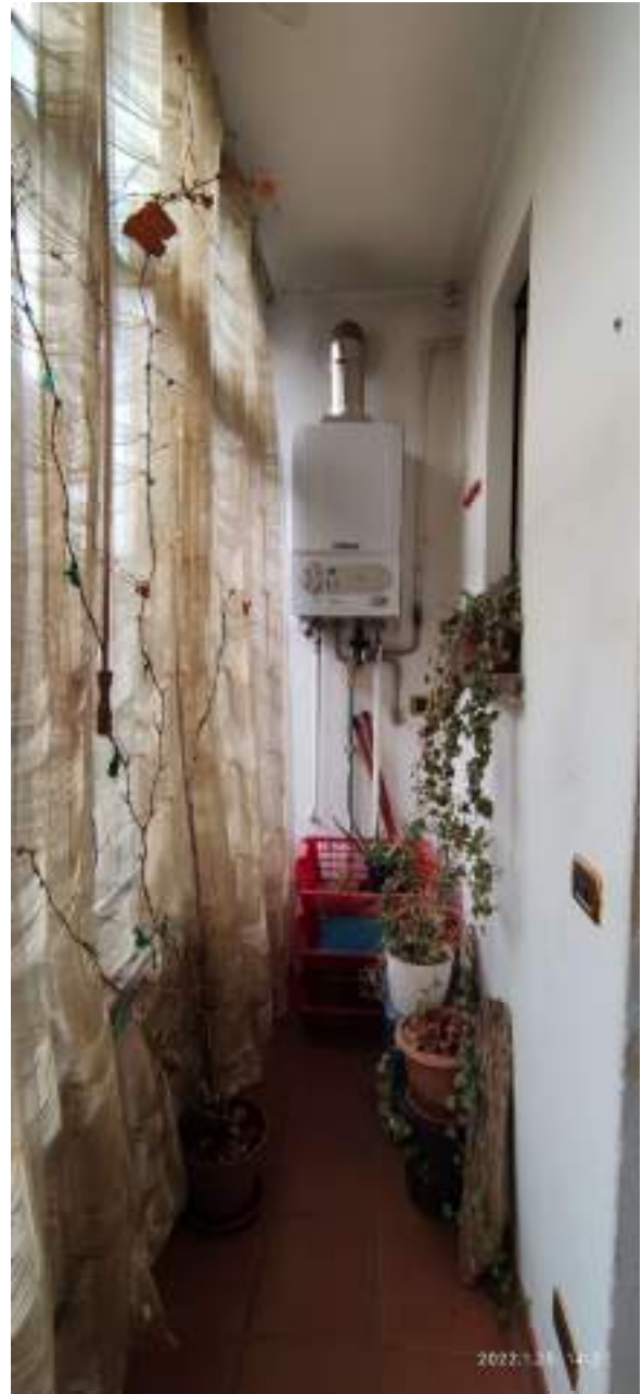
FOTO 16_VERANDA SU CUCINA