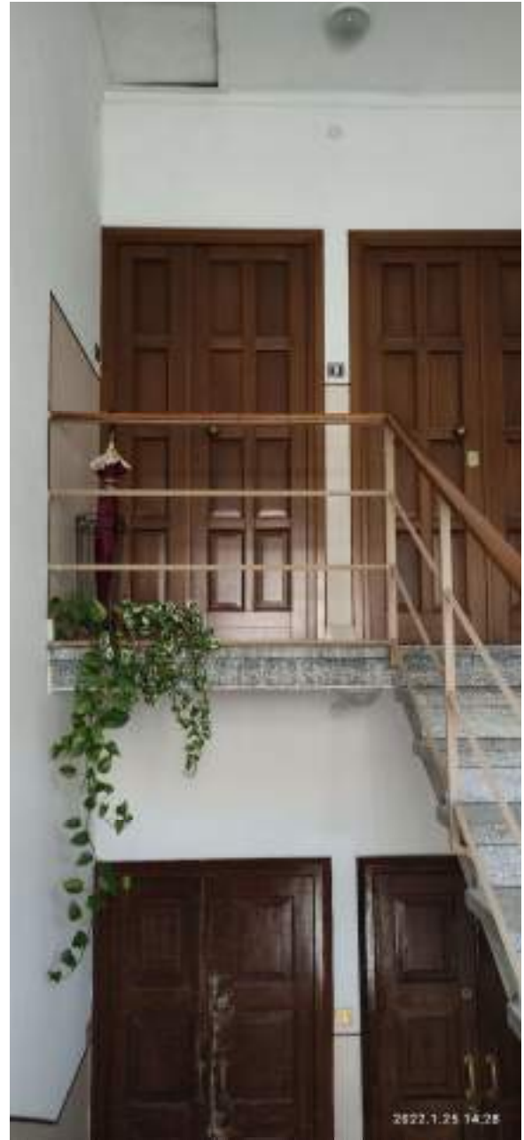
FOTO 4_PORTONCINO DI ARRIVO AL PIANO SECONDO