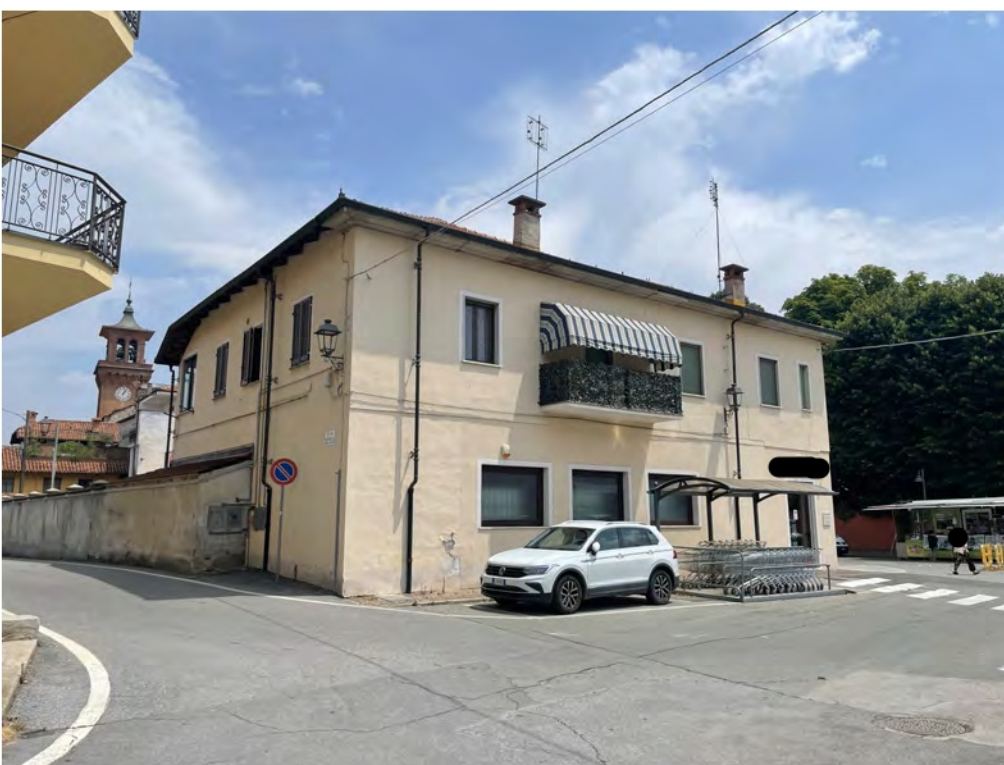
Fotografia n° 5 - Vista della facciata su incrocio tra Corso Sacco e Vanzetti e Via Castello