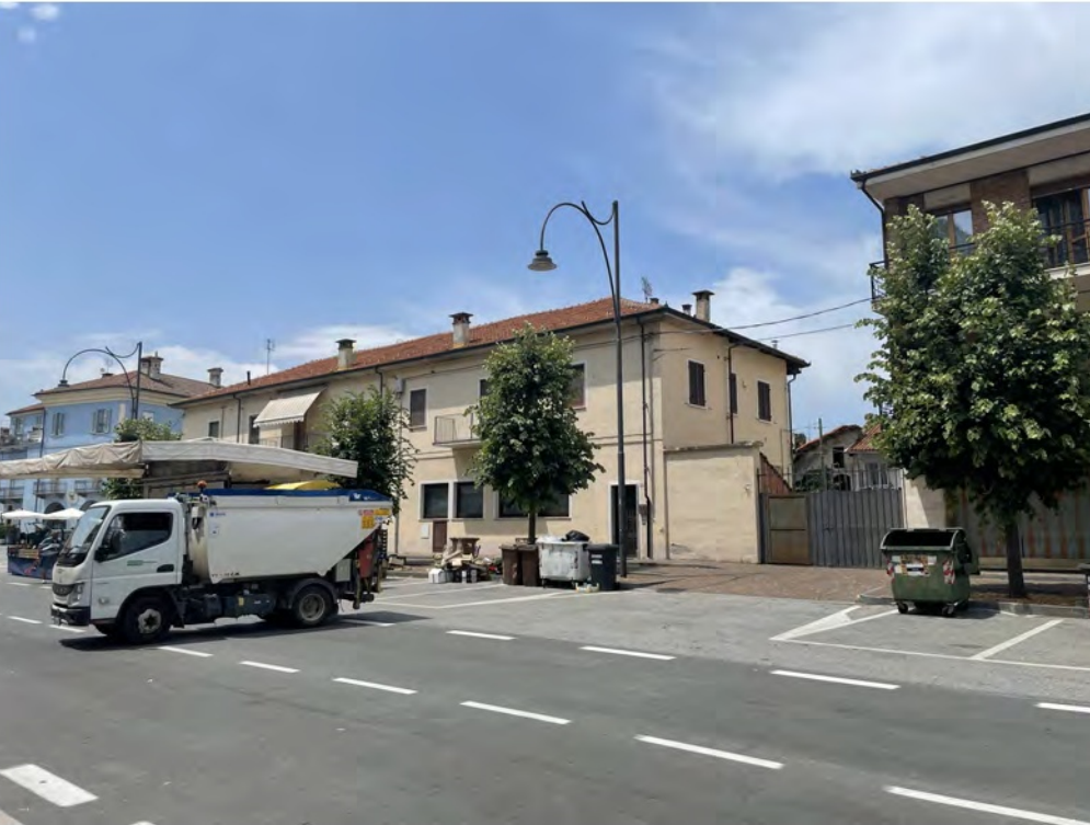
Fotografia n° 3 - Vista della facciata principale dal Corso Sacco e Vanzetti (lato accesso cortile)