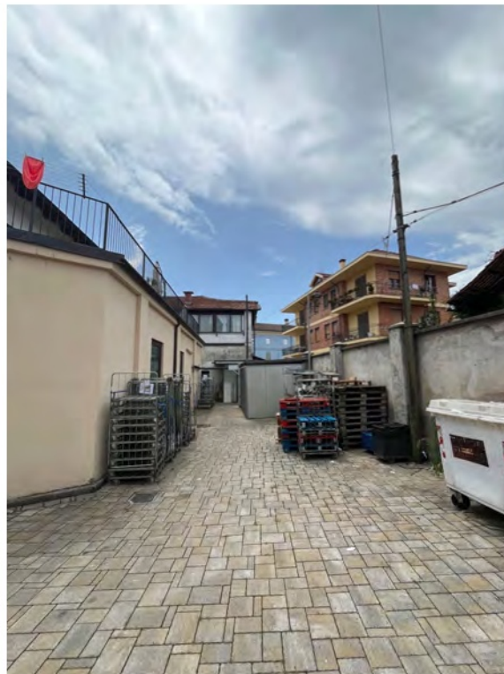
Fotografia n° 8 - Interno cortile vista sul retro-negozio