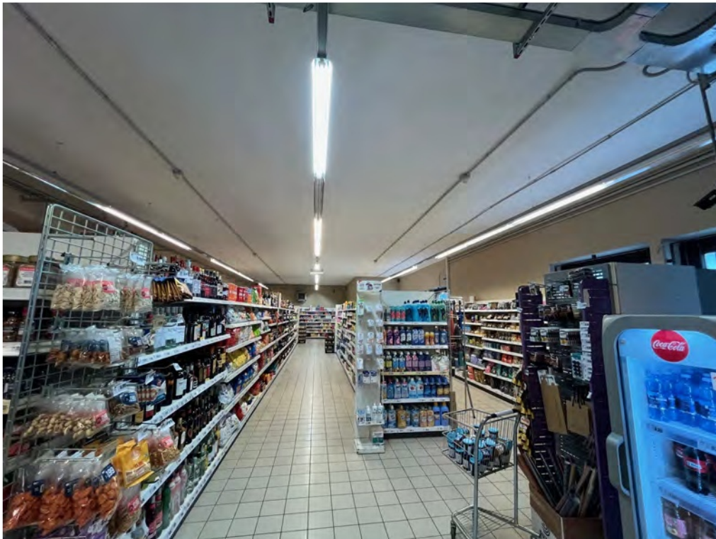
Fotografia n° 11 - Vista interna dettaglio degli allestimenti