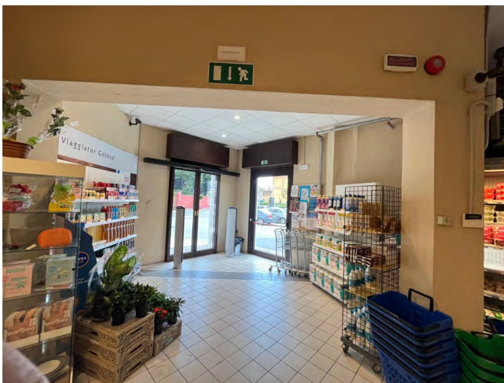
Fotografia n° 9 - Vista interna dettaglio dell'atrio d'accesso