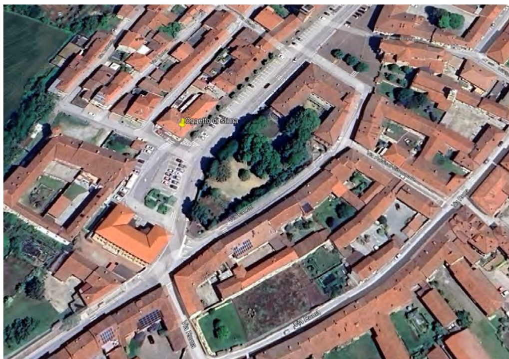
Fotografia n° 2 - Vista aerea di dettaglio