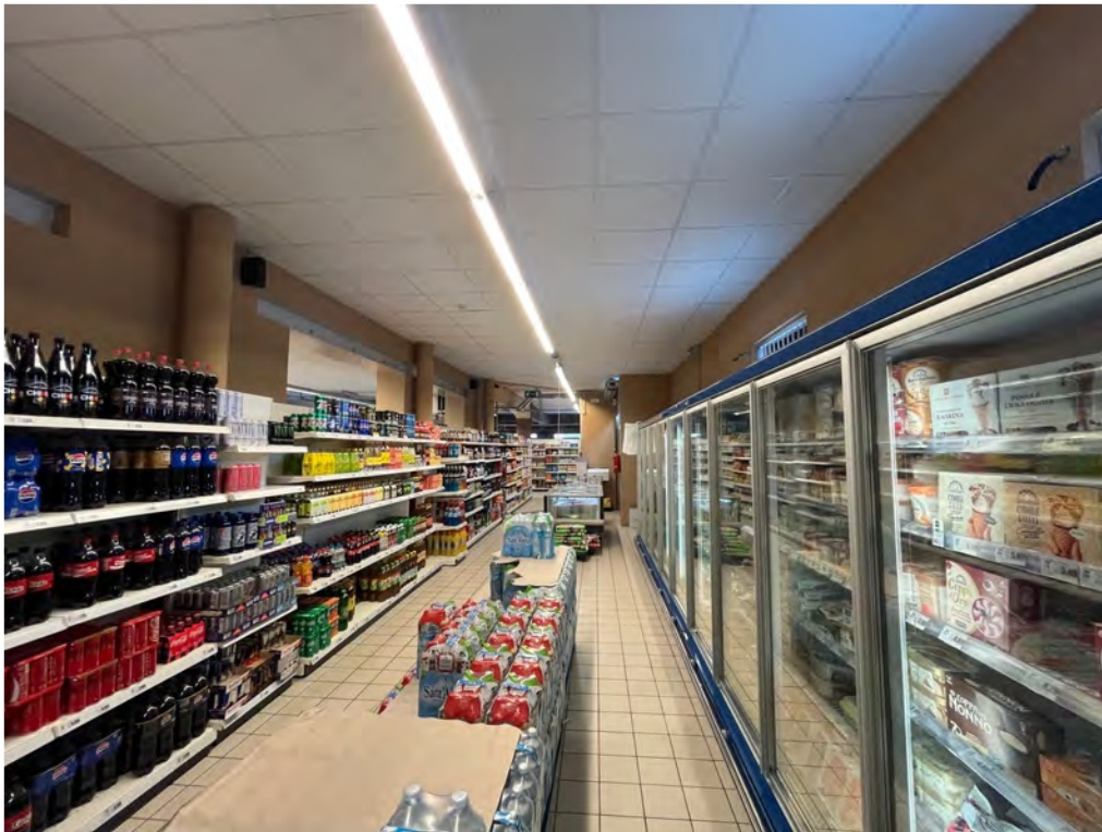
Fotografia n° 12 - Vista interna dettaglio degli allestimenti