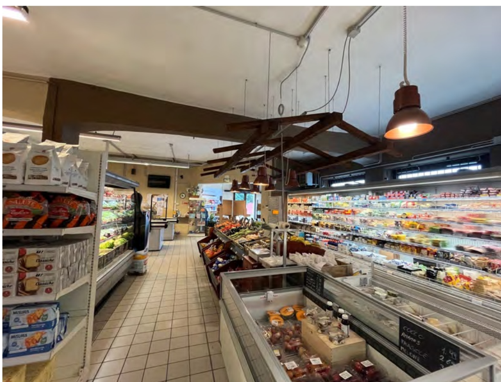
Fotografia n° 10 - Vista interna dettaglio degli allestimenti