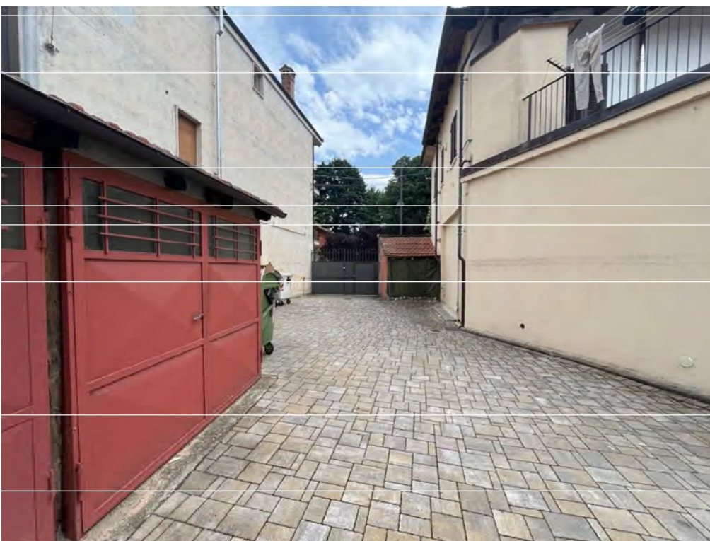
Fotografia n° 7 - Interno cortile vista su accesso carraio