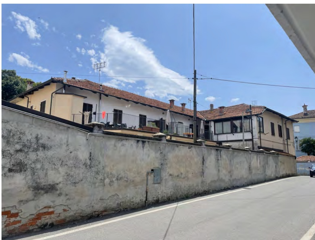
Fotografia n° 6 - Vista della recinzione del cortile su Via Castello