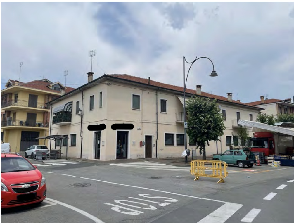
Fotografia n° 4 - Vista della facciata principale dal Corso Sacco e Vanzetti (lato accesso negozio)