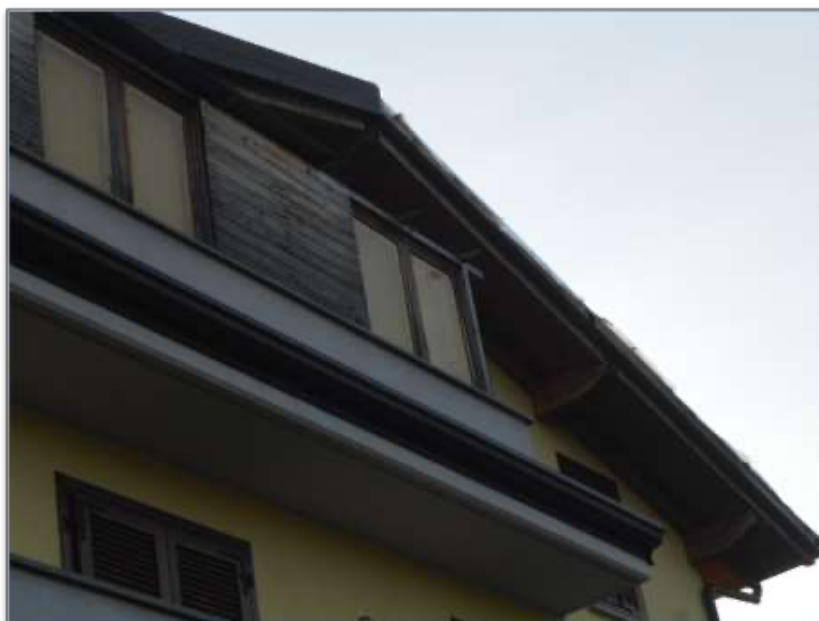
Foto 12 parte di tetto con gronda mancante