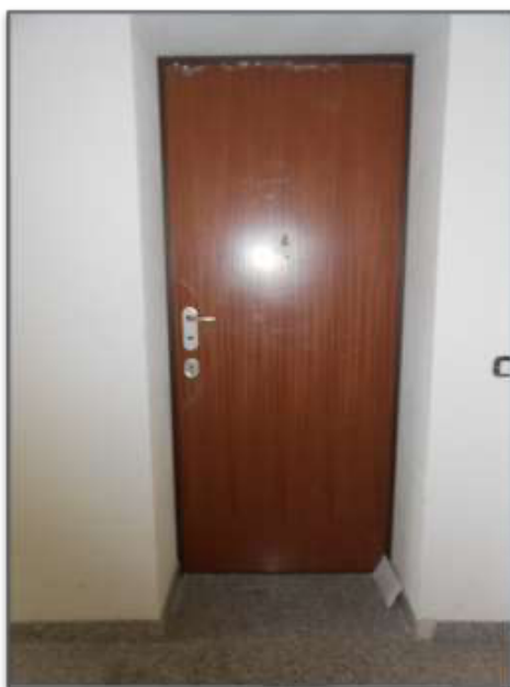
Foto 1 ingresso all'immobile