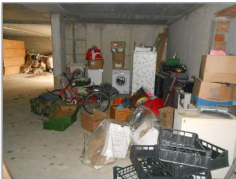
Foto 1 spazio dove dovrebbero esserci i magazzini/cantine