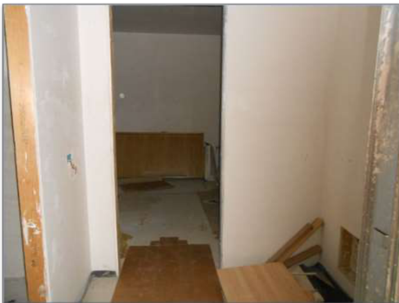
Foto 5 disimpegno