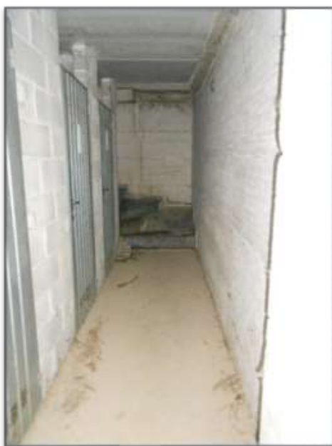
Foto 15 parti comuni