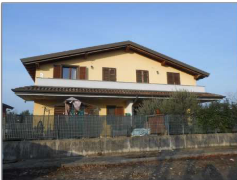
Foto 1 vista dell'edificio