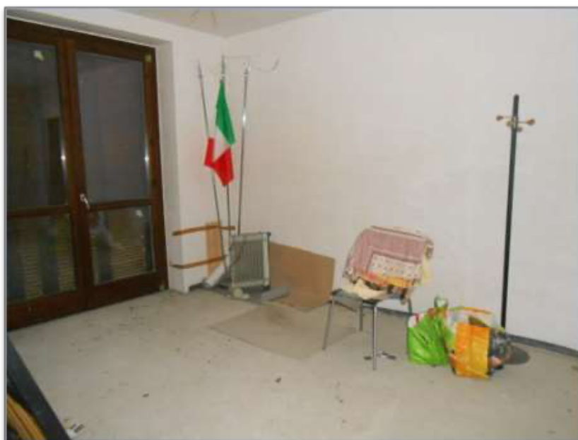
Foto 2 soggiorno