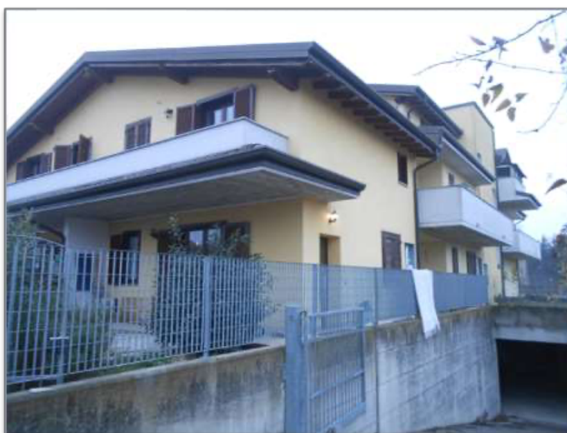
Foto 2 vista dell'edificio