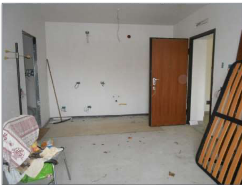
Foto 3 angolo cottura