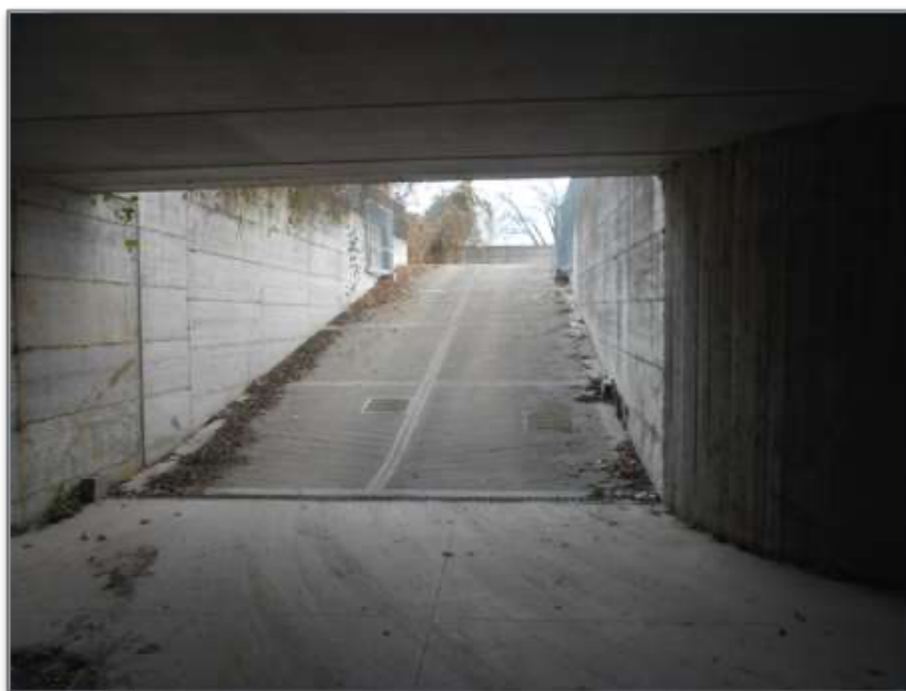
Foto 13 rampa dei box