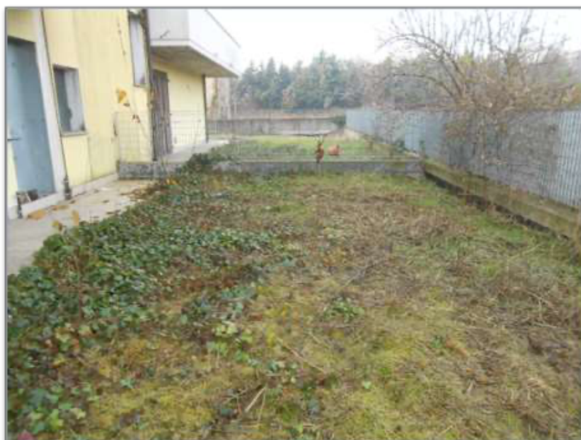
Foto 8 giardino