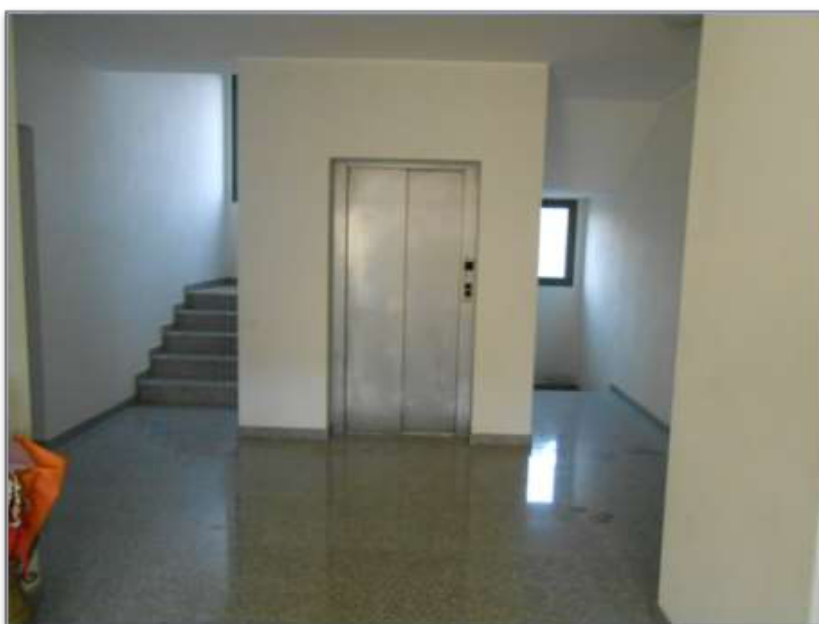
Foto 6 parti comuni