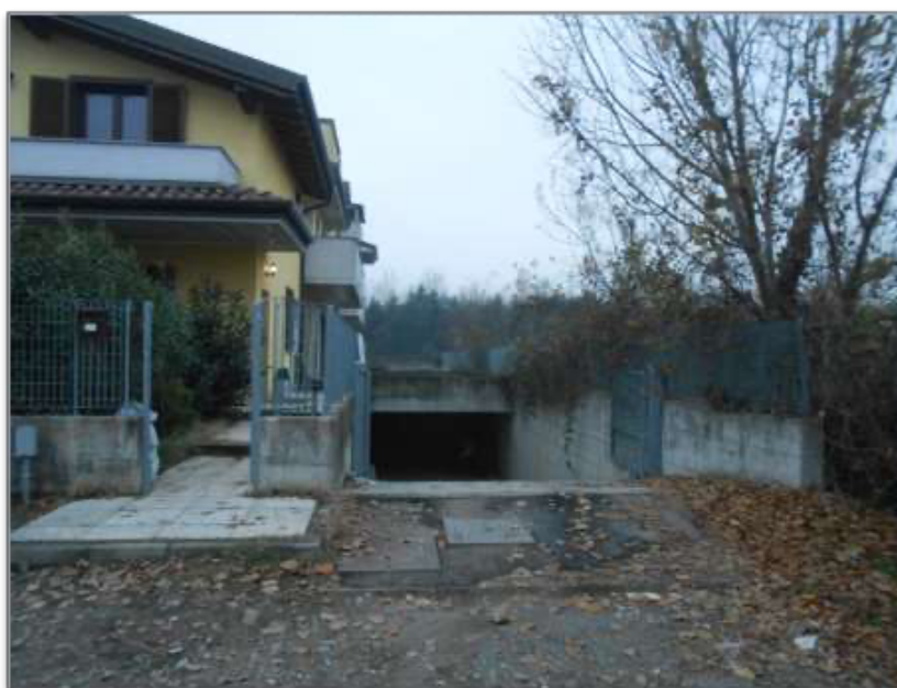
Foto 4 ingresso carrabile