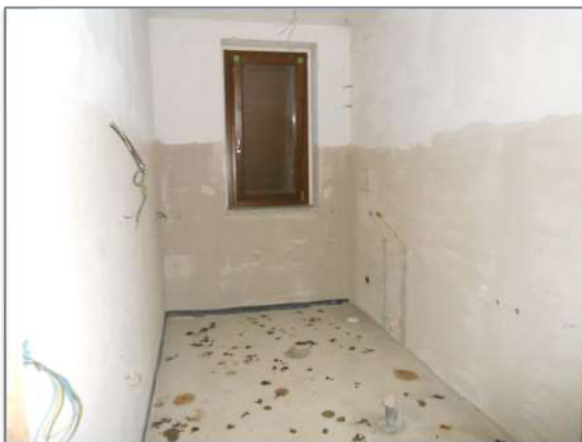
Foto 6 bagno