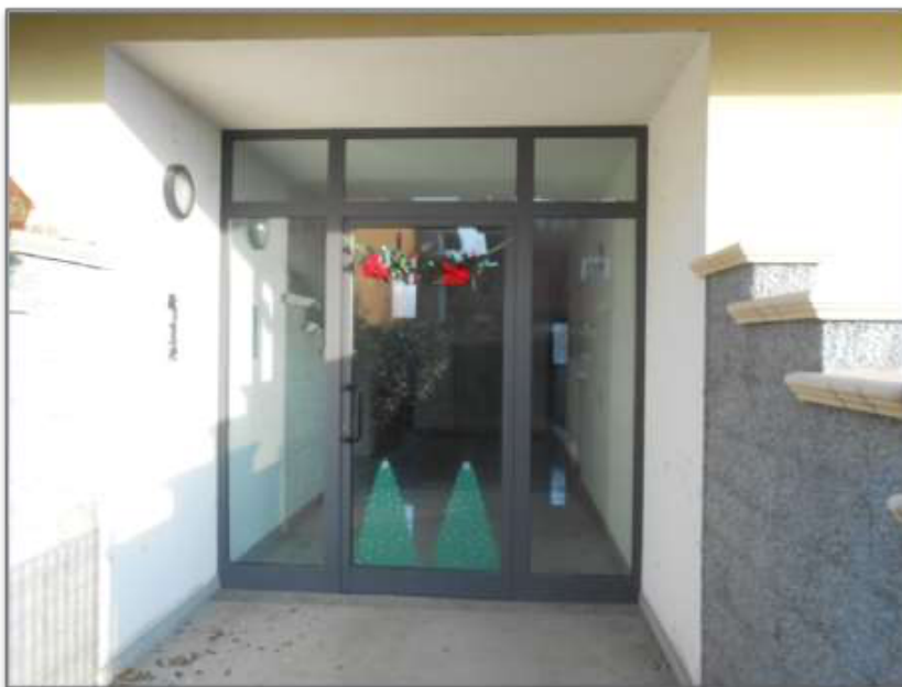
Foto 5 porta ingresso al condominio