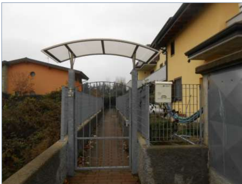
Foto 3 ingresso pedonale