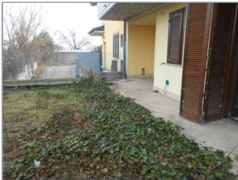
Foto 7 giardino