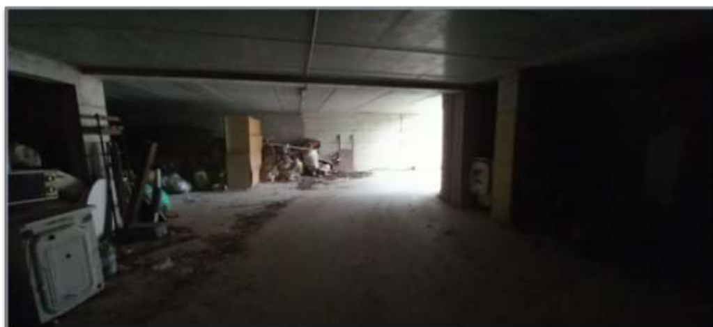
Foto 14 parti comuni