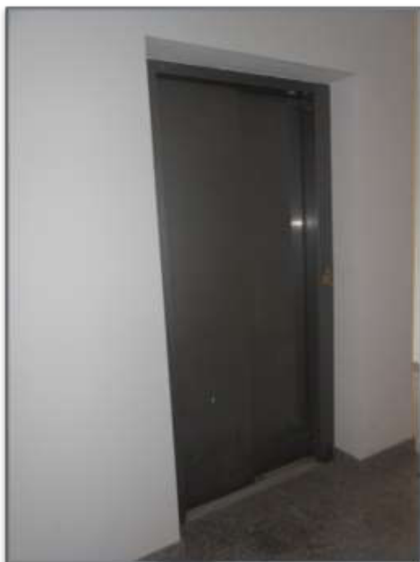
Foto 7 parti comuni