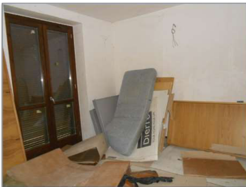
Foto 4 camera