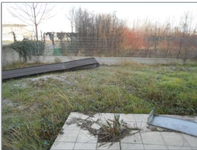
Foto 11 parte della gronda finita nel giardino sub. 5