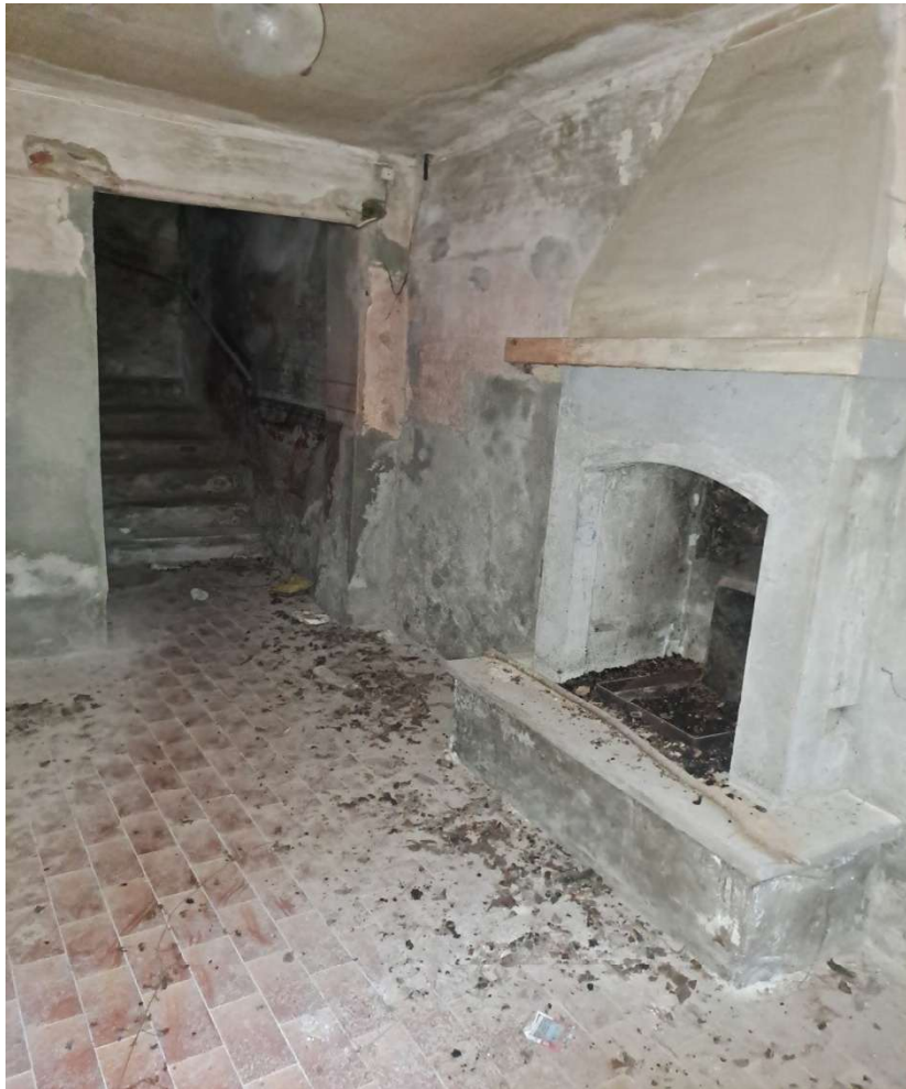
Locale ingresso al piano terra con vano scala per l'accesso ai piani superiori