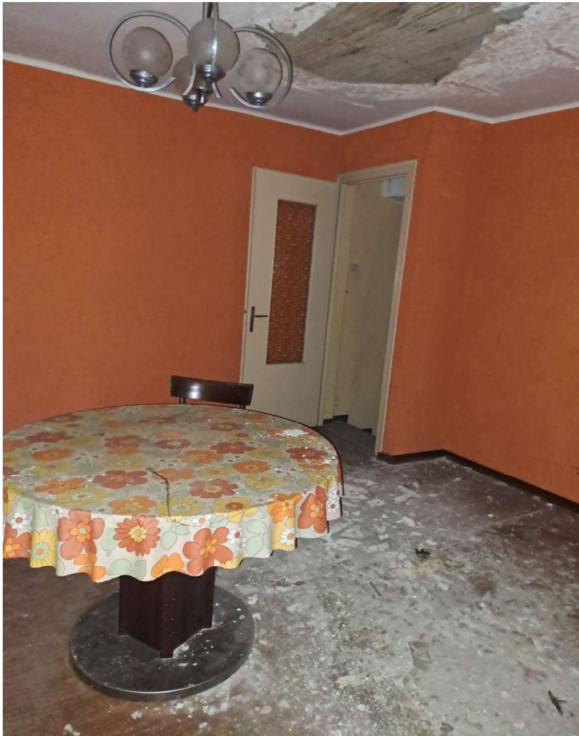
Camera al primo piano