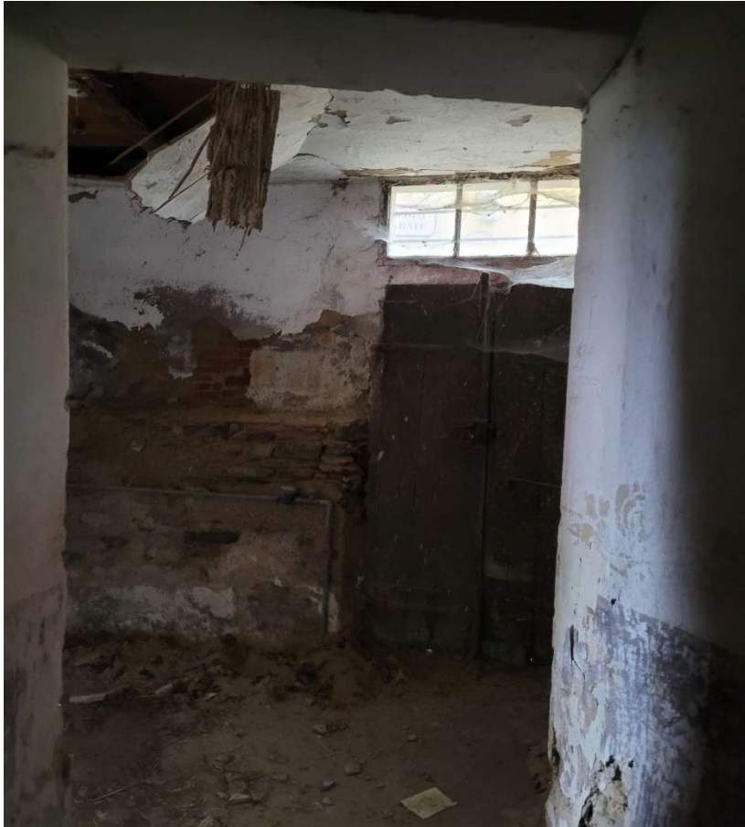
Locale ripostiglio al piano terra