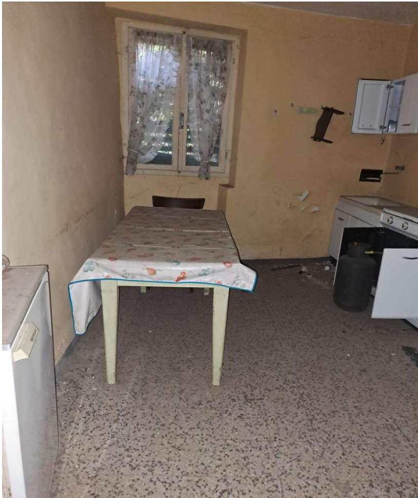
Locale cucina al primo piano