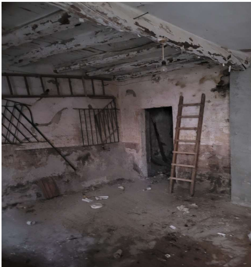
Locale di sgombero al piano terra