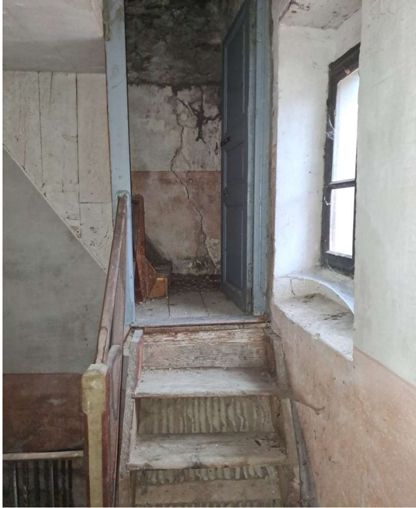
Scala di accesso al piano sottotetto