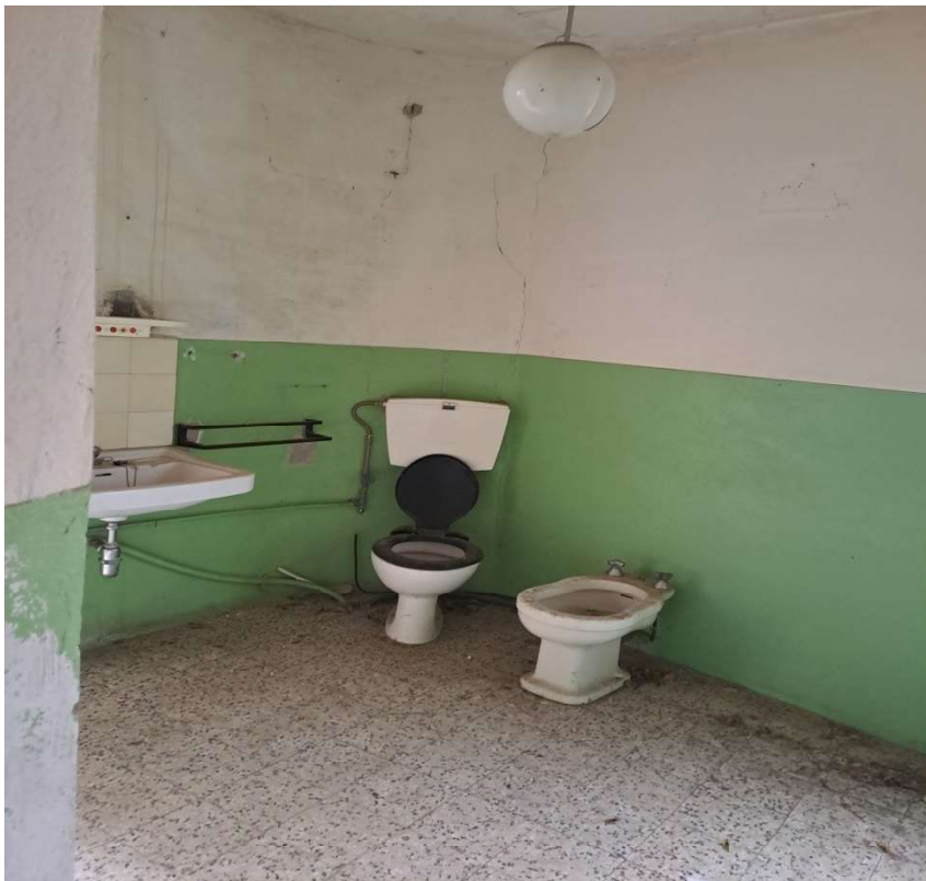
Locale wc al primo piano