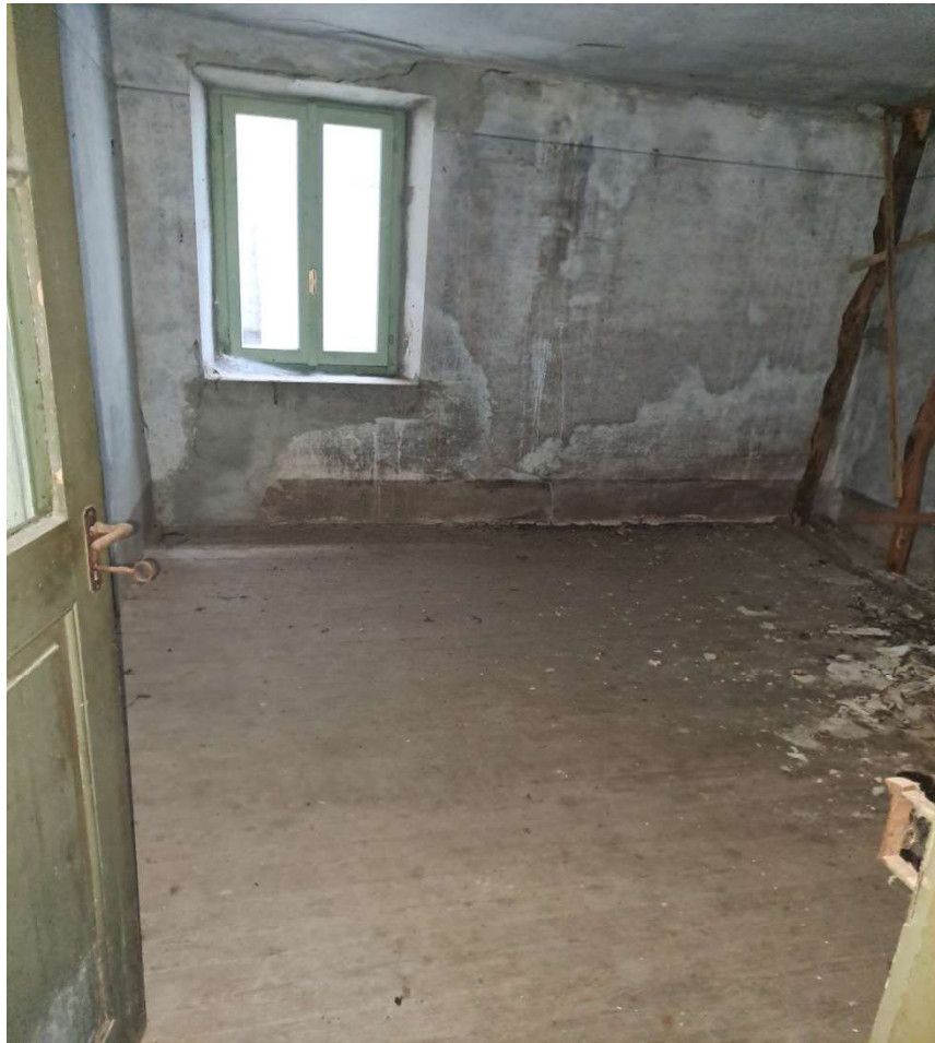
Camera al piano secondo