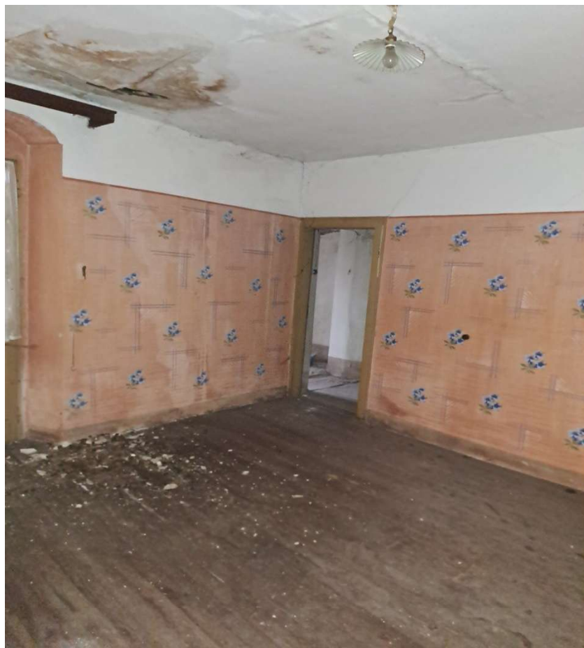
Camera al piano secondo