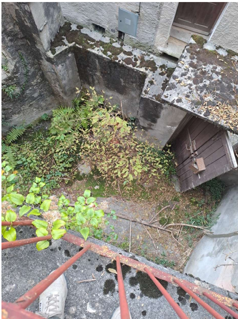
Vista del cortile interno con portoncino d'ingresso, dal balcone del primo piano