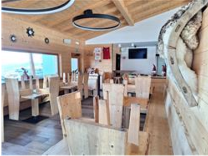
Vista dall'interno del fabbricato

I beni sono ubicati in zona rurale in un'area sportiva, le zone limitrofe si trovano in un'area agricola (i più importanti centri limitrofi sono Nova Levante). Il traffico nella zona è locale, i parcheggi sono buoni. Sono inoltre presenti i servizi di urbanizzazione primaria e secondaria, le seguenti attrazioni storico paesaggistiche: Sciliar.