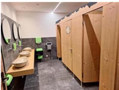
Servizi igienici al piano scantinato