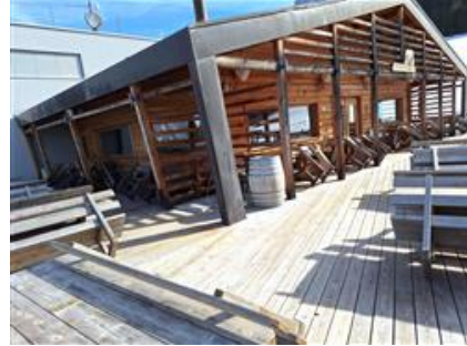
Vista verso la cabinovia