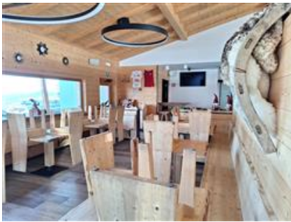
Saletta ristorante al piano terra

L'intero edificio sviluppa 3 piani, 2 piani fuori terra, 1 piano interrato. Immobile costruito nel 2016.