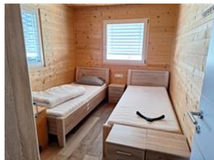
Camera per il personale al 1. piano