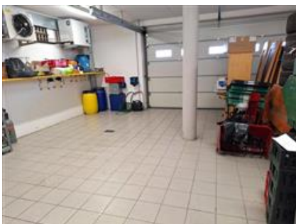
Garage sub 3 al Piano Scantinato