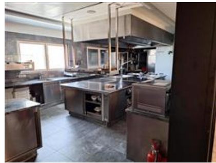
Cucina al Piano Terra