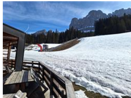
Area pertinenziale verso la pista da sci