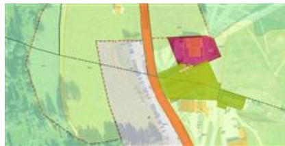
Estratto dal PUC