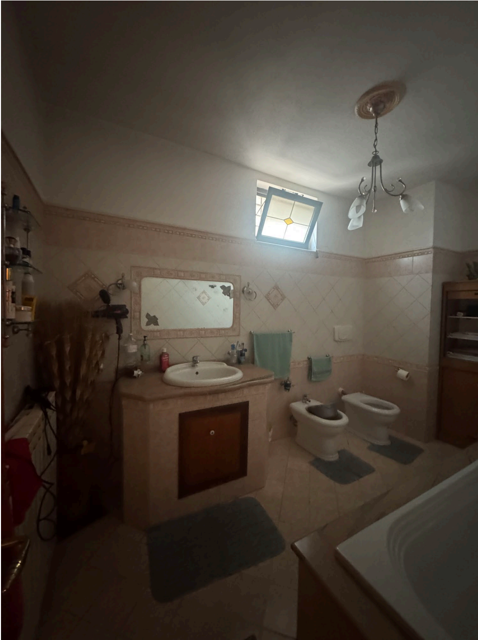
Bagno piano primo (sub 2)