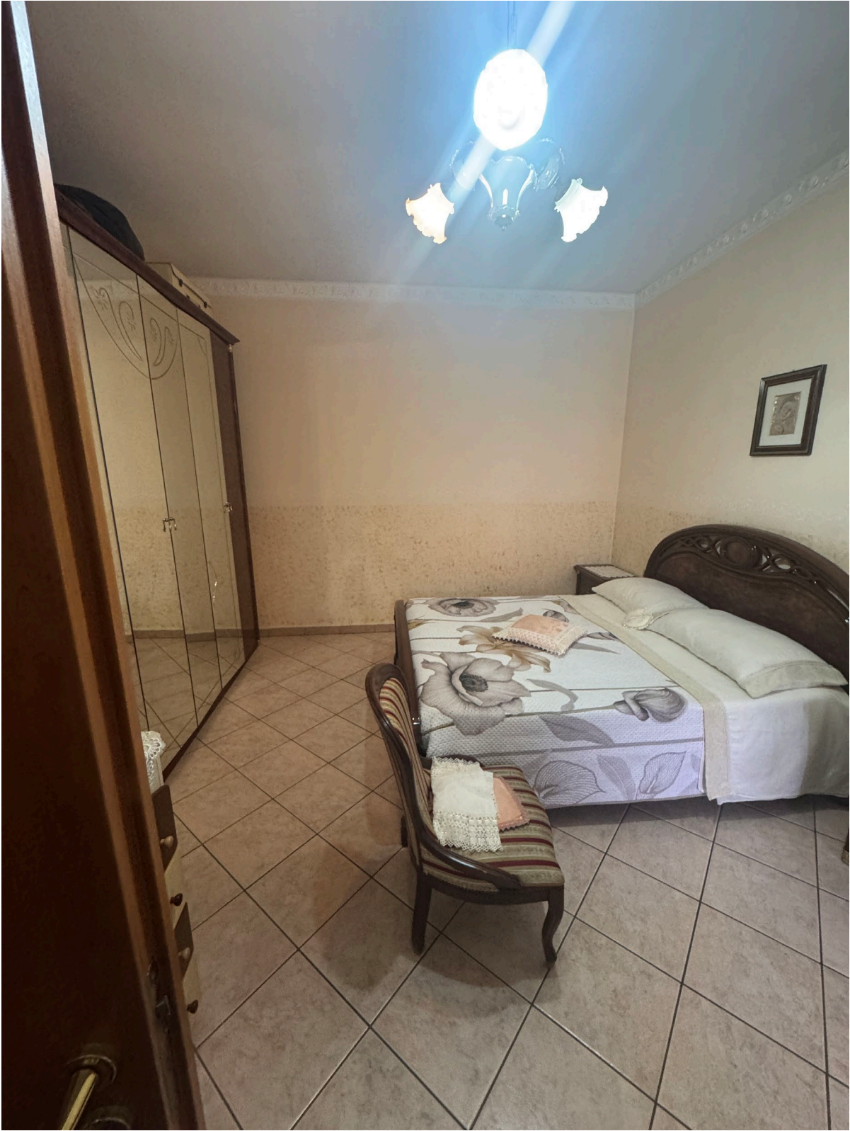
Camera piano primo (sub 2)