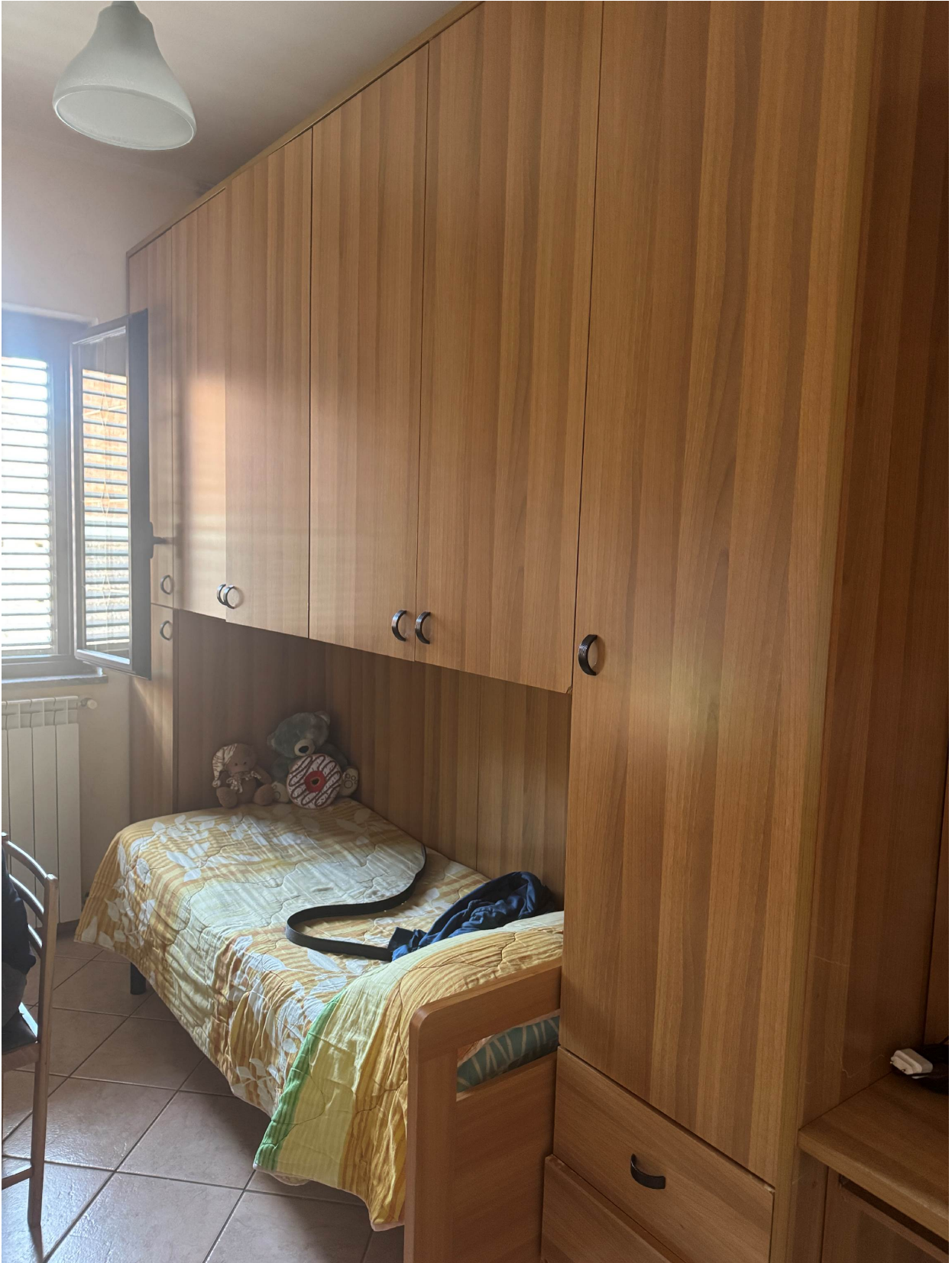
Camera piano primo (sub 2)