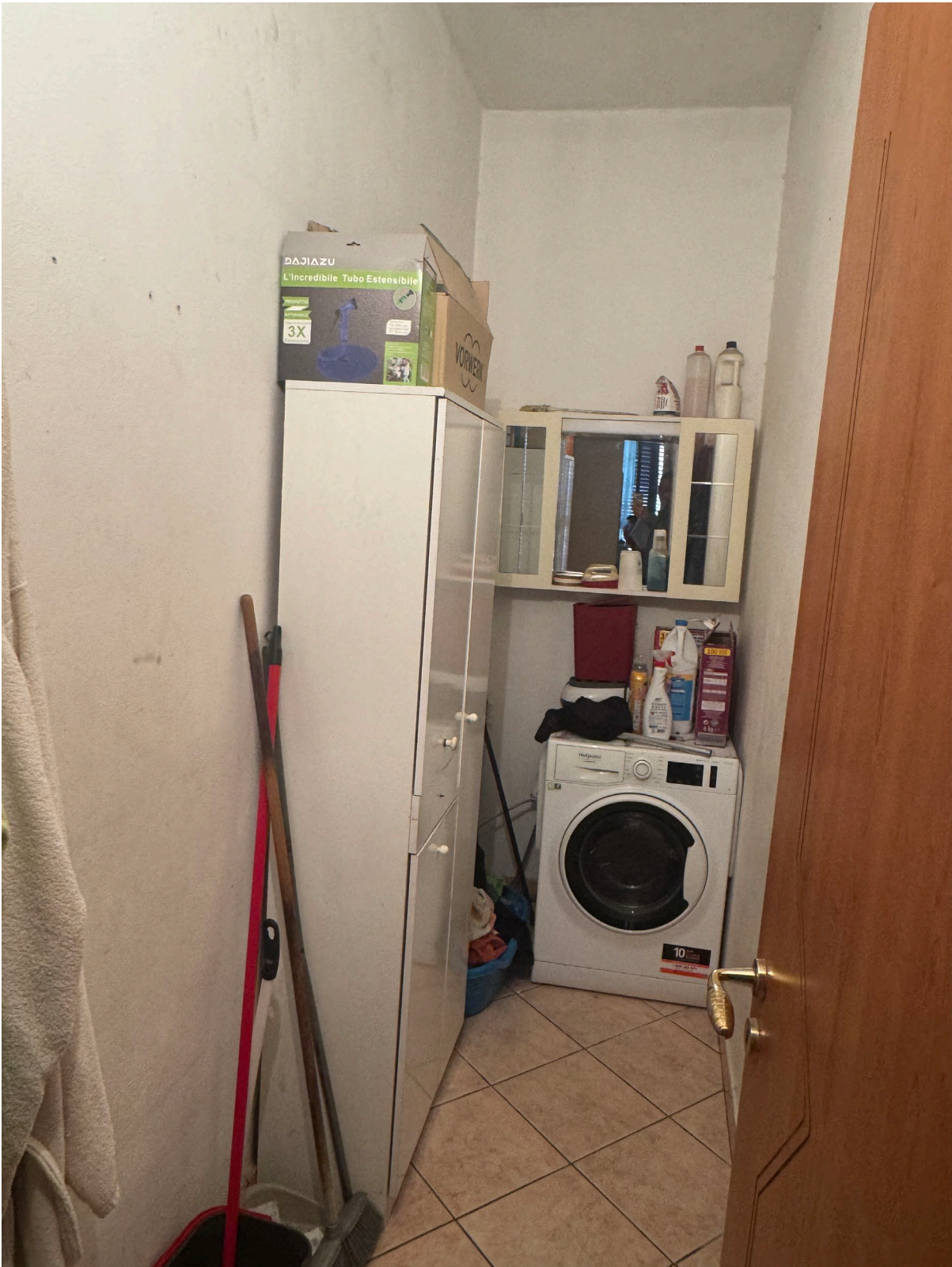
Ripostiglio piano primo (sub 2)