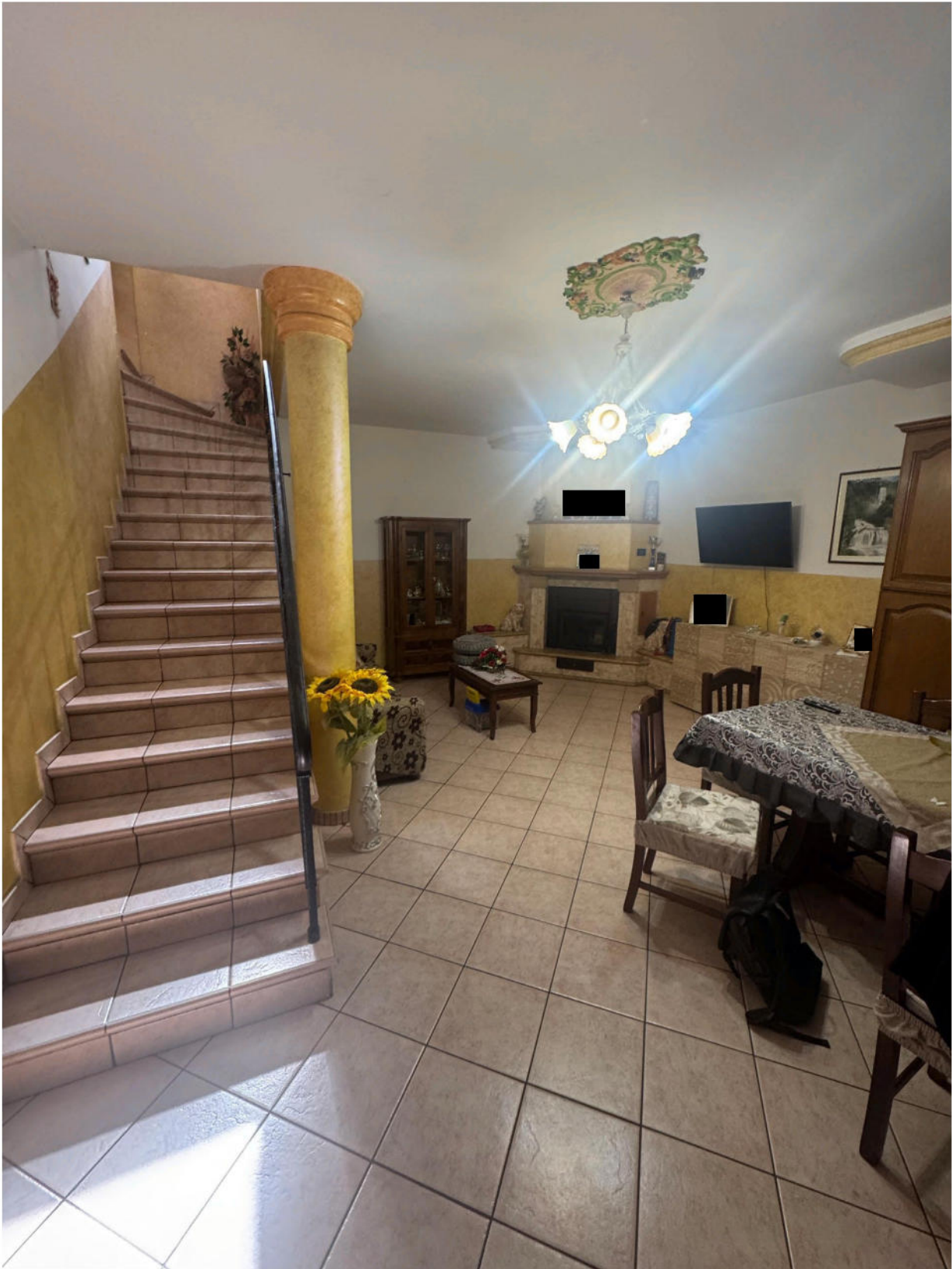
Cucina Piano terra (sub 3)