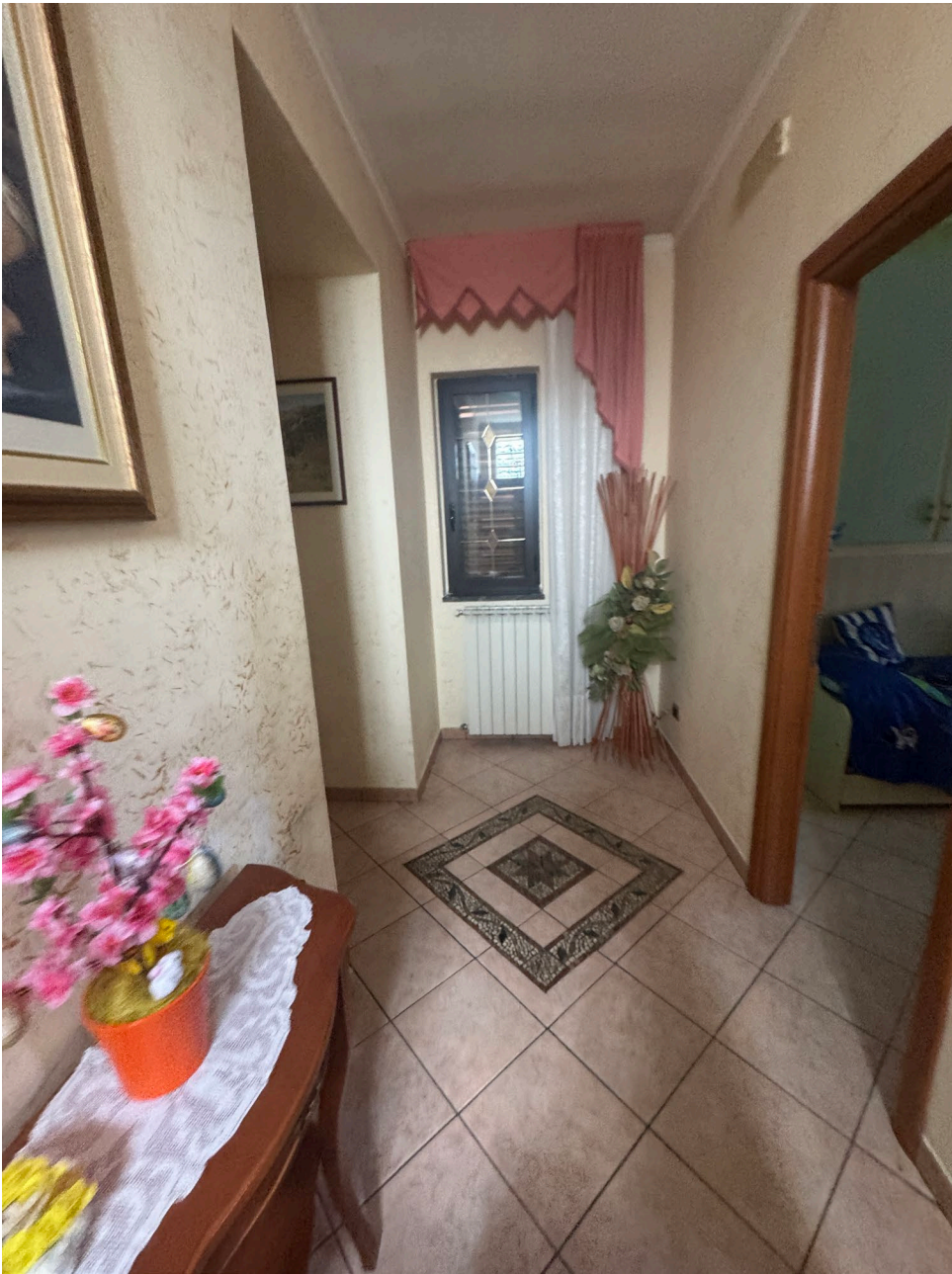
Corridoio-disimpegno (sub 2)