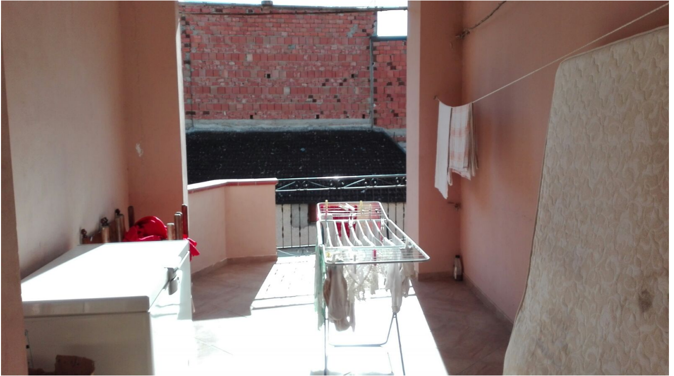
Terrazzo ove sono presenti le difformità (sub 2)