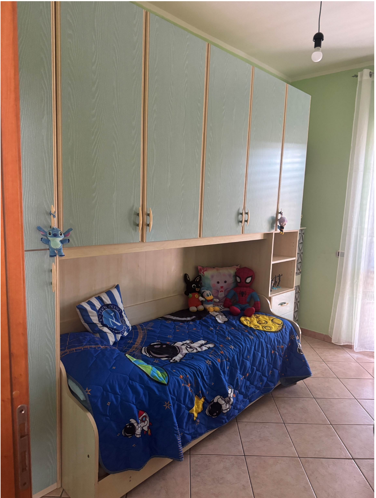
Camera piano primo (sub 2)