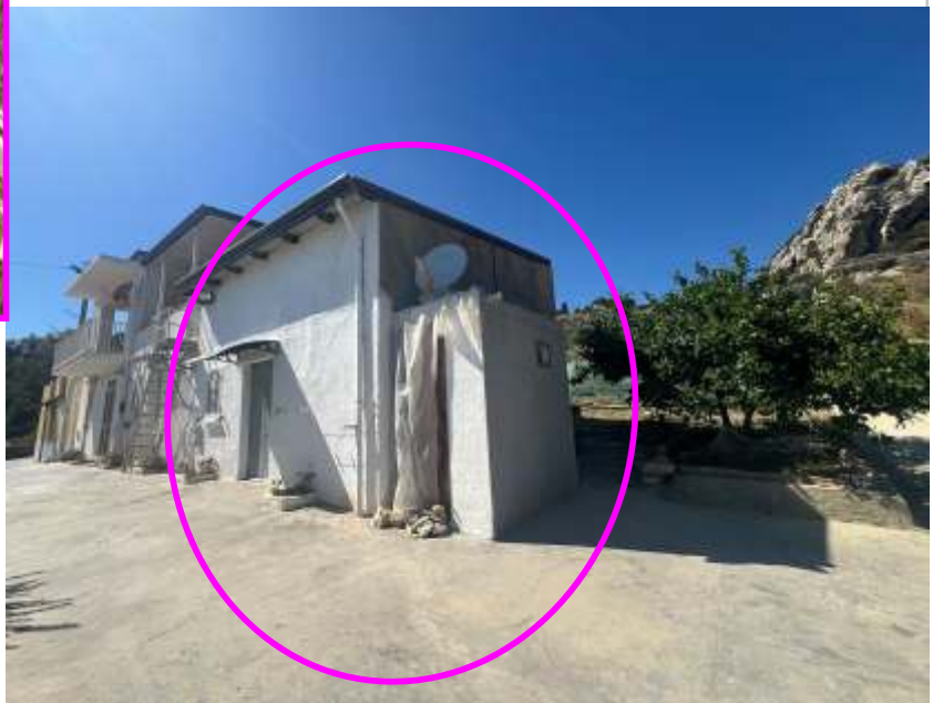
VISTA ESTERNA FABBRICATO P.LLA 635 SUB.5