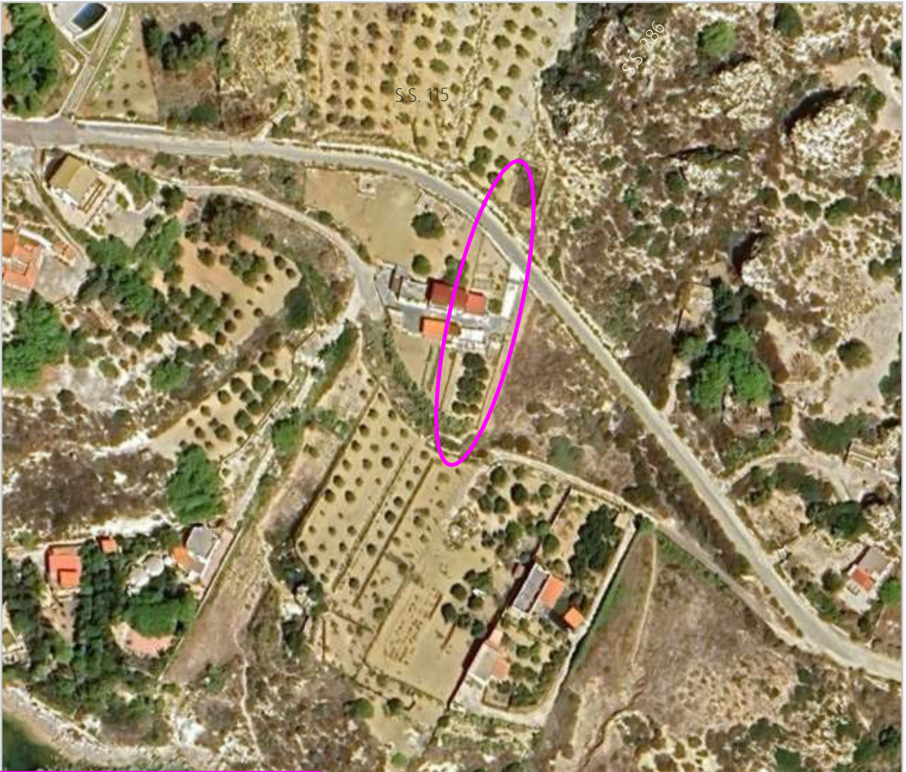
ORTOFOTO INDIVIDUAZIONE FONDO ED IDENTIFICAZIONE DEL FABBRICATO