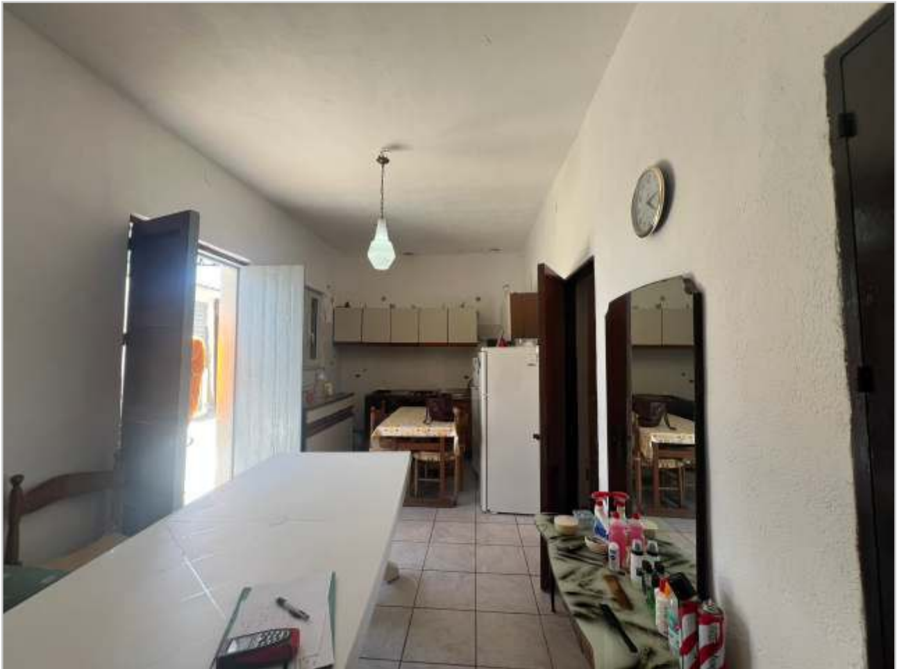
VISTE INTERNE - VANO SOGGIORNO/CUCINA