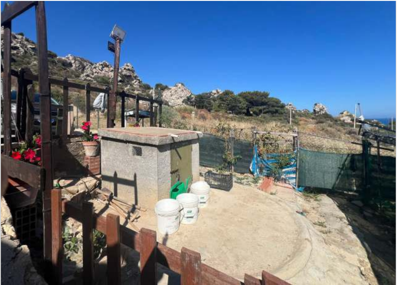
VISTE ESTERNE - AREA RISERVA IDRICA E FORNO