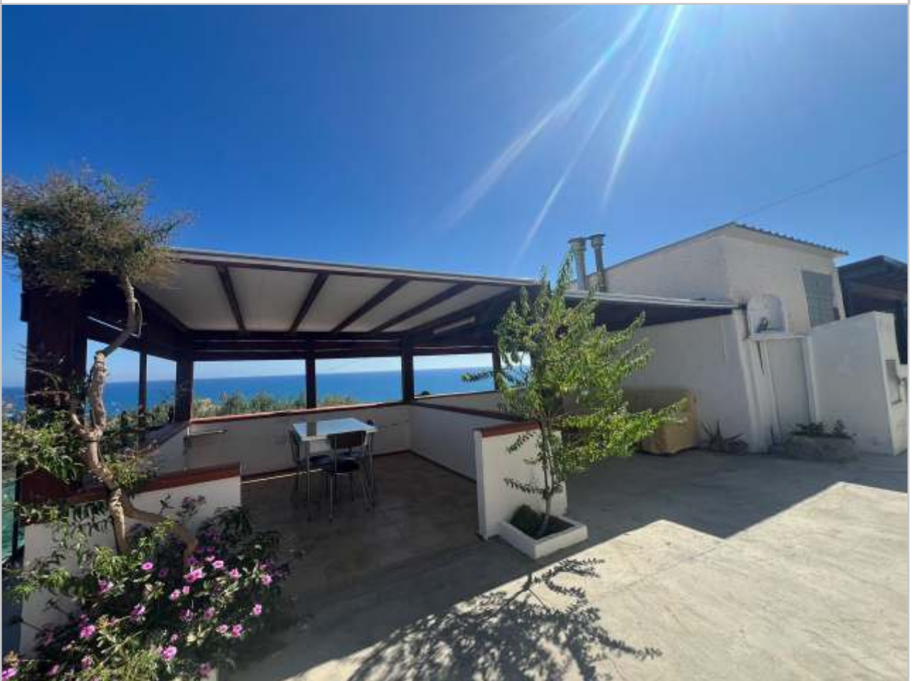
TETTOIA A SUD DEL FABBRICATO