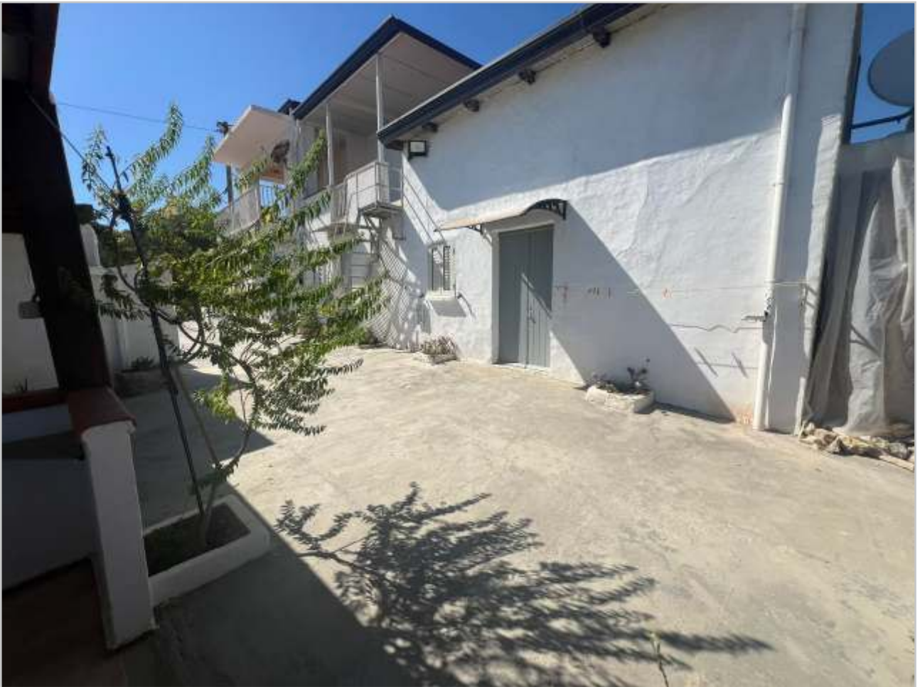
VISTA ESTERNA - PROSPETTO PRINCIPALE LATO SUD