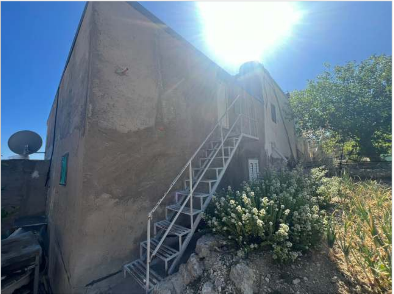
PROSPETTO LATO NORD - ACCESSO AL LOCALE PIANO SUPERIORE