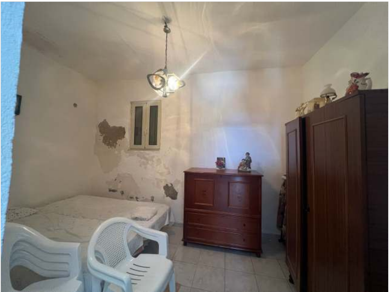
VISTE INTERNE - CAMERA E VANI SERVIZIO