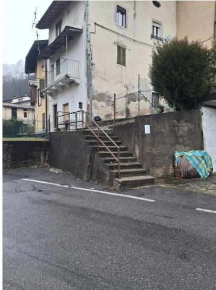
SCALA DI ACCESSO AL GIARDINO