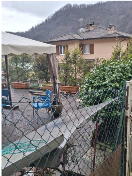
VISTA 1 GIARDINO