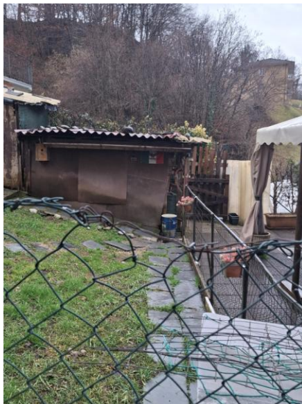
VISTA 2 GIARDINO