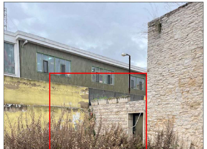
Porzione di fabbricato aderente al confine del lotto