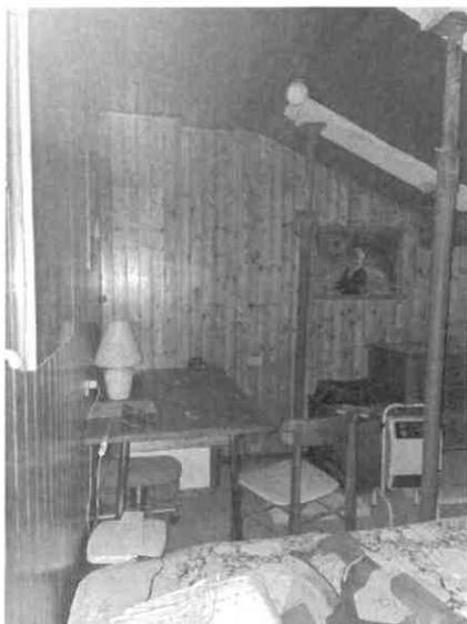
Piano secondo-piano secondo