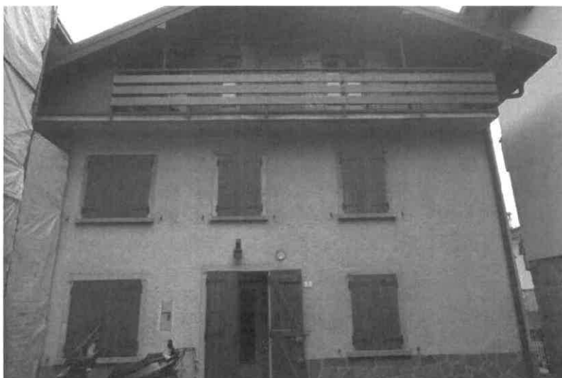
Fronte esterno Nord