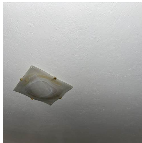
Fig. 16, 17 – Piano primo – camera: piano di calpestio e soffitto