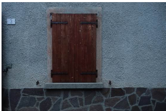
Fig. 3, 4- Piano terra – prospetto esterno Nord ed ingresso all'appartamento