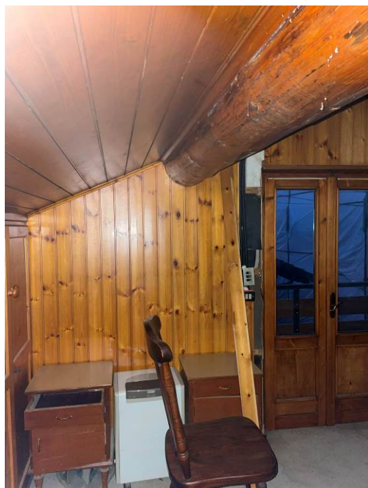
Fig. 24, 25 – Piano secondo – ambiente sottotetto