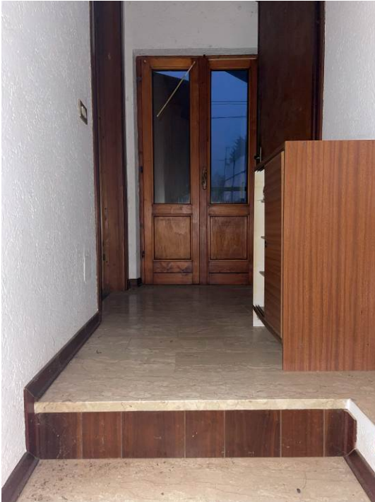
Fig. 23 – Piano secondo – disimpegno