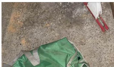
Fig. 30 – Piano secondo – ambiente soffitta: piano di calpestio