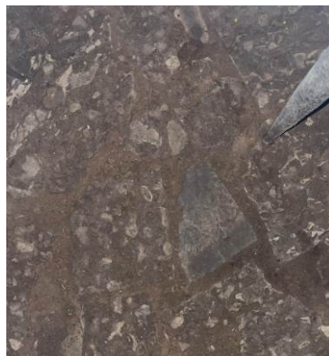
Fig. 34, 35– Piano interrato