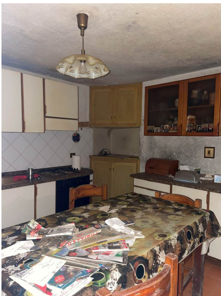
Fig. 5 – Piano terra – ambiente cucina-