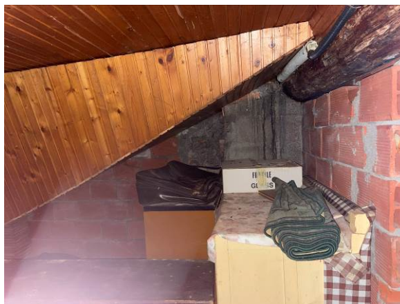
Fig. 28, 29 – Piano secondo – ambiente soffitta