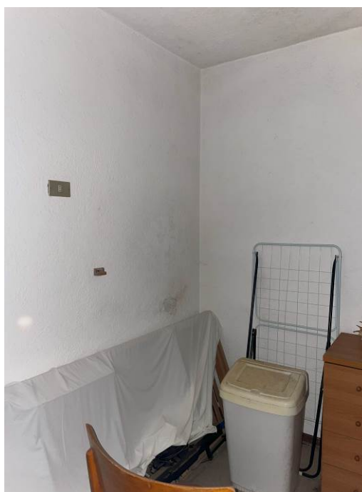
Fig. 19, 20 – Piano primo – ambiente Ripostiglio