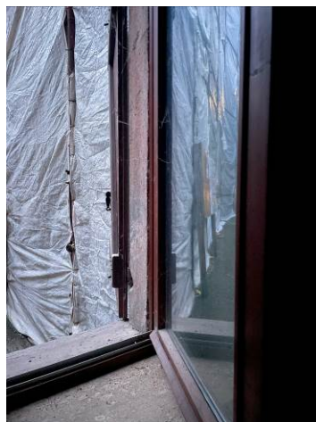
Fig. 11, 12 – Piano terra – ambiente soggiorno: piano di calpestio e dettaglio serramenti