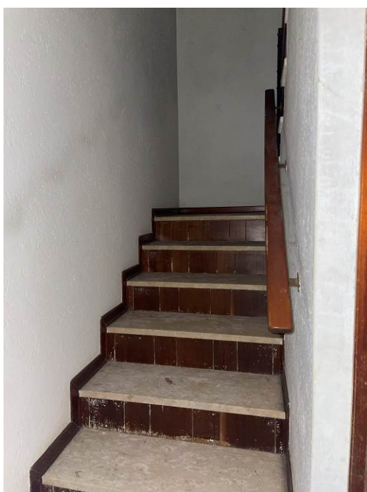
Fig. 13 – Vano scala piano terra-piano primo