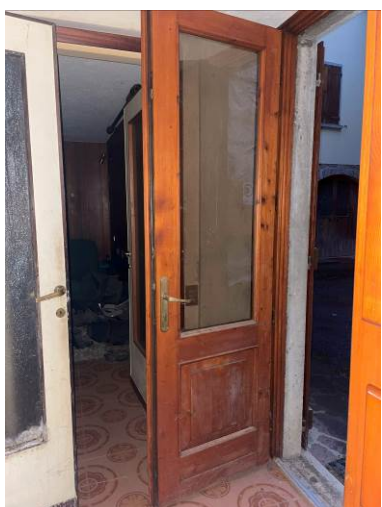
Fig. 8 – Piano terra – ingresso disimpegno