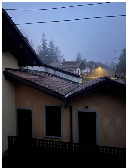
Fig. 26, 27 – Piano secondo – balcone e vista dal balcone