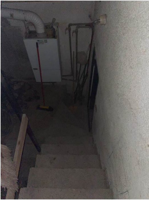
Fig. 31 – Vano scala piano terra-piano interrato