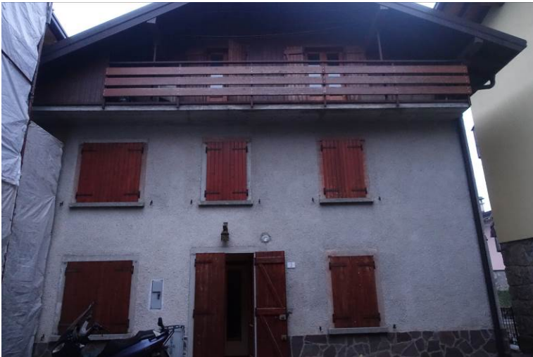
Fig. 1 – L'unità immobiliare

F. 25, PART. 4567, CL2, CATEG A3, RENDITA 356,36 euro