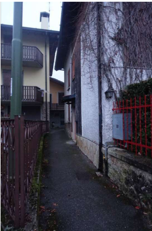
Fig. 2 – Il contesto