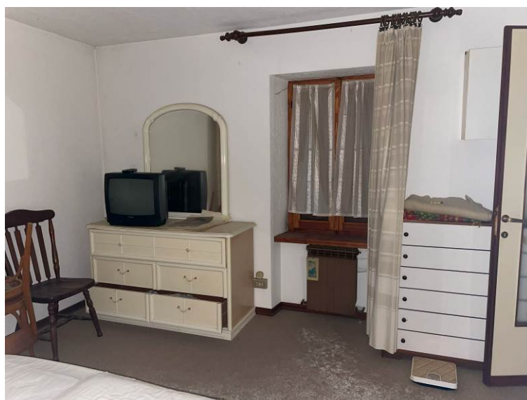
Fig. 14, 15 – Piano primo – camera –