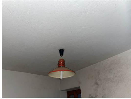
Fig. 21, 22 – Piano primo – ambiente Ripostiglio: stato di conservazione pareti, dettaglio corpi scaldanti e soffitto