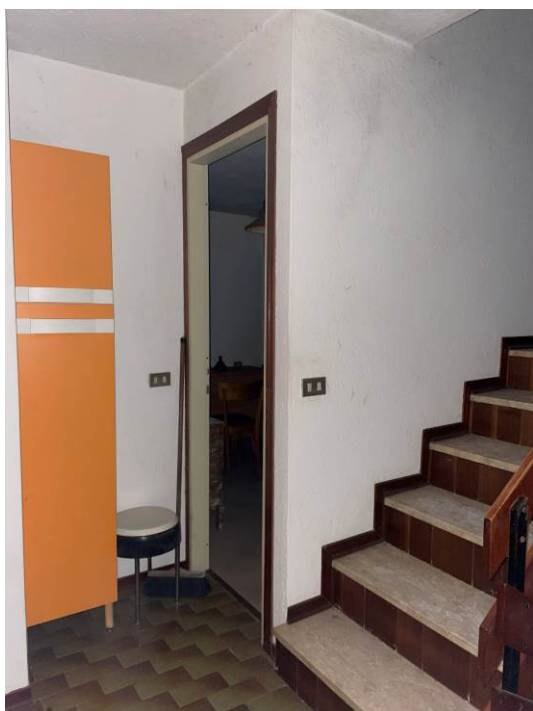
Fig. 18 – Piano primo – disimpegno