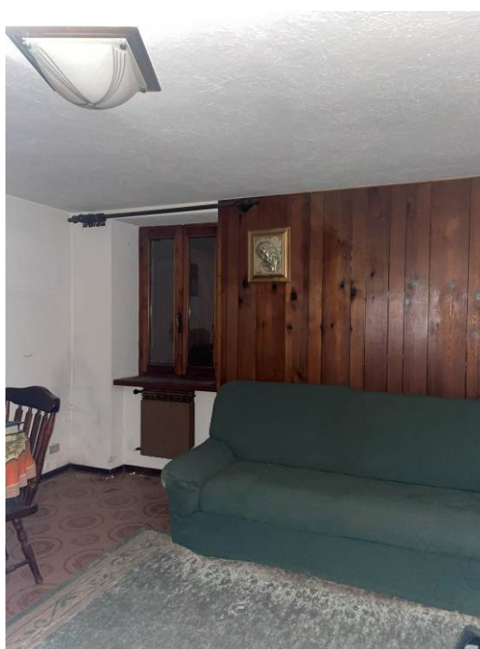
Fig. 9, 10 – Piano terra – ambiente soggiorno