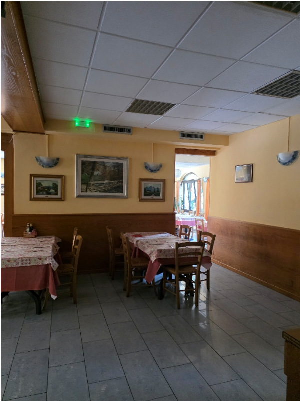
Foto 1-2-3- sala interna con zona BAR.