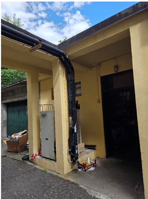
Foto 2 - Vista accesso magazzino 4385 sub.1.