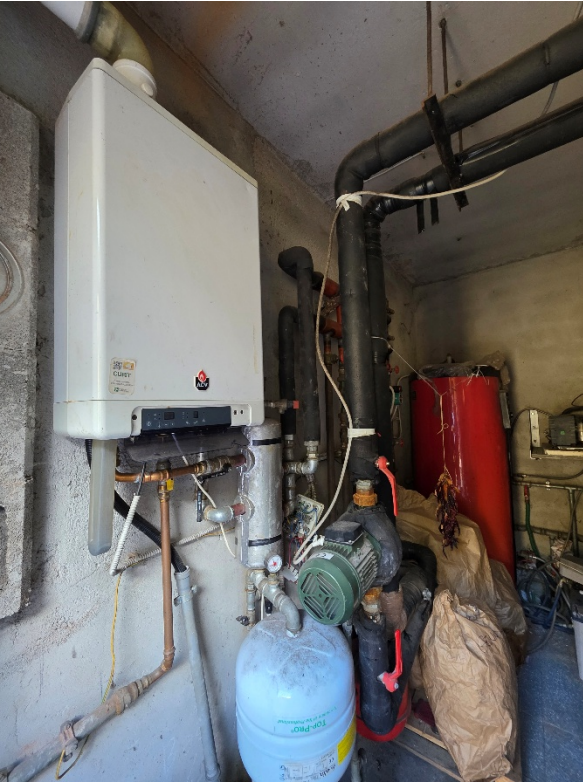
Foto 9 - Locale tecnico impianto termico con caldaia a gas in condensazioni.