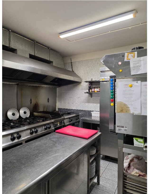
Foto 4 – camino forno/pizza prospiciente la sala interna. Foto 5 - cucina.