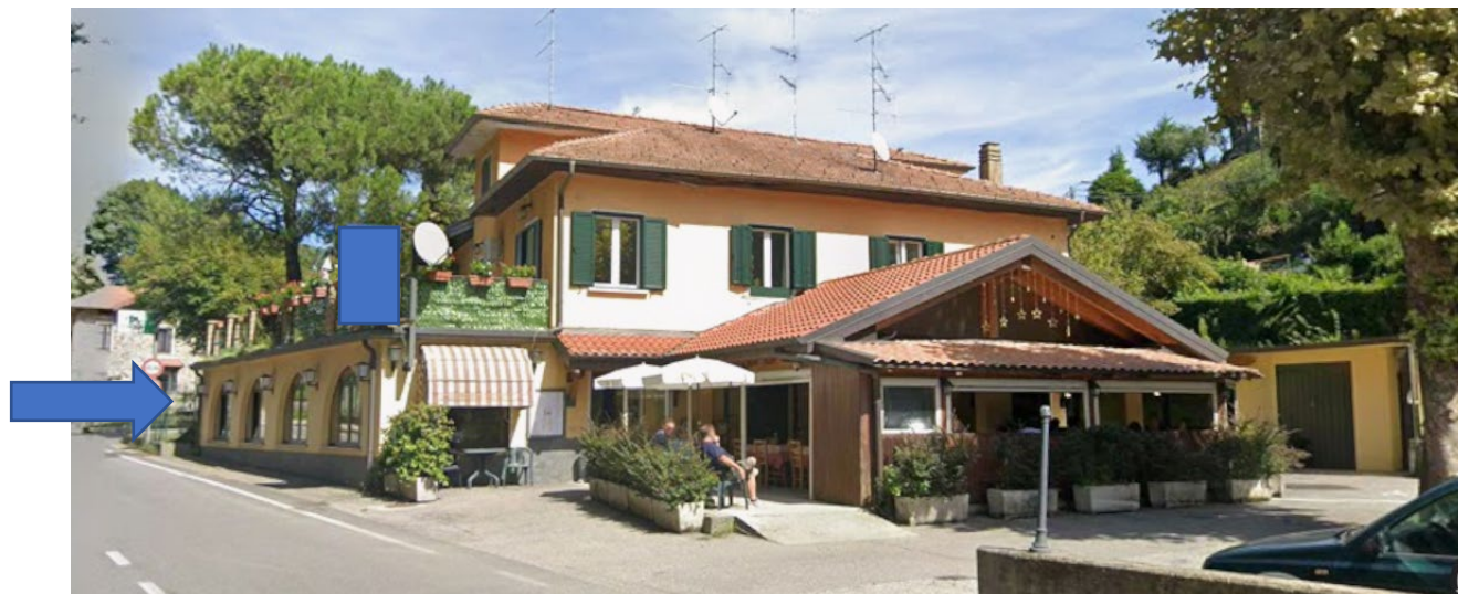
Foto 1- vista esterna – Via Guglielmo Marconi – unità commerciale a piano terra.

RILIEVO FOTOGRAFICO ESTERNO – CORPO A – commerciale p.lla 4384 sub.501 – p.lla 4545- C/1