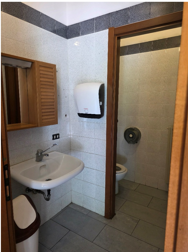
Foto 6 - Bagno ospiti.