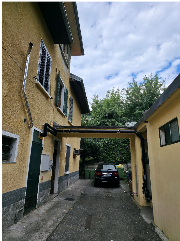
Foto 4 – Vista prospetto retro su area parte comune – magazzino p.11 4385 sub.1.