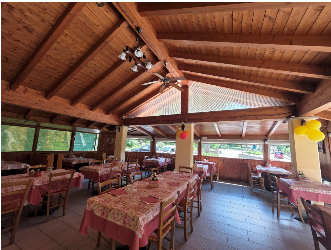
Foto 8 – zona porticata – (non vi è titolo edilizio per la chiusura sui tre lati del portico).