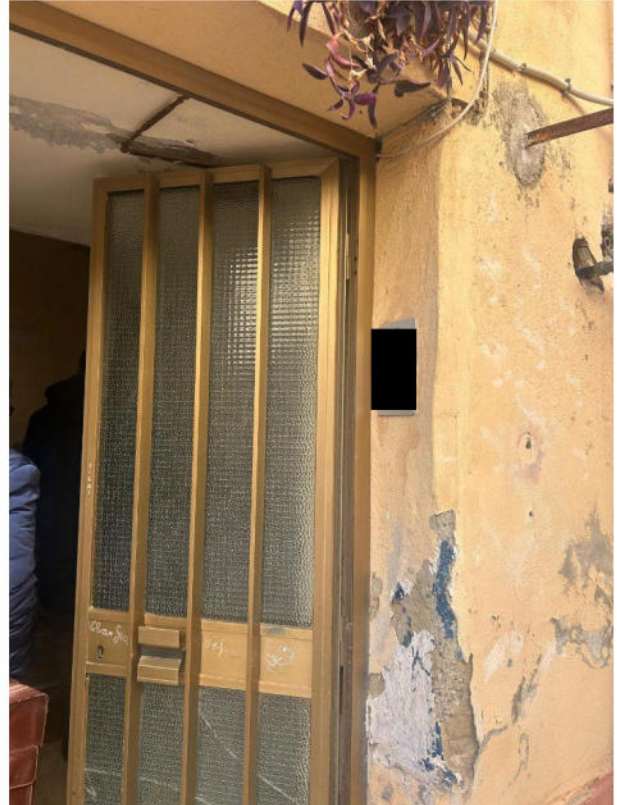
Figura 2 - Ingresso scala