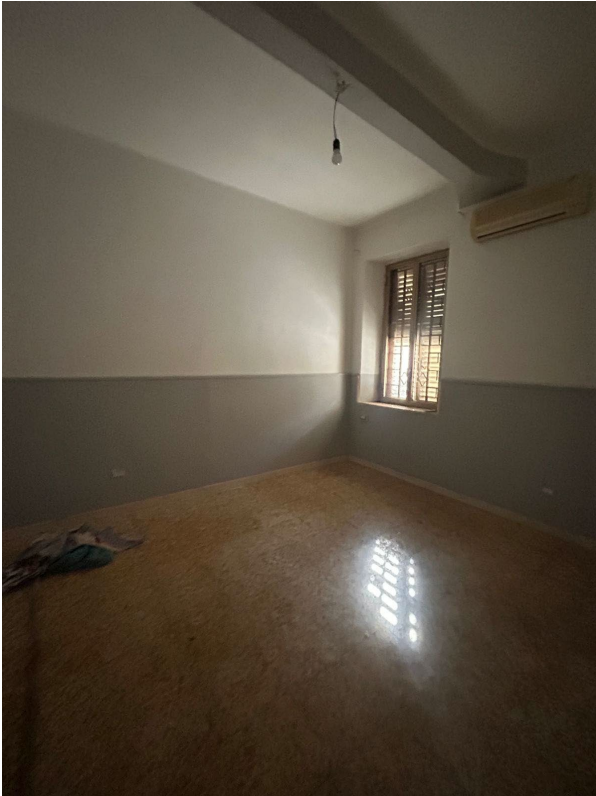
Figura 5 - Camera n.1