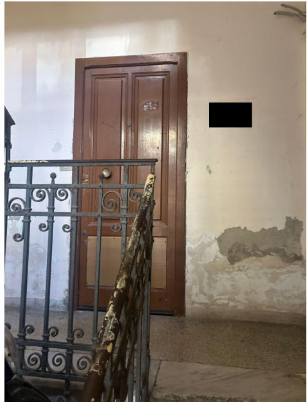
Figura 4 - Porta di accesso appartamento