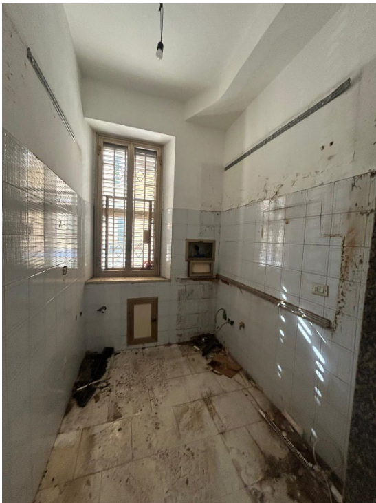
Figura 7 - Cucina