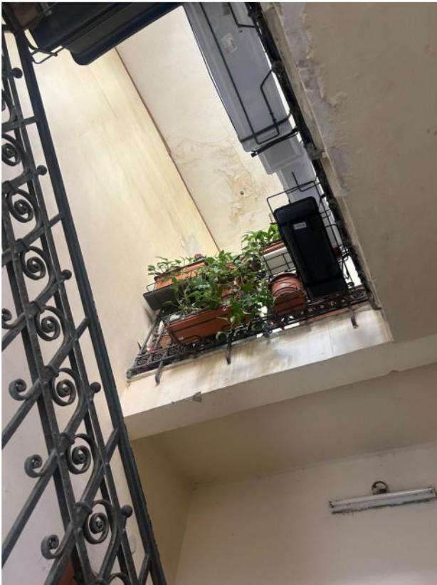
Figura 3 - Vano scala