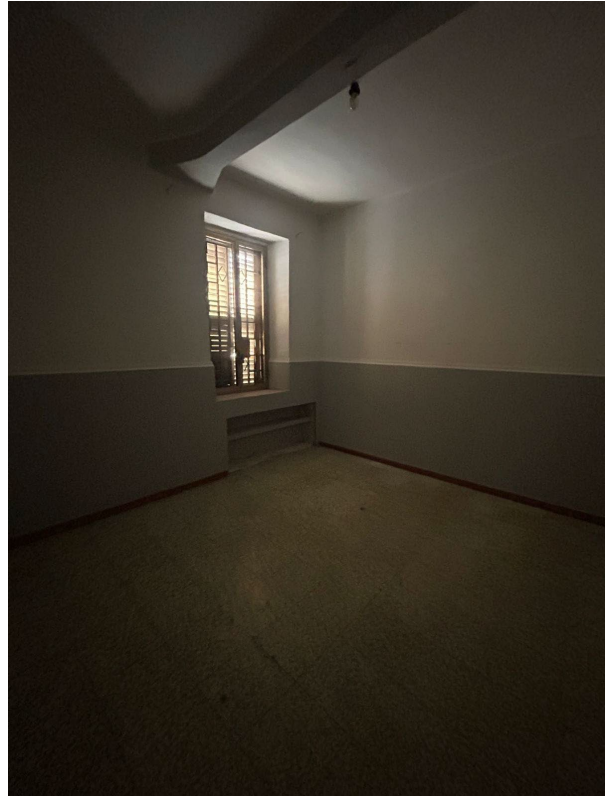
Figura 6 - Camera n.2