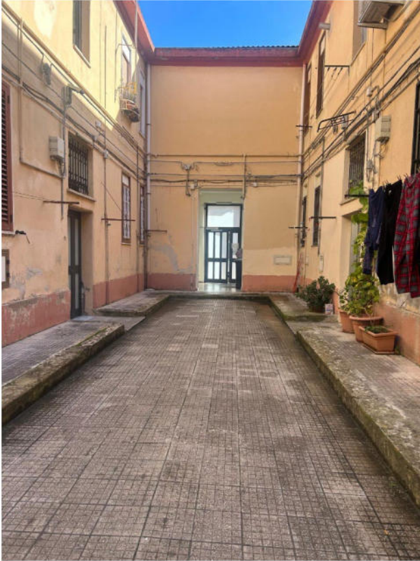
Figura 1 - Cortile condominiale