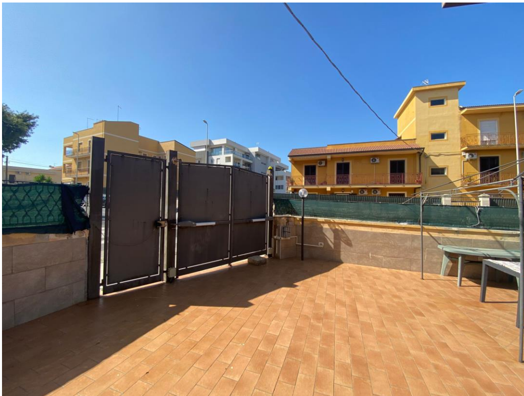
Vista stabile lato sud