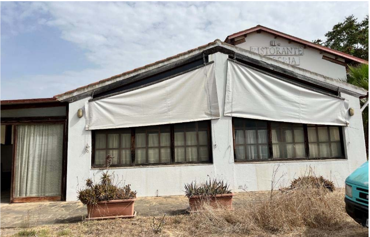
Prospetto lato ovest