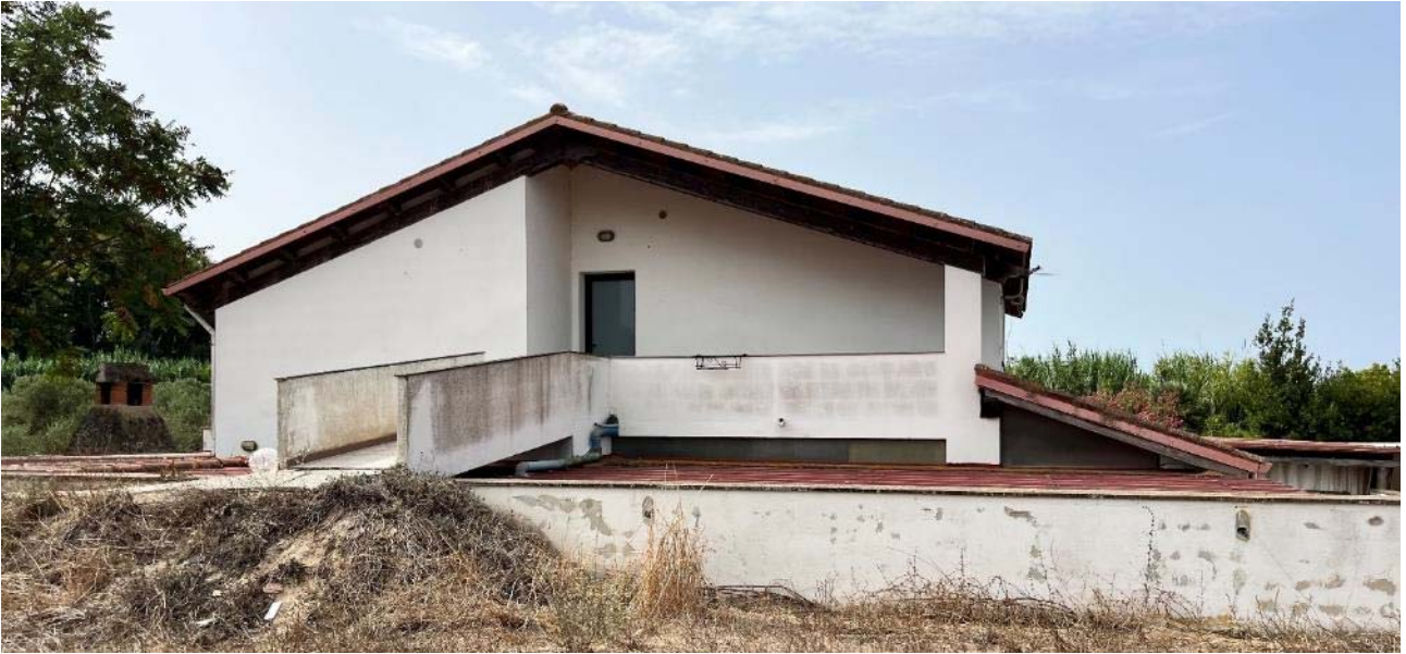
Prospetto nord-est e rampa accesso dal terrapieno

(porzione di fabbricato al piano primo, con destinazione alloggio custode)