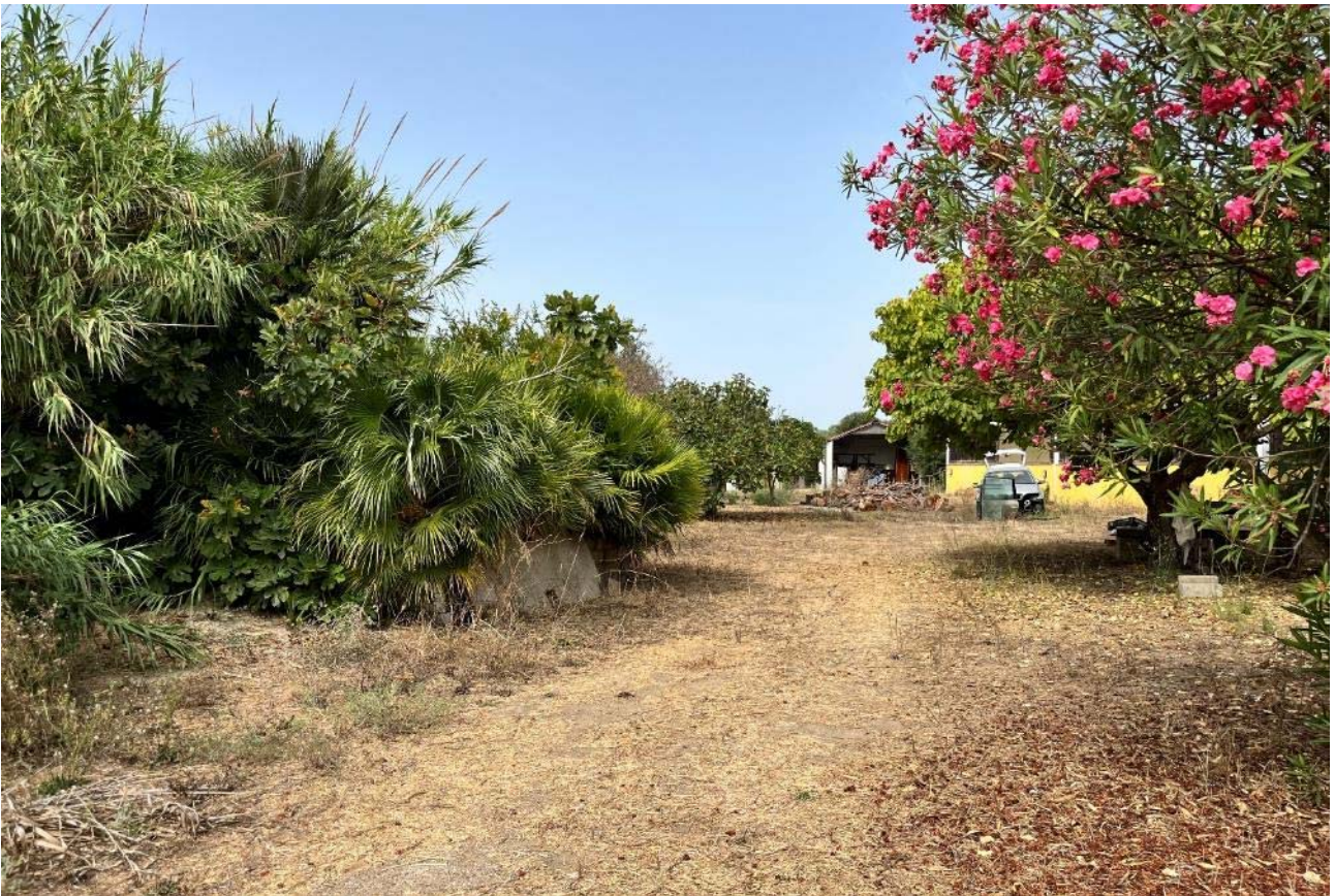
Area a verde