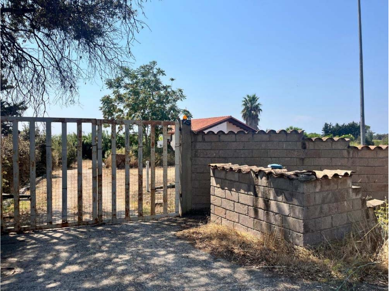
Ingresso al complesso dalla S.P. n. 4