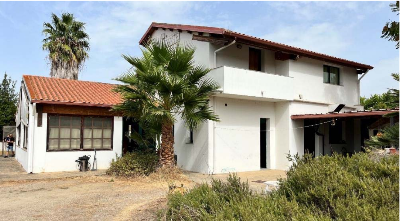
Prospetto lato sud-est

(porzione di fabbricato al piano terra, con destinazione affittacamere con annessa somministrazione pasti)