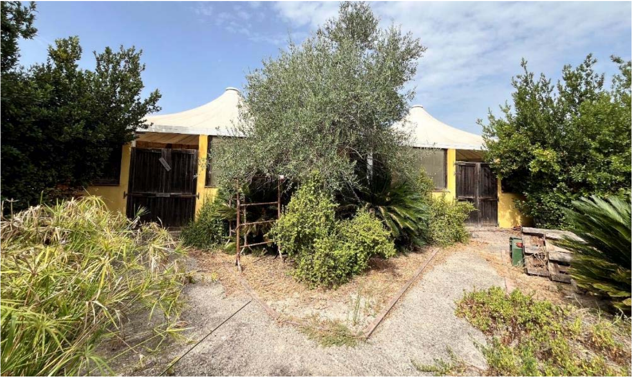
Prospetto est tensostruttura