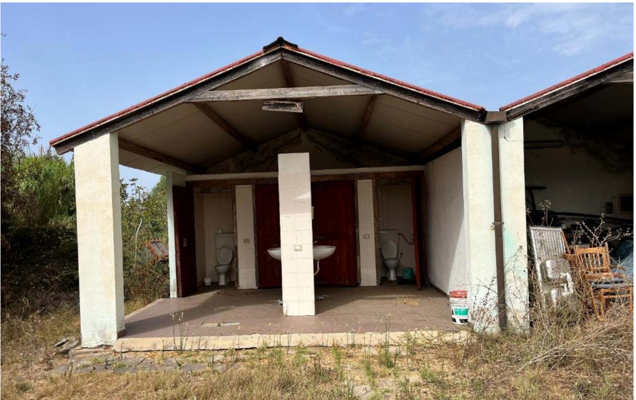
Vista locale bagni