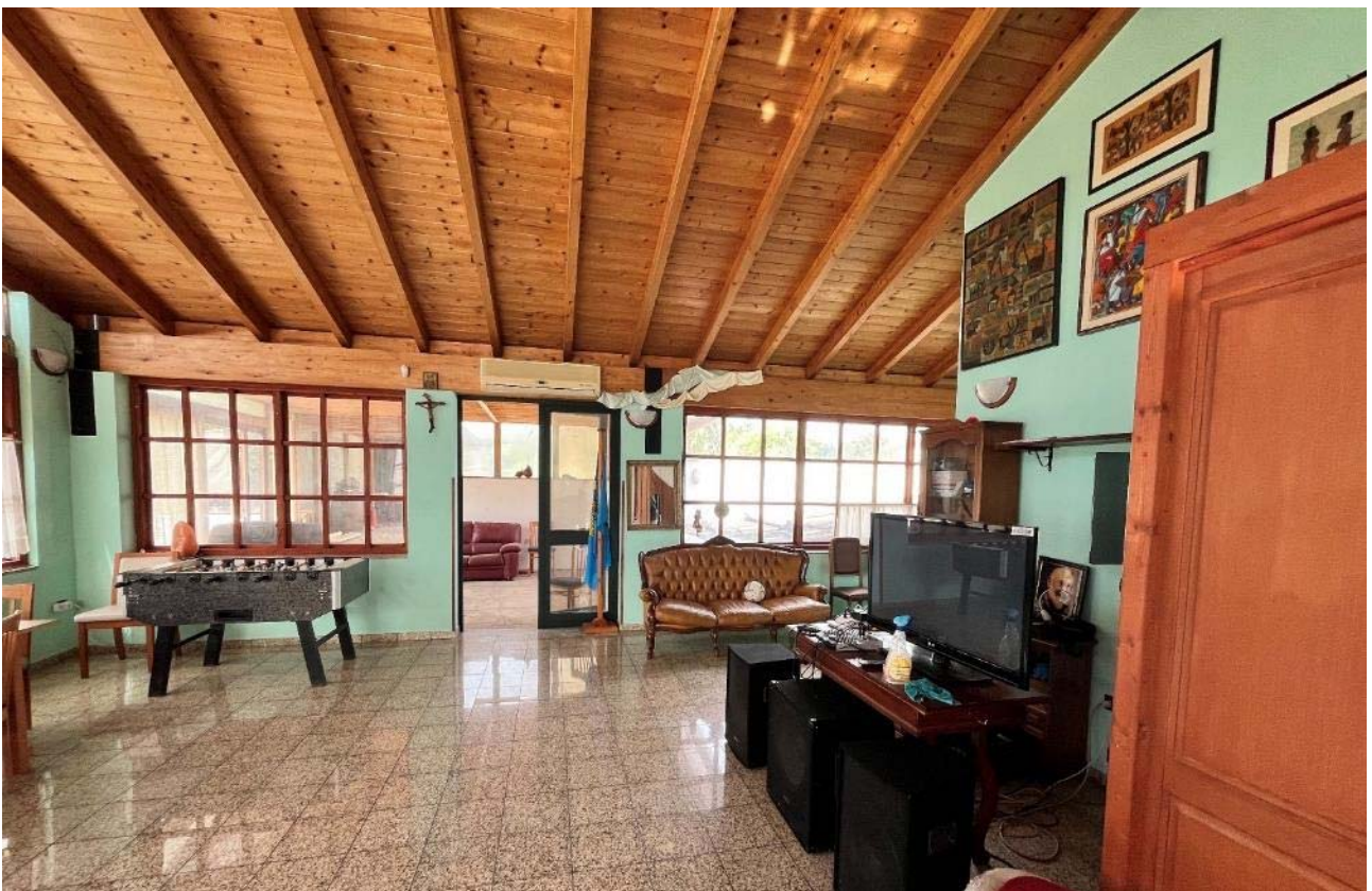
Veranda lato sud