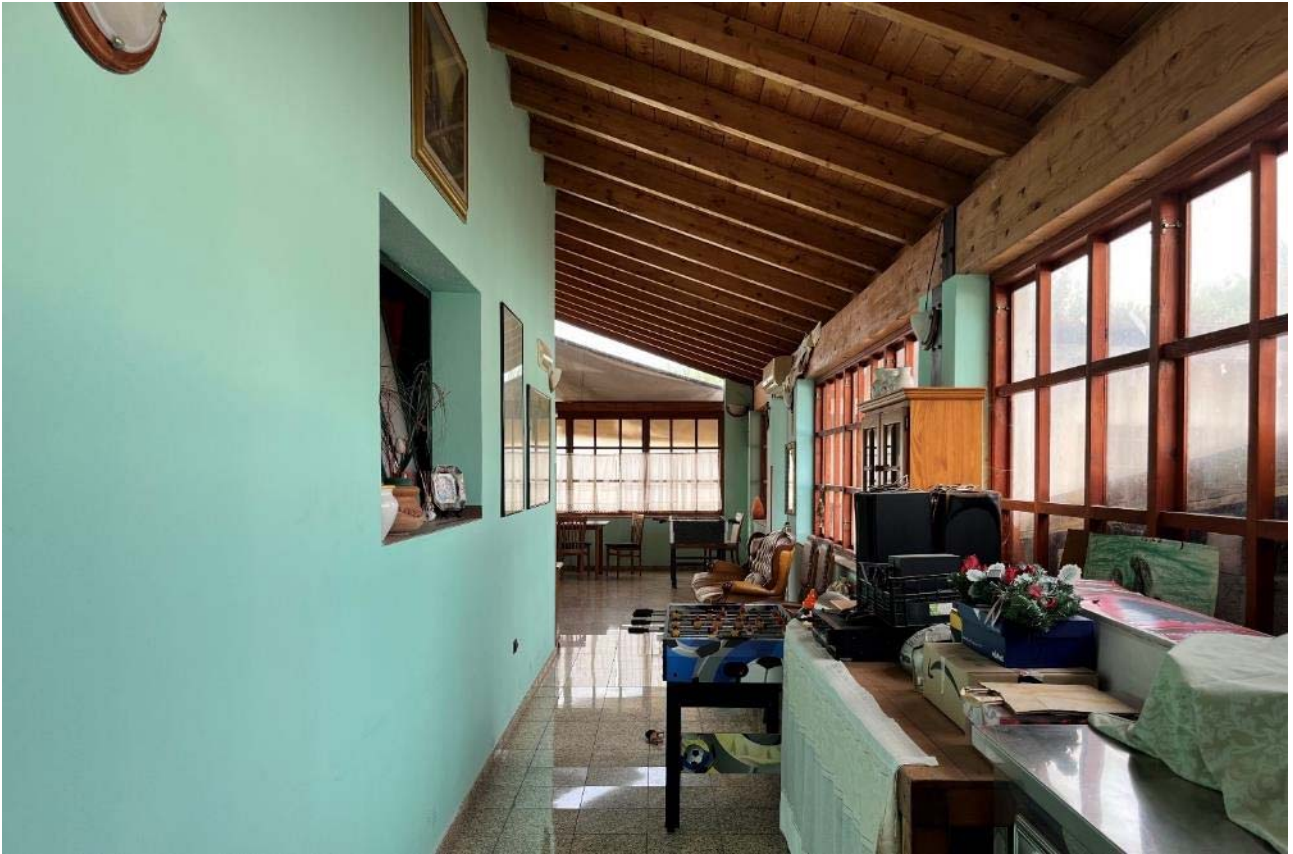
Veranda lato nord-ovest