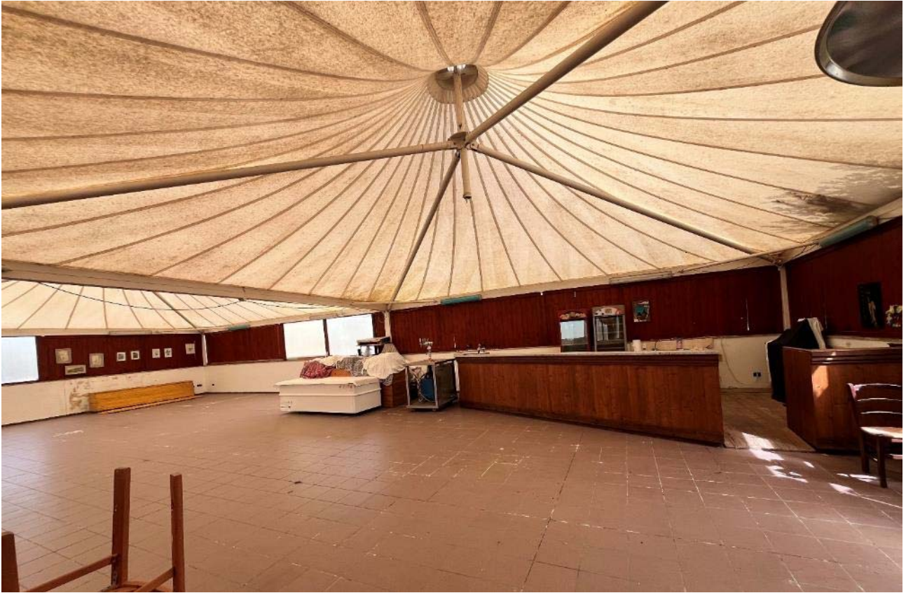
Vista interna con piano bar