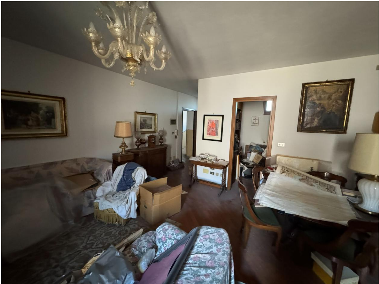
Soggiorno – foto 1