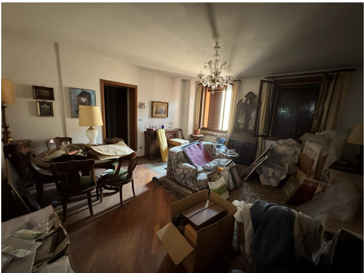
Soggiorno – foto 2