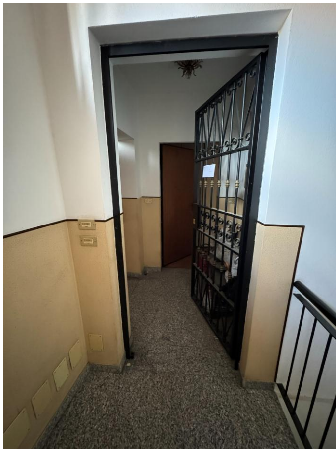
Disimpegno esterno comune con l'appartamento sub 34