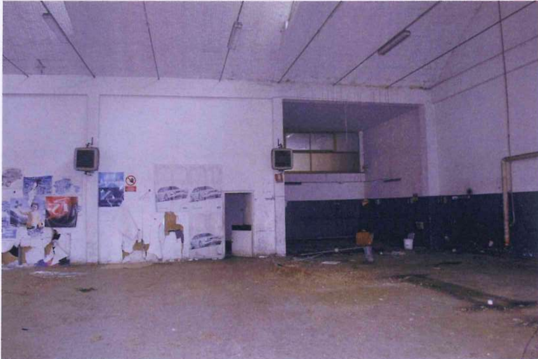
13. Altra veduta dell'officina 1.