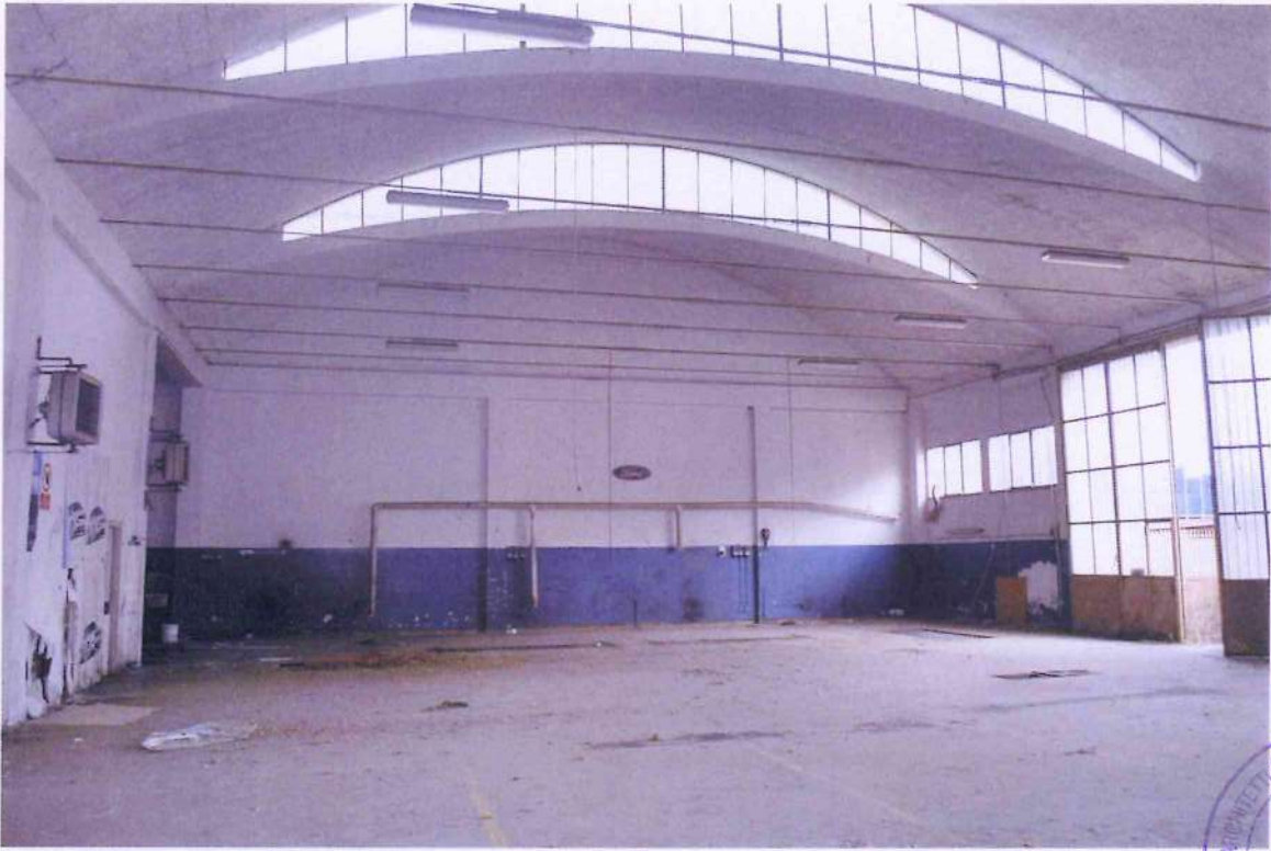
17. Altra veduta dell'officina 1. Controcampo.