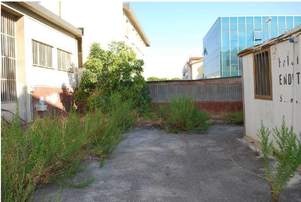
2. Piazzale principale