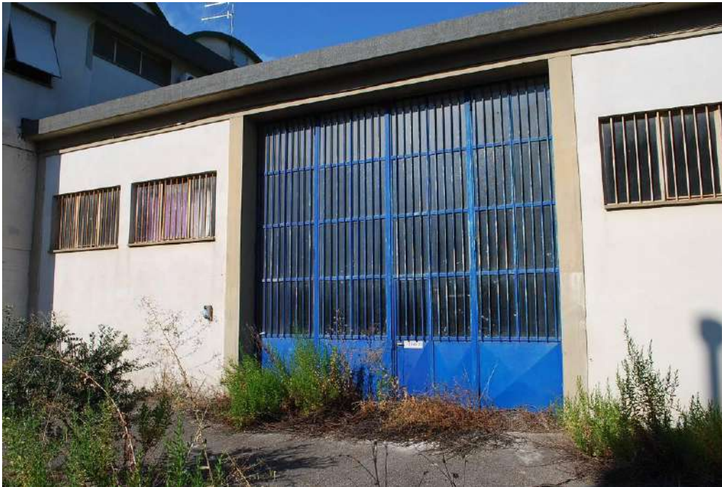
3. Portellone di accesso al capannone