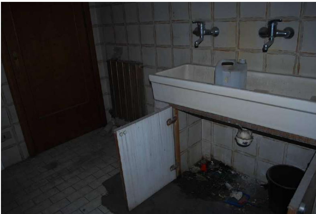
6. Interni piano terra