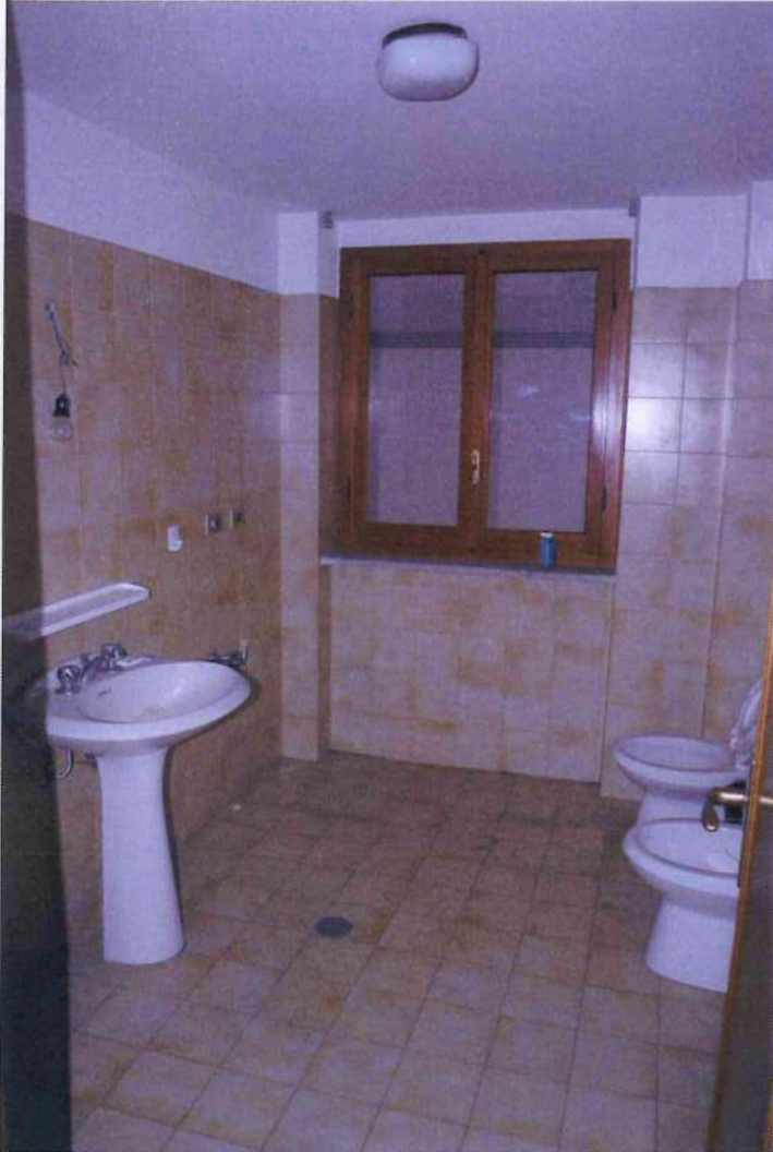
33. Veduta bagno.