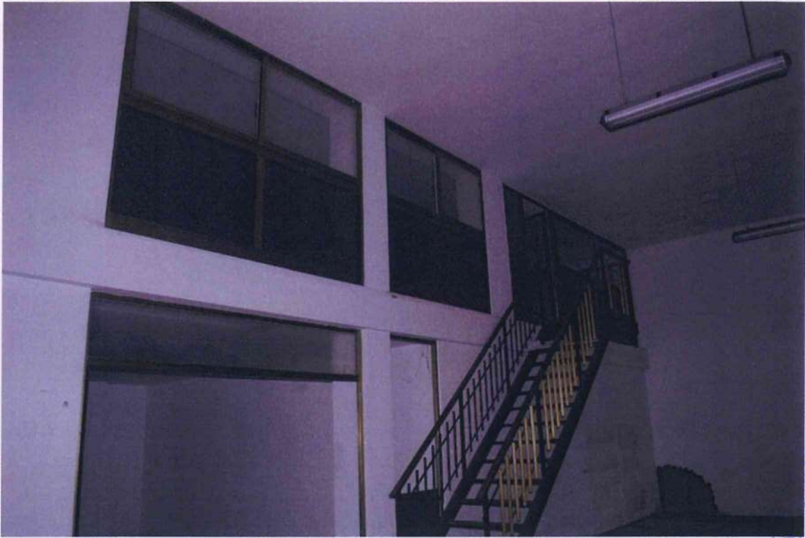
27. Scala interna di collegamento con il piano ammezzato.