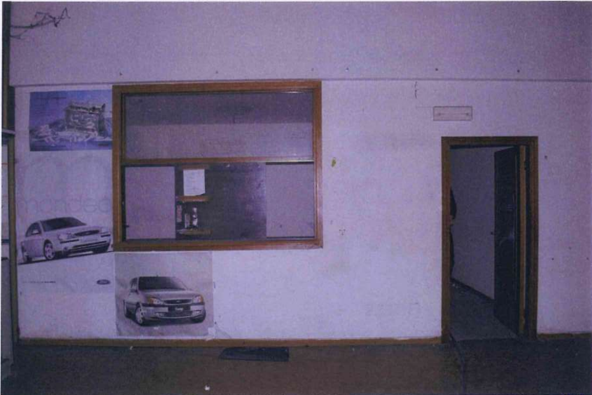
25. Deposito ricambi 1. Veduta verso il box accettazione.