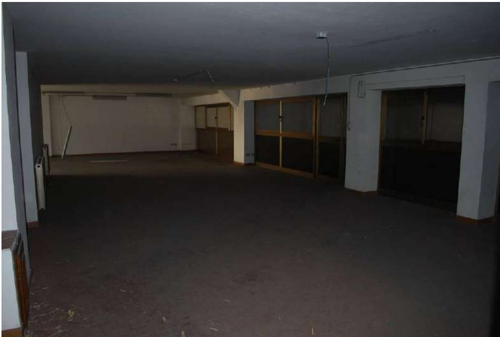
12. Interni piano primo