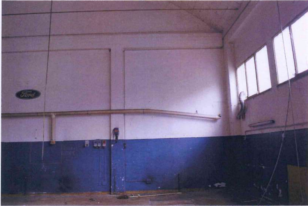
15. Altra veduta dell'officina 1.