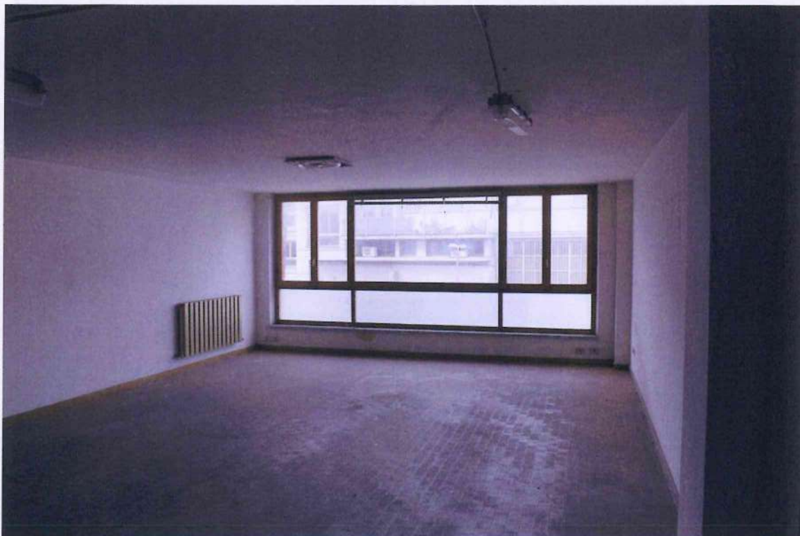
35. Veduta ufficio 2.