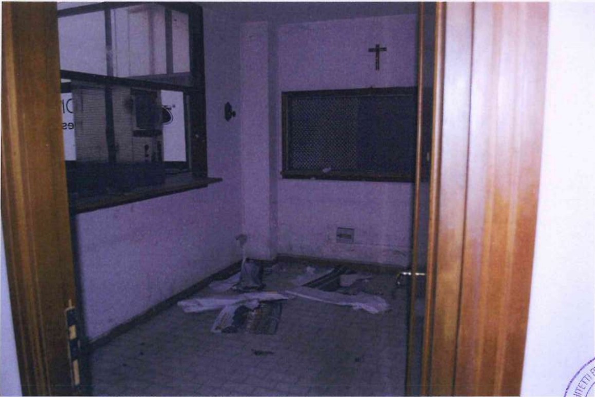
23. Box accettazione.