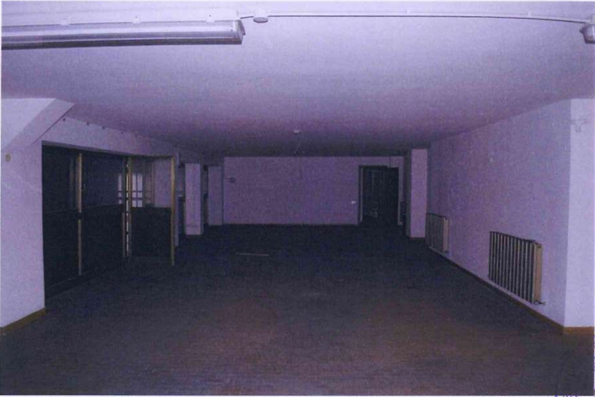
37. Altra veduta ufficio 2.