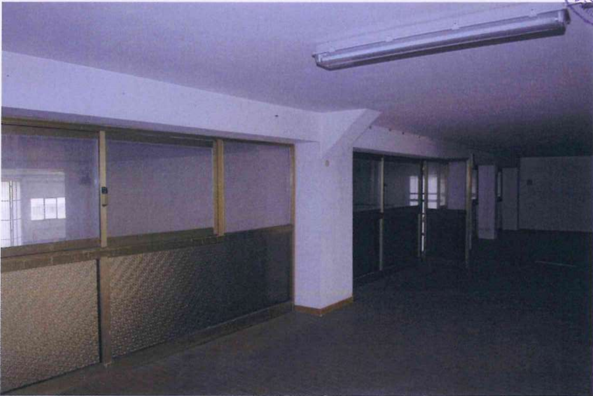
38. Altra veduta ufficio 2.