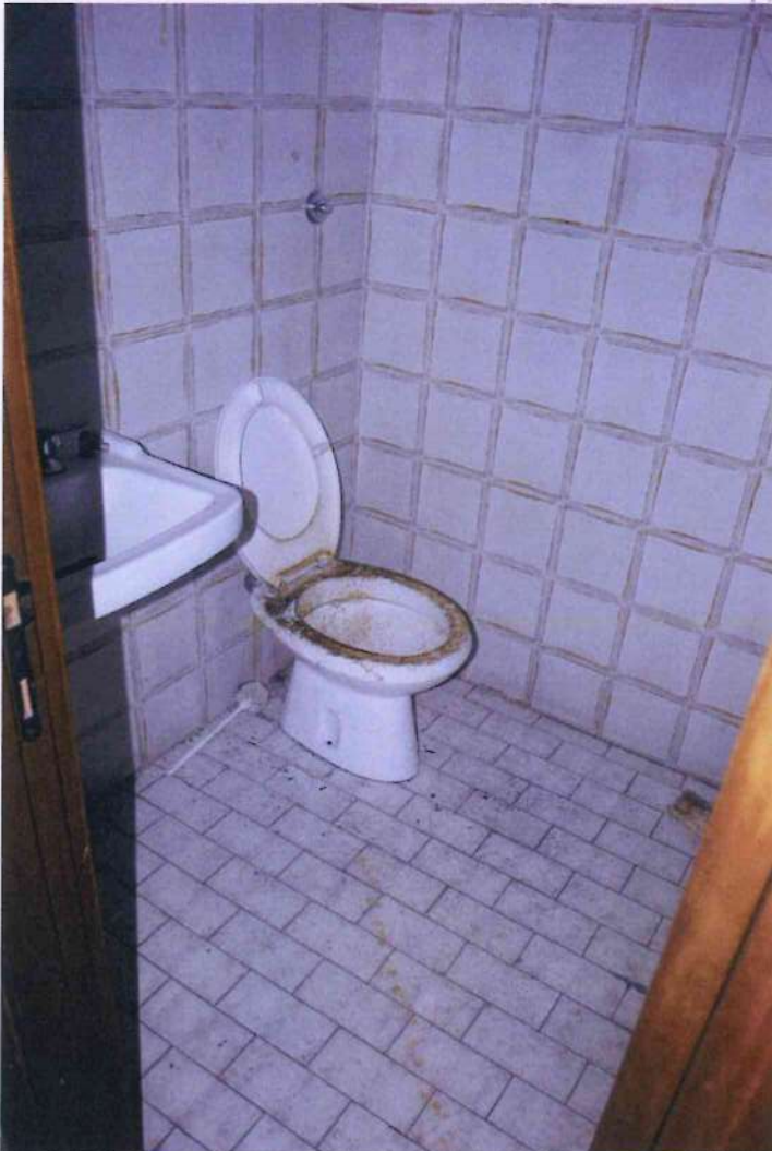
22. Servizi igienici.