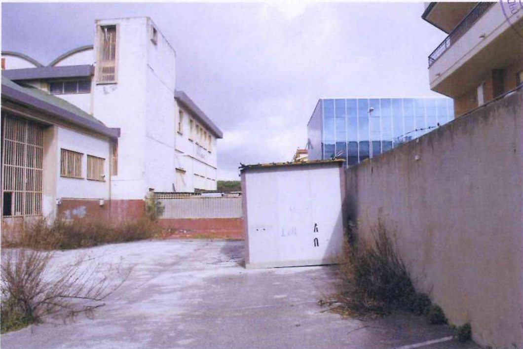
8. Altra veduta del piazzale interno