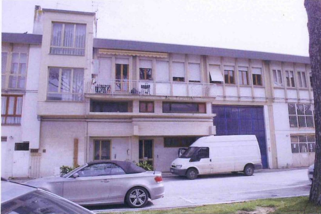
3. Veduta della porzione di fabbricato oggetto di perizia