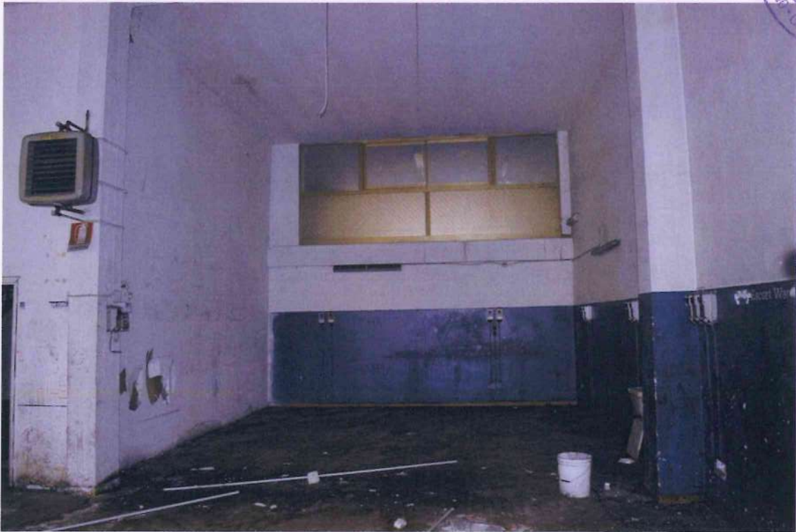
18. Veduta dell'officina 2