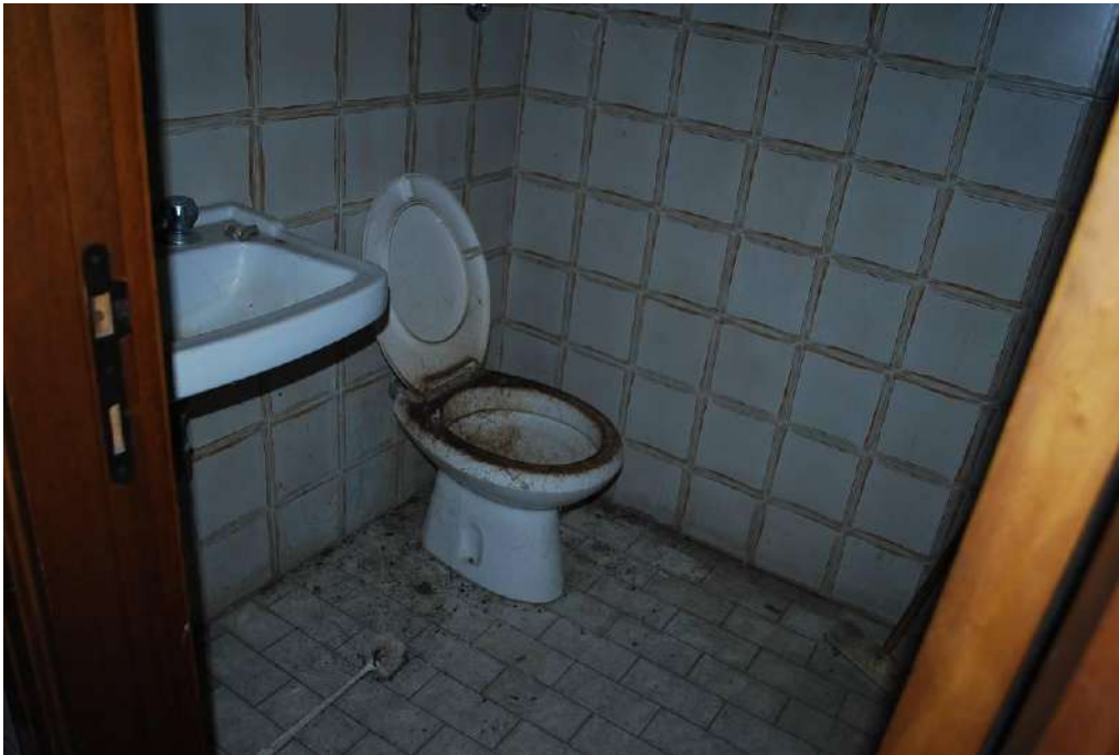
7. Interni piano terra