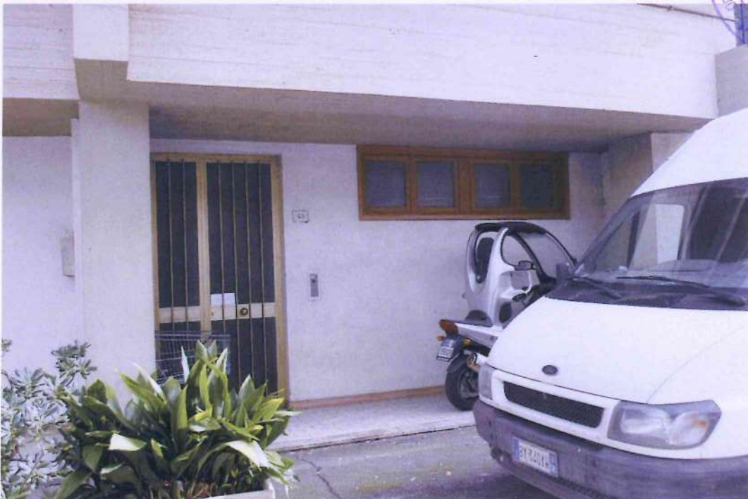
4. Porta pedonale di accesso di Via Monte Cengio n. 48