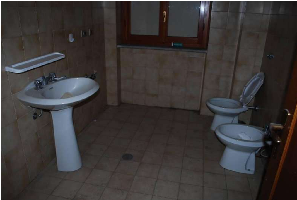
11. Interni piano primo