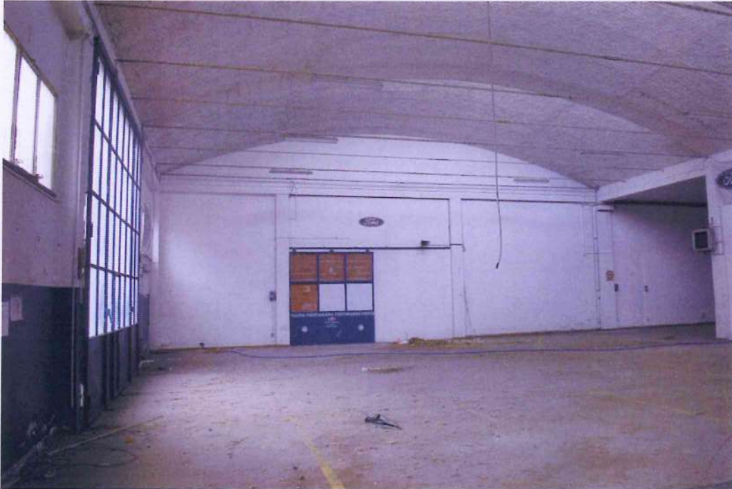
11. Veduta dell'officina 1.