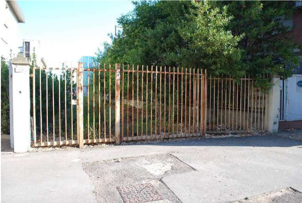
1. Veduta dall'accesso su Via Monterosa