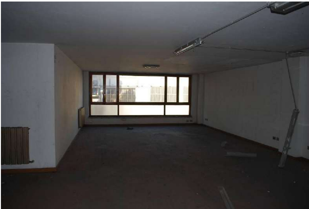
10. Interni piano primo