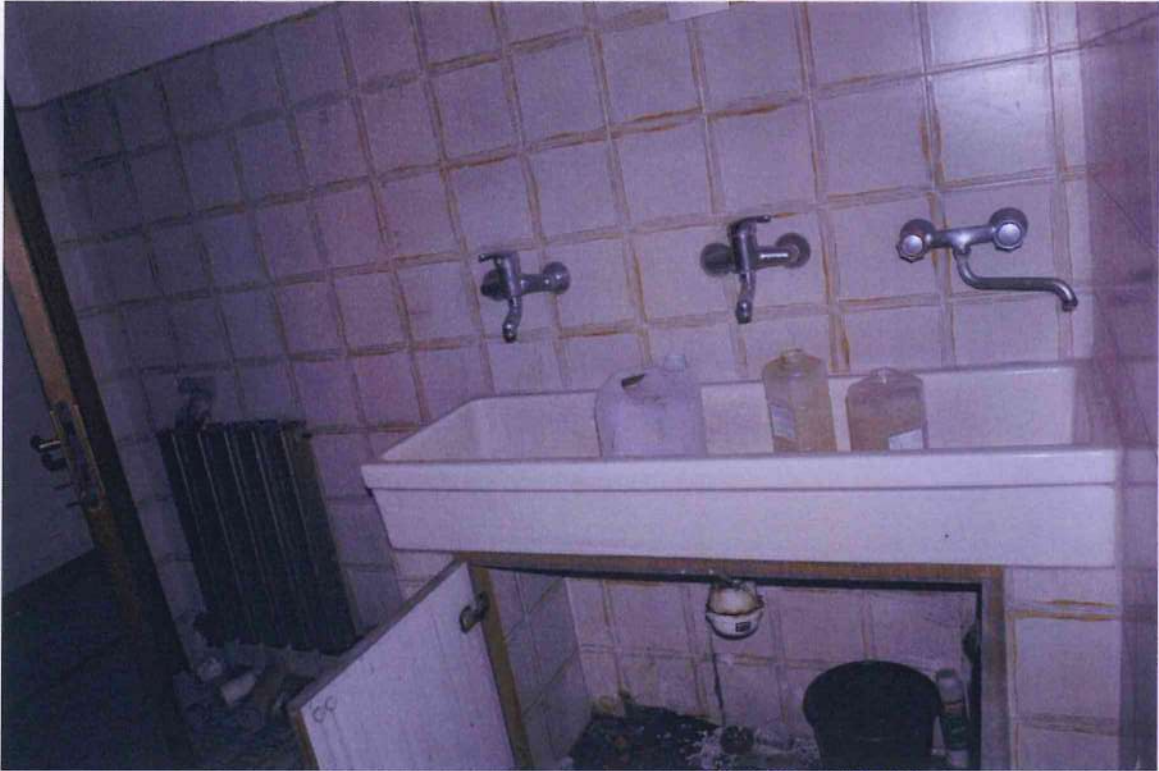
21. Servizi igienici.