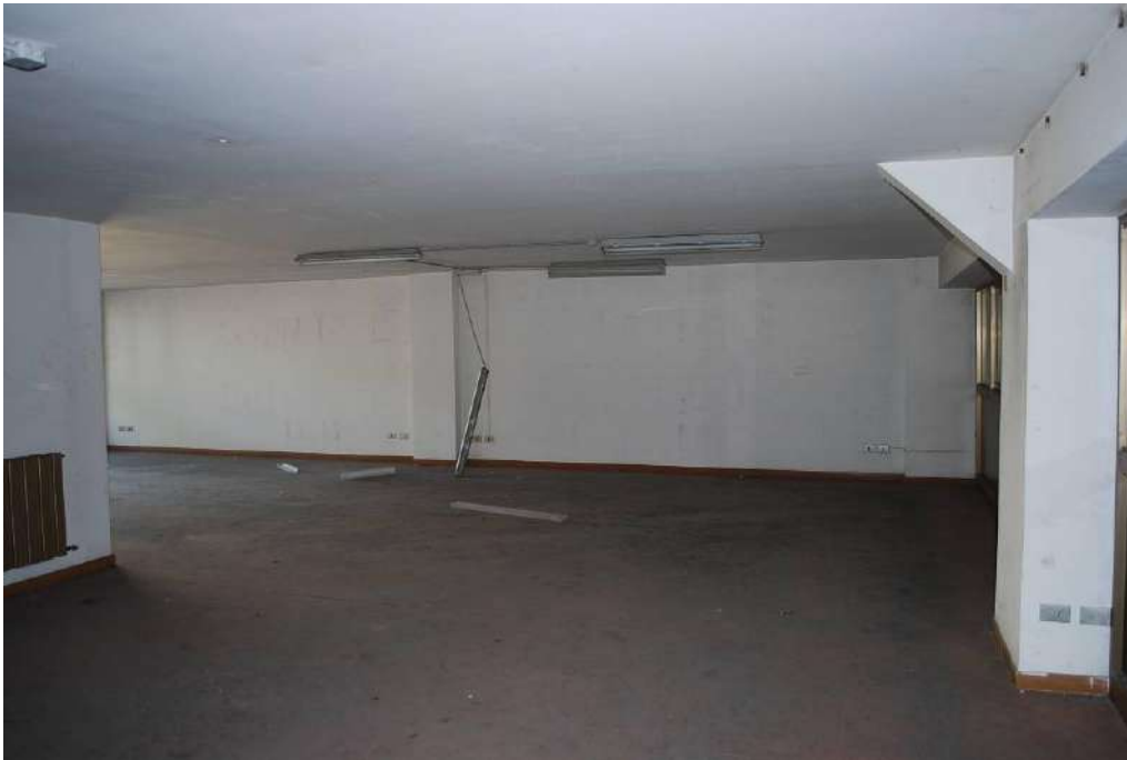
9. Interni piano primo