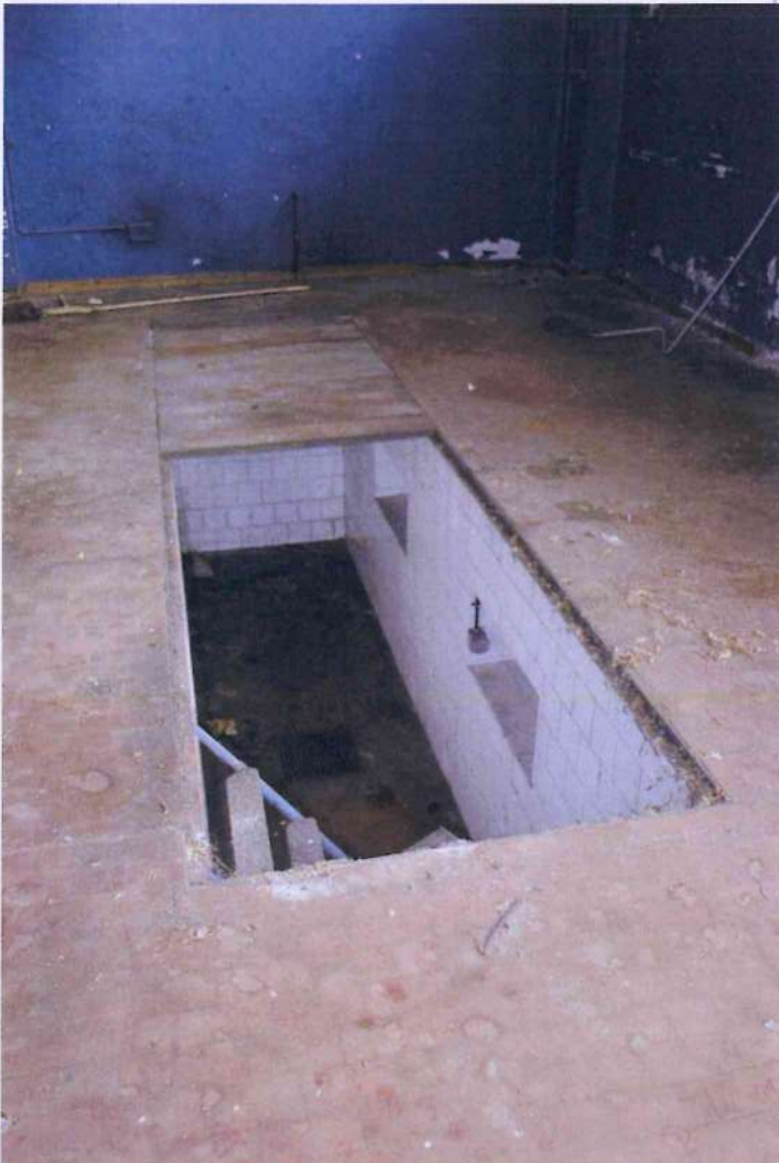
16. Altra veduta dell'officina 1. Dettaglio del pozzetto.