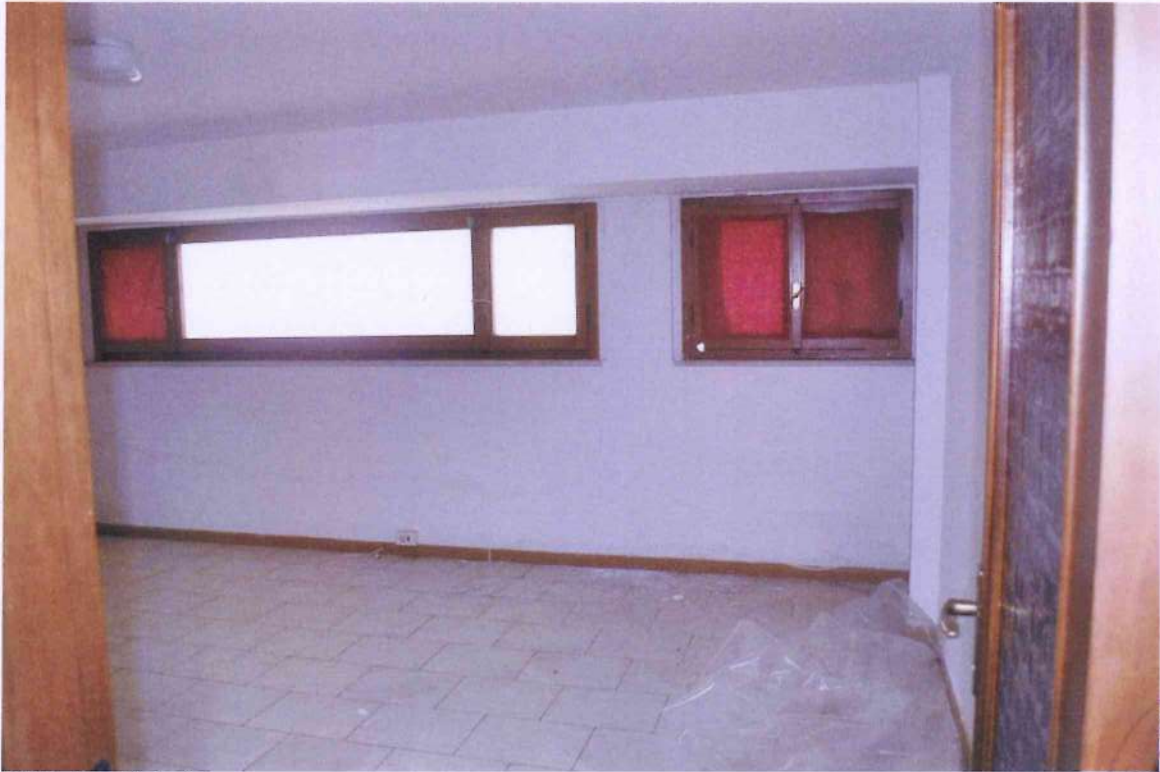
31. Veduta ufficio 4.