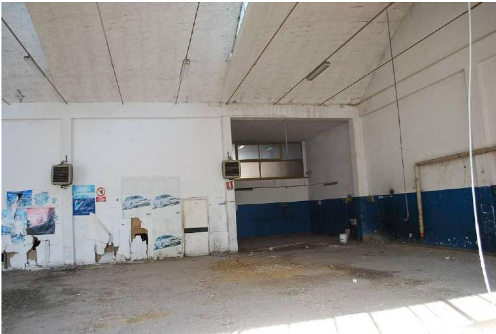
4. Interni piano terra