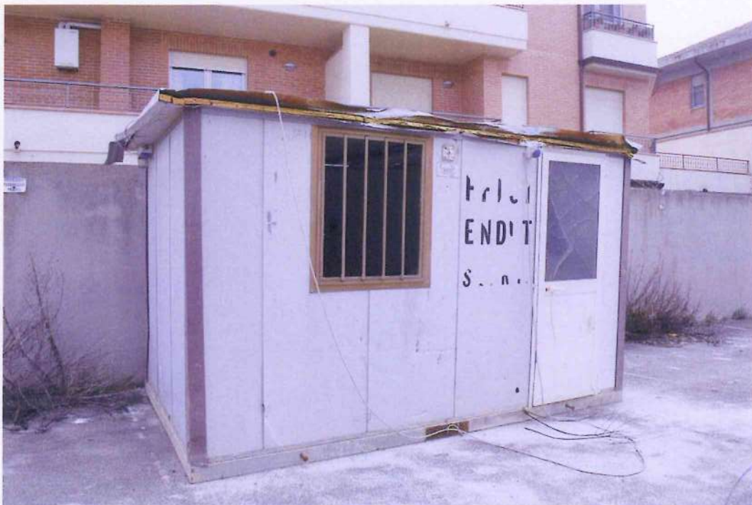
9. Altra veduta del piazzale interno. Dettaglio della baracca di cantiere.