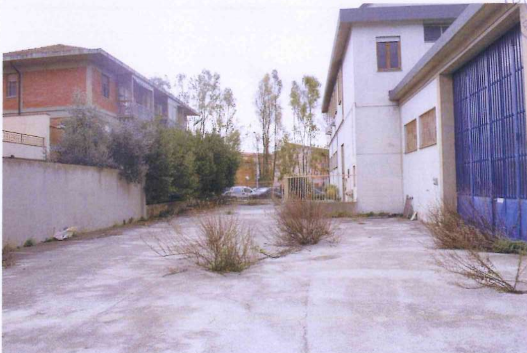
10. Altra veduta del piazzale interno. Controcampo verso Via Monterosa.