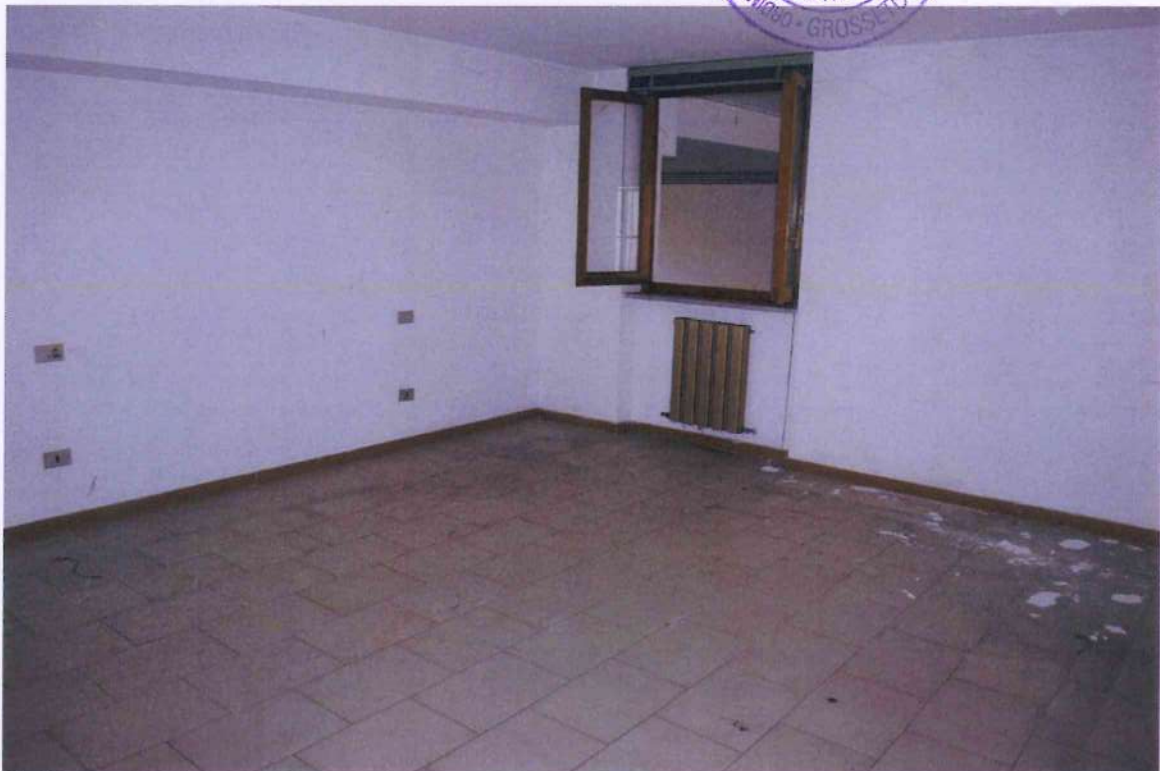
34. Veduta ufficio 1.