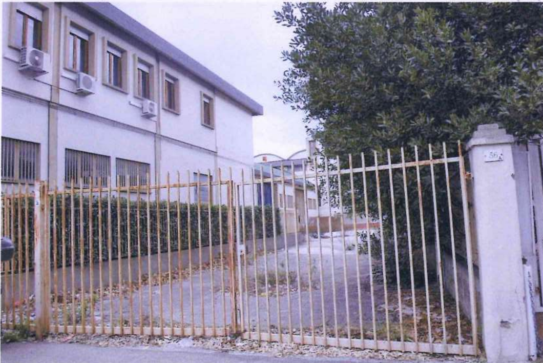
6. Cancelli di ingresso di Via Monterosa n. 56a