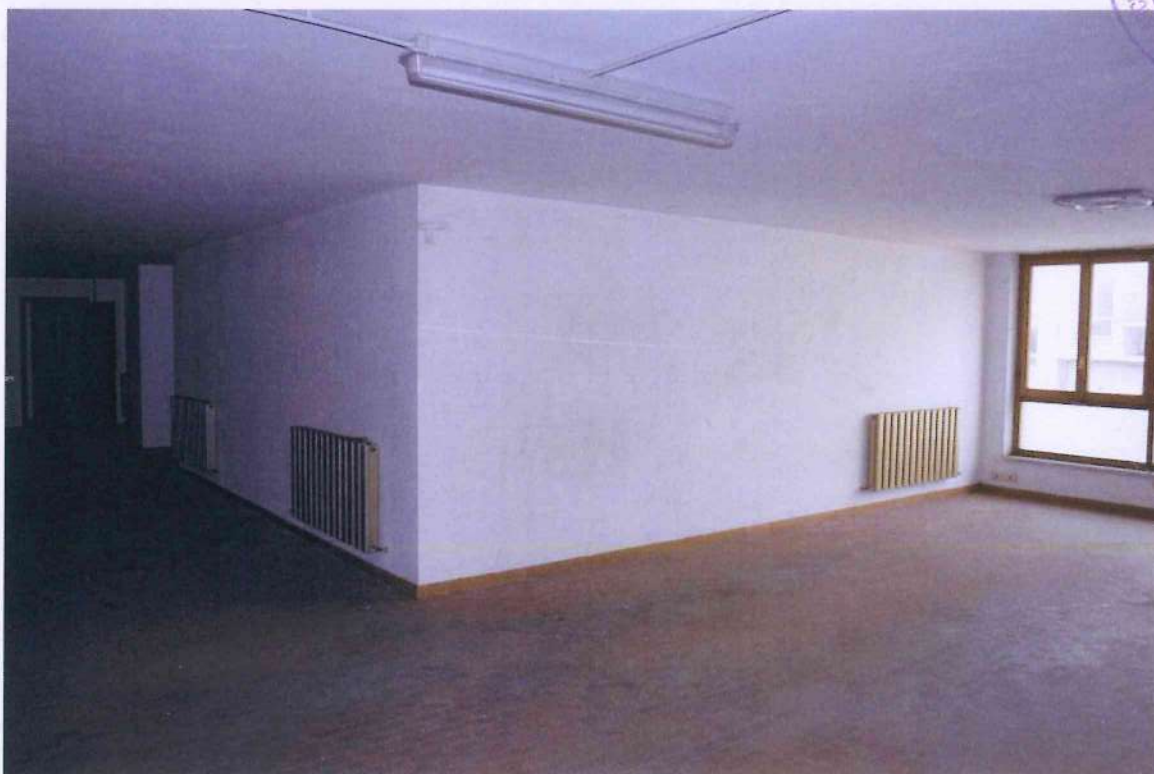
36. Altra veduta ufficio 2.