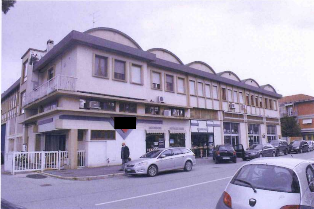
1. Veduta del fabbricato da Via Monterosa