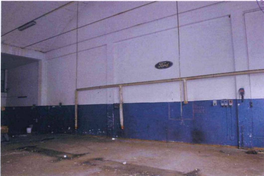
14. Altra veduta dell'officina 1.