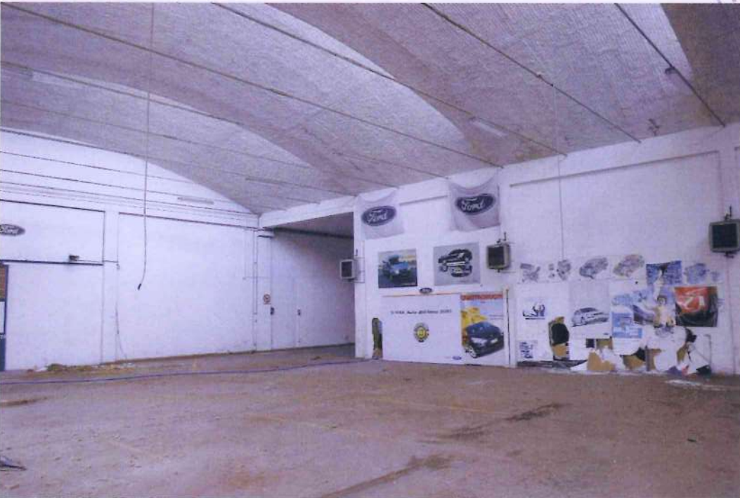
12. Altra veduta dell'officina 1.