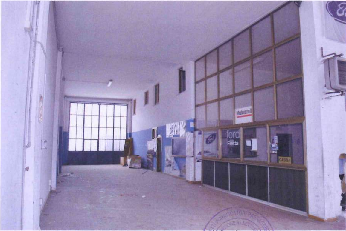
19. Corsia di accesso automezzi.