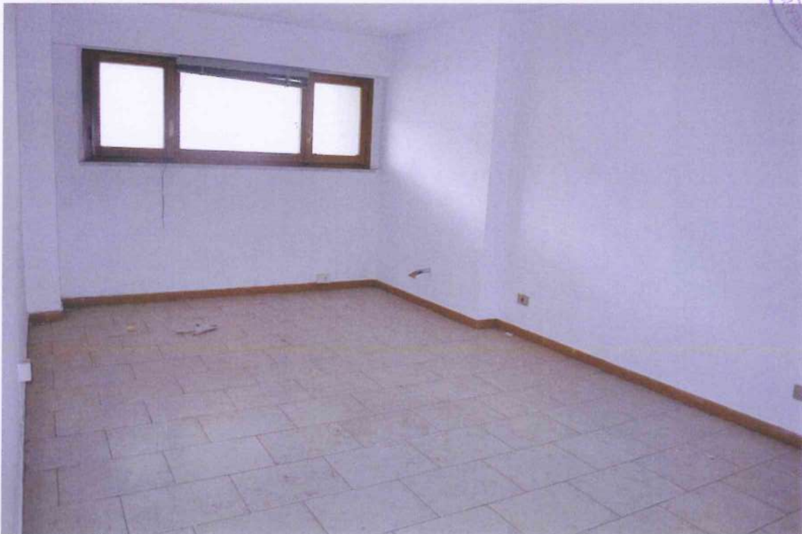
32. Veduta ufficio 3.