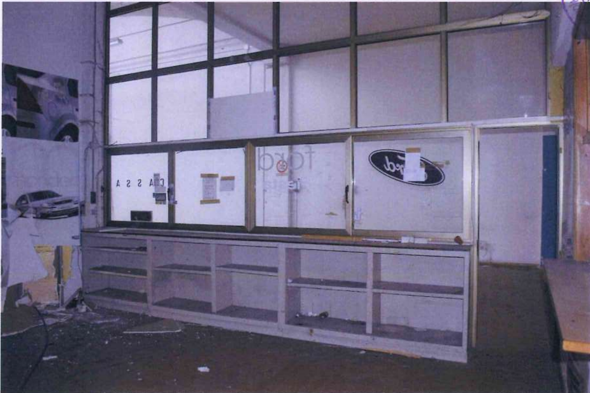
24. Deposito ricambi 1.