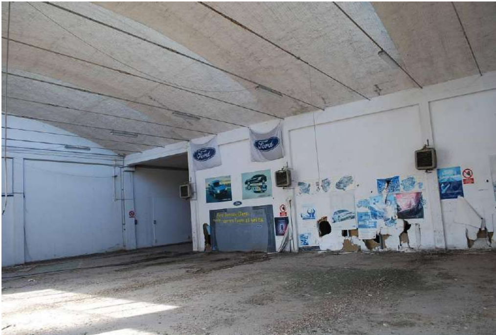
5. Interni piano terra