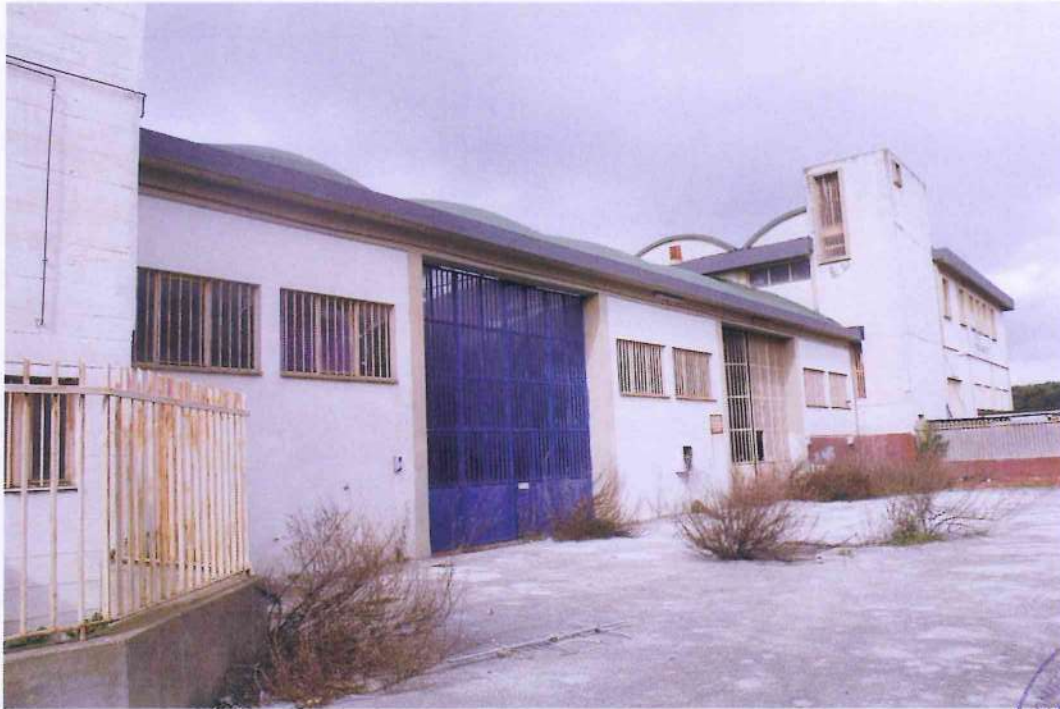
7. Veduta del piazzale interno