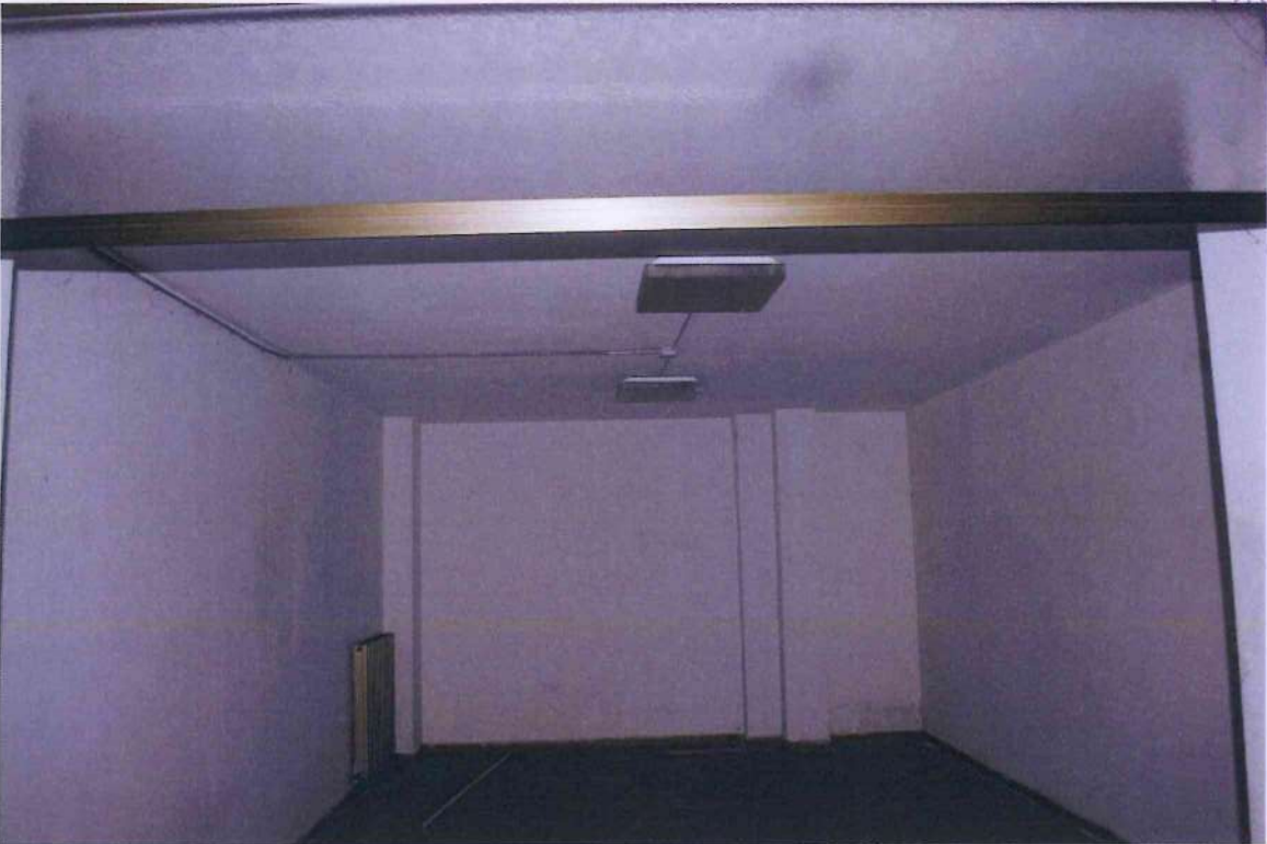
26. Deposito ricambi 2.