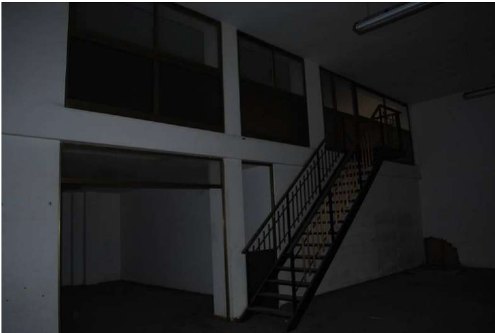
8. Interni piano terra