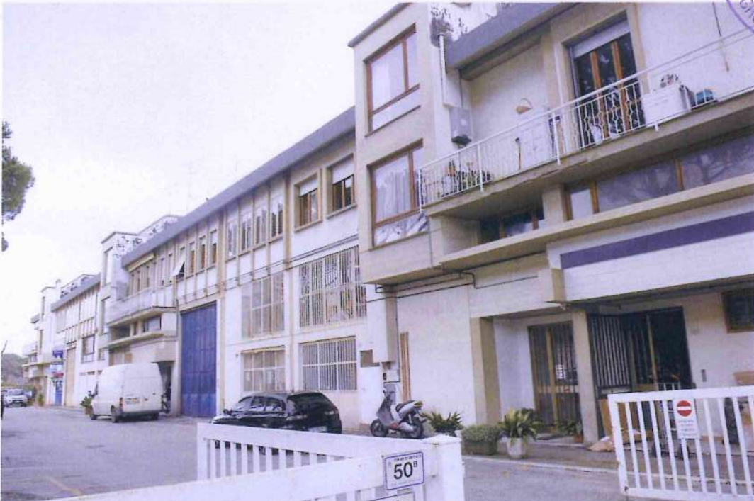
2. Veduta del fabbricato da Via Monte Cengio