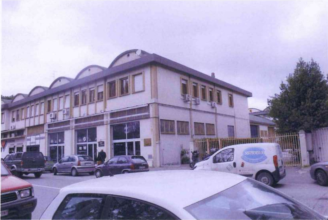
5. Altra veduta del fabbricato da Via Monterosa