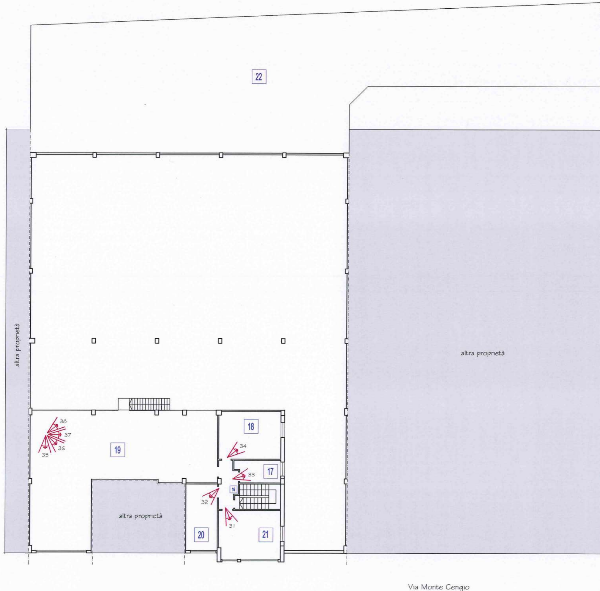
PIANTA PIANO AMMEZZATO

Via Monterosa n. 56a Via Monte Cengio n. 48/48a Grosseto Piano ammezzato - scala 1:200 LOTTO 1